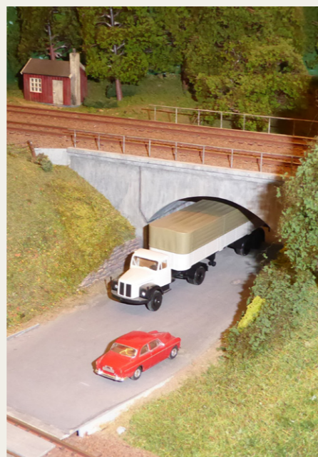
Det er dejligt at se de mange små detaljer, der er blevet plads til i det flotte anlæg. Her er det en Scania og en Volvo et sted syd for Svenstrup.