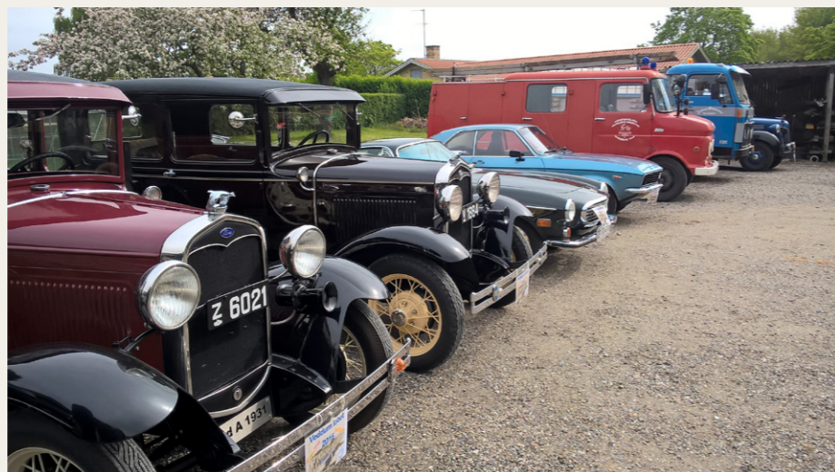
Veteranbiler på rad og rækker er klar til start på årets udgave af Veddumløbet.

På anden etape fortsatte vi ad små veje til Hadsund. Over broen til en naturskøn rute ved Hadsund Syd, tilbage over broen til Fiskerihavnen. Her var 2. post. Efter rast og konkurrence her var turens tredje etape ad små veje langs Mariager Fjord