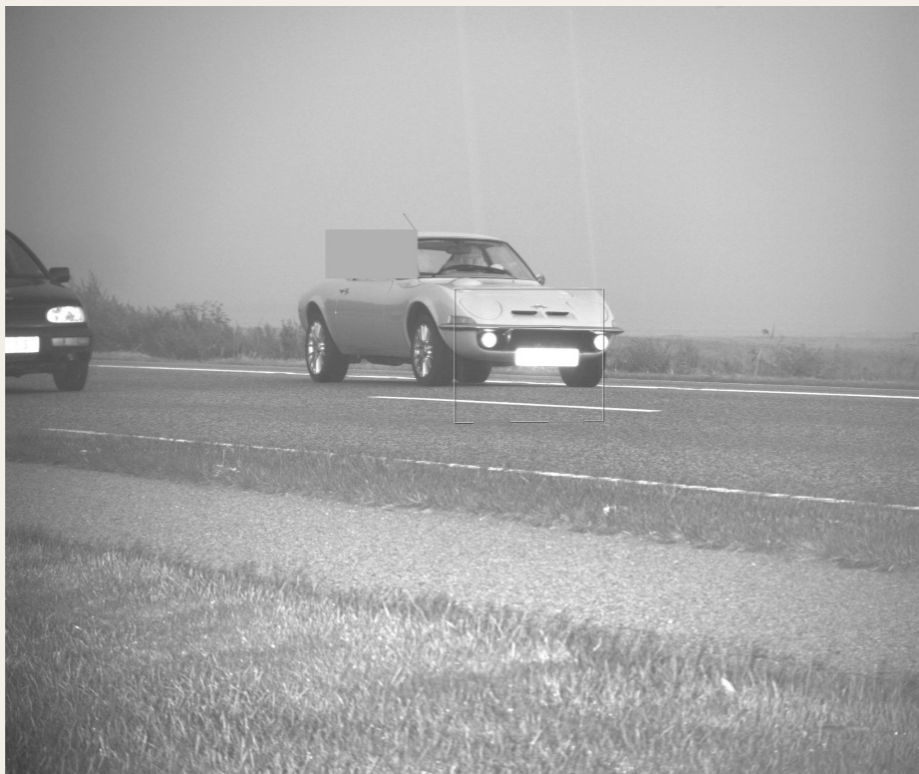
Et billede til 1000 kroner, og så er det ikke engang i farver, og kvaliteten er i øvrigt meget dårlig.

Det er så lige her, de (ordensmagten) har valgt at afprøve en af de hersens helt nye pengemaskiner, der skal flå GT'ere og andre, for deres surt optjente skatte kroner, der med et nærmest usynligt treben i vejkanthen udsender sin dødbringende laserstråle, for at afsløre den kriminelle handling.