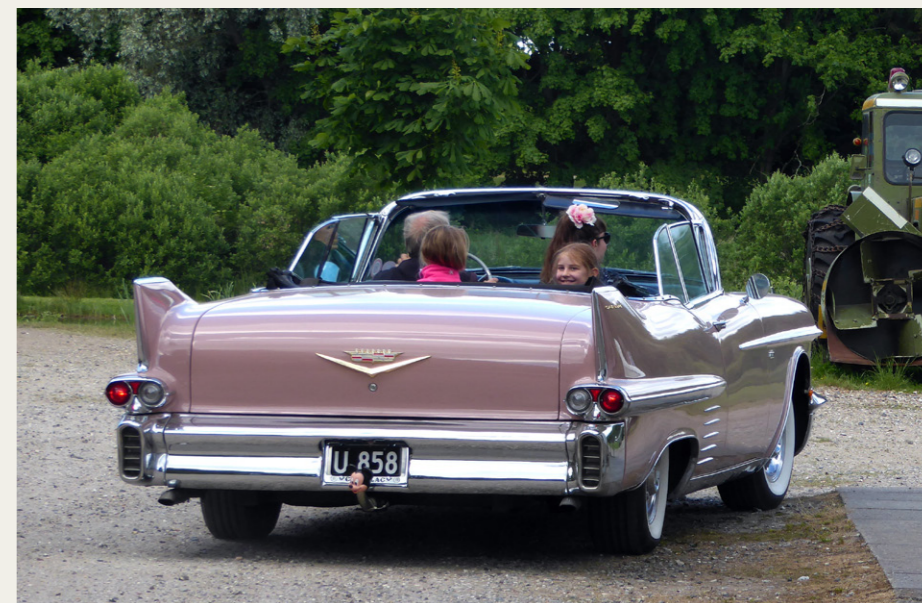
Et par heldige piger havde fået plads bag i den flotte Cadillac, som her lægger an til landing ved Hjallerup Mekaniske Museum