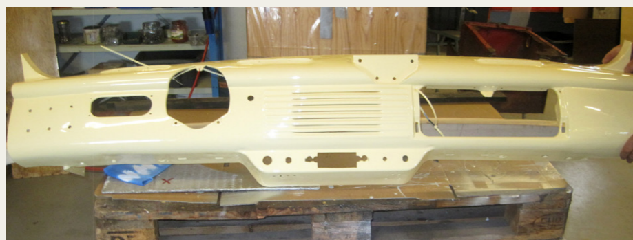
Instrumentpanelet er garanteret blevet flottere, end dengang det var nyt.