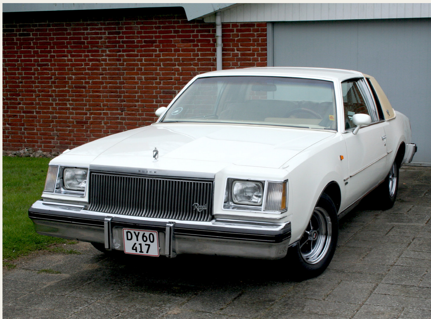
Den fine „nye“ Buick efter hjemkomsten til Svenstrup.

Næste „bil-kigge-tur“ var den 16. marts, hvor vi forud havde lavet telefoniske aftaler, henholdsvis i Odense og i Varde. I Odense drejede det sig om en Buick og i Varde drejede det sig om en