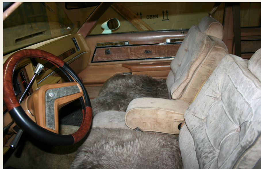
I kabinen er der lænestole så bløde, som dem vi har foran fjernsynet