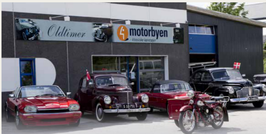
Motorbyen, Odense, en virkelig interessant ramme om klassiske biler

Jeg har flere gange besøgt min familie i USA, og jeg skal ikke lægge skjul på, at jeg nok har en lille passion for amerikanske biler. Første gang jeg besøgte USA var i