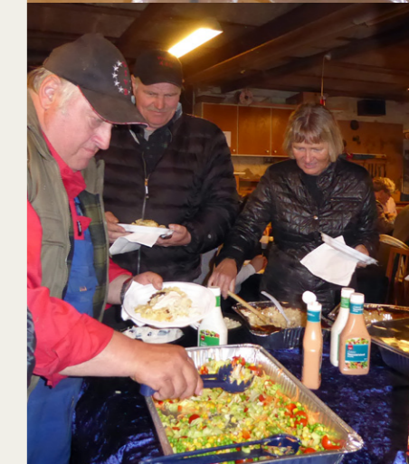
Efter løbet blev der serveret både kamsteg og oksesteg med flødestuede kartofler og grønsagsmix.