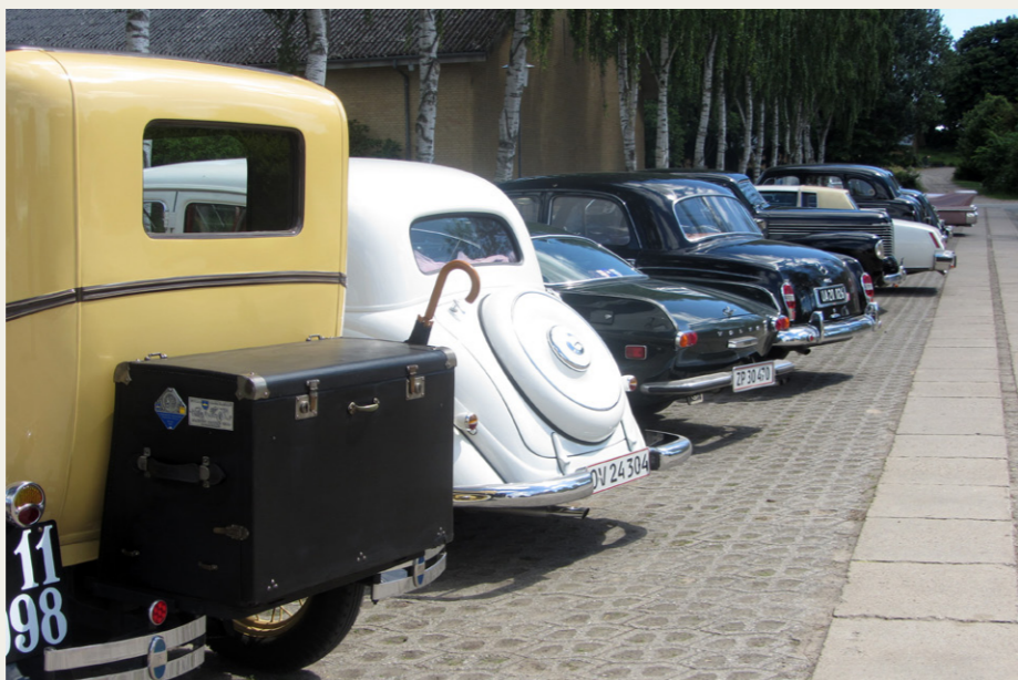
Jeg ved ikke, om det var en forudelse, der gjorde, at den gamle Opel Kapitän blev parkeret modsat alle andre, men det gjorde det noget nemmere, da den skulle skubbes igang.