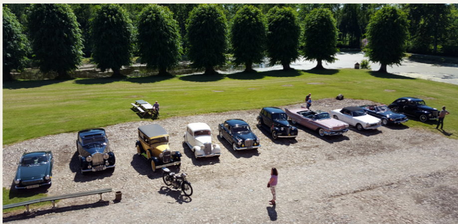
De fleste af bilerne og den ene motorcykel set fra et af vinduerne i slottet.