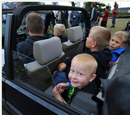
Smil over hele femøren - det er det, Birch Tvilum Classic Show handler om.

Læs mere på www.rallyshow.dk eller www.facebook.com/rallyshowdk .