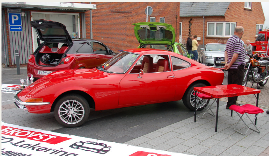
Sådan fortjener en Opel GT at tage sig ud på billeder.