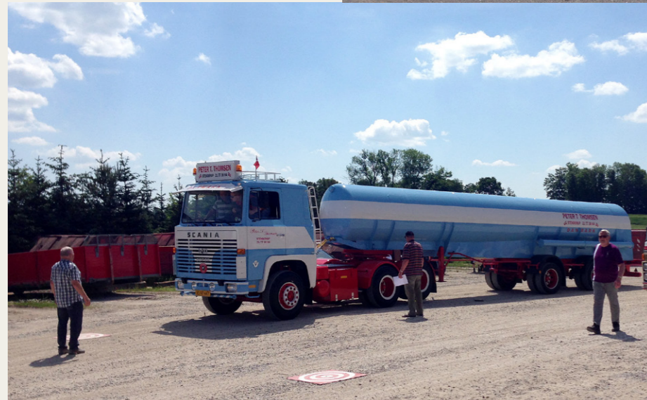
Scania LBS140, der fik en andenplads i årets konkurrence om flotteste køretøj. Fotograferet ved en post, hvor det gik ud på at ramme plet med et lod, hængende i en snor under forkefangeren

Ude på ruten var der ni poster med en blanding af spørgsmål og mere praktiske opgaver. Blandt de drilske spørgsmål var bl.a. tilladt akseltryk på to-akslet bogie for 1977 (14,5 tons, yes én rigtig), akselafstand på vores køretøj (jeg påstod desværre at, den er 5 meter, korrekt svar 5,5 meter, da Bussen er en Volvo B58-55), første NMT telefon i Danmark (1982, vi gættede rigtig) og kombiner 5 billeder af dækmønstre til lastbiler med det korrekte navn (vi havde ingen anelse og 5 forkerte...).