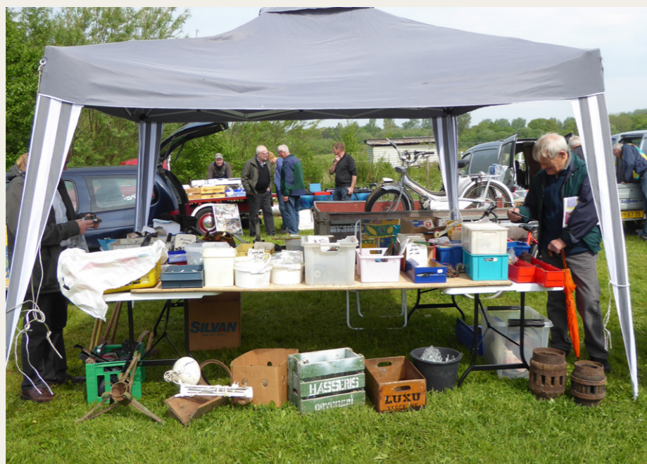
Der var da heldigvis stadig både sælgere og købere på stumpemarkedet om søndagen.

De udstillede genstande var stort set som sidste år. Der var en hel del stationære motorer, der var en hel række mere eller