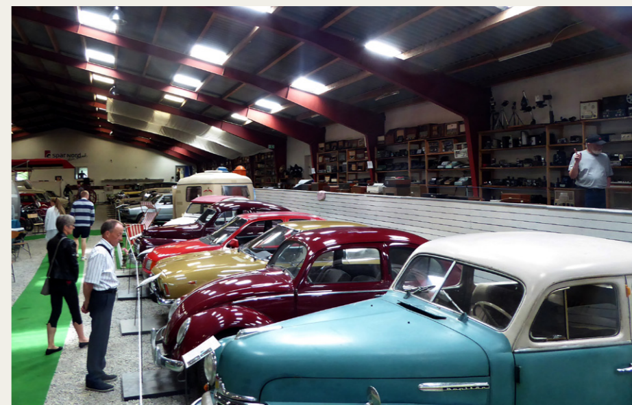
Turens første stop var ved Hjallerup Mekaniske Museum, hvor der var mulighed for at beundre den flotte udstilling.