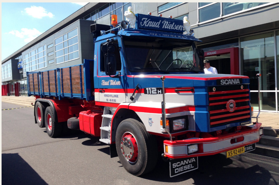
Nyeste lastbil var denne flotte Scania T112H fra 1985 med Nopa tippelad. Måske ikke en rigtig veteranbil endnu, men istandsat så den fuldstændig ser ud, som en ny entreprenorlastbil kunne se ud i 1985