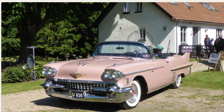
Der var egentlig planen, at Ole Svensson ville deltage i sin flotte Buick Super Eight Convertible fra 1949, men den valgte at strejke. Så var det jo heldigt, at han kunne låne denne flotte 1958 Cadillac Convertible Coupé af lillebror Carl Erik Svensson.