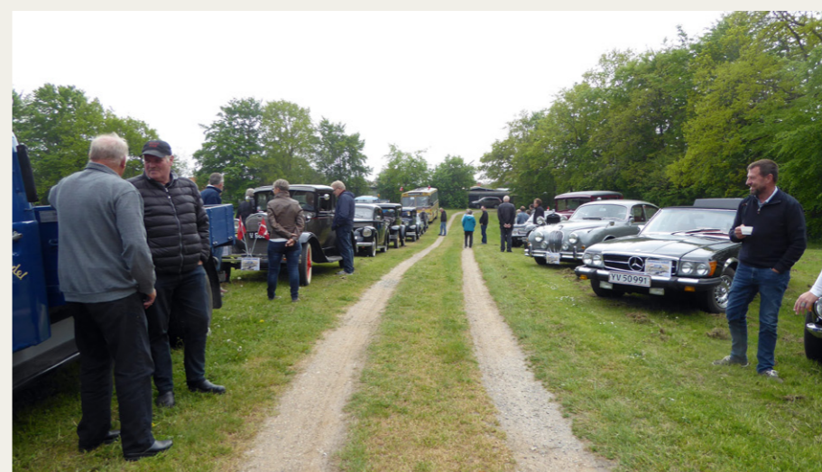
På Øster Hurup Strandpark var der tid til en lille pause og en opgave.