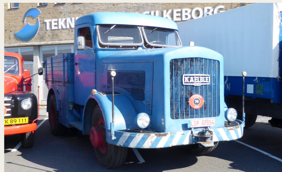
Meget speciel Kaelble „Schwerlastzugmaschine“ af ukendt årgang. Motor på ca. 14 liter og 150 hk. Motoren både lignede og lød som noget, der hørte hjemme i et lokomotiv

mere på de deltagende køretøjer, inden der var præmieuddeling. Her snakkede jeg med et par medlemmer fra Bushistorisk Selskab, der deltog i løbet med to busser, og som inviterede NVMK og Bussen med