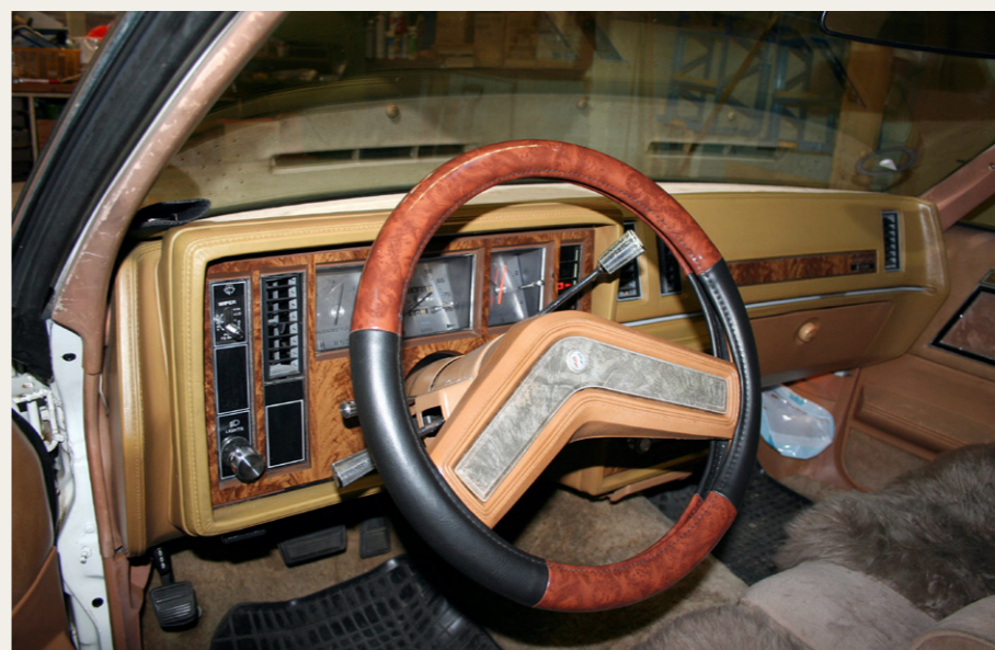
Instrumentbrættet er meget amerikansk: Ratgear, firkantede ure og store flader med noget, der ligner træ.