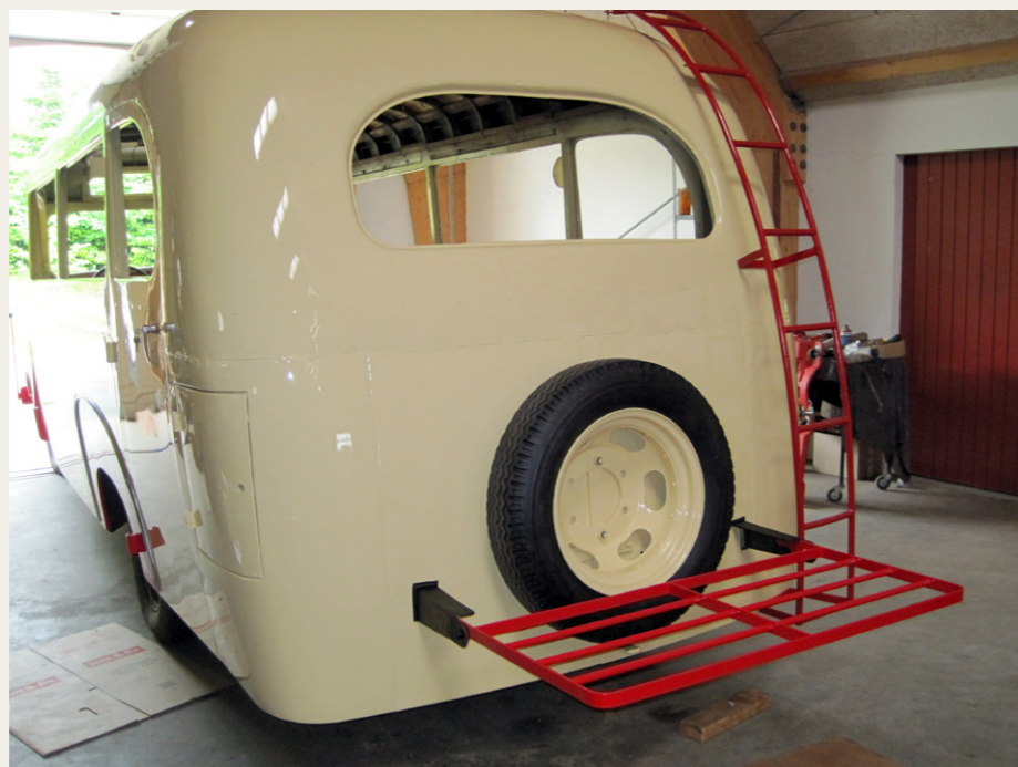
Der skulle masser af kosmetiske hjælpemidler til, for „Den Gamle Dame“ kunne få sit ungdoms udseende tilbage.