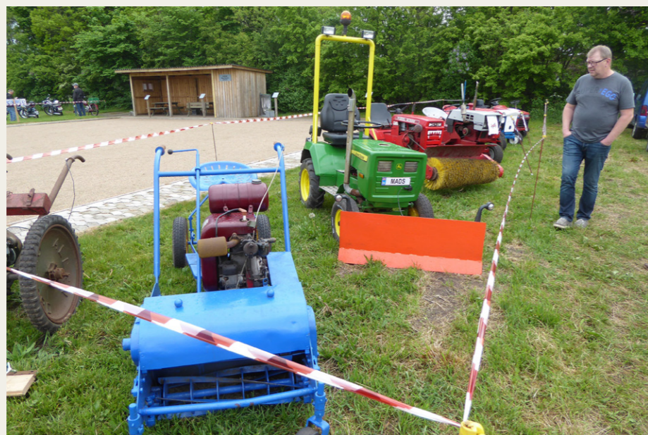
Havetraktorer og -redskaber i mangfoldige udformninger.