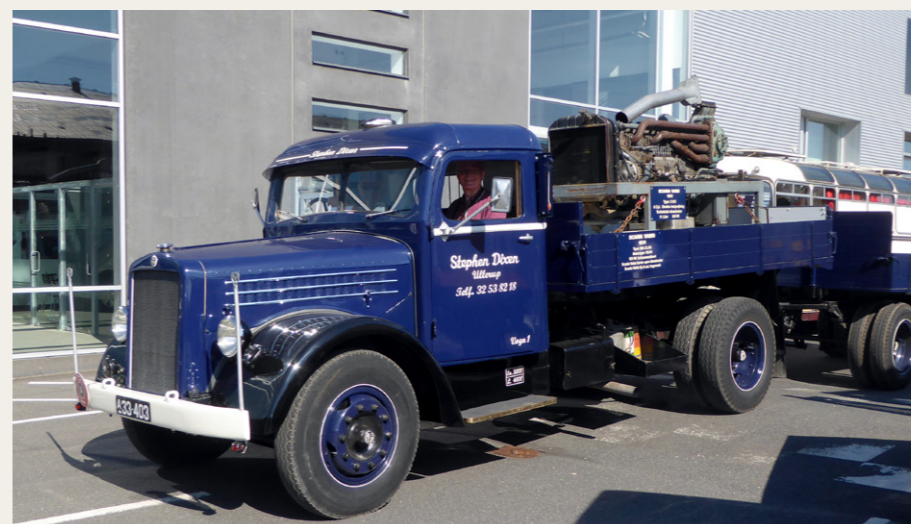
Danmarks ældste Scania Vabis, type 33315 fra 1939 ejet af Stephen Dixon fra Dragør