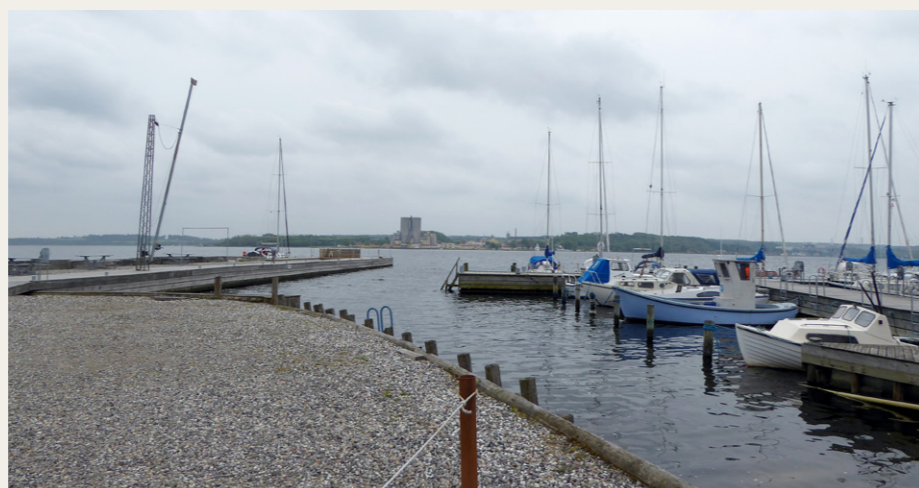
Under stoppet ved Vive Krigshavn var der en flot udsigt over lystbådehavnen og Mariager Fjord.