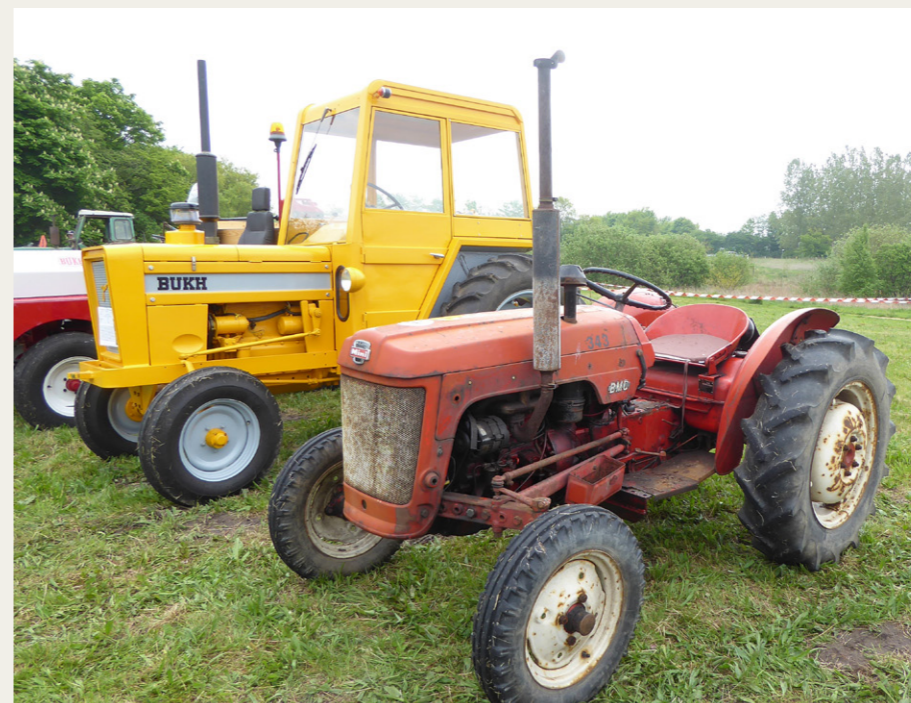
Den lille BMC traktor ser ikke ud af meget ved siden af den store Bukh traktor, men skorstenen er da næsten lige så stor.

mindre sjældne traktorer, og som noget nyt var der en udstilling af havetraktorer med forskellige redskaber. Blandt traktorerne var der en ret sjælden lille BMC Mini traktor fra starten af tresserne.