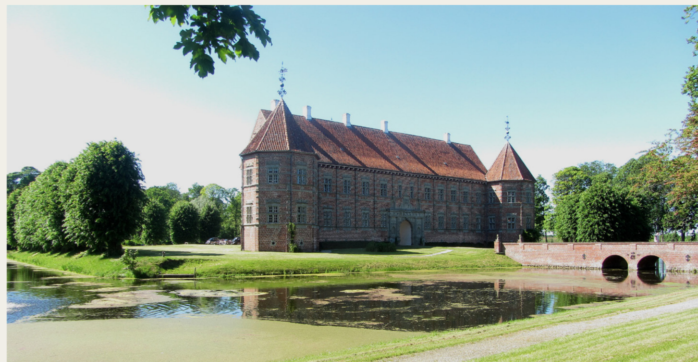
Voergaard Slot og en del af voldgraven set fra plænen ved Tinghuset. Nogle af bilerne kan lige anes på slotspladsen bag slottet.