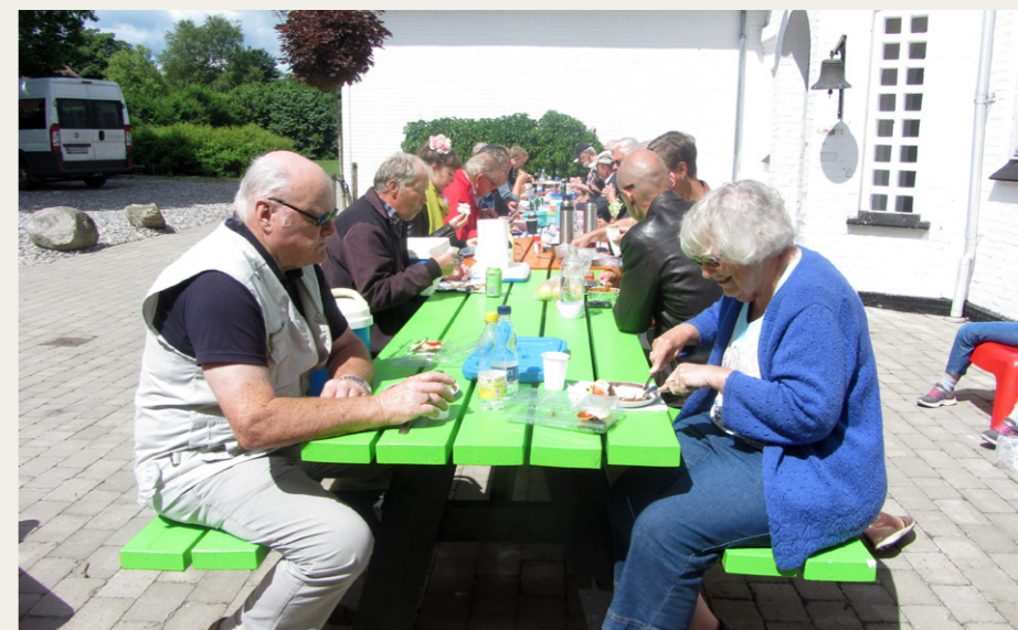
Ved Try Efterskole nød vi den medbragte frokost udendørs i det flotte sommervejr.