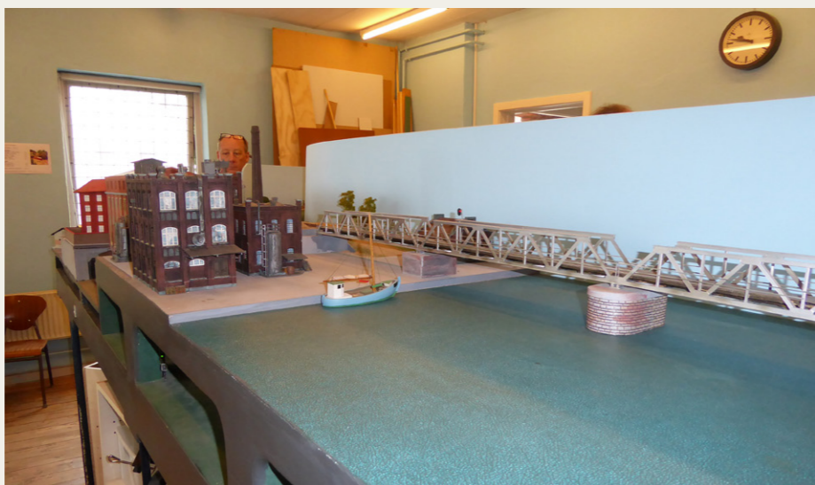
Jernbanebroen over Limfjorden og Spritfabrikken ses her fra nordøst. Lige bag den blå væg til højre for broen ligger Hadsund, og Århus er gemt væk under fjorden.