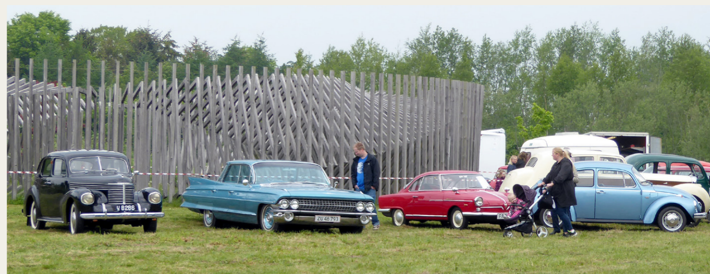
Et udsnit af de 12-15 biler, der var til stede sidst på formiddagen.