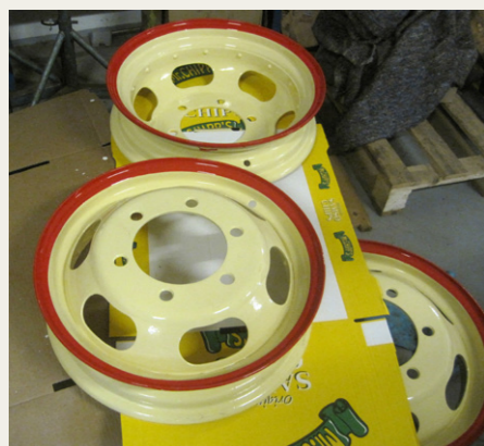
Fine nye hjul er der også blevet til.