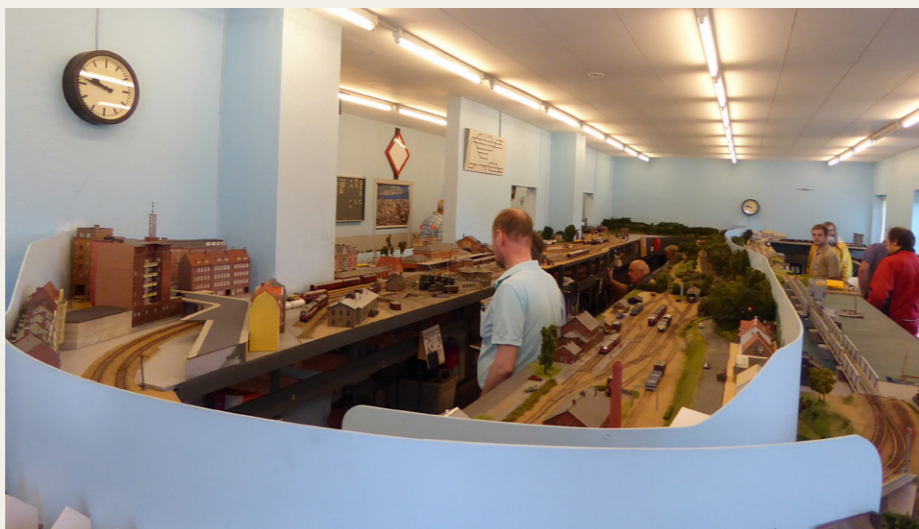
Det flotte modeljernbaneanlæg fylder ganske godt i det store lokale, og så er det endda ikke fuldt udbygget.

Geografisk er der naturligvis taget udgangspunkt i Aalborg, med den flotte stationsbygning, som den så ud før 1970, og sydpå er der både forbindelse gennem Svenstrup til Langå og videre sydpå, og til Hadsund via den gamle Hadsundbane. Nordpå kører toget ikke overraskende over Limfjorden til Nr. Sundby og videre til Frederikshavn. Det, der stadig mangler i planen, er Thisted Banegård, som skal forbindes til både Nr. Sundby og Langå, og en forbindelse fra Svenstrup til Hvalpsund.