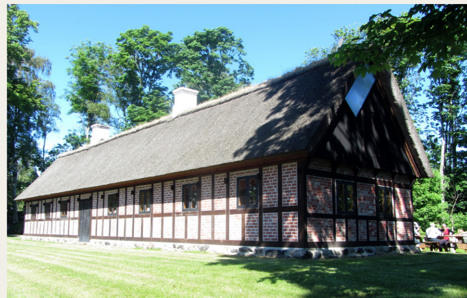
Dagen sluttede med kaffe/te og nybagt kringelkage på plænen ved Tinghuset.

Den imponerende samling er selvfølgelig beskyttet af en række sikkerhedsforanstaltninger, men det afholdt ikke et par tyveknægte for nogen år siden fra at stjæle et par malerier til en samlet værdi af flere hundrede millioner kroner. Billederne er senere kommet tilbage, men nu er det et krav for forsikringsselskabet, at der skal være forbud mod fotografering inde på