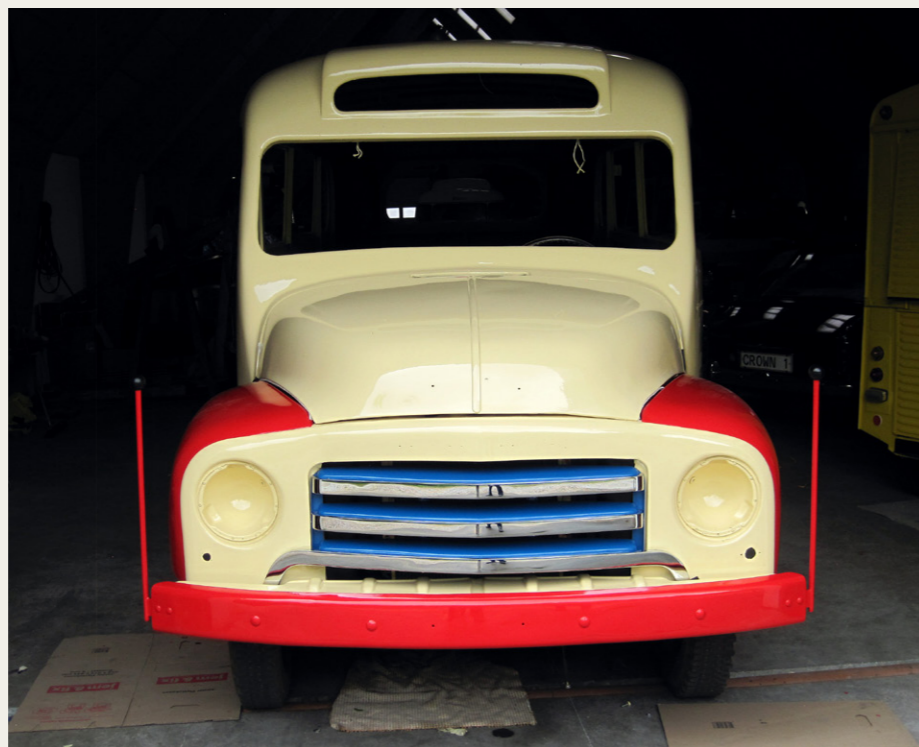
Og foran er der kommet nye solufyldninger på bisserne.