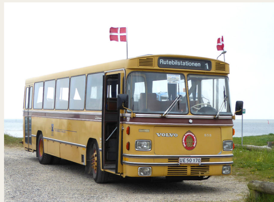
Nordjysk Vintage Motor Klubs gamle klubbus deltog også i Veddumløbet. Bussen ses her ved Als Odde.