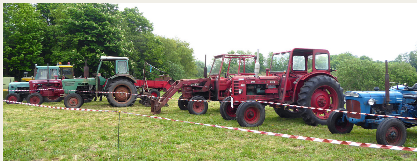
Et udsnit af de udstillede traktorer