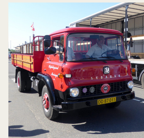
Fin Bedford K benzin fra 1965