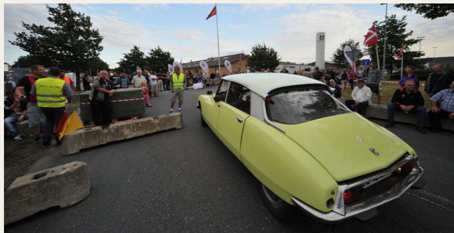
Der er glæde hos publikum i alle aldre, når indehavere præsenterer deres veterankøretøjer ved Birch / Tvilum Classic Show den 12. august i Fårvang.

Info: Mobil 40276464 - 40886464 - 23700739 www.aars-stumpemarked.dk - facebook.dk/aarsstumpemarked