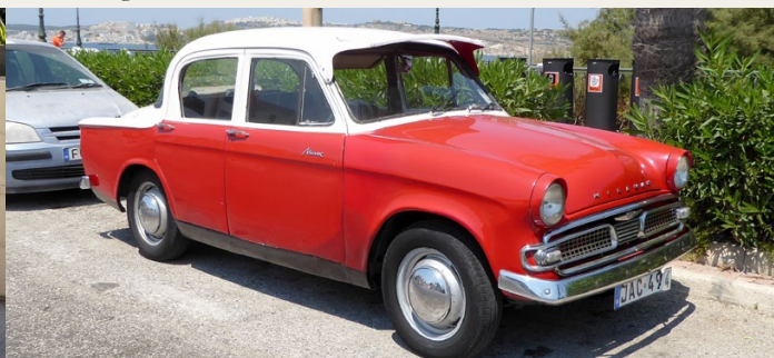
Hvorimod denne Hillman Minx ligner noget, der er med i den daglige kamp.