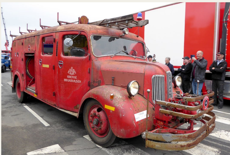
Ikke alle deltagende køretøjer var nypudsede og skinnende. Denne sjældne danskbyggede Triangel brandbil fra 1942 er nysynet og køreklar, men udseendemæssigt i stand som fundet.