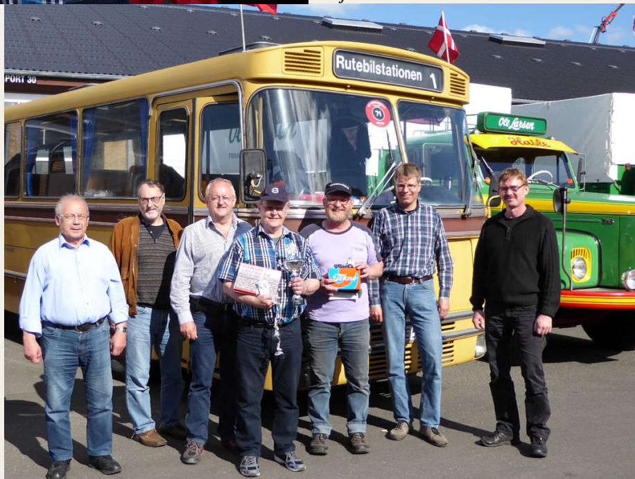
Hele holdet fra NVMK samlet foran bussen klar til hjemturen.