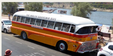
En af de få gamle Malta busser, som vi så, anvendes i dag som salgsbus for souvenirs.

Opel'en tydeligvis var parkeret nøjagtig samme sted som den fine Anglia.