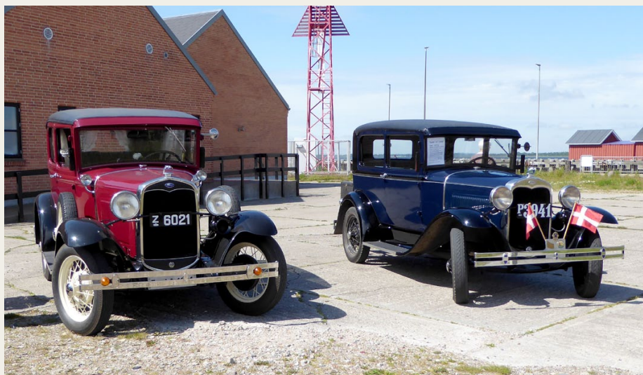
Disse fine Ford A'er fra henholdsvis 1931 og 1930 sluttede sig til selskabet i Hals.