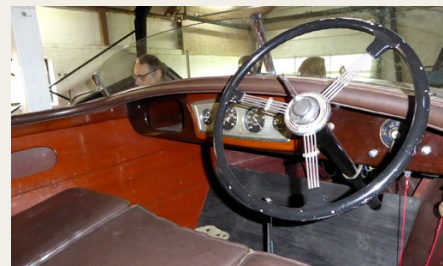
Var det ikke for de manglende pedaler kunne man næsten tro, at dette cockpit er fra en åben bil.