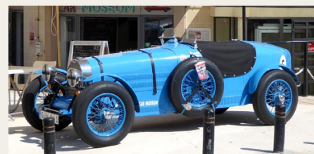
Den lille blå Bugatti anvendes som blikfang for „Malta Classic Car Museum“

ældre køretøj, som var helt dækket ned at et klæde. Ud fra profilen kunne jeg godt se, at det måtte være en Imp i en eller anden variant. Og hver gang vi kom forbi, stod den der stadig godt formummet, bortset fra en enkelt gang, hvor den var helt væk. Den anden sidste dag var klædet ikke sat helt så godt på, og nu kunne man se kofangerne, men det afslørede stadig ikke en hel masse.