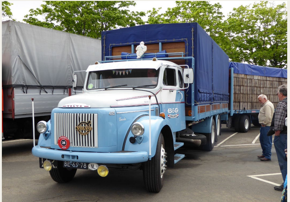
Vinderkøretøjet som årets flotteste lastbil, en Volvo L495 Titan med Turbo og Bogie. Anhængerens læsset med et imponerende læs tomme trækasser.

På turen var i alt 9 poster med forskellige typer af opgaver, både fysiske opgaver som stabling af flyttekasser og islåning af søm, og mere eller mindre drilske spørgsmål relateret til tunge køretøjer. Undervejs syntes vi ikke, det gik alt for godt med