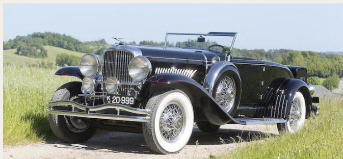
1930 Duesenberg Model J Disapearing Top Roadster by Murphy.