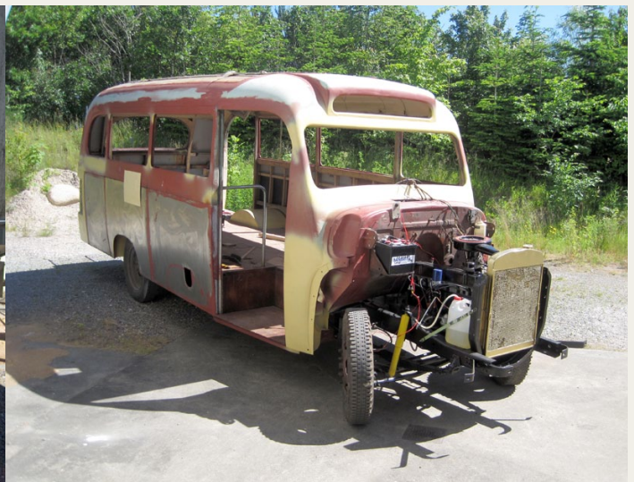
Nu begynder det igen at ligne en bus, og projektet ser ikke længere så uoverskueligt ud.