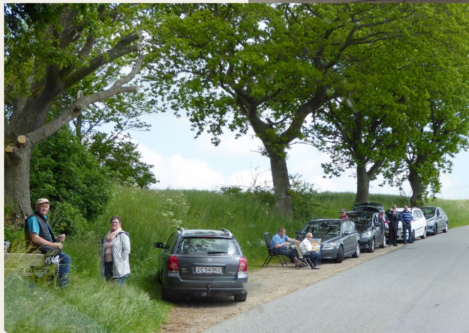
Langs ruten var der mange tilskuere med medbragte havestole, kaffekander og kameraer.