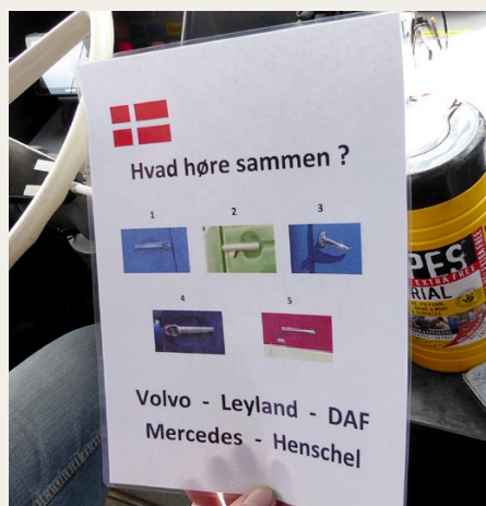
Et af de drilske spørgsmål: Hvilke dorhåndtag og bilmærker hører sammen? For en gang skyld én hvor vi havde alle fem rigtige!