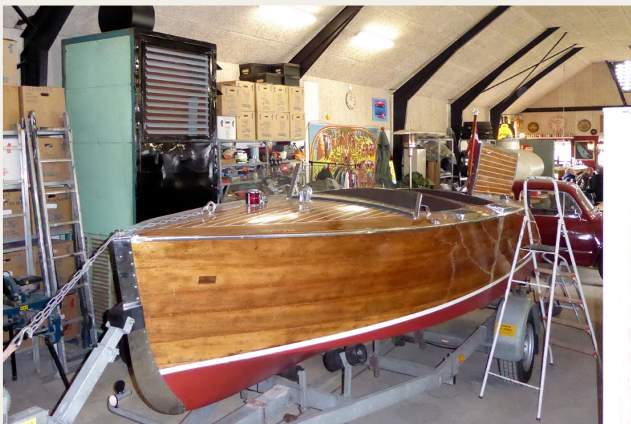
I samlingen var også denne mere end 70 år gamle Chris-Craft 17' Runabout.