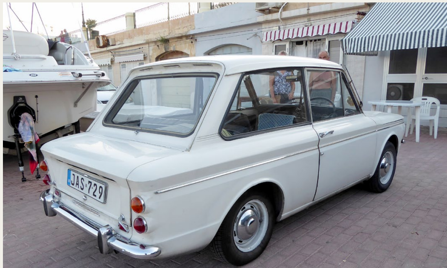
Rækværket over „garageportene“ går lang fortovet ved den lokale hovedgade. Mange af garagerne er tydeligvis indrettet som små ferieboliger.