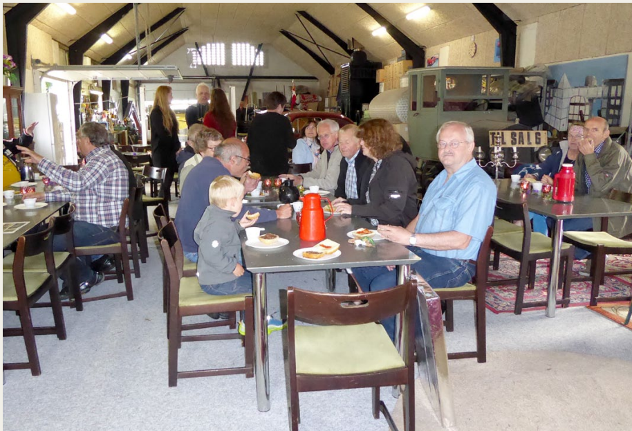
Inde i laden, garagen, værkstedet, baren eller hvad vi nu skal kalde det, var der dækket op til kaffe og morgenbrød.