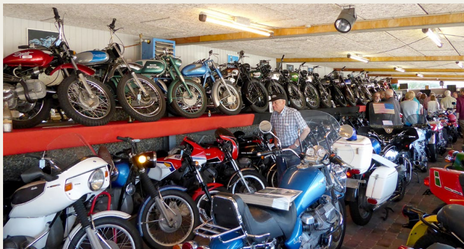
På Hedebo Strandcamping står motorcyklerne tæt pakket i flere lag.