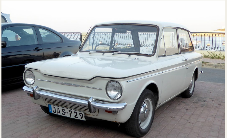
Hvem kan hjælpe Joe med hans gearskifteproblemer?