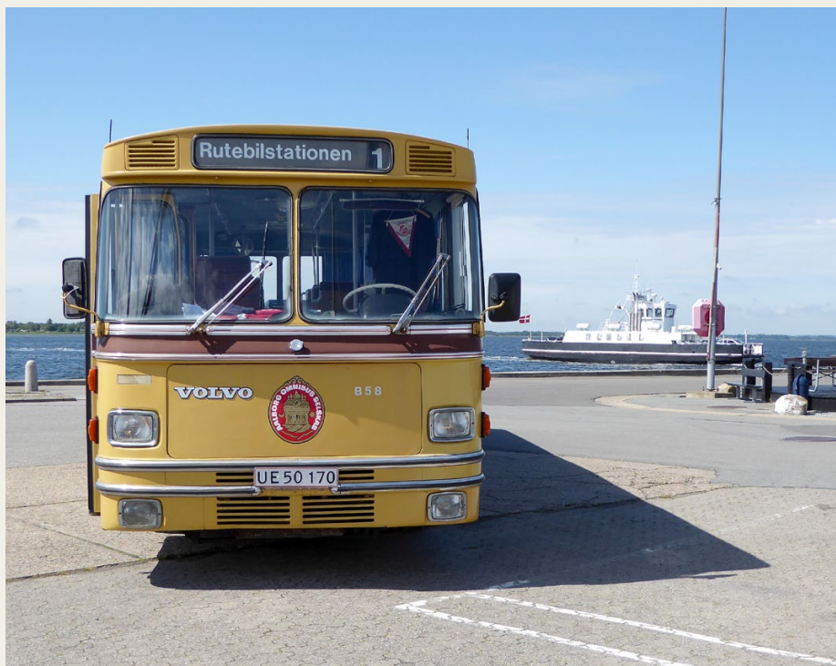
Bussen ser ganske overvældende ud i forhold til den „lille“ Hals-Egense ferge i baggrunden.