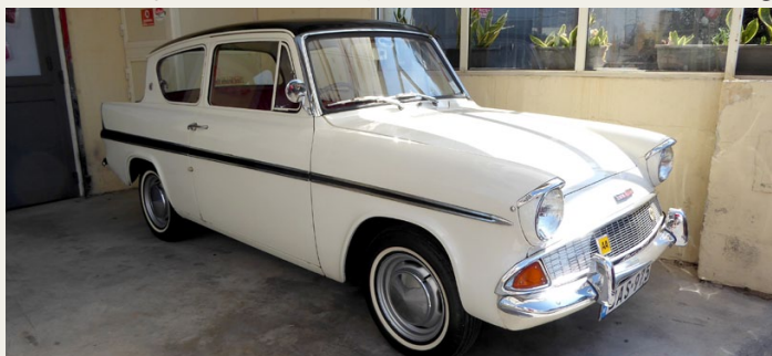
Den flotte Ford Anglia er tydeligvis et samlingsobjekt.

Allerede den første morgen, kom vi forbi en rigtig flot Ford Anglia, som holdt parkeret bag en kæde. Af skiltene på bilen fremgik det, at ejeren var medlem af veteranbilklubben "Old Motors Club, Malta" - www.oldmotorsclub.com . Et lille sjovt sidespring her er, at da jeg efter hjemkomsten kontrollerede Facebook, var der en person, der havde offentliggjort et billede af en Opel Olympia Rekord, som han havde taget på Malta. Det sjove er, at