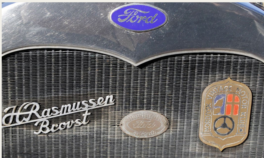
På Ford'ens køler finder vi to eksempler på tidlige udgaver af klubbens logoer. I midten er det et lille skilt med inskriptionen „Nordjysk Ford A Klub“, og til højre ser vi et tidligt skilt fra „Nordjysk Vintage Motor Klub“