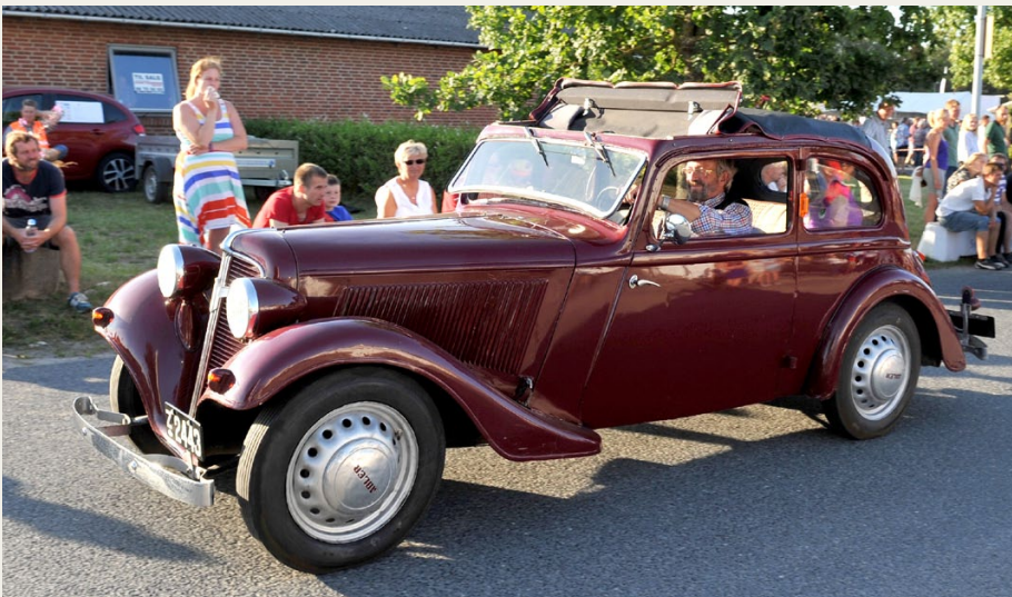
Det skaber glæde blandt store og små, når ejerne af de klassiske køretøjer viser deres veteraner frem ved Tvilum Classic Show.