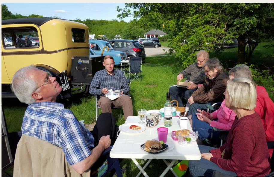
I den smukke sommeraften blev den medbragte mad nydt i mindre grupper.

fremmødte, som er medlem af NVMK, men det blev det nu ikke mindre interessant af.