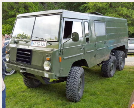
Hen på aftenen dukkede denne sjove Volvo C304 fra 1977 op i „Krattet“. Sjov når terrænet giver udfordringer, men sikkert alt andet end sjov på motorvej.