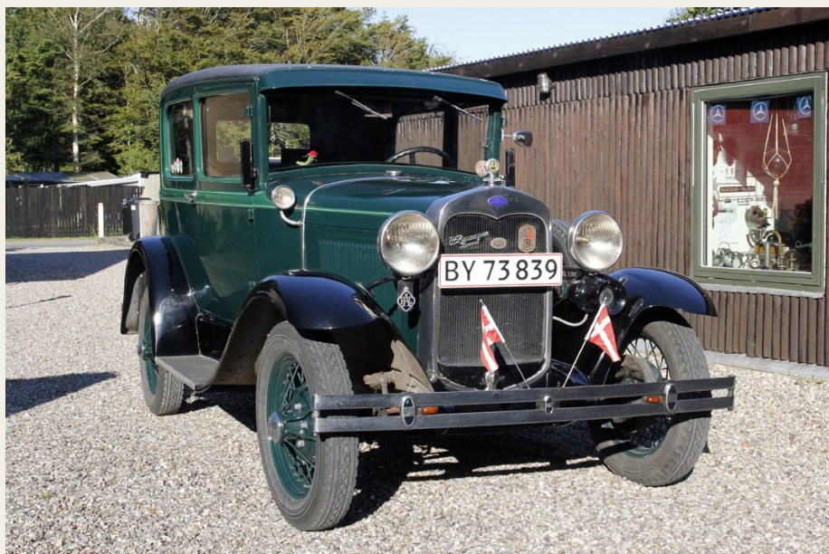
Den gamle Ford A en flot sommeraften hjemme på matriklen på Kaas Hede.