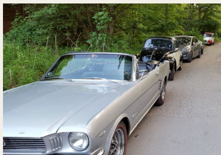
De sidste biler måtte helt op i skoven.