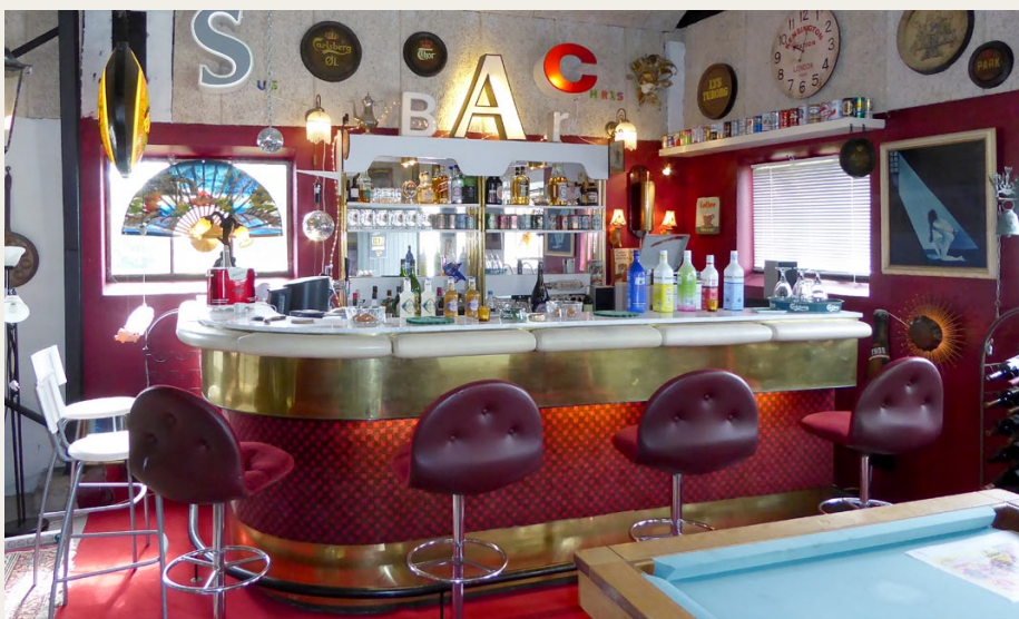
Sådan en bar burde være standard i enhver garage.

skilt. Ude i gården stod kronjuvelen, en Buick Super Eight Convertible fra 1949, klar til at tage med på udflygt.