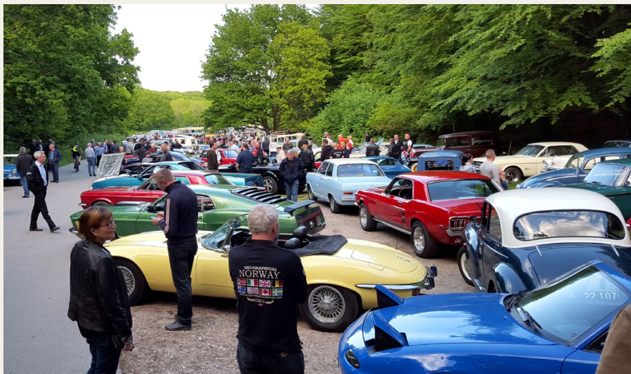
Der var fyldt op til sidste plads i Lundby Krat den anden tirsdag i juni 2015.