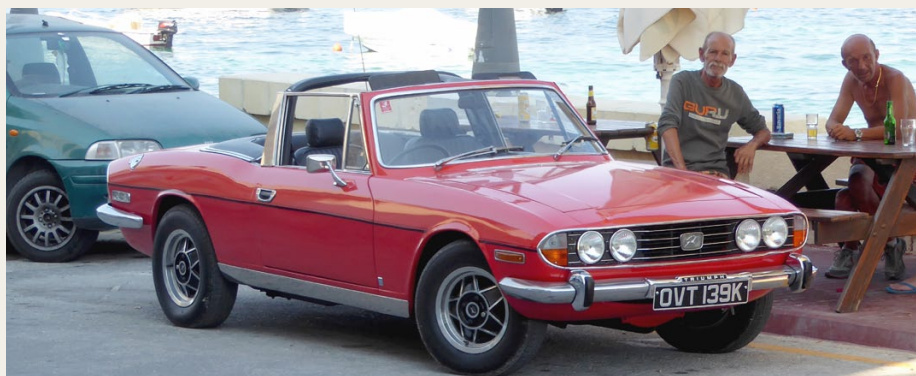
Ejeren af denne 1968 Triumph Stag, den tyndbårede herre yderst til højre, ville gerne fortælle om sin bil, men kommunikationen gik ikke helt optimalt.

Allerede den første dag på Malta fandt vi en dejlig rute, som vi gik mindst én gang om dagen i den uge, vi var der, og allerede på den første dag kom vi forbi et