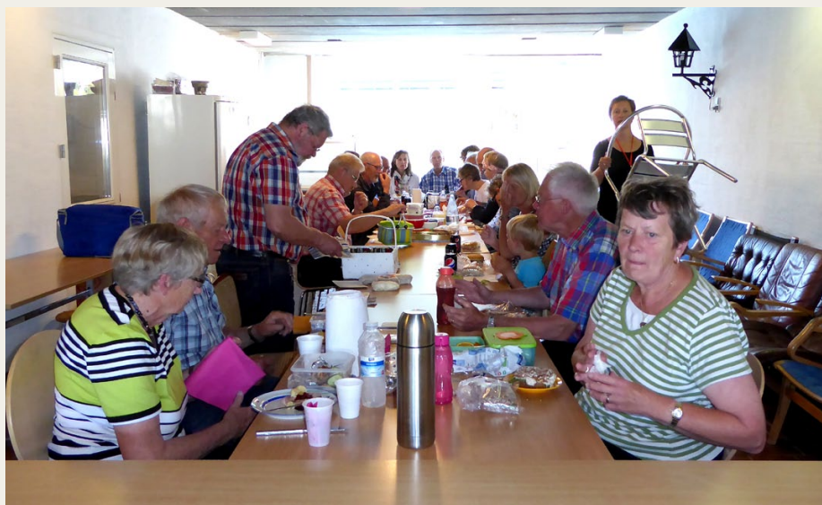
Der var plads til næsten alle ved langbordet, da der var fællesspisning i en af opholdstuerne på Hedebo Strandcamping.