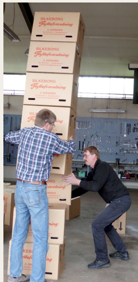
Stabling af flyttekasser på tid ved Silkeborg flytteforretning. De blev stående, så vi fik point for 8 kasser.