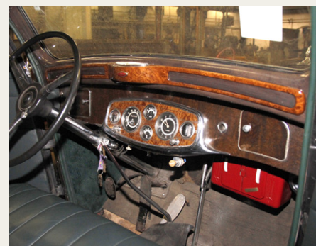
En moderne førerplads årgang 1934.