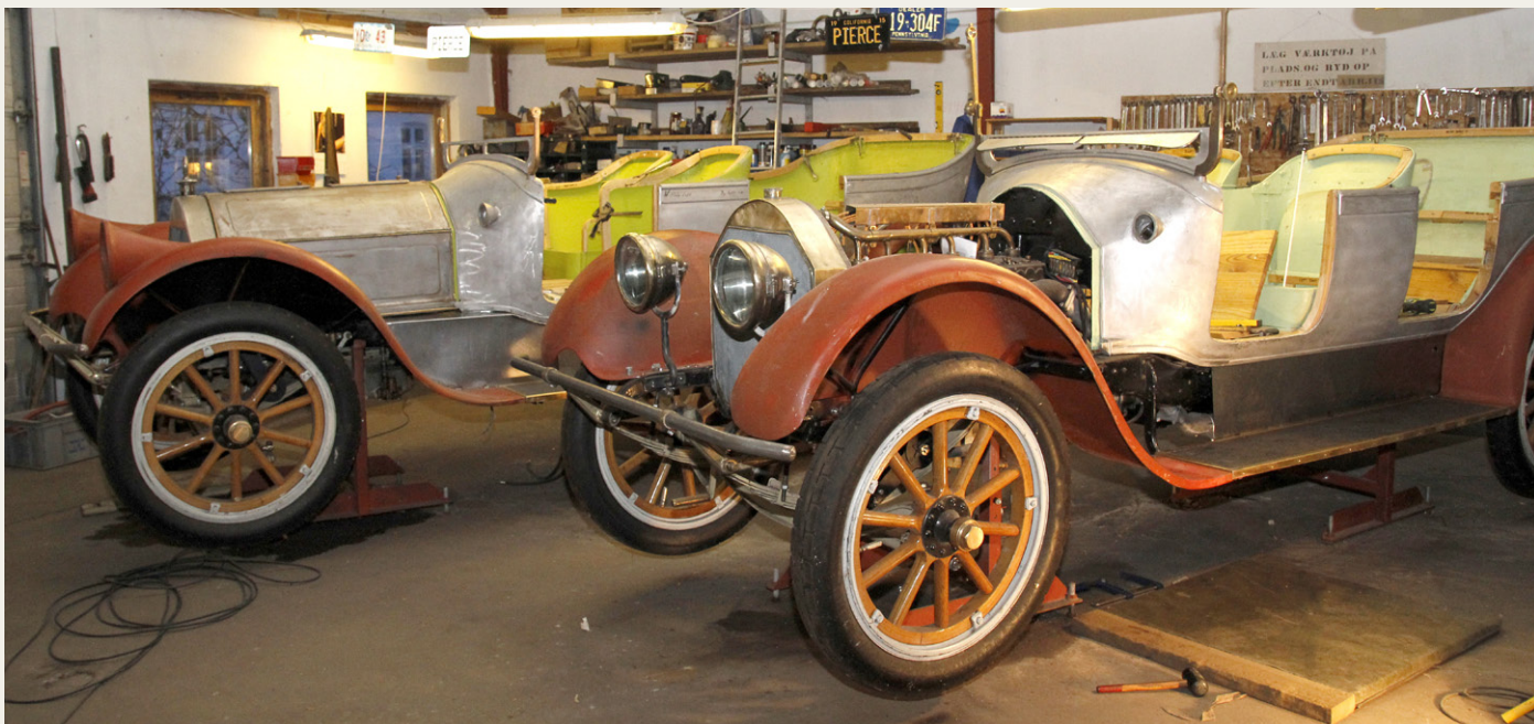
Ved første blik ser der ikke ud til at være sket en hel masse i det sidste år, men et nærmere kig på detaljerne viser, at der er sket en hel masse.