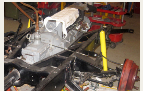
Motoren har fået den helt store omgang.