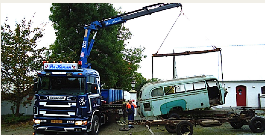
I sommeren 2014 blev min overkrop flyttet til en midlertidig underkrop.