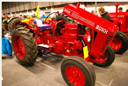
Nogle traktorentusiaster restaurerer deres traktorer til samme høje niveau som ses hos mange veteranbilentusiaster. Her en 2-cylinder BUKH Super på 30HK, der nærmest er i bedre stand, end da den forlod fabrikken som ny i 1961.