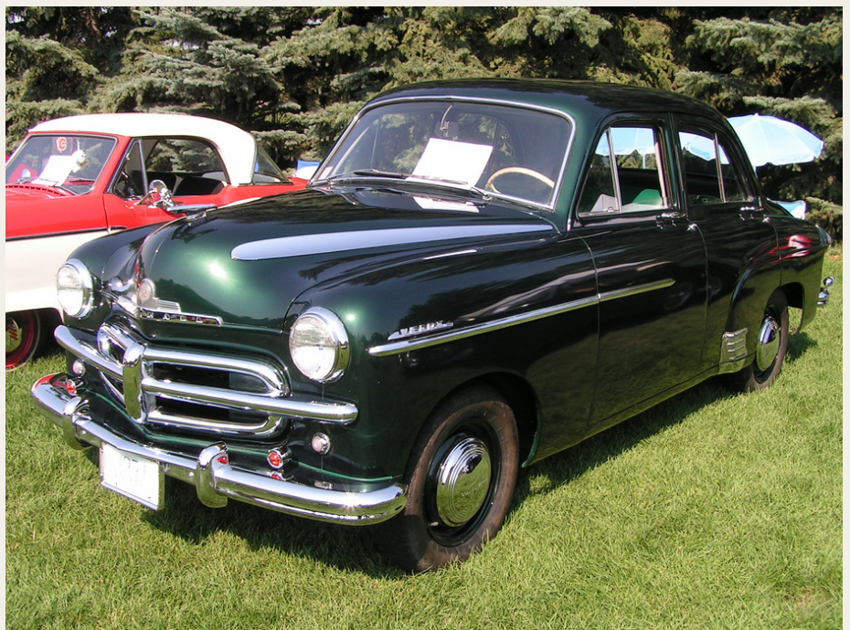
Min fars tredje bil var en Vauxhall Velox i stil med denne, som venligst er lånt fra internettet.