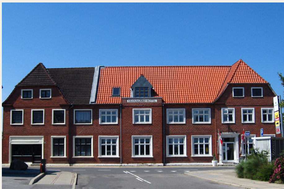
Den 11. maj går turen til Skovsgård Hotel