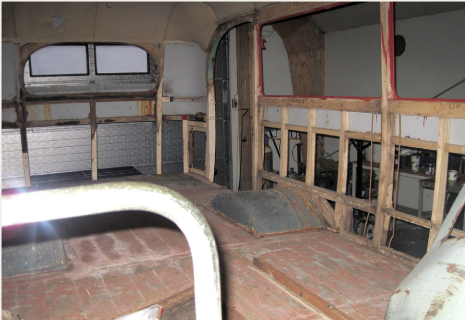
Lige nu er der plads til at holde bal i mit indre, men 15 stole venter på at flytte ind igen.