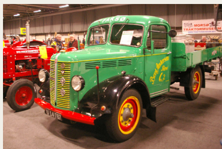
En enkelt lokal veteranbil havde også fundet ind på udstillingen.