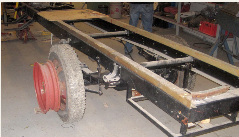
Understellet er næsten lige så godt, som da jeg blev født.

en vognmand i Aulum og senere „Billig“ Bent i Hals og Strømmens Autoudlejning i Randers. Derefter havnede jeg, sammen med mange andre meget større søskende, i Grenå hos Granly Bussamling.