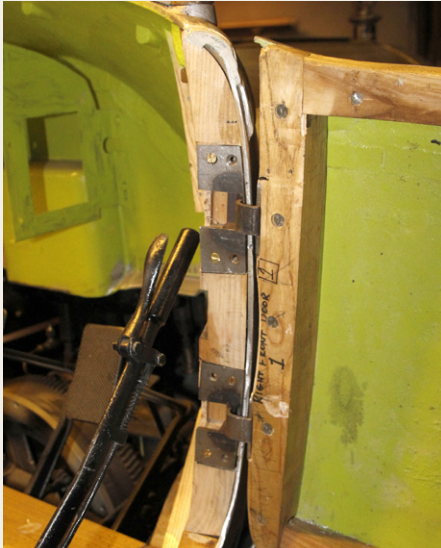
Alle 16 dørhængsler i de to biler ender sandsynligvis med at blive forskellige.

på begge biler. Den ene af dem er lavet så færdigt, at man kan se, hvordan man med et lille håndtag kan åbne to klapper under forruden. Aircondition årgang 1915.