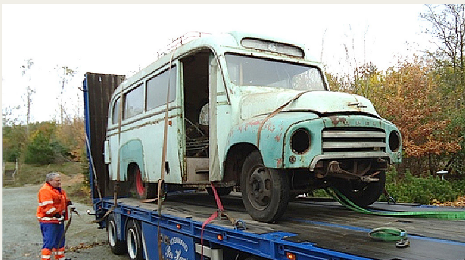
Turen til Hjallerup foregik på ryggen af et meget større køretøj.