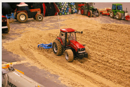
Radiostyret modeltraktor på arbejde i „sandkassen“.

Efter indlægget fra MhS vedrørende registreringsafgift på veterankøretøjer i Hornet oktober 2014 har medlemmer bedt om en enklere forklaring og eventuelt et eksempel.