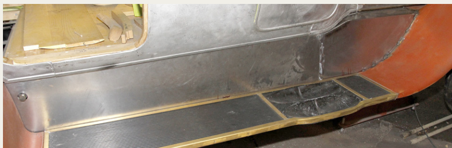
Her er et af de fire sideskorter, som for øjeblikket er under opbygning og tilpasning.

Der er nu gået et år siden den sidste beretning fra Bent, og når vi kommer ind i værkstedet til de to store Pierce Arrow'er, kunne man umiddelbart godt få det indtryk, at der ikke er sket en hel masse siden sidst, men når man kigger nærmere