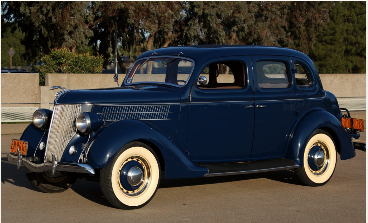
Denne fine Ford V8 DeLuxe fra 1936, som er fundet på internettet, er ikke helt sort, men den har de gule hjul.

en Ford V8 årgang 1936, sortlakeret med gulmalede fælge. I min erindring var det en rigtig flot bil, og jeg husker at jeg var meget betaget af lyden fra V8 motoren, som var meget karakteristisk.