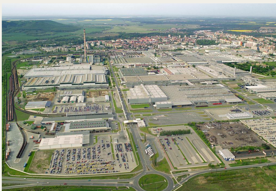
Den 12. oktober skal vi se en film, som blandt andet indeholder et besøg på Skoda fabrikkerne i Mladá Boleslav i Tjekkiet.