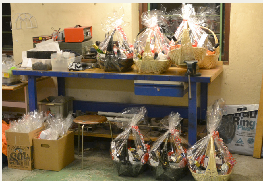
De flotte præmier var linet op på gulv og arbejdsbord i værkstedet.