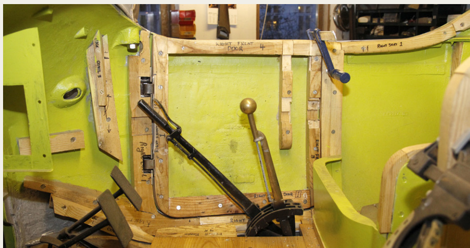
Der er stadig noget træarbejde, der skal laves indvendigt i de to gamle Pierce Arrow'er.

I svaret fra PAS fortælles, at Pierce Arrow foreskrev følgende standard farver for karrossierne: sort, mørkere blå, mørkere brun, mørkere grøn, mørkere rødbrun eller mellemgrå. Skærme, skorter og ben-