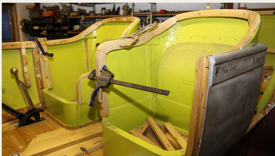
Sadelmageren ville gerne have haft sæderammerne med hjem, men det er nu ikke så enkelt. Bemærk forskellen på de to forsæder. Passageren nyder godt af høje stolesider, mens føreren får plads til større armbevægelser.

zintank skulle være sorte, og hjulene skulle være enten sorte eller samme farve som karrosseriet.