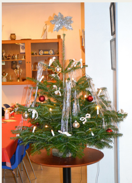
Dette fine lille juletræ var førstepræmie i det amerikanske lotteri, som blev gennemført i bankopausen.