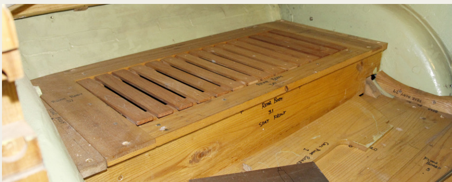
Der er kommet låg over rummet til værktøjskassen.