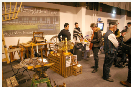
Museet Herregården Hessel havde også arrangeret sig med en stand på udstillingen.