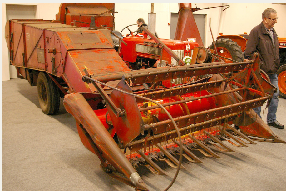
.....og fra samme virksomhed en 6' halvbugseret mejetærsker her monteret på en IH 414 årgang '62.

en stand med arbejdende radiostyrede traktorer havde fundet vej til weekendens udstilling – og ret imponerende er det at se, hvor akkurat og naturtro det kan gøres med disse radiostyrede modeller.