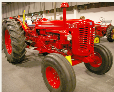
Det eneste eksisterende eksemplar af en 6-cylinder Bukh 956 på 95 HK, som aldrig kom i produktion.