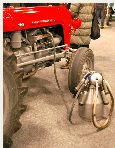
Sådan kunne man også skabe vakuum til at drive malkemaskinen.