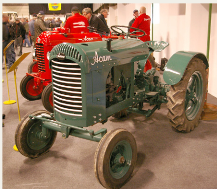
Prototype fra 1950 af den danske Acam traktor med Ford Prefect motor fra A/S Cbr. Andersens Maskinfabrik, Holbæk

Omkring 100 traktorer var udstillet samt et pænt udvalg af ældre maskiner og redskaber. Som ved de fleste andre af denne slags udstillinger og stumpemarkeder er også modeller pænt repræsenteret i form af et antal salgsstande med - ved denne lejlighed, naturligt nok - et rigt udvalg inden for modeltraktorer og -redskaber, høstmaskiner, entreprenørmaskiner m.m. Også