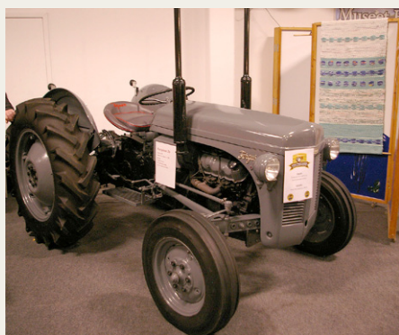
En „lettere“ modificeret 1958 Ferguson 26 med Ford Granada V6 2300 motor på 108HK.