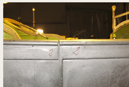
Foreløbig mærkning af dør og karrosseri.

På et eller andet tidspunkt skal der monteres forruder på bilerne, og de nederste dele af vinduesrammerne er monteret