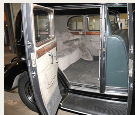
Der er masser af benplads bag i sådan en Pierce Arrow, forudsat man ikke tager de ekstra klapsæder i brug.