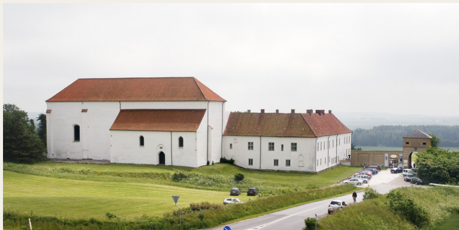
Sommersæsonen forventes afsluttet med et besøg på Børglum Kloster den 13. september.