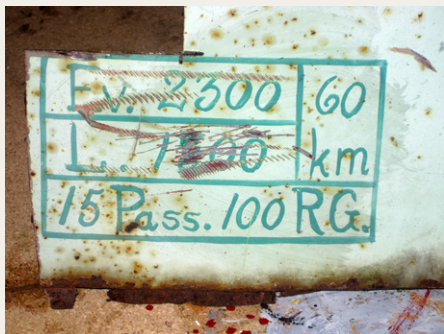
Sandheden om min vægt kan ikke holdes skjult.

Jeg kan ikke huske hvem, der fik mig lavet, men jeg kan huske, at jeg har tilhørt