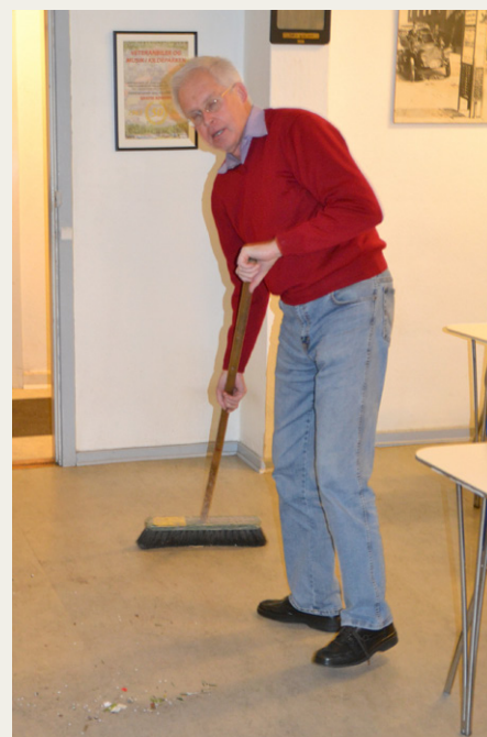
Efter at det hele var slut, gik formanden i spidsen for rengøringsholdet.