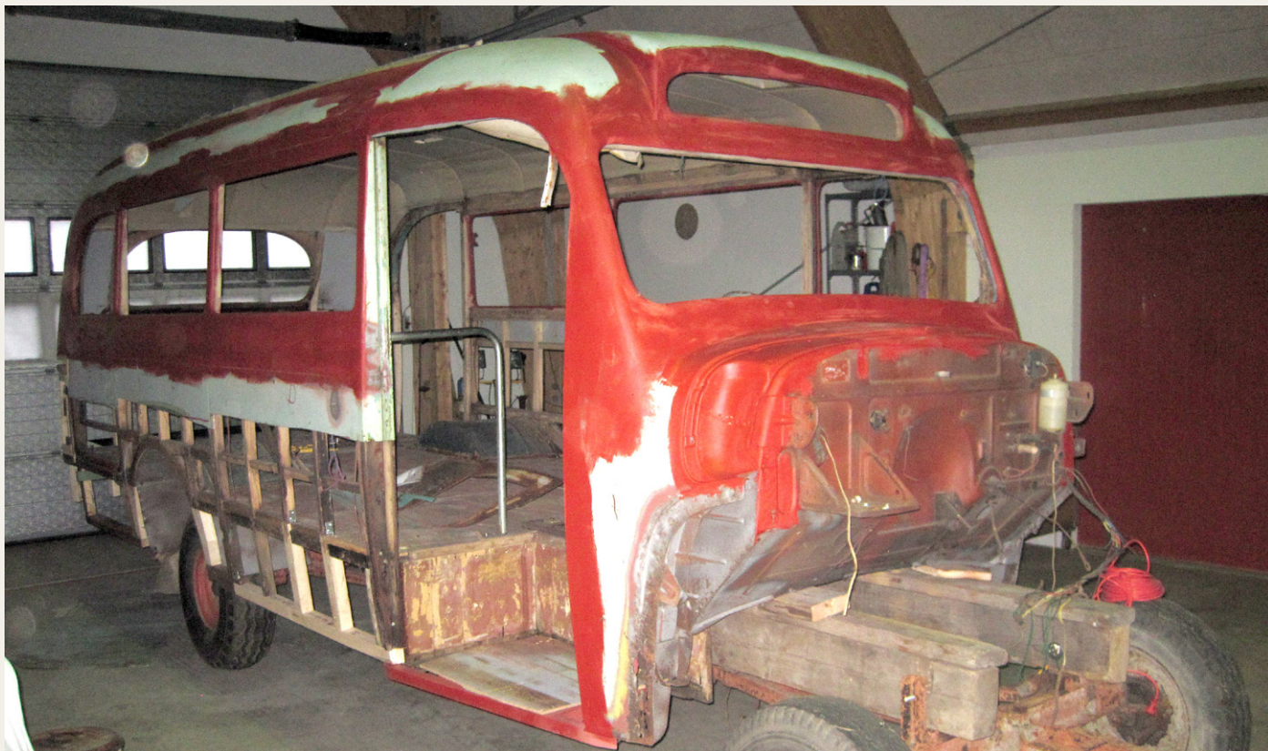
Overdelen er midlertidig placeret på en vogn. Og nej, jeg skal ikke have chassissramme af træ fremover.