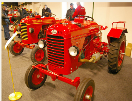
I forgrunden en 1951 Acam traktor, der betragtes som den første produktionsmodel. I baggrunden Acam traktoren i 1952 Saxon-udgave, som solgtes gennem firmaet SAXONIA i København.