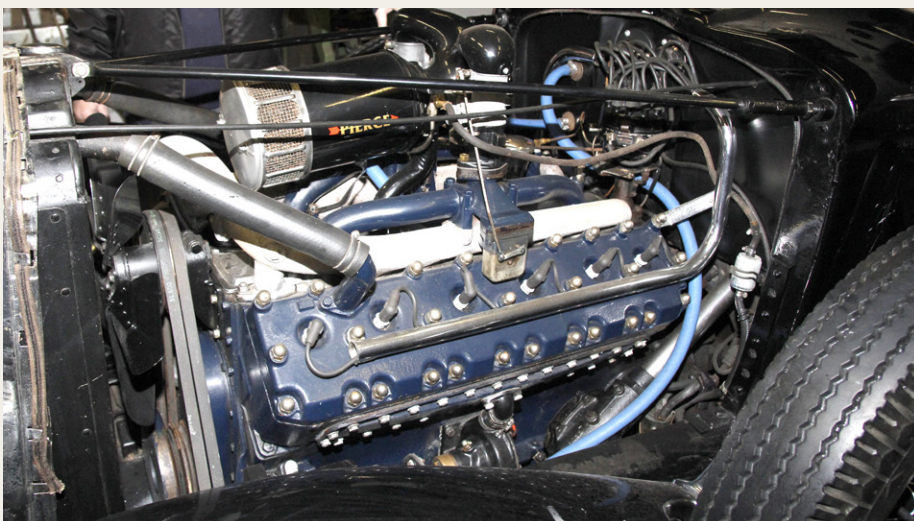
7,6 liter slagvolumen fordelt på tolv cylindre fylder temmelig meget i det store maskinrum.