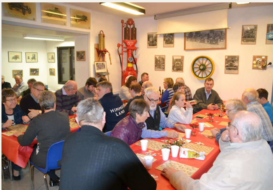
Der var et rigtig flot fremmøde til årets Julestue.