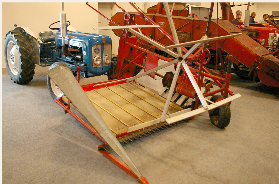
JF's (J. Freudendahl A/S, Sønderborg) bud på en halvbugseret binder spændt på en Fordson Dexta.