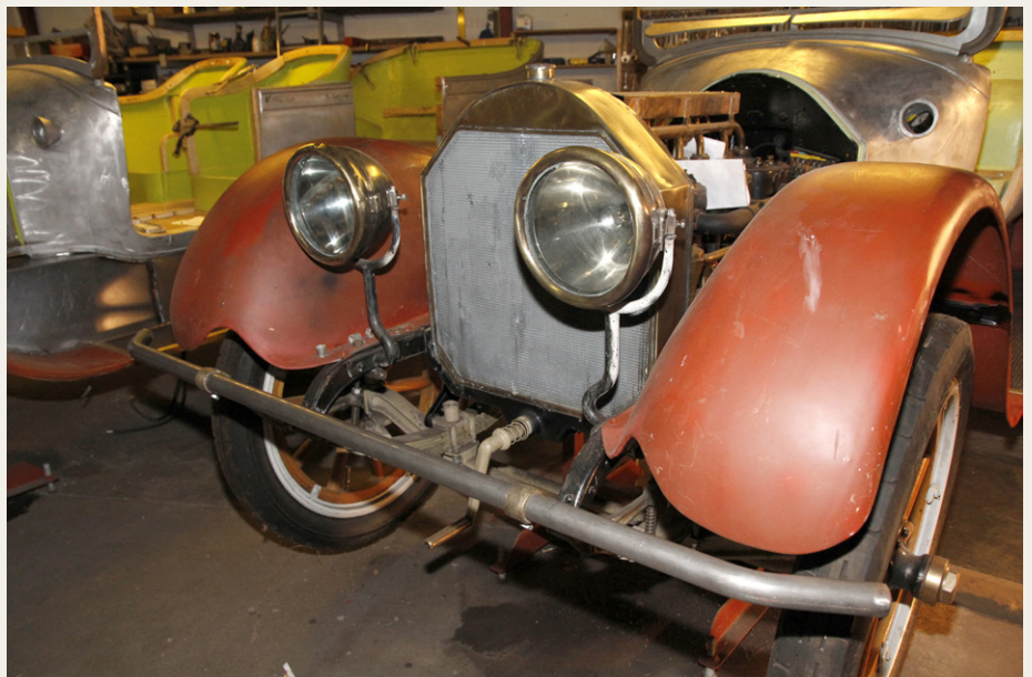
En af de ting, som er kommet til siden sidst, er kofangerne. Et simpelt bukket rør, som dog er fjedrende ophængt, så det giver lidt efter, hvis man kører på noget.