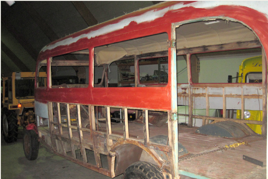
Lige nu er jeg ikke helt tæt, men en gang plastikkirurgi skulle gøre underværker.