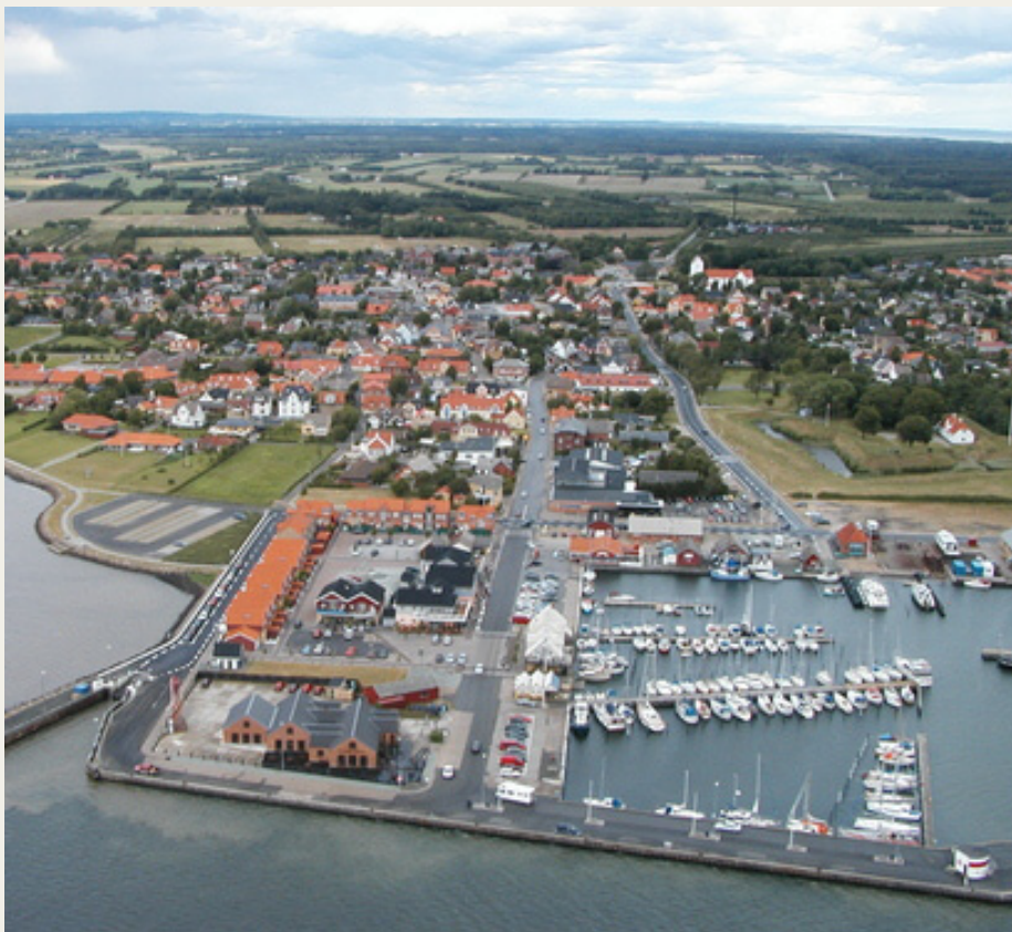
Hals Havn er vel en af de havne, der skal besøges på „Havneturen“ den 20. juni.

Næste sommerarrangement foregår lørdag den 22. august, hvor der arrangeres en „Skagerak-tur“, selvfølgelig med inspiration fra turen langs østkysten. Mødestedet bliver i nærheden af Aabybro, måske også med fælles afgang fra klubhuset. Turen kommer til at gå ad mindre veje op langs vestkysten med stop i byerne Blokhus, Løkken og Lønstrup – og måske lidt længere nordpå, når turen bliver planlagt i detaljer. Der bliver tilmelding til dette arrangement.