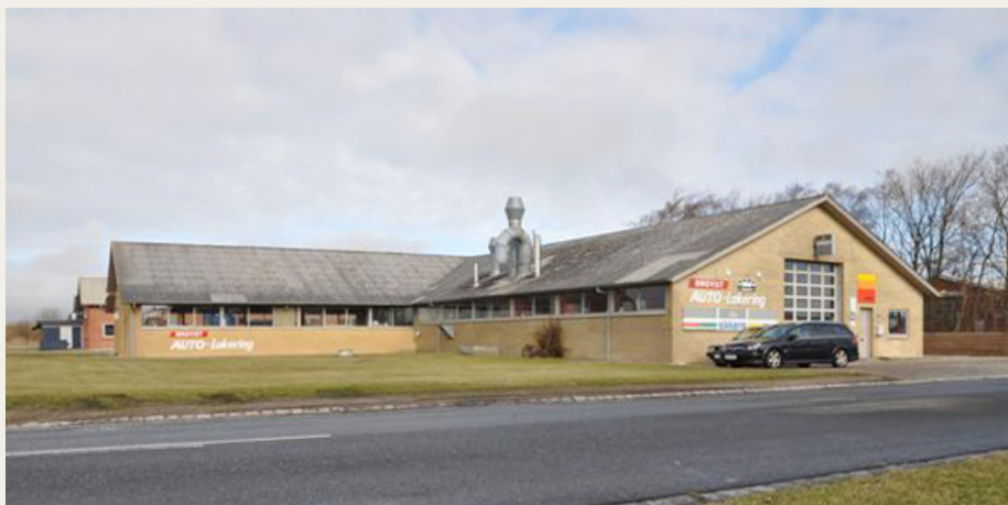
Den 13. april skal vi på besøg hos Brovst Autolakering, Industrivej 1, 9460 Brovst.

Skovsgaard Hotel er en socialøkonomisk virksomhed, der i mange år har videreført det gamle jernbanehotel, men på nogle helt andre menneskelige og økonomiske vilkår. Skovsgaard Hotel fungerer som arbejdsplads på særlige vilkår for mennesker, der af forskellige grunde ikke har kunnet få fodfæste på det almindelige arbejdsmarked. For yderligere oplysninger se www.skovsgaardhotel.dk . Vi forventer tidsmæssigt at ankomme til Skovsgaard Hotel så vi kan være klar til at nyde en dejlig 3-retters menu i hotellets restaurant kl. 19.30. Der er parkeringsplads lige ved siden af hotellet. Der bliver som forret serveret Skorzonerrod med vinaigrette og pocheret æg, som hovedret serveres der smørstegt rødspætte med smørsovs, og