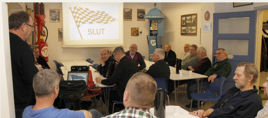
Efter afslutningen af selve foredraget var der rig lejlighed til spørge og diskutere.

Men det var nu ikke for at besøge museet, at Ib var taget Beaulieu, men derimod for at opleve the International Autojumble, det største udendørs stumpemar-