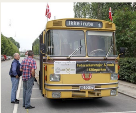
Selv om skiltet siger: „Ikke i rute“, så kørte klubbens gamle Volvo-bus faktisk i rutefart denne dag. Her ses den ved det „faste“ stoppested på Gammel Kørvej.