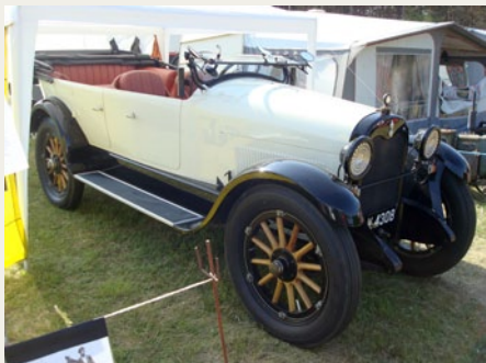
En J.I. Case fra 1919 er en meget stor og flot veteranbil.

Der var også en stand med datidens moderne hjælpemidler til husmoderen. Når man ser på disse to vaskemaskiner, kan man godt komme i tvivl om hvilken