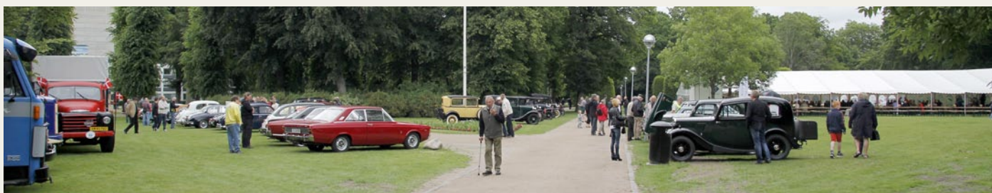
For veteranbilselskere, som tilfældigt kom igennem Kildeparken denne lørdag, må dette have været et overraskende og dejligt syn.