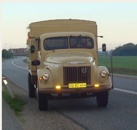
HC's fine Volvo fra 1956 meget tidligt om morgenen.

Vel ankommet til Silkeborg var det tid til at bese de øvrige 109 meget flotte lastbiler og igen i år var Silkeborg Veteranrally en stor oplevelse og godt tilrettelagt!