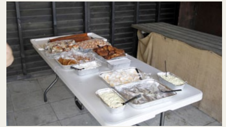
Den lækre frokostmenu bestod af krabbekløer, hummerhaler, røget laks, fiskefileter, fiskefrikadeller og marinerede sild med kogte æg.