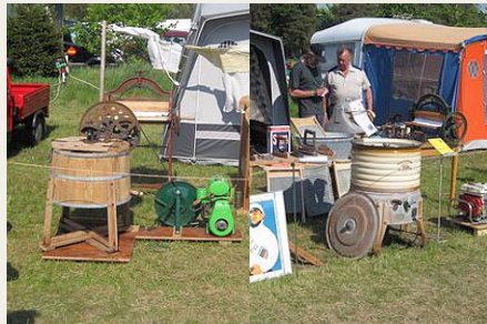
To gamle vaskemaskiner med henholdsvis benzinator og elmotor.

Der var også et flot eksemplar af en stok