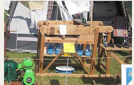
Med fuld læs i kassen kan sådan en stokrulle gøre dugene meget fine.