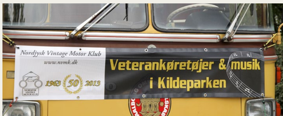
Der skulle blandt andet fremstilles bannere som det, der her er monteret på fronten af den gamle Volvo bybus, som i dagens anledning fik lov til at køre en „fast“ rute i Aalborg.

Vi blev relativt hurtigt enige om, at det ikke burde være urealistisk, at sådan en fødselsdagsfest kunne mobilisere omkring lige så mange køretøjer som en „god aften i Lundby Krat“. Det skal ikke være nogen hemmelighed, at jeg personligt drømte om et par hundrede køretøjer - alt i alt, men et eller andet, forhåbentligt ikke kun vejret, gik ikke helt efter „vores hoveder“, og det er lidt træls, men næste gang klubben fylder 50 år så.....(er der nogen andre