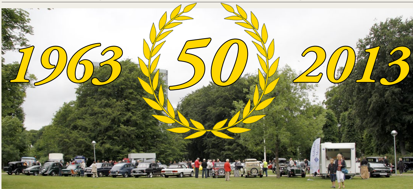
Kildeparken den 22. juni 2012: Masser af veterankøretøjer og glade mennesker, men der var plads til mange flere.

Det var med stor spænding vi så frem til Nordjysk Vintage Motor Klubs 50 års Jubilæumsarrangement den 22. juni 2013.