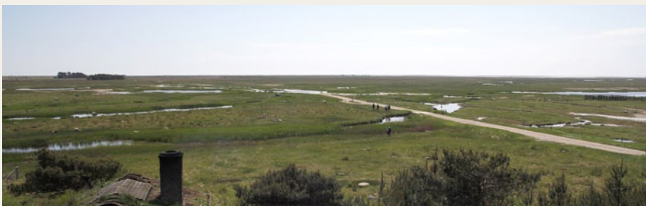
Fra Læsø Saltsyderi's udsigtstårn kan man tydeligt se, at Rønnerne, hvor man benter det meget saltholdige vand, er meget flade.