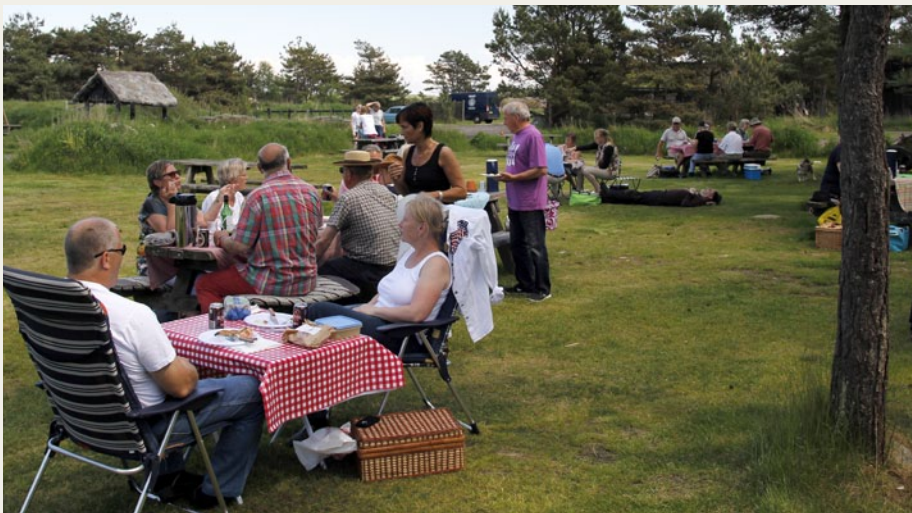
Frokosten skulle indtages ved Saltsyderiet, og deltagerne forsøgte så vidt muligt at placere sig i skyggen. Dagens vind er i afslappet, vandret position i baggrunden.