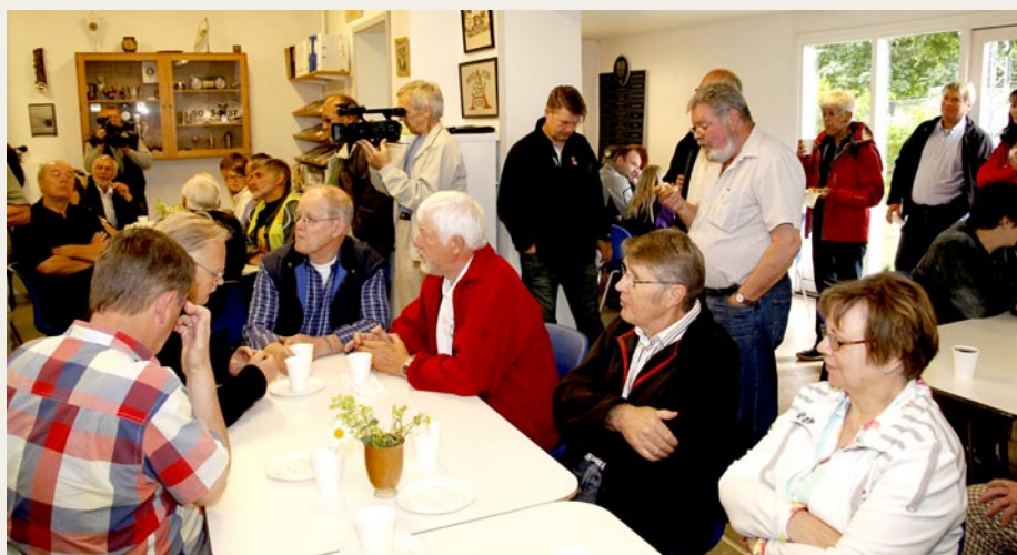
Medlemmer og gæster, som havde taget imod invitationen til morgenkaffe og rundstykker lytter til Formandens velkomst.