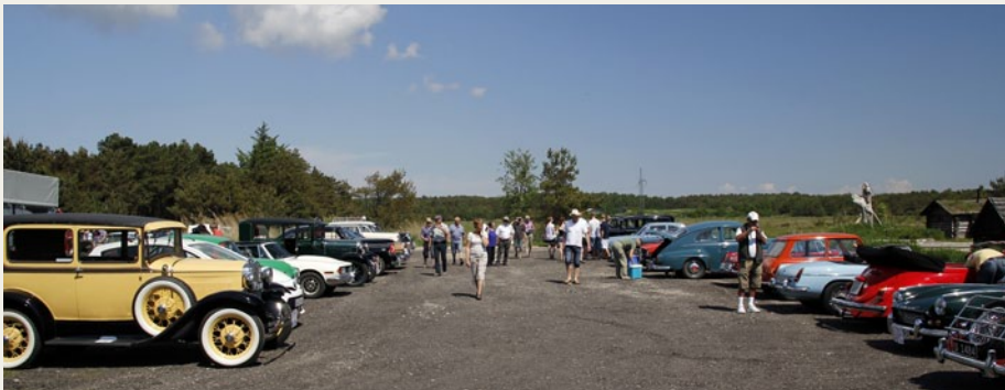
De mange veterankøretøjer fyldte ganske godt på parkeringspladsen ved Saltsyderiet.