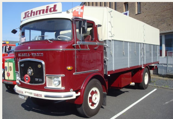
Claus', HC' og hele publikums favorit: En utrolig flot Scania-Vabis LV75.

Der var i år besøg fra Schweiz med 5 biler bl.a. den fine Saurer, som ses på billedet. Saurer i Schweiz har fabrikeret lastbiler, busser og militærkøretøjer siden 1903 og lastbilverkstedet blev i 1982 overtaget af Daimler-Benz. Læs selv historien om Saurer på Wikipedia.