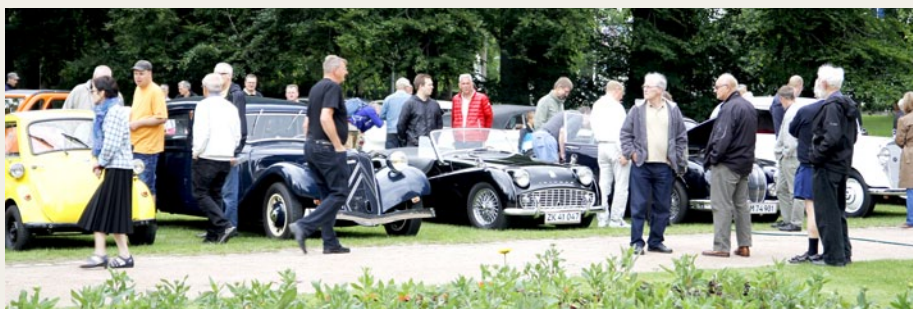
Forst på eftermiddagen var der faktisk ret mange mennesker, som kiggede interesseret på vores gamle køretøjer i Kildeparken.