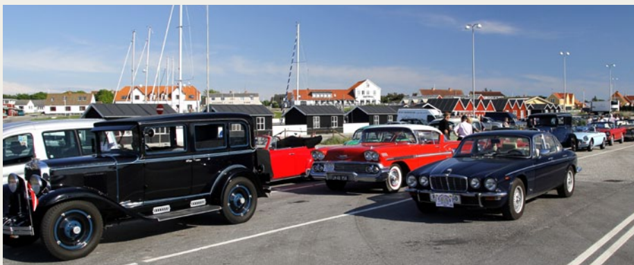
På Vesterø Havn var der veterankøretøjer i lange baner.