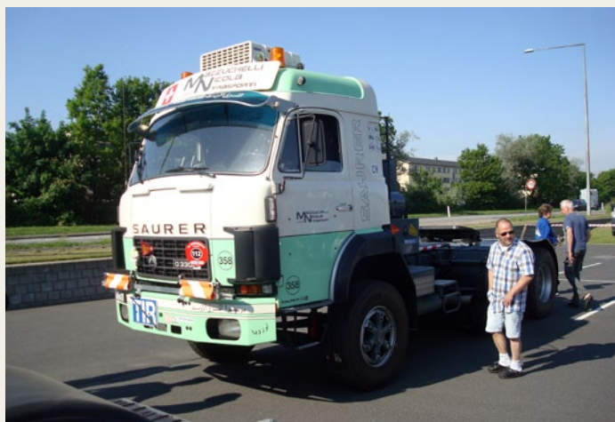
Denne fine Saurer er en af 5 deltagere fra Schweiz.