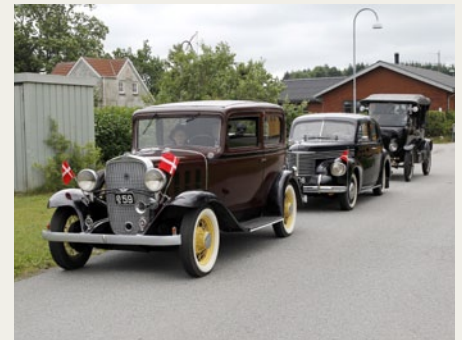
Her er tre af de 7 - 8 biler, som samledes i Voldsted for efterfølgende at bliver filmet af GVD TV.

Efter tredje runde skulle vi igen følge kørselsvejledningen, som bestod af et oversigtskort og en vejledning udskrevet fra Google Maps med de fordele og ulemper,