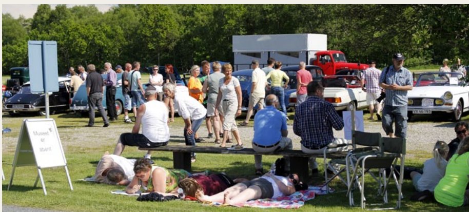
Ved Museumsgården blev der både studeret veterankøretøjer og råhygget.