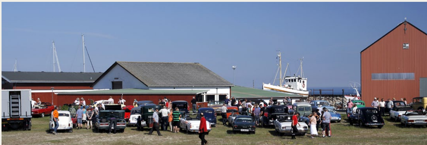
Mere end 40 veterankøretøjer er her samlet nær Østerby Havn.

Herefter går turen til Læsø Uldstue, hvor vi får en fyldestgørende historie fortalt om fåreavlen på Læsø og om Læsø Uldstue. Vi står på Uldstuen's gårdsplads, nogle af os i en bagende sol, andre er rykket i skygge langs murene og atter andre står i vognporten, hvor de står i vejen for svalerne! – der åbenbart har deres reder her! Efter den hyggelige fortælling er der mulighed for at komme indenfor og se og ikke mindst røre de mange fine ting, og efter den udførlige fortælling om Læsø ulddyners fortræffeligheder, så skal vi da i hvert fald lige røre dem – der er vist også nogle, der bruger nogle kroner her, mon