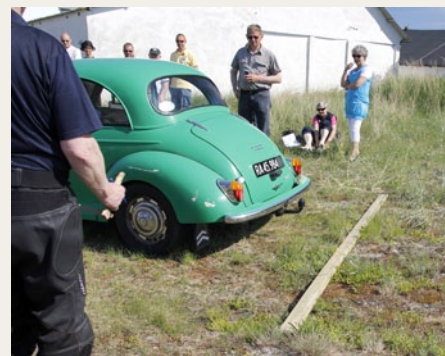
Morris'en kom ikke helt så tæt på det udlagte brædt som Laverda'en.

mod Frederikshavn i et passende tempo med Laverda'en lige efter Morris'en. Vi når frem i god tid.