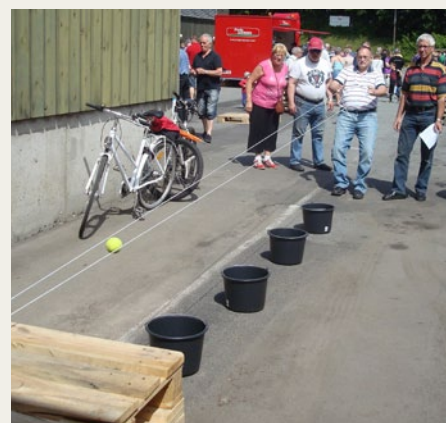
Det er så meningen at bolden skal ramme ned i spand nummer 5.

Efter en grillet pølse i Volvo'ens magerlige radio-central gik det sent hjemover,