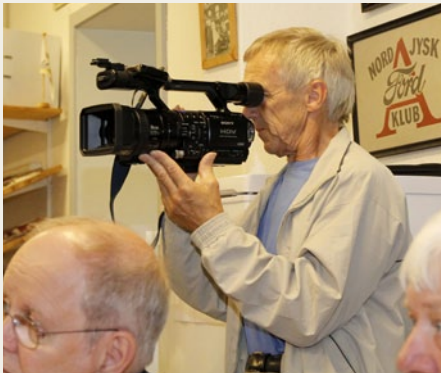
GDV TV filmede både i klubbhuset og på den efterfølgende køretur.

som listede rundt med nogle voldsomt store videokameraer, og en kraftig herre førte sig frem med mikrofon. Det viste sig at være et hold fra GVD TV Produktions-selskab, som forhåbentlig har fået lavet en god udsendelse om vores arrangement.