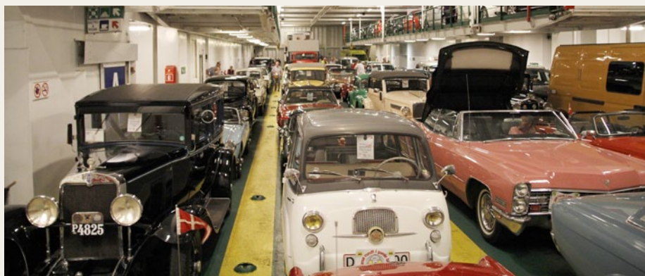
De mange veterankøretøjer fyldte ganske godt på Læsøfergen.