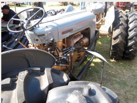
En meget stor grå Ferguson, sammenbygget af to „Guldfugle“

Der var rigtig mange traktorer, de fleste af dem var flottere end da de var nye. Men jeg faldt over den lille grå Ferguson. Som det fremgår af billedet, er den ikke så lille endda. Det var datidens store traktorer disse sammenbyggede modeller årgang 1956. Flot ser den ud. Disse to FE35 var en jubilæumsmodel, også kaldes for Guldfugl.