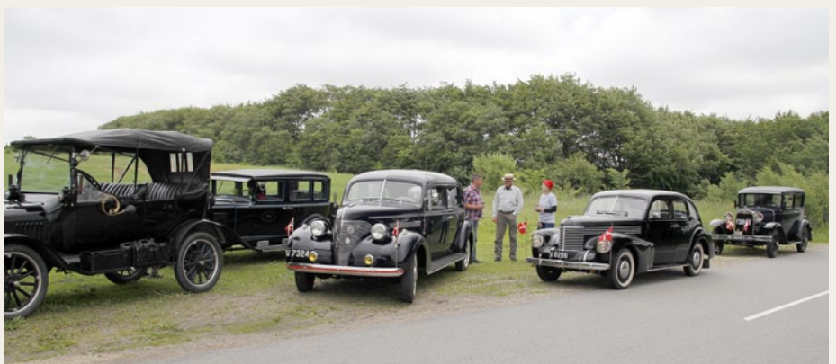
På Hæsumvej, lige vest for Støvring, holdt vi en kort pause, hvor vi blandt andet snakkede om vore køretøjs historie og oprindelse.