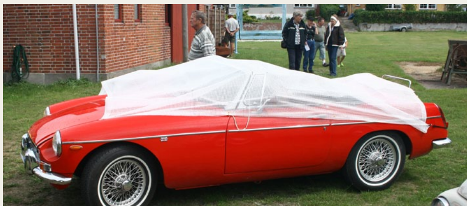
Hardings røde MGB med den klare presenning, som også kom i anvendelse ude midt i Lille Vildmose.