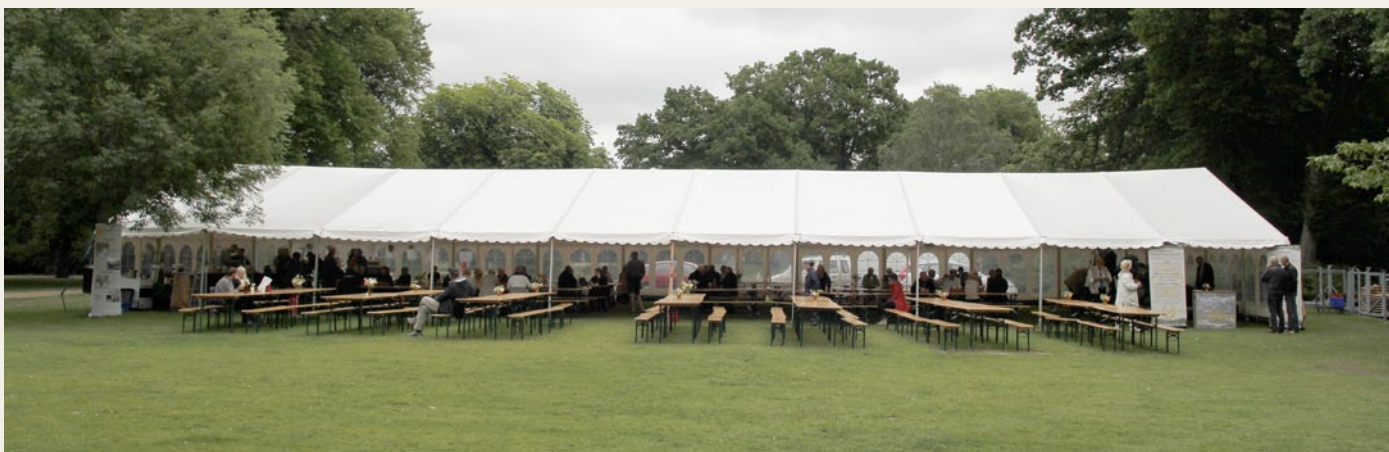
Det var ikke siddepladser, der manglede ved det store telt - snarere noget publikum.