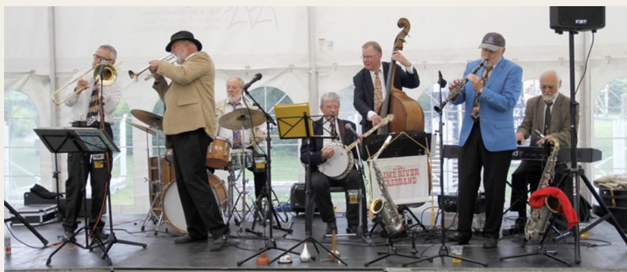
Den fik ikke for lidt, da Limeriver Jazzband gav den gas på scenen i det store telt.

Omkring klokken halv fem begyndte der at regne mere vedholdende, og både gæster og de udstillede biler begyndte ret hurtigt at forsvinde. Klokken fem var regnen heldigvis stilnet så meget af, at vi kunne begynde at pakke de udendørs borde sammen uden at blive alt for våde.