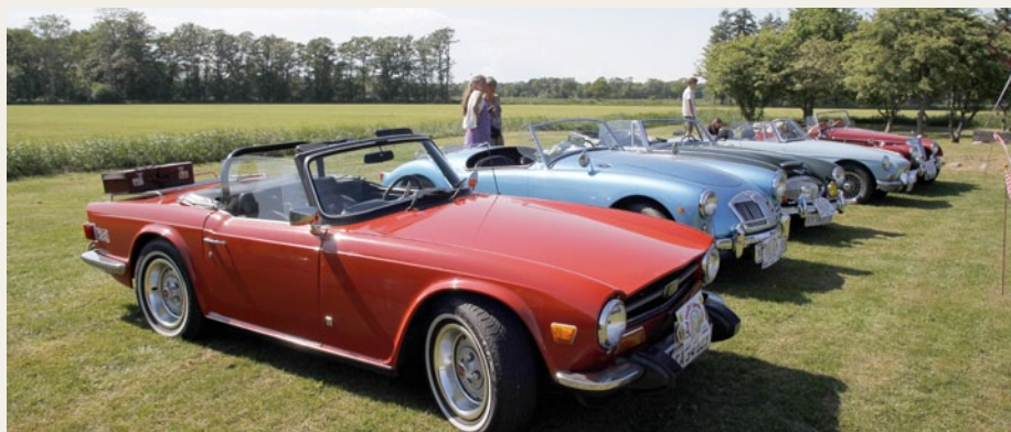
Hardings Triumph TR6 flankerer en række engelske sportsvogne ved Museumsgården på Læso.