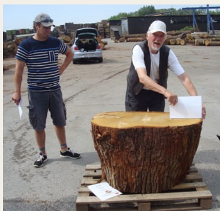
HC forsøger at beregne omkredsen af denne træstub.

De praktiske prøver som at finde omkredsen af en træstub, at køre en tennisbold hen ad to snøre og ramme spand nr. 5 samt at spille kæmpe Mikado gik meget