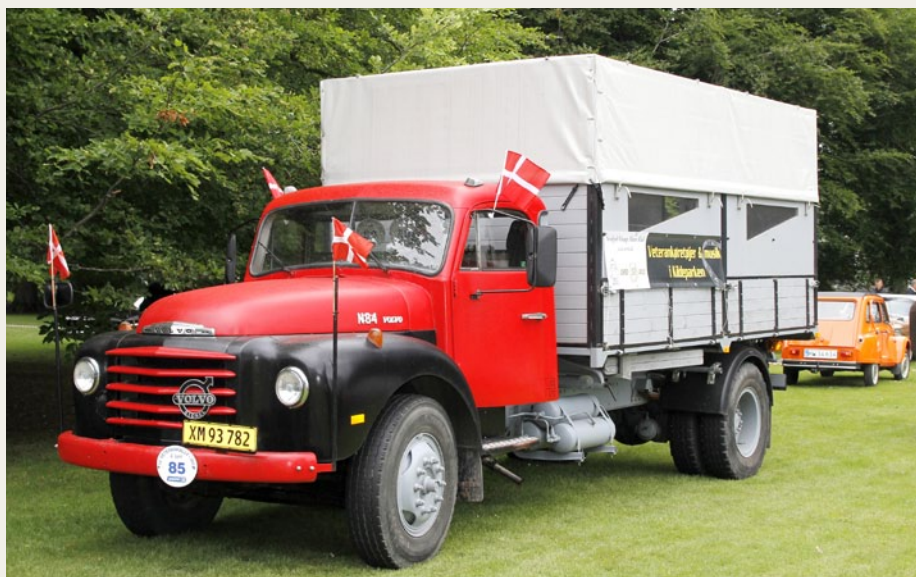
I dagens anledning var Bamsebilen pyntet med flag og bannere, og den kørte flere propagandaturer rundt i Aalborg og omegn.

Senere lørdag aften fik jeg lejlighed til at snakke med nogle af dem, der solgte øl ved havnen. Også her beklagede man sig over, at publikum var en alt for let overskuelig mængde. Jeg var på Nørresundby Torv på propagandatur med Bamsebilen omkring kl. 14.30. Her var der stort set mennesketomt. Alt dette, plus et par andre detaljer, har fået mig til at konkludere, at der var mange mennesker der kunne have fået en hyggelig dag i Kilden - de