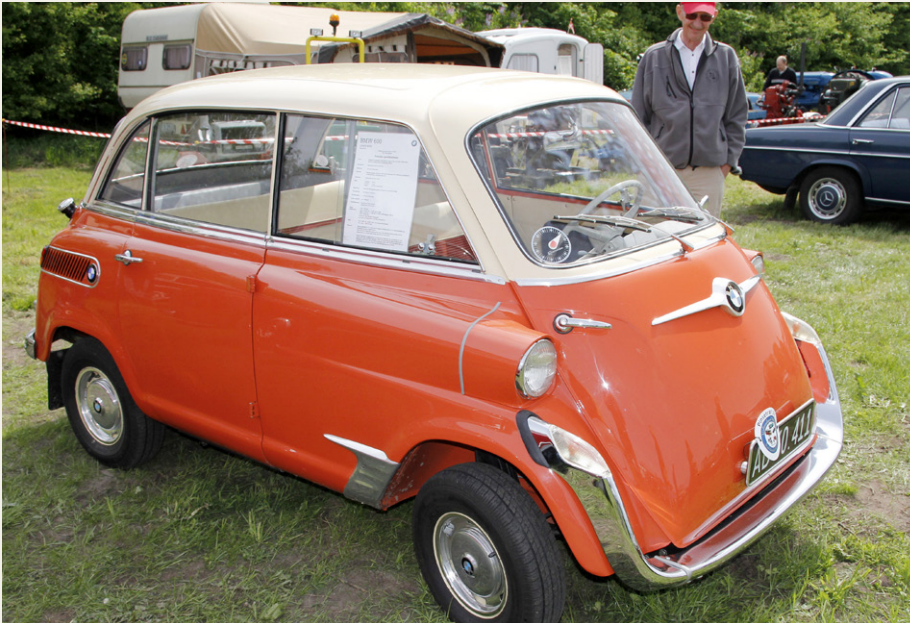
En BMW 600 er ikke bygget som de fleste to-dørs modeller. Én dør til forsædet og én dør til bagsædet; det finder du vist ikke ret mange andre steder.

baghjulene, med bedre køreegenskaber til følge, og dels er blevet plads til et bagsæde. Adgangen til bagsædet sker gennem en enkelt bagdør i højre side. Dem er der ikke mange af.