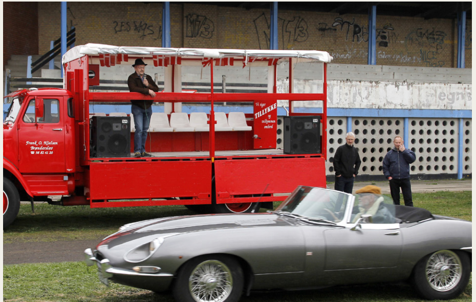
Undertegnede på slap line med mikrofon i hånden. Bilen i forgrunden er en Jaguar E-Type Series 1 1/2 fra 1968

skulle køre en runde på cindersbanen, og de havde i deres visdom besluttet, at undertegnede skulle fortælle om de fremmødte biler. Protester blev ikke accepteret, så jeg startede den gamle Opel og kørte forrest på godt en omgang, inden jeg stoppede ved tribunen, hvor jeg blev udstyret med en mikrofon. Jeg havde lige nået at notere et par stikord og låne nogle af kortene på bilerne, så jeg stod ikke helt på bar bund, da jeg skulle fortælle om bilerne.