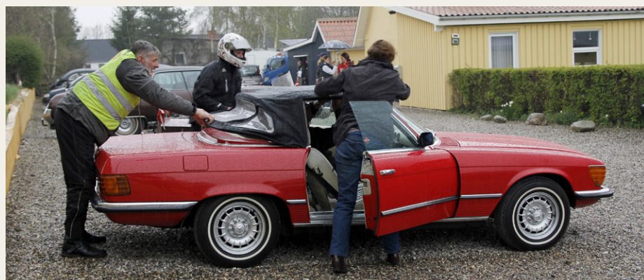
Når man ikke kan lide at få våde sæder, er det godt, at der er hjælp at hente, når kaleschen skal overtales til lukke tæt.