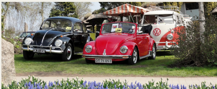
Der var også en hel koloni af Folkevogne.