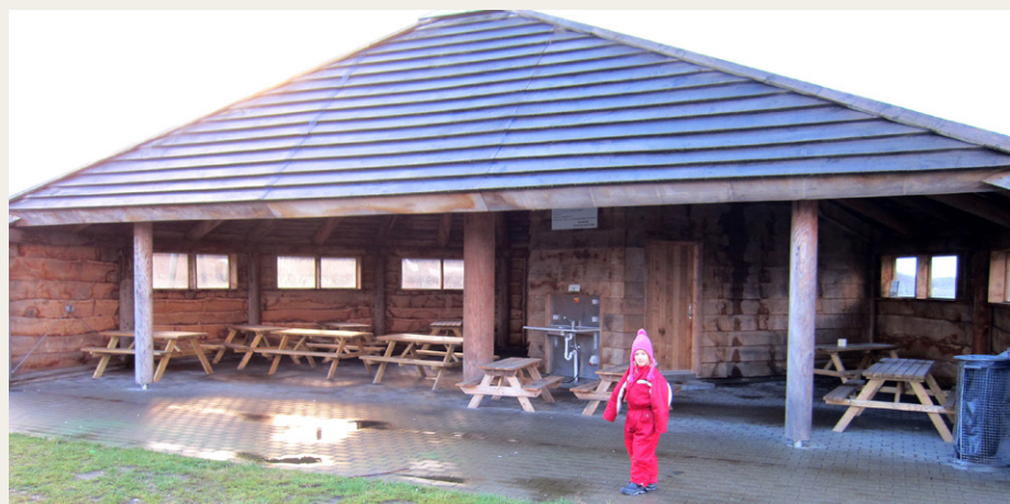
Madpakkehuset ved Jægerum Søpark.

I det mindste ser vi frem til en interessant og lærerig aften.