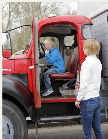
Man kan heldigvis ikke være for lille til at være bidt af en gal lastbil.