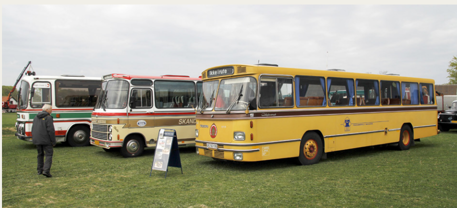
De tre fremmødte busser var fra Fårup Skovbus, Bushistorisk Selskab og NVMK