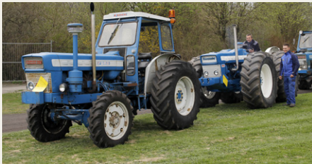
To meget sjældne firhjulstrukne Ford traktorer: Forrest en Roadless Ploughmaster 95 og bagved en County 954.

gamle Volvo bybus. Begge ture med HC bag rattet.