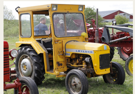
Det er ikke så tit, man ser en Leyland traktor.