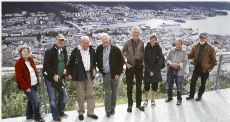
Det meste af selskabet leger turister i Bergen.

På den anden Norgestur, som fandt sted fra den 8. til den 14. august 2012 var