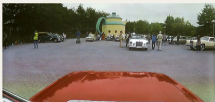
Ankomsten til Vestlandstreffet filmet fra toppen af en Triumph Stag.

Om lørdagen deltog alle i et lokalt veterobilarrangement, Vestlandstreffet ved Kongeparken, som var årsagen til, at turen skulle finde sted på netop dette tidspunkt. Et meget vellykket arrangement med hele 76 biler til start. På køreturen var der ind-