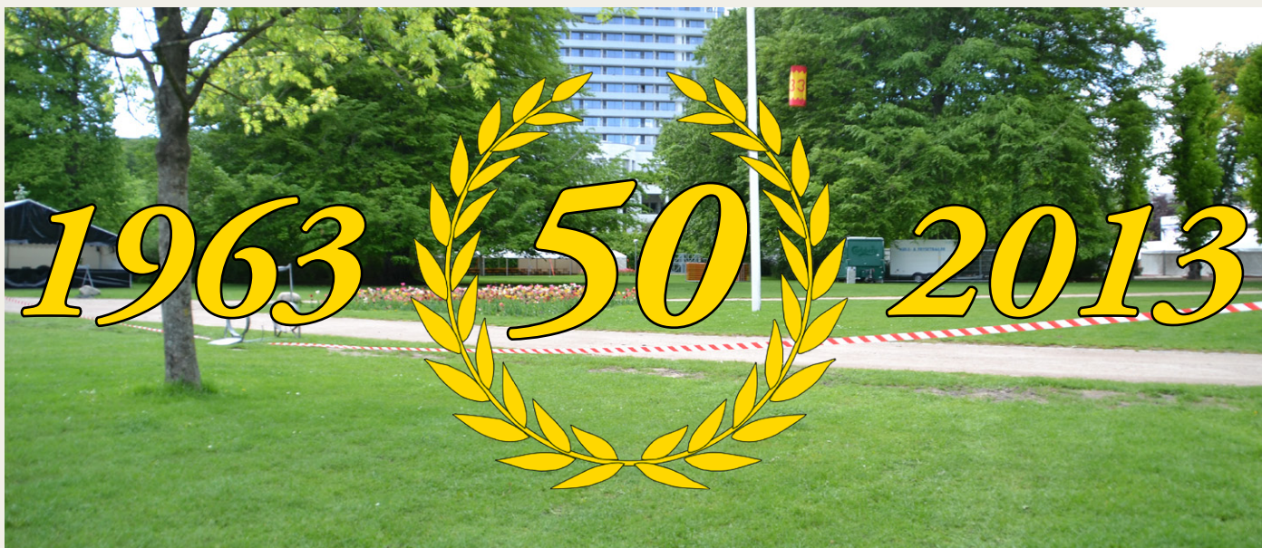
Kildeparken i Aalborg en kolig forårsdag i 2013. Her er stort set ikke et menneske. Den 22. juni vil her være fyldt med veterankøretøjer og glade mennesker.