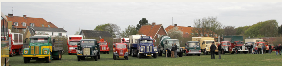
Et udsnit af de fremmødte lastbiler. En dejlig blanding af store og små, af nyere og ældre og af meget originale og meget restaurerede lastbiler.