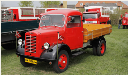
Min favorit blandt lastbilerne var denne lille, meget flotte Borgward fra 1949.