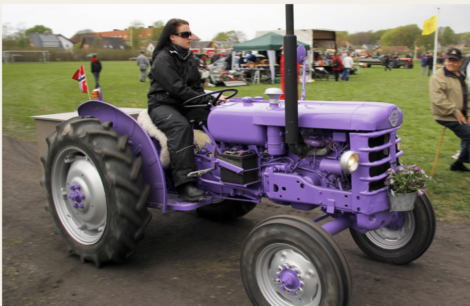
Det var ikke ligefrem originalitet, der prægede de norske gæsters køretøjer, men fint ser det da ud med en lilla Volvo traktor med blomster på fronten, og det kan ikke ikke undre, at føreren er meget kvindelig.

Lørdag den 11. maj var der overskyet fra morgenstunden, men det holdt dog tørt til over middag, men så kom der også flere byger resten af eftermiddagen. Der er nok ingen tvivl om, at vejrudsigten lagde en dæmper på deltagelsen, og om lørdagen var der fremmødt ca. 30 lastbiler, hvoraf de tretten var mærket med "De Røde Veteranlastbiler". Der var tre busser inklusive NVMK's gamle bybus. Antallet af biler og motorcykler var lidt sværere at gøre op, da mange valgte at komme i/på deres gamle veterankøretøj, kigge på udstillingen og