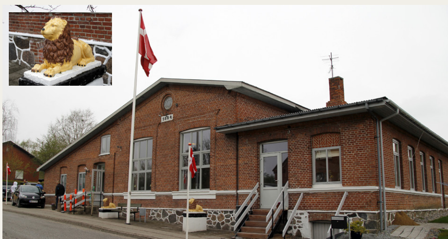
Kulturbust Veddum Sal af 1984, som dannede rammen om Veddumløbet 2013. Indsat et billede af en af de to løver, som er Veddum Sals vartegn.

Da startnumrene og løbsmaterialet blev delt ud, var jeg heldig – jeg fik nemlig vindernummeret.