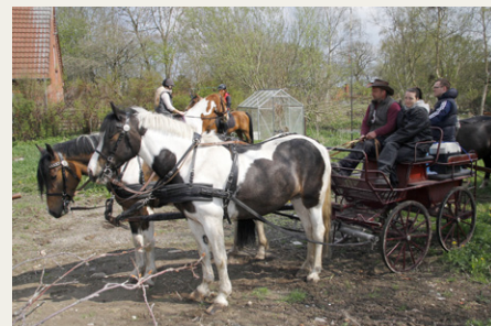
Sidst på dagen dukkede en flok bestetrunkne køretøjer op på pladsen over for Veddum Sal. Et spændende indslag.

Af sted mod næste og sidste Post 4. Så vidt jeg lige nåede at se stod der vist nok Tisted. Igen sled det stærkt på de små celler under de grå hårtotter. En seddel med ordsprog blev udleveret, men kun halvdelen af de gamle ordsprog var skrevet på, resten måtte vi selv notere. Igen kom kuglepennen til god hjælp. En af opgaverne lød „Hvad man ikke ved“ - er det en form for alvidenhed? Nå, spørg til side,