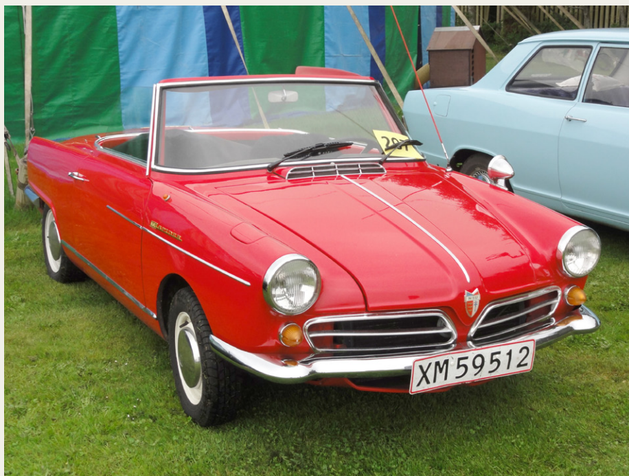
Den sødeste lille NSU Spider med Wankelmotor årgang 1965