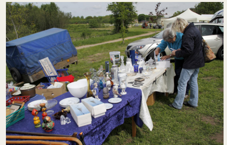
Man kunne købe andet end reservedele.