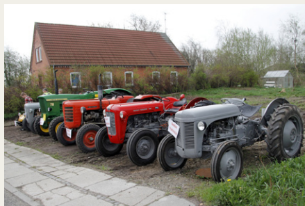
I Veddum har man også en traktorklub, som i dagens anledning havde fundet nogle af klenodierne frem.

Herfra gik turen videre mod Als Odde, hvor post 2 var klar. Og uha da, det krævede dyb koncentration. Det var tryllerlinge / nøgler, som skulle løses, dvs. skilles ad eller samles. En god undskyldning for lidt ekstra grå hår. Da opgaven var løst, var det ellers af sted i højt gear - skulle jo følge Roveren. (Sikkert en bil der kan anbefales til travle forretningsmennesker). Så vidt jeg lige nåede at se, kørte vi også her ad en smuk rute til Helberskov, Havnø, Visborg og til Glerup hvor post 3 var placeret ved Fælleshuset. Udfordringen var at tipse 13 spørgsmål om Veddum Kulturhus rigtigt,