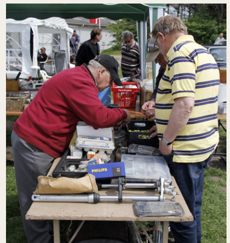
Så fik Aks Torp vist solgt en eller anden dims.