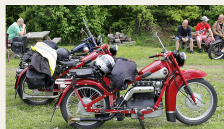
Blandt de mange fine motorcykler, som havde fundet vejen til Hjallerup, var disse tre Nimbus'er.