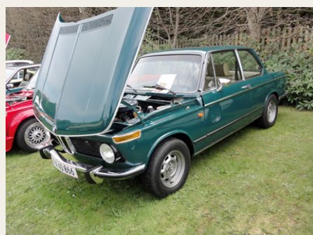
1974 BMW 2002 med åben maskinrum og i totalrenoveret stand.