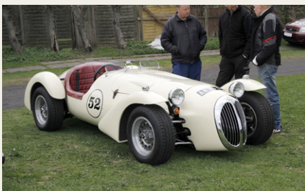
Denne Koenig er et meget sjældent dyr i den danske natur. Rørgitter chassis, glasfiber karrosseri og mekanik fra en 1970 Jaguar.

Hen på formiddagen var nogen kommet i tanke om, at personbilerne også