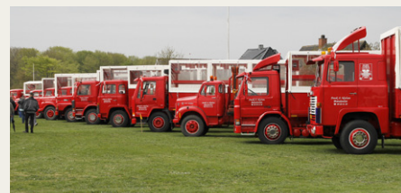
Hele karavanen af Røde Veteran Lastbiler var også linet op på Brønderslev Stadion.