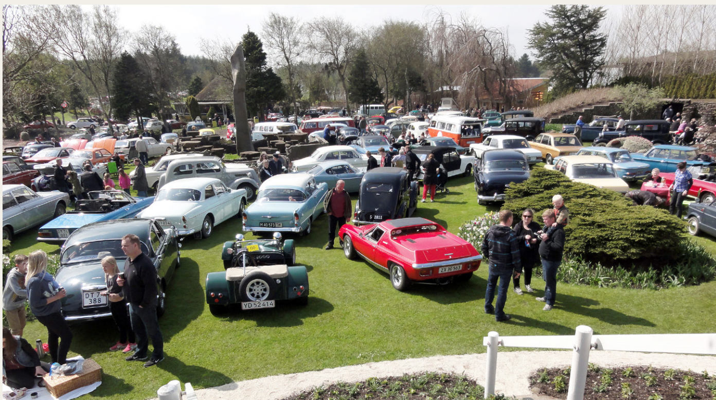
560 veteranbiler og 7017 gæster var spredt ud over Jesperhus Blomsterpark på åbningsdagen.

Dette års to største deltagergrupper vurderede jeg at være diverse amerikanerbiler samt diverse udgaver af folkevogne. Sidstnævnte mærke har vi formentlig næsten alle sammen en eller anden form for erindring om. Og om hvor mange der var plads til i bilen. Sikkerhedsdebatten lå ikke højest på dagsordenen i sin tid.