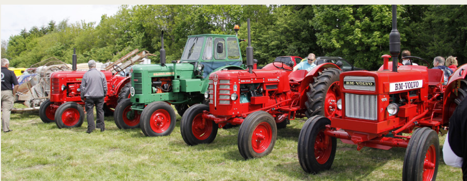
Der var masser af traktorer til stede. I denne række er der kun Volvo traktorer.