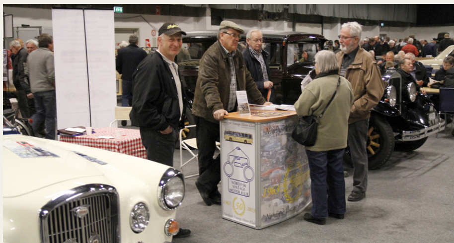
Gerner underholder et par interesserede gæster, mens Dan morer sig over et eller andet.