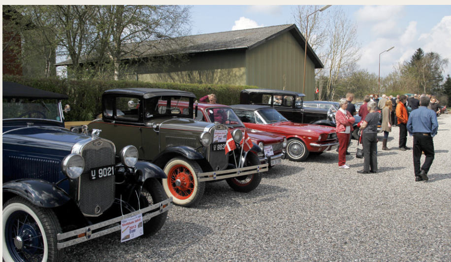
Der var både masser af spændende køretøjer og mange mennesker på parkeringspladsen ved Veddum Sal på denne Kristi Himmelfartsdag.