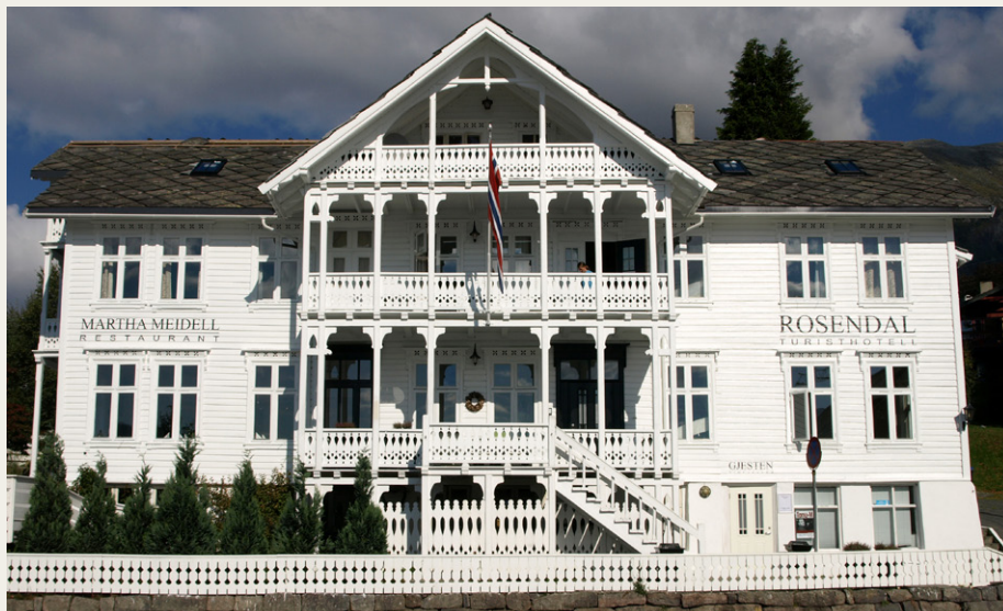
Den anden overnatning fandt sted på det idylliske Rosendal Turisthotell.