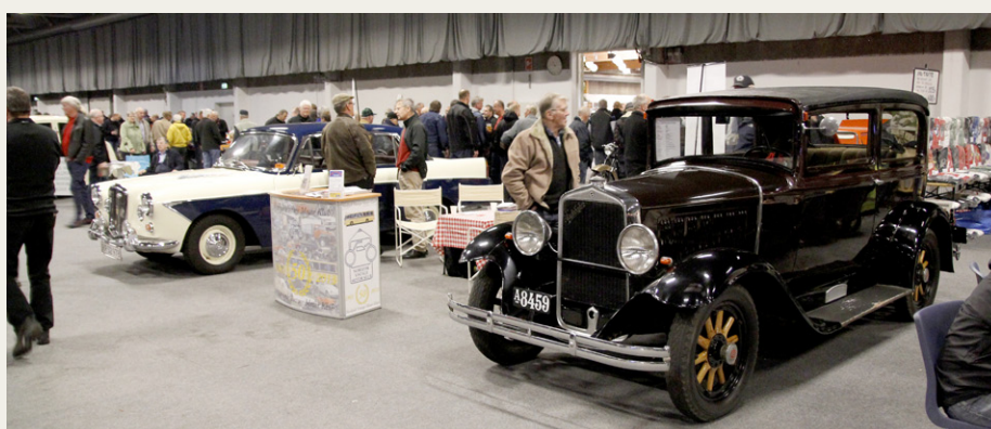
På Nordjysk Vintage Motor Klubs stand kunne man også se Gerners Wolseley og Dans Studebaker. Imellem de to biler ses klubbens nye messedisk.