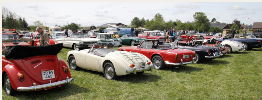
Et skønt syn ud over en masse veteranbiler. En stor del af sportsvognene i billedet er en del af den norske delegation, som benyttede det gode vejr til at besøge Hjallerup.

Forfra ligner den en Isetta med døren placeret i fronten, men bagenden er trukket både længere og bredere, så der dels er blevet næsten normal afstand mellem