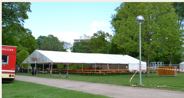
Dette telt er stillet op i Kildeparken i anledning af karnevallet i Aalborg. Lørdag den 22. juni vil det store madtelt stå på den samme plads.

Efter morgenkaffen skal vi ud og køre. Afhængigt af hvor mange gæster der skal med på formiddagens promenadekørsel, har vi seks ruter på ca. 60 km hver. De tre ture er nordenfjords og de sidste tre er - pudsigt nok - søndenfjords. Turene kan bringe ekvipagerne omkring bl.a. Tylstrup, Vødskov, Vestbjerg, Vadum, Gandrup, Nibe, Svenstrup, Ooppelstrup, Storvorde, Støvring og Ferslev. Alle turene vil enten