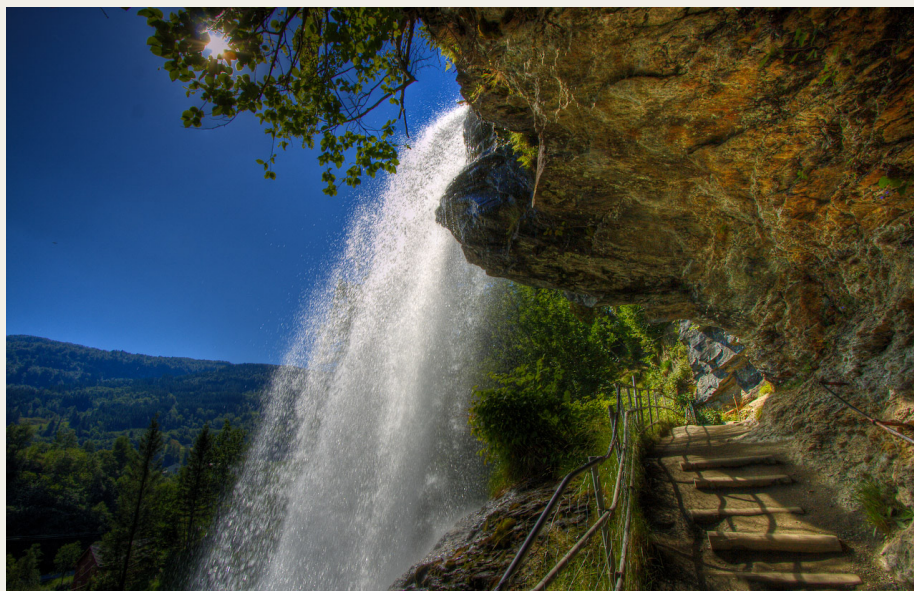
Steinsdalsfossen udmærkede sig ved, at man kunne gå inde bag ved vandfaldet. Billedet er venligst udlånt fra internettet.