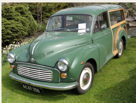
Morris 1000 Traveller fra 1967.