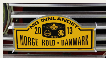
De norske gæster kørte rundt med dette skilt på fronten. Det tyder på en velorganiseret tur.

Og det var ikke kun de lokale, der havde fundet vej til Hjallerup. Der var også en delegation på godt en halv snes norsk indregistrerede MG, Morgan, Triumph og Jaguar, som havde fundet vej til Vendsyssel på denne tidlige sommerdag. Skilte på bilerne indikerede, at de var på en fem-seks dages tur her i landet.