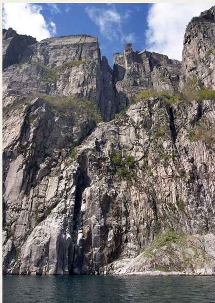
Preikestolen set fra færgen på Lysefjorden.