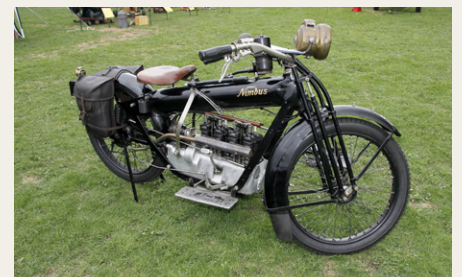
Jeg havde heldigvis talt med ejeren af denne flotte Nimbus fra 1922, inden jeg skulle fortælle om den fra scenen.