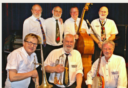
Limeriver Jazzband sørger for underholdningen