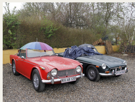
Kalescher findes i mange varianter.

Mens vi går ud og gør klar til start, opdager vi at nogen bliver kede af det, hvis deres køretøjer bliver støvede på grusvejene. Det er vel derfor, der pludselig bliver åbnet for den store bruser ovenfra. Andre – i åbne vogne - er træt af våde sæder, og får pludselig travlt med at undersøge hvordan kalechen egentlig skal monteres. Mon alle dem, der nu sad dejligt komfort-