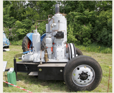
En stor 45 hk Hundested motor fra 1957.