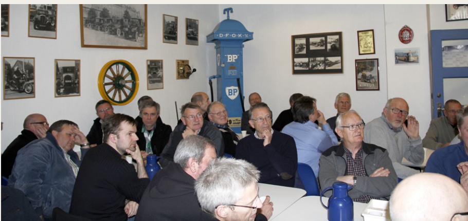
Et lille udsnit af de i alt ca. 45 interesserede tilhørere.

Har man behov for at lægge store lag af spartelmasse på, her taler vi om millimeter, er det bedre at anvende epoxy spartelmasse. Fordelen ved epoxy spartelmasse frem for polyester er, at den er langt mere fleksibel, men til gengæld er den langt vanskeligere at bearbejde efterfølgende. Thorben anbefalede, at man lige før epoxy spartelmassen sætter sig efter nogle timer, glitter overfladen med en gummiklods dyppet i sæbevand. Derved kan man fjerne de værste af de spor og forhøjninger, som man ikke kan undgå at lave, når man påfører spartelmassen. Og det er lige så vigtigt, at man sliber spartelmassen lige så snart, der er storknet nok til at det er