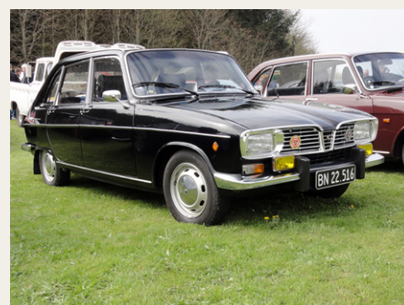
Renault 16 fra 1970, en af de få, som rusten ikke tog livet af.