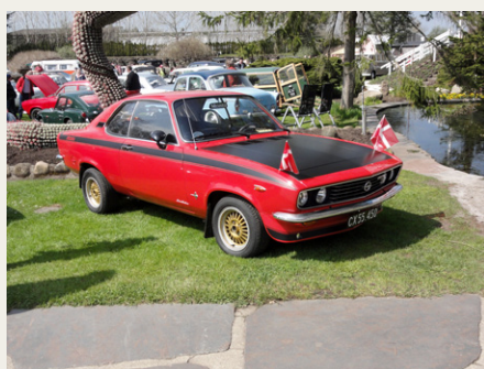
En rigtig flot Opel Manta fra 1973.