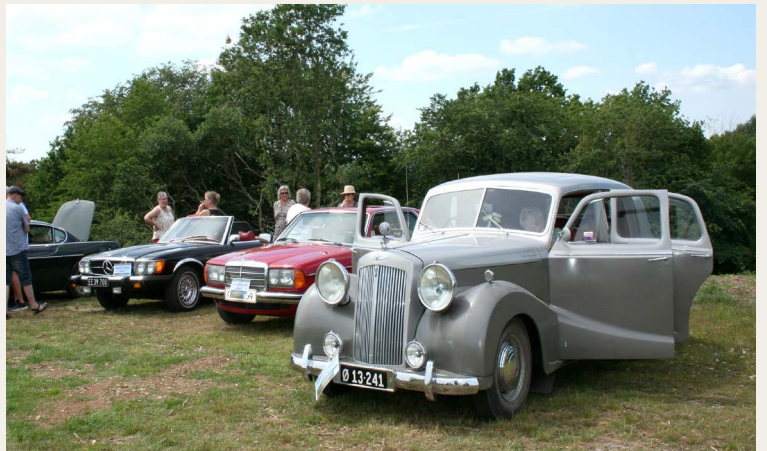
3. stop blev gjort på bakken over byen, hvor køretøjerne „slog ring“ ved og om den smukke vindmølle i Bælum.