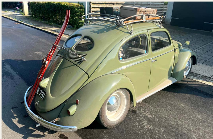
Så er den gamle "dame" fra 1951 med de 25 hk hjemme igen.