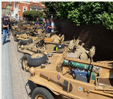
Udstillede VW type 166 - „Schwimmwagen“.