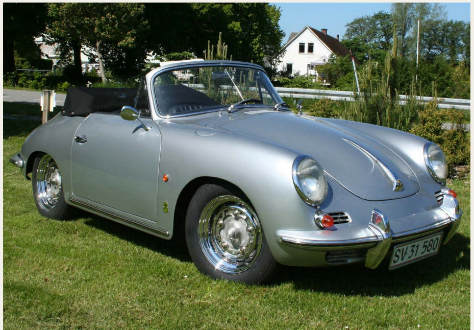
Den nævnte utroligt flotte 1963 Porsche 356 Cabriolet.