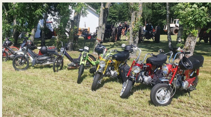
Også køretøjer som typisk lægger en „blå tåge“ efter sig, var på banen.