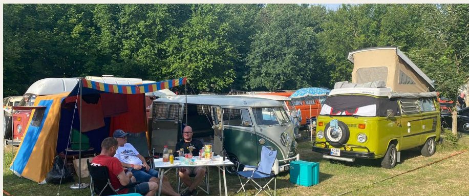
Ro, afslapning, hygge og socialt samvær på campen med ligesindede.