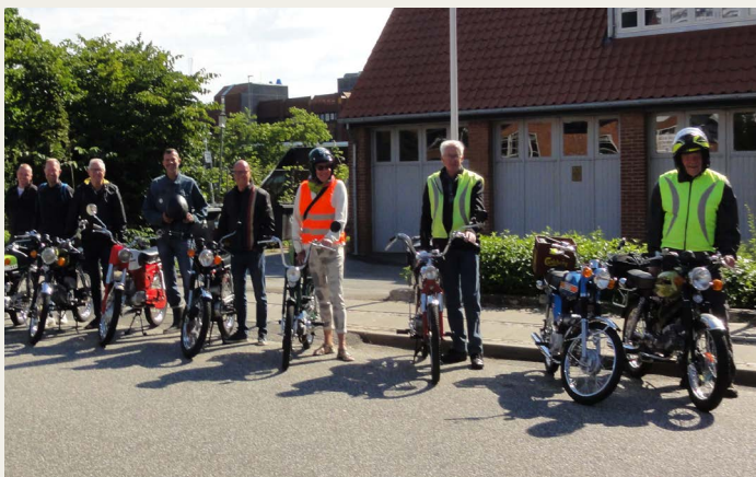
NVMK 50cc ved afgang fra Forchhammersvej 5