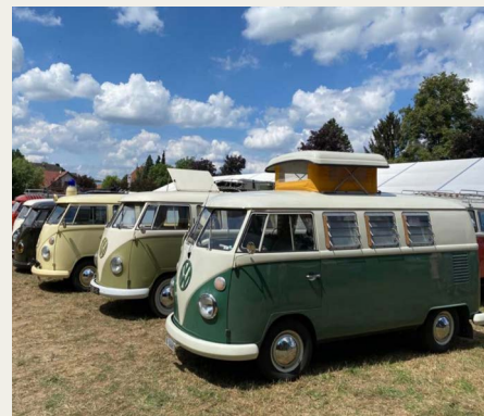
Udstillede VW type 2 - transportere/busser.