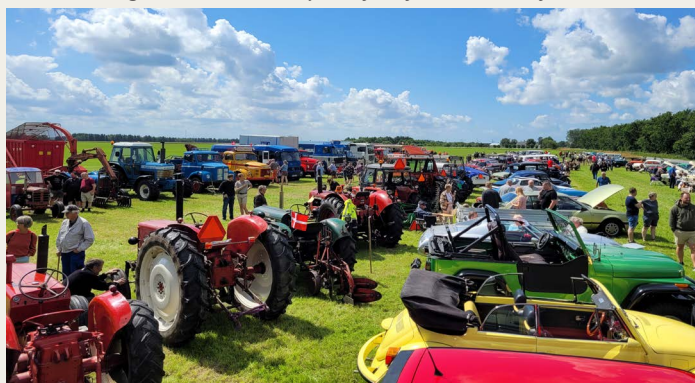
Engen var „alsidigt klædt“ med traktorer, personvogne, tunge køretøjer.