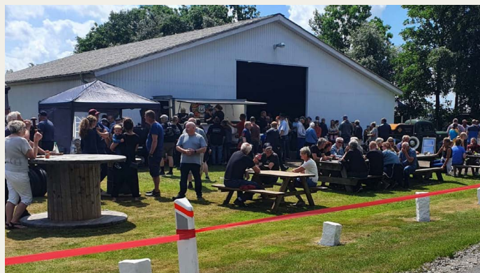
Til årets imponerende træf kom ca. 250 køretøjer og ca. 700 besøgende .