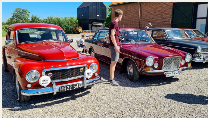
Det modsatte hjørne af pladsen var også samlingssted for en gruppe Volvo'er.