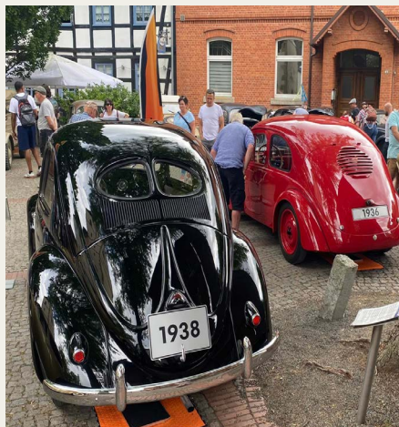
Fine prototyper/modeller - hhv. 1936 og 1938.

Kl. ca. 9 rullede vi fra pladsen ved Hessisch Oldendorf, og først stop var på en af de første motorvejs tankstationer, hvor der skulle tankes, og besøges et noget renere toilet end det på campen.