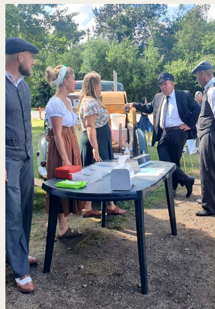
„Entreen“ er klar til dagens mange besøgende.