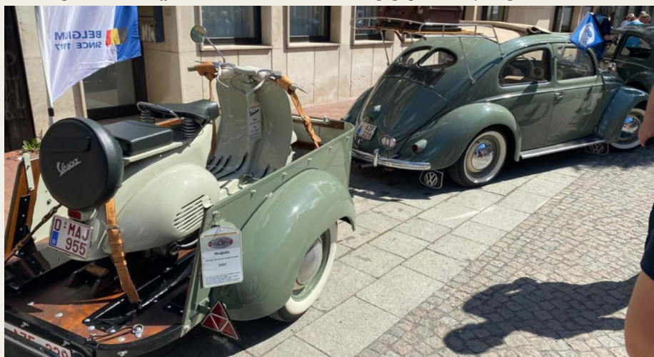
Klassisk VW, klassisk trailer og klassisk Vespa scooter, - flot „ekvipage“