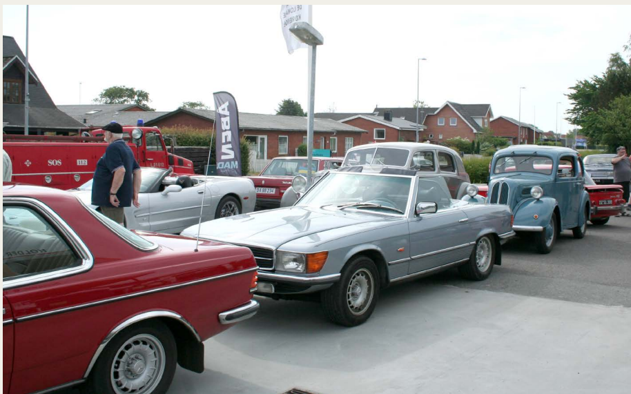
Pladsen var lidt mindre en vanligt, deltageres køretøjer fyldte godt på Go-on, det gik dog udmærket.