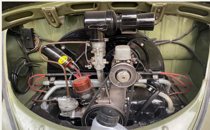
„Hun“ har med omkring 90 km/t tilbagelagt 1350km, og et benzinforbrug på omkring 12,5 km pr. liter, uden at slå en prut forkert, "I love it.