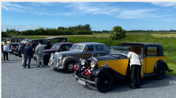
Line-up forud før start ved Ryaa-Is, Aabybro.