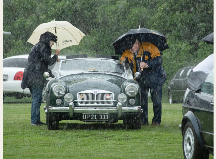
I en tordenbyge er det svært at gardere sig når man kører åben 1960 MG - A.