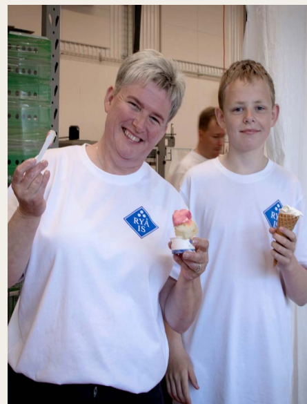
Glæde, søde smil og Ryaa is er god kombination.