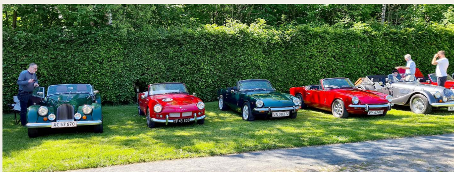
Et lille udsnit af de mange engelske biler, som var parkeret i begge sider af vejen hen mod slottet.