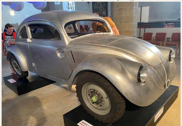
I byens kirke udstilledes en reproduceret prototype (Ifølge Kim - vw30) på en bund fra bil nummer 26 fra år 1936.