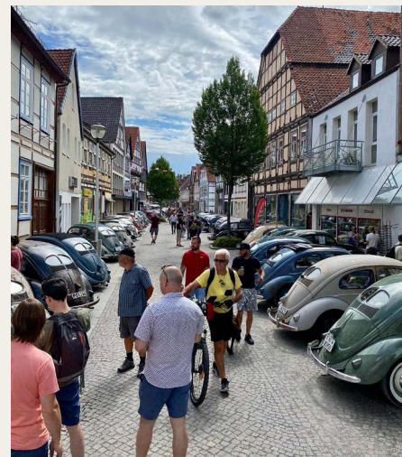
De mange VW'er vakte rigtig stor opsigt/interesse.