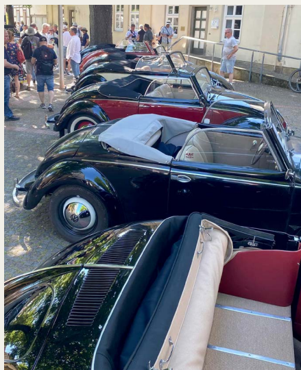
Udstillede VW type 1 - cabriolet.