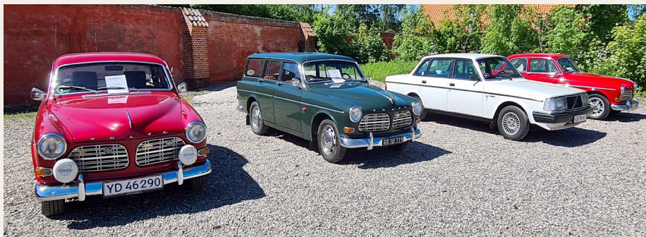
En lille gruppe Volvo'er havde samlet sig i det ene hjørne af pladsen.