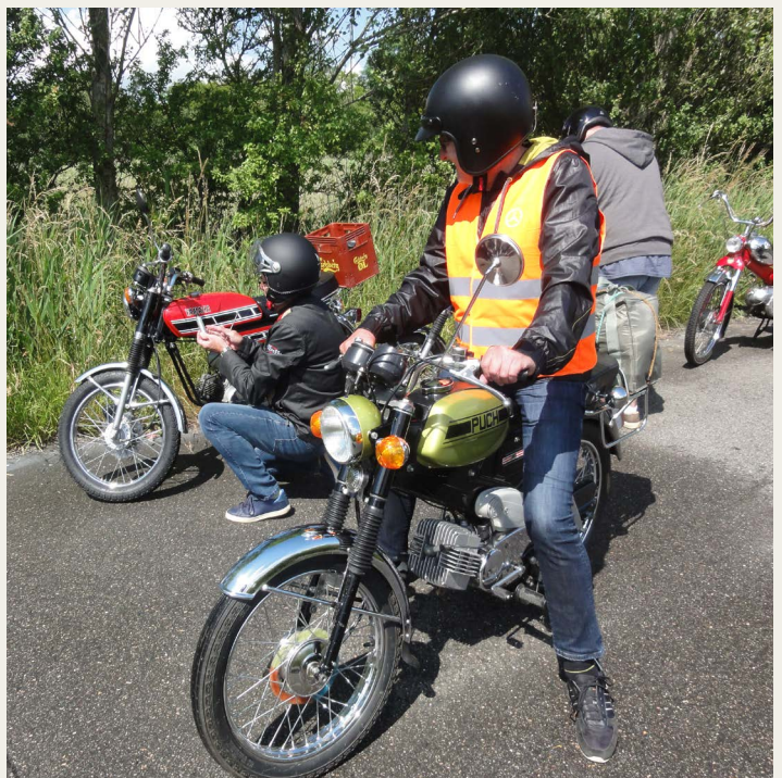
Pitstop ved Hvorupgaard. Puch-folket kan nøjes med at se på. (Red.: Man må da ikke mobbe?)