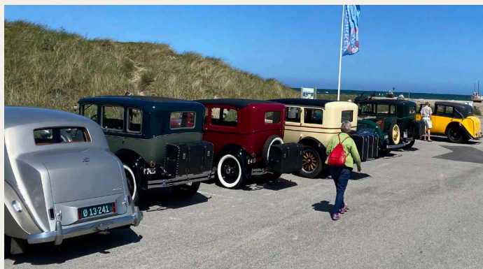
Rigtig flotte „bagpartier“ ved parkeringen på Slettestrand.