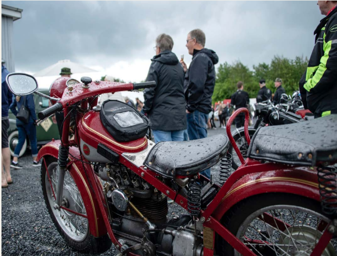
En fin Nimbus MC var at se blandt veterankøretøjerne.