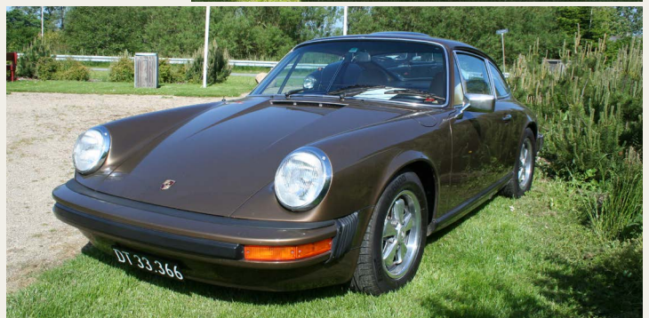
Gæst var tillige en rigtig fin veterantraktor International Harvester 434, en 1964 VW type 113, og Christian Ibsens 1974 Porsche 911 2.7 L