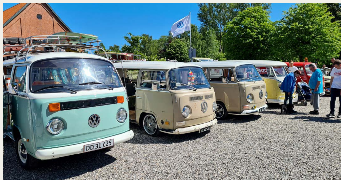
De fremmødte Folkevogne havde fået deres helt egen plads over for den store ridehal. Dette er kun et lille udsnit, som viser nogle af de fremmødte T2-ere.