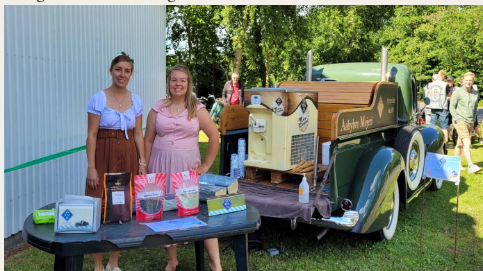
„Isholdet“ solgte over 500 lækre Ryaa softice fra Lindhardts flotte Ford isbil.