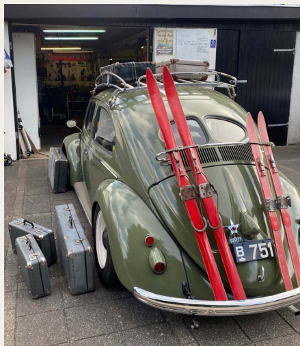
Pakket og klar til afgang fra Aalborg.