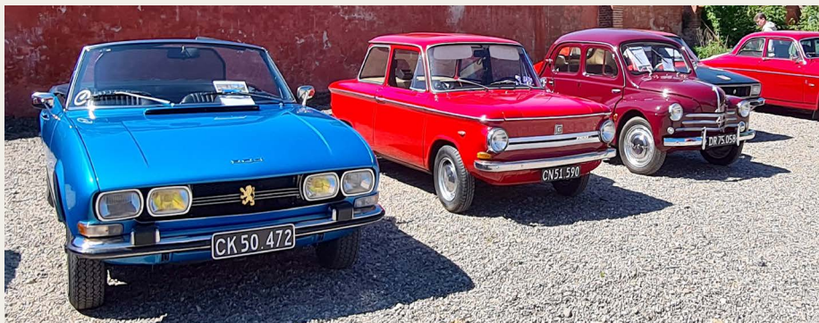
Ved ankomsten fandt vi plads ved siden af en lille tysker og et par andre franskmænd.