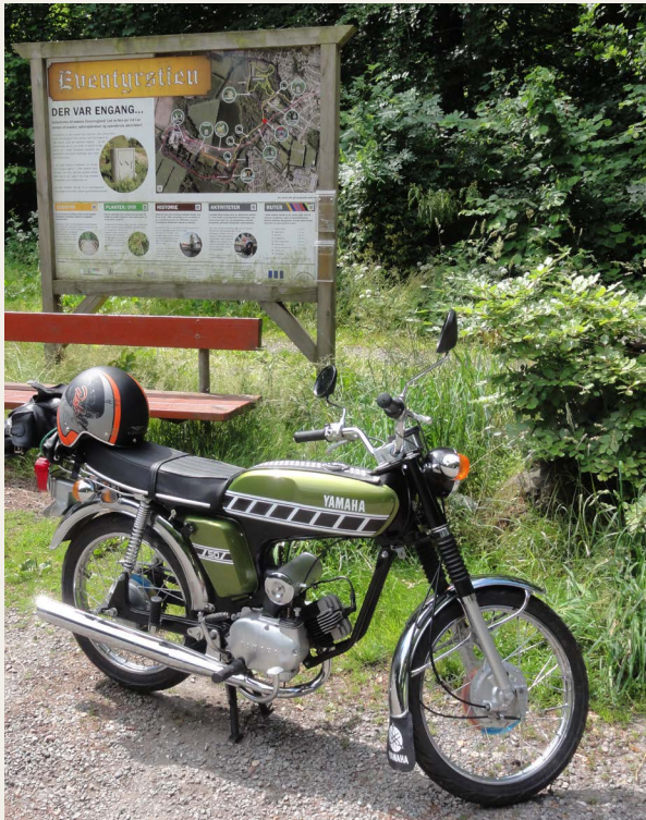
Rast for Yamaha og for tiltrængt frokost ved Skovkiosken, Dronninglund