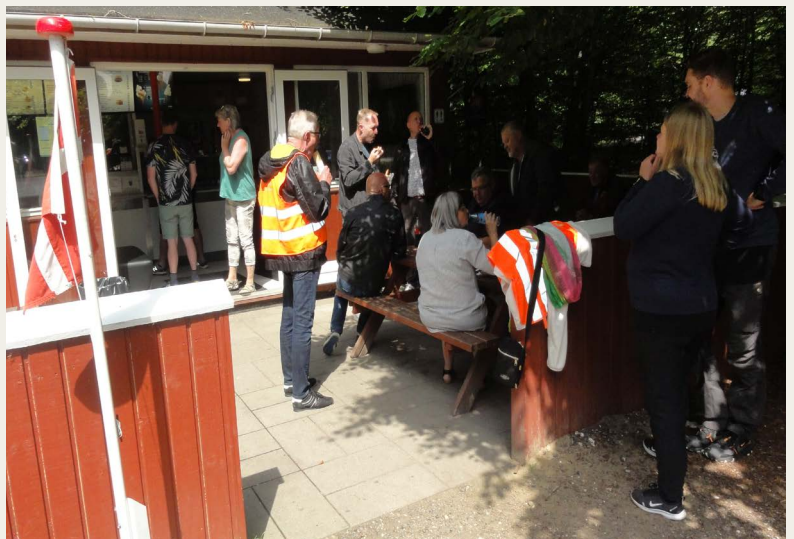
Frokostpause ved Skovkiosken, Dronninglund.