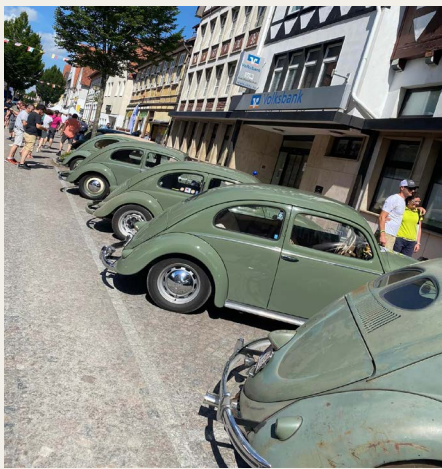
Gaden med udstillede „brezel vw'er“.

Lidt over kl. 9 rullede alle 850 biler ind i centrum og blev dirigeret ud, så alle "Briller" holdt sammen, alle Ovaler, Karmann Ghia, Split busser, Kubelwagen,