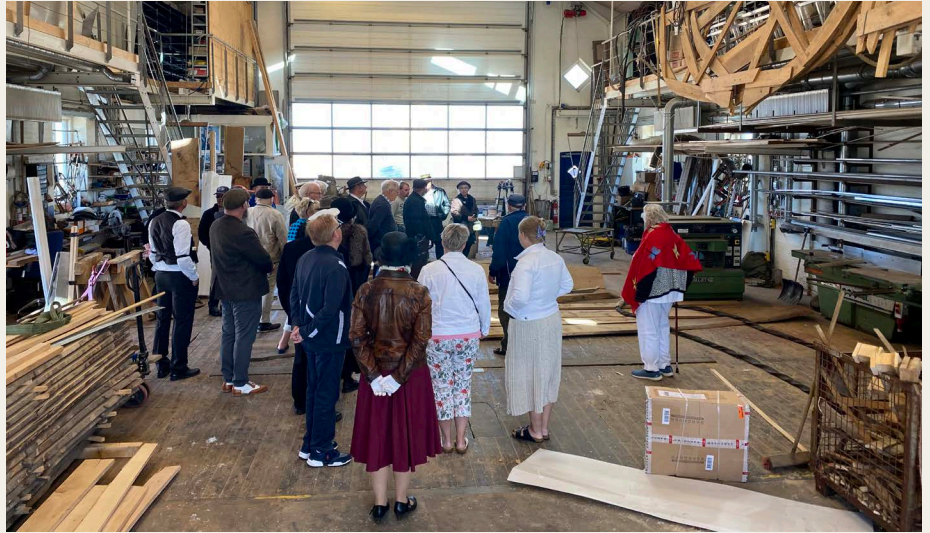
Ved Slettestrand blev deltagerne budt indenfor hos Slettestrand Værft.