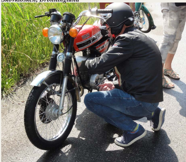
Lidt „motorudfordringer“ - pitstop ved Hvorupgaard.