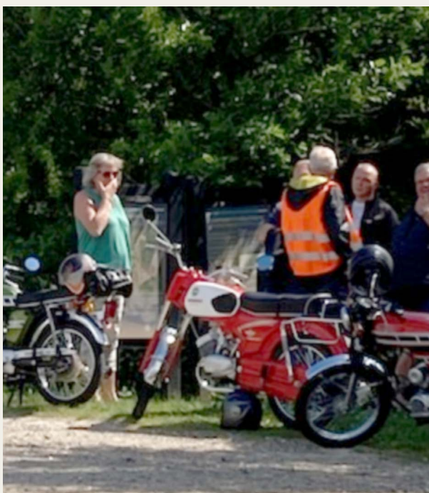
3 indtryk fra pit-stop ved Teglværksøerne, Gandrup, det må man da betegne som „knallert-miljø“