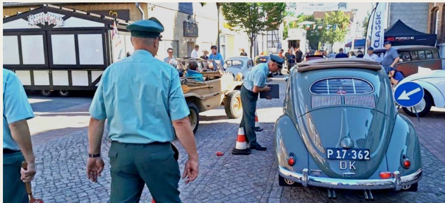
„Ordnung muss sein“ - officials viser de 850 VW'er til de rigtige pladser i byens gader.