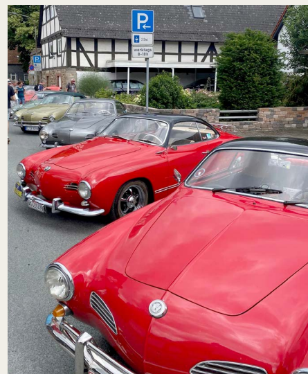
Udstillede Karmann Ghia Type 14 - cabriolet.