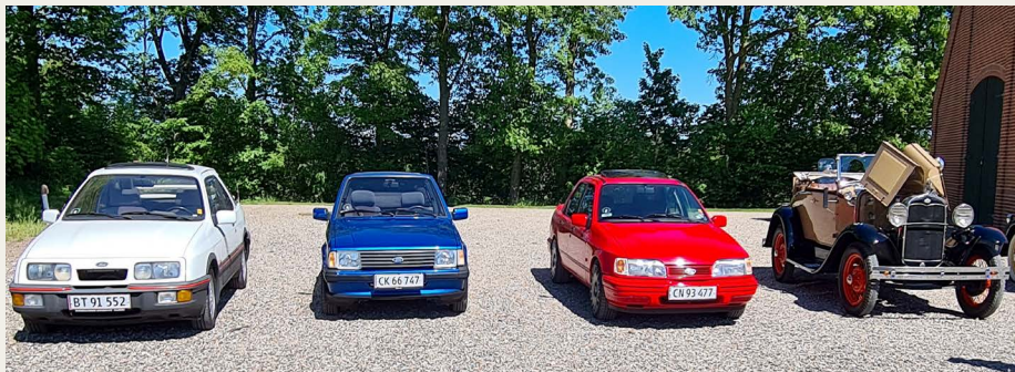
En lille samling tyske og amerikanske Ford-vogne på pladsen vest for den store ridehal.