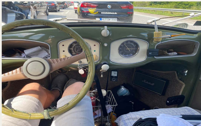
Indtryk af „førerkabinen“ i Kims 1951 VW.