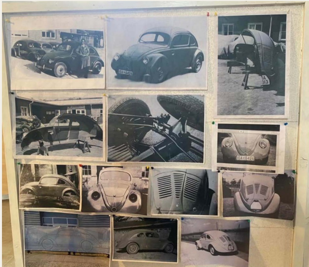
Planche fra Grundmann museet.