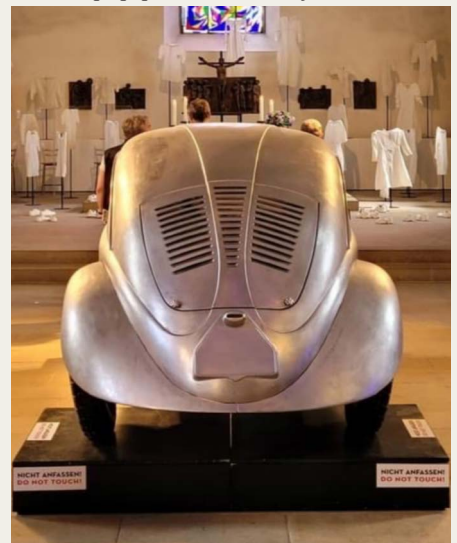
Reproduceret 1936 prototype.