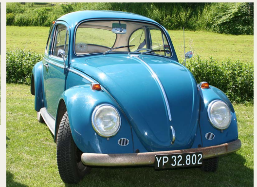
Gæstende køretøjer - varierende fabrikat, årgang og størrelse.