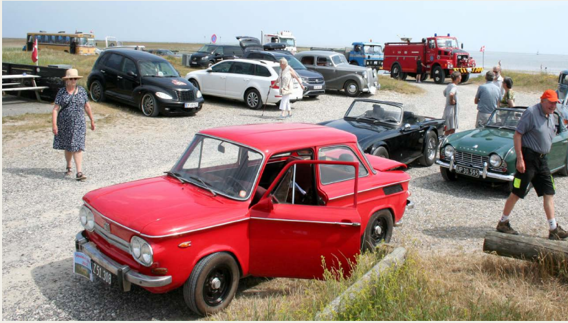
2. stop var Als Odde ved kanten af Mariager Fjord - „Danmarks smukkeste fjord“.