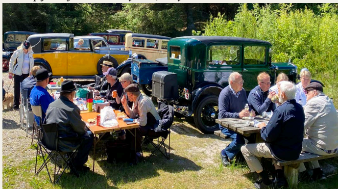
Deltagerne nød det fine vejr, den flotte natur og picnice'en ved Slette å.