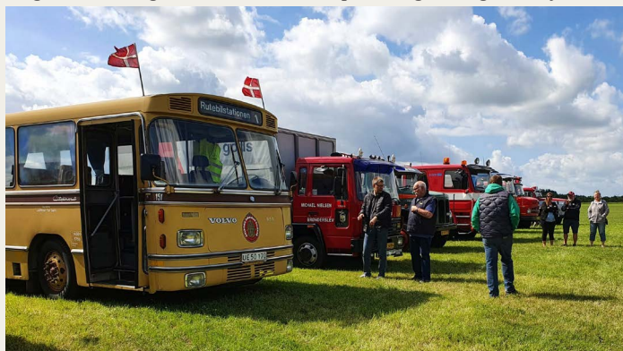
I fronten af de tunge vogne kunne man NVMKs 1970 Volvo B58 cityliner bus.