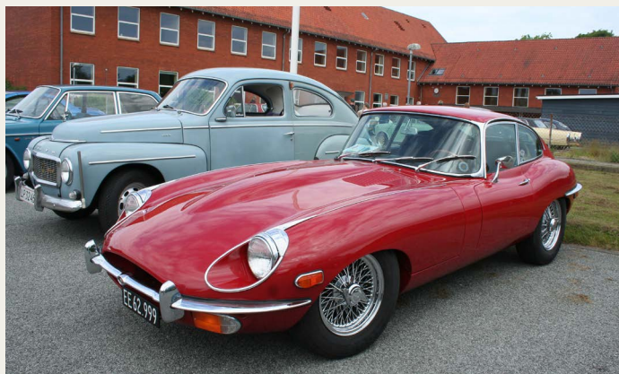
Morgenkaffen blev indtaget hos MVVK - her gæsternes biler parkeret ved MVVK's fine klubbygninger i V. Hjermitzlev