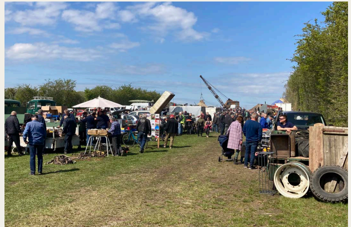
Nogle af de udstillede knallerter og lastbiler på parkeringsarealet. Arealet med stumpemarked og i baggrunden Motorsamlingens PM1 gravemaskine i drift.