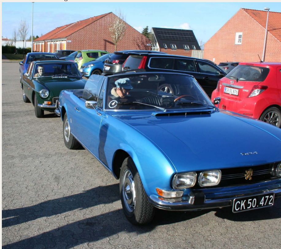
Så er vi næsten klar til afgang fra Støvring.