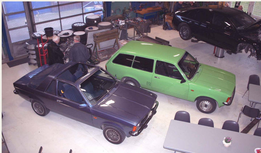
Der var fine rammer for besøget med borde/stole samt fast og flydende til gaden hos Ilbro Auto.