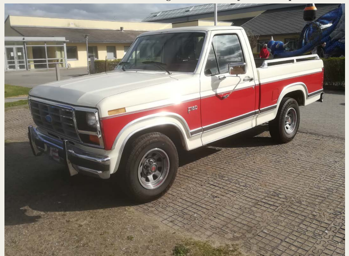
Endnu en „stærk arbejdsvogn“ en Ford F150 4.2L V8