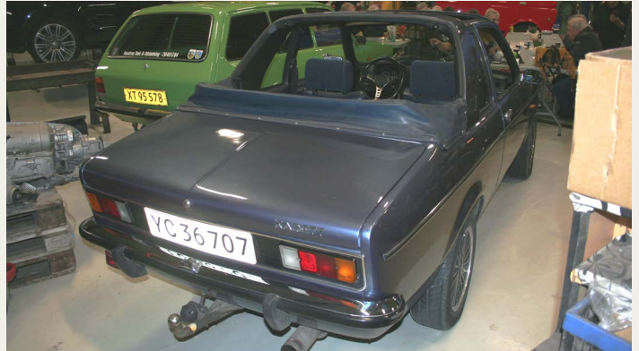
Opel Kadetts „special“, øverst som „pick-up truck“ - Sæhan årg. 1979, nederst en model Aero (cabriolet) 2.0 årg. 1978