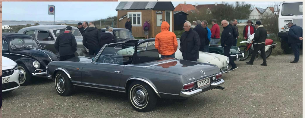
Afrunding af turen. Ved Guf & Kugler, havnen i Nibe, inden da var turen lagt forbi til et „friskt“ ophold ved fiskerlejet i Klitgaard.