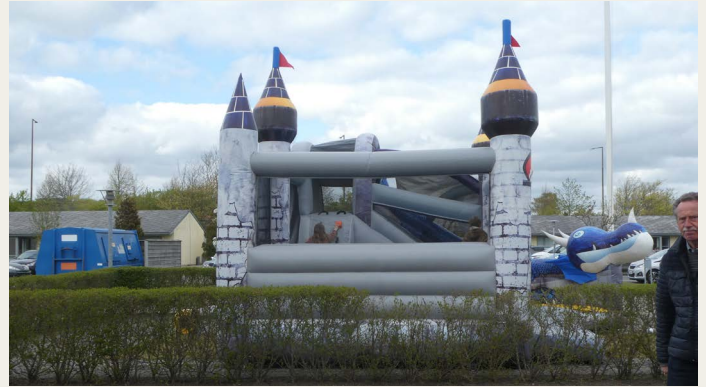
Der var opstillet hoppeborg til de yngre gæster.