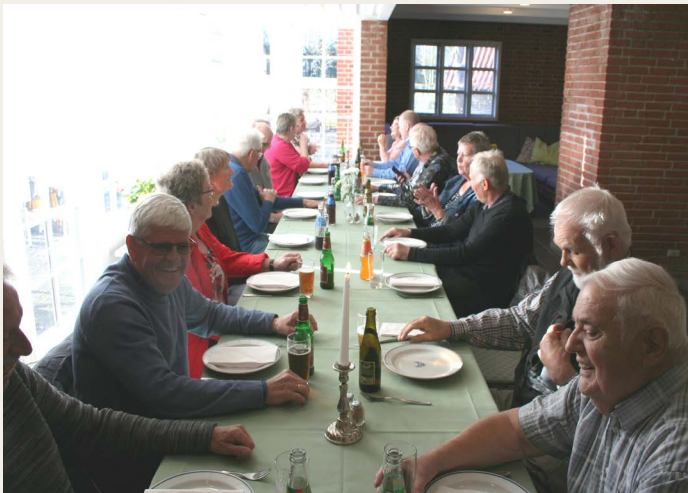
Tur deltagerne samlet ved bordet i Rebildhus umiddelbart før vi gik igang med maden, velsmagende hakkebøf med bløde løg, kartofler, sovs og tilbehør.