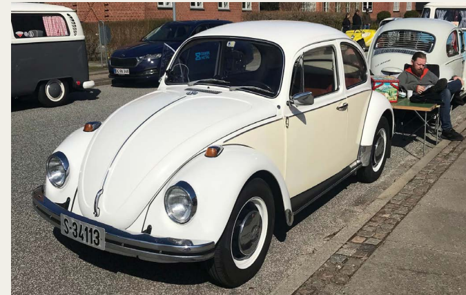
Gæsterne i de to hvide VW bobler havde taget turen til Aalborg fra Larvik, Norge.