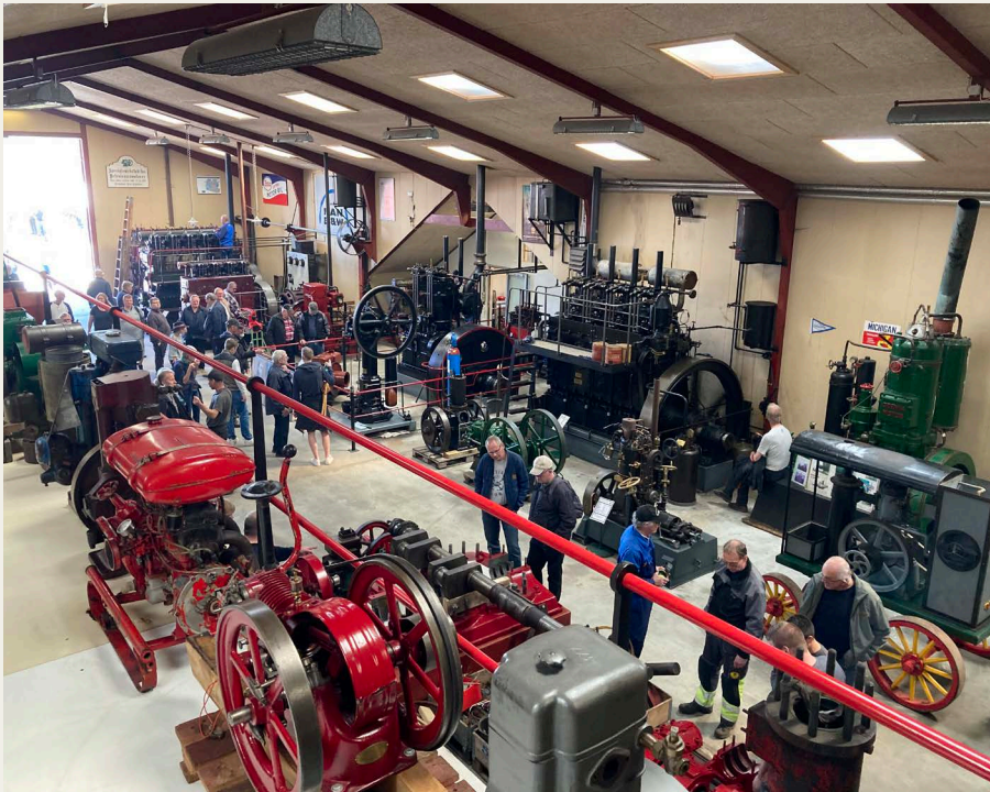
En af motorsamlingens haller med udstilling af stationære motorer.