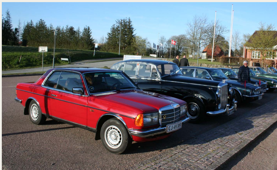
Deltagernes køretøjer linet op ved Rebildhus.