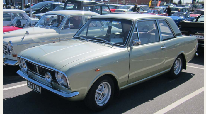
En 1970 Ford Cortina MK II GT 1.6 L