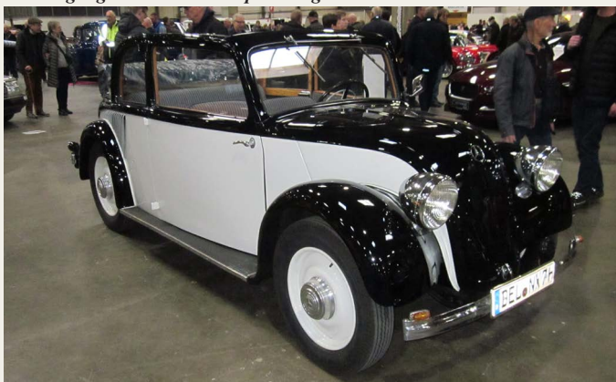
En sjælden 1934 Mercedes Benz 130 H 1.3L (H=Heckmotor)