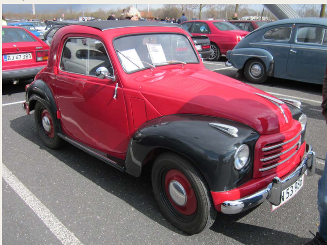
En rigtig fin og velbevaret 1953 Fiat T500 C Topolino.