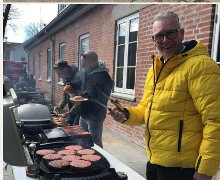
Menuen stod på velsmagende burgere m.m.