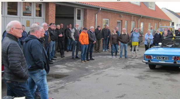
Deltagere ved standerhejsningen på forpladsen ved klubhuset.