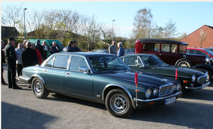
Deltagernes køretøjer linet op ved „opsamlings/mødested“ ved Shell i Støvring.

Såfremt køreturen skulle gå direkte fra Klubhuset til Rebild ville det være en forholdsvis kort køretur. Tanken og ideen med denne forårstur var jo netop ”TUR”. Denne tur gav os mulighed for at køre gennem, og samtidig nyde eftermiddags-solen, det fantastiske forår og de smukke landskaber med træer og bevoksning klædt i nyudsprunget lysegrønt løv, absolut helt optimalt.