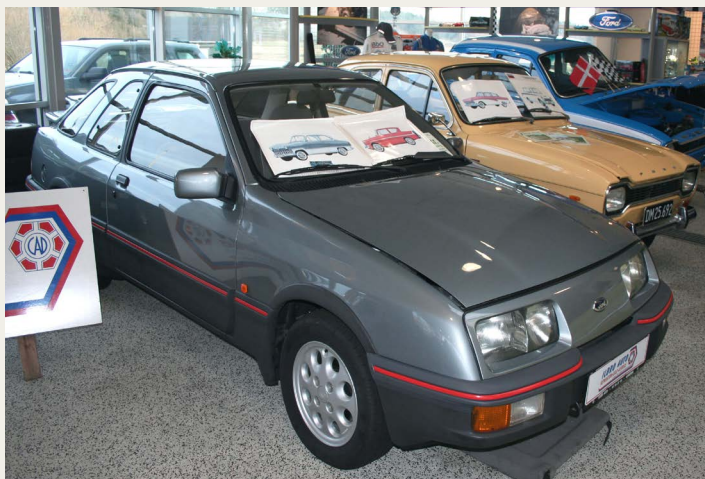
Fords „fremtidsbil“ i 80erne - Sierra, her i en XR4 udgave.