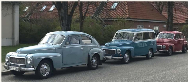
En fornem Volvo trio ved kantstenen - PV544 - PV210 Duett - PV544