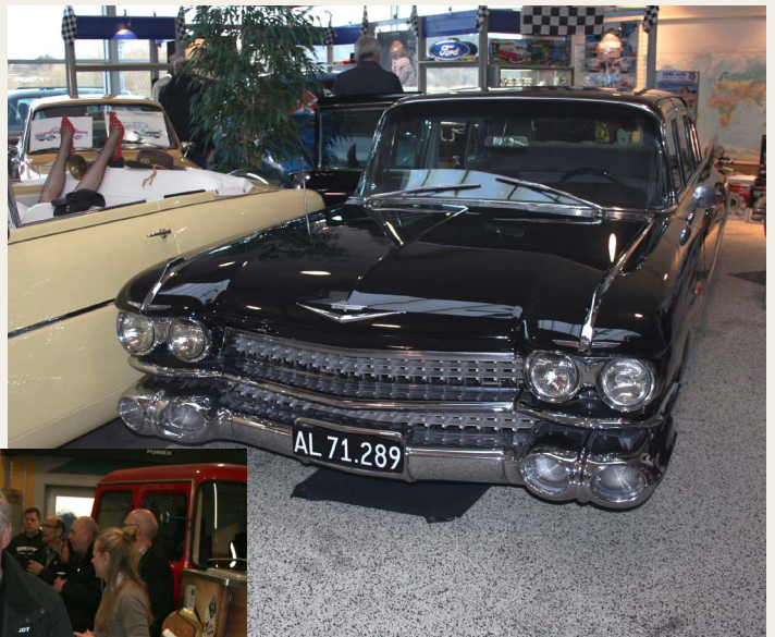
1959 Cadillac Eldorado Fleetwood 6.4 l V8