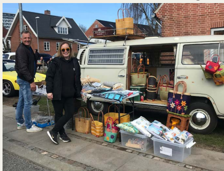
Mange fremmødt havde „Jenne gue sager“ udbudt til salg