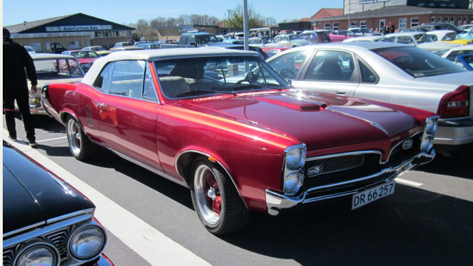
På P-pladsen sås fine biler. En 1967 Pontiac Le Mans convertible 5.3 L V8.