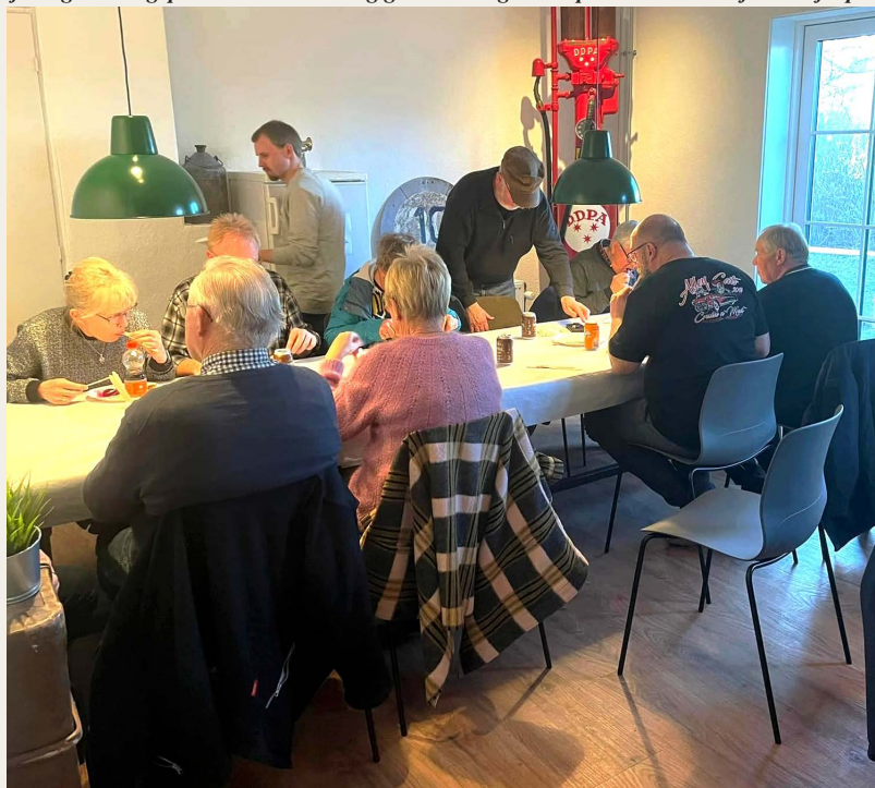
I det nyrenoverede klublokale var der „spisestue“ med rigtig hyggeligt socialt samvær.