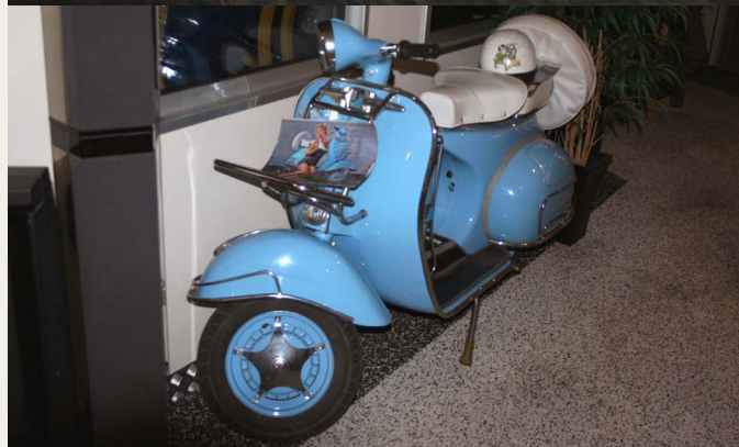
Udstillingen rummer også fine 2 hjulede køretøjer .