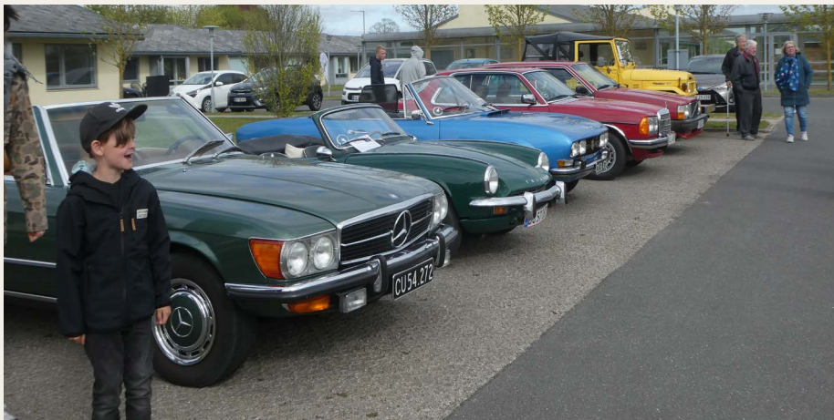
En del af de fremmødte veterankøretøjer i den kolde vind på Smedegårdens parkeringsplads. Bemærk at på trods af den kolde vind er kalecherne nede på de åbne biler.