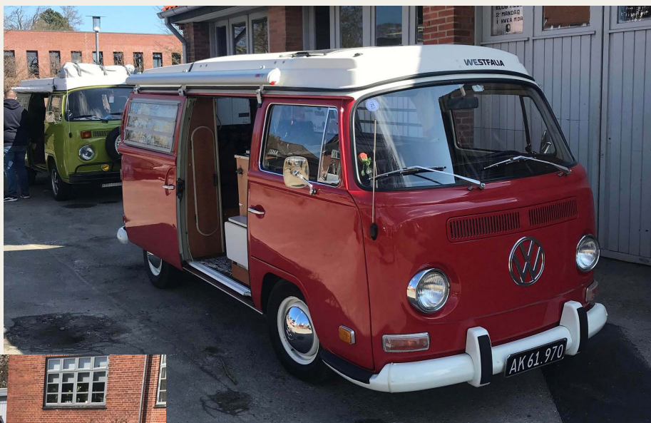
Fine VW camping-busser pynter på pladsen ved klubhuset.