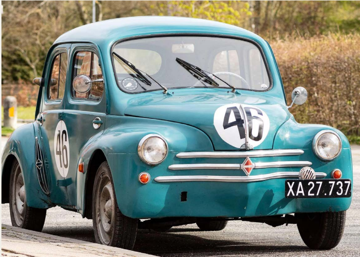
Stærke biler fra en svunden tid - 1960 Renault 4, Jan Krogshave.