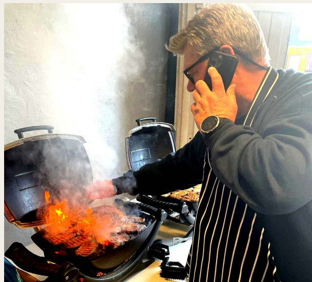
Meny - Klarup er leverandør af „råvarerne“. „Røg i køkkenet kan ej undgås“. Stegeprocessen med ovn og grill blev dog klarer på bedste vis ved fælles hjælp.