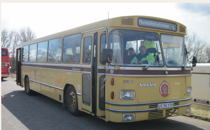
Denne gang var der busholdeplads bag hallerne.