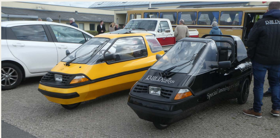
Blandt de fremmødte køretøjer var der hele to Ellerter, eller City-El, som de rettelig hedder. Den gule er en næsten veteran fra 1988. Den sorte cabriolet fra 2008 mangler til gengæld en del år inden den opnår veteranstatus