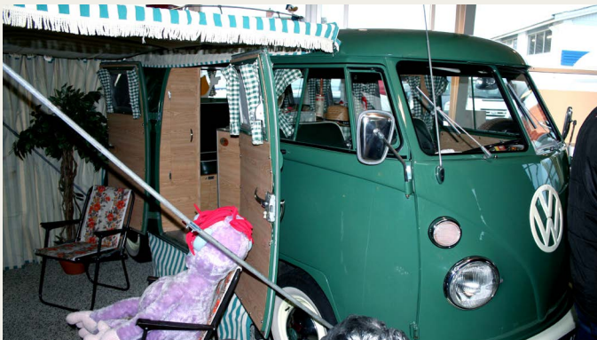
VW bus som campermodel - flot model fra 50erne..