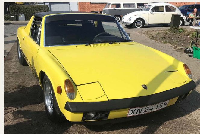
En deltager var kørende i denne fine 1973 Porsche 914