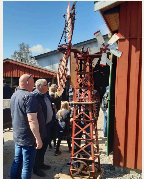
Klapsejlermodel: Motorsamlingen har en kørende klapsejler vindmølle, som flere gange har været vist i "Bonderøven" på DR. Ved siden af klapsejleren i fuld størrelse var udstillet en fungerende skalamodel, som flittigt blev studeret og diskuteret.