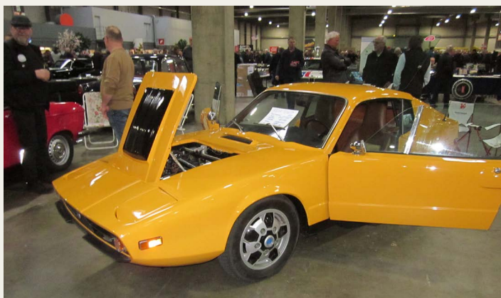
I hallerne sås spændende køretøjer, her en flot 1972 Saab Sonett V4