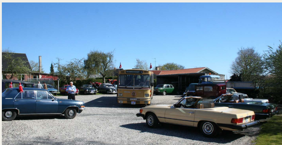
Lørdag d. 25. juni er der mulighed for at være med på HIMMERLANDSTUREN - se omtale.