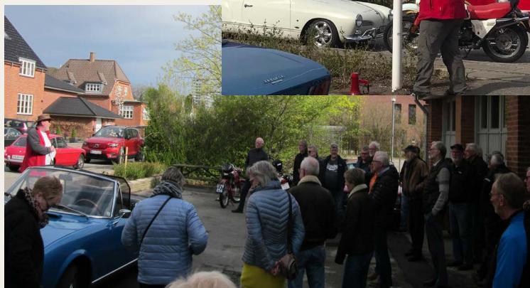
Mange medlemmer var mødt op og kunne se NVMKs fane gå til tops i flagstangen.