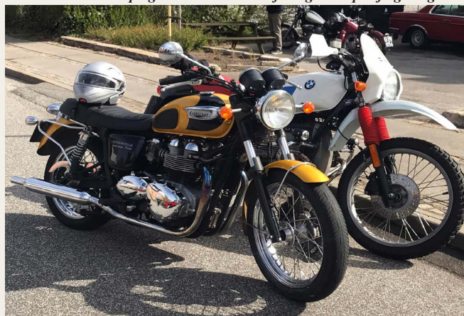
Det var glædeligt at se MC-kørende denne dag. Ø.1955 James Cadet 150cc, tv. 1995 Yamaha XV 1100 Virago, th. Triumph Bonneville 900 & BMW R65GS.