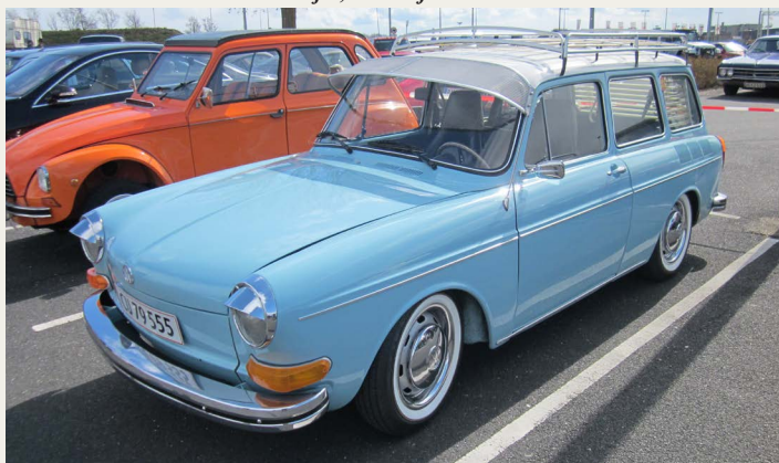
I udendørs en lige så flot bil med hækmotor - en 1971 VW 1600 Variant.