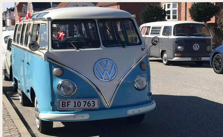
Bjørn Crewe, Odense var på far/søn tur i denne flotte VW - bus.