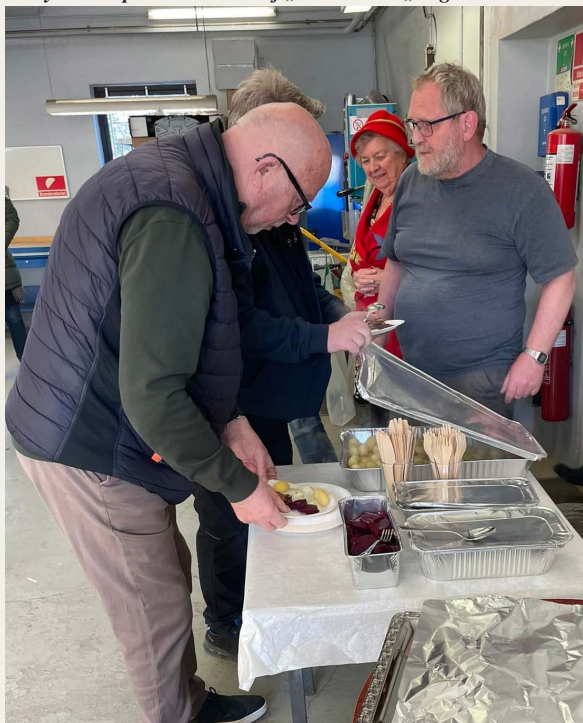
I værkstedet var der delvist „friluftskøkken“ og „ta'-selv bord“