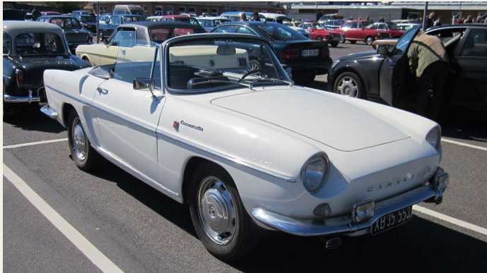
En 1965 Renault Caravelle 1.1 L Cabriolet.