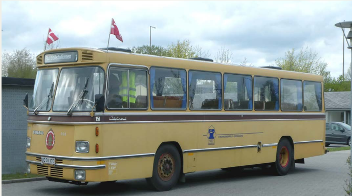
Klubbens gamle Volvo-bus deltog også i arrangementet, og i løbet af aftenen kørte den to ture med passagerer.