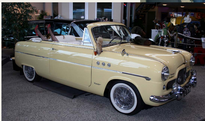
Udstillingen rummer mange fine biler, her Ford Zephyr Six Convertible 51-56