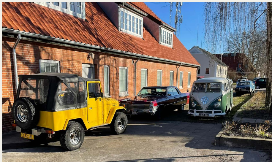
Foråret er kommet, „vinterdynen“ er taget af de ældre køretøjer, og turen er sat til klubhuset.