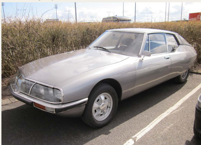
En 1971 Citroën SM Coupé 2.7L V6 - SM= Systeme - el. Sport Maserati.