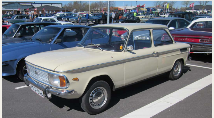
En af den tids „hotte“ køretøjer en 1968 NSU 1200.