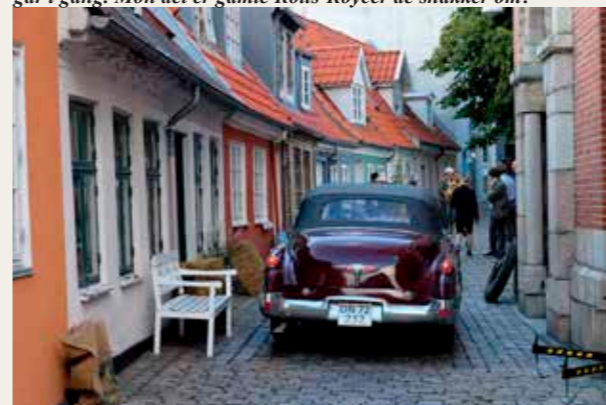
Ole Svenssons store Buick fra 1949 fylder meget i de små gader omkring Vor Frue Kirke.