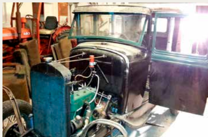
Fronten inden restarering.