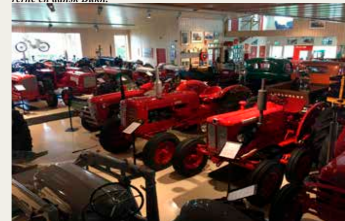
Oversigtsbillede med bl.a. traktorer og museets hyggelige indgang i baggrunden.