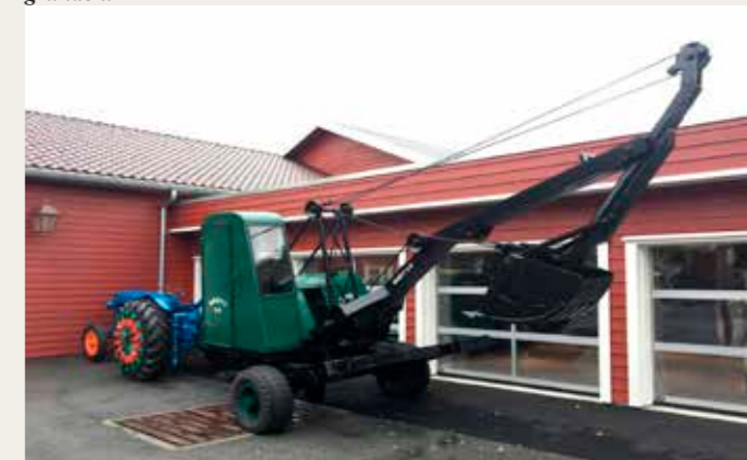
Bugseret Broyt wiregravemaskine, trukket af en Fordson Major med spadeklor på trækjulene.