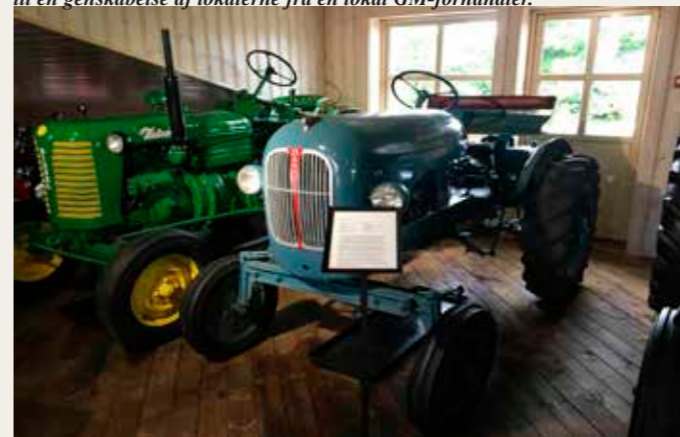
En Danhorse bygget 1957 i Skalborg, samt en tjekkisk Zetor.