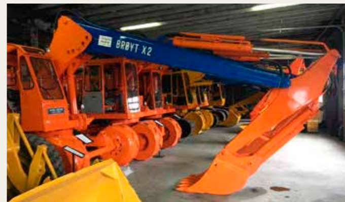
Museet har også en samling af norskfremstillede Broyt gravemaskiner. Disse er pga. pladsmangel på museet udstillet i en lagerhal, men der er også adgang til denne for gæster.