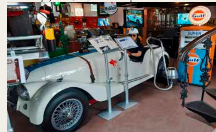
Den hvide 1957 +4 model er en fabrikstunet bil med TR3 motor.