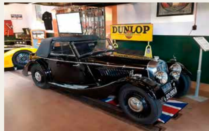
En Morgan Drophead 4/4 fra 1947, med en samlet produktion på 164 stk. Bilen er udstyret med en Standard Special 1200 cc motor på 39 hk.