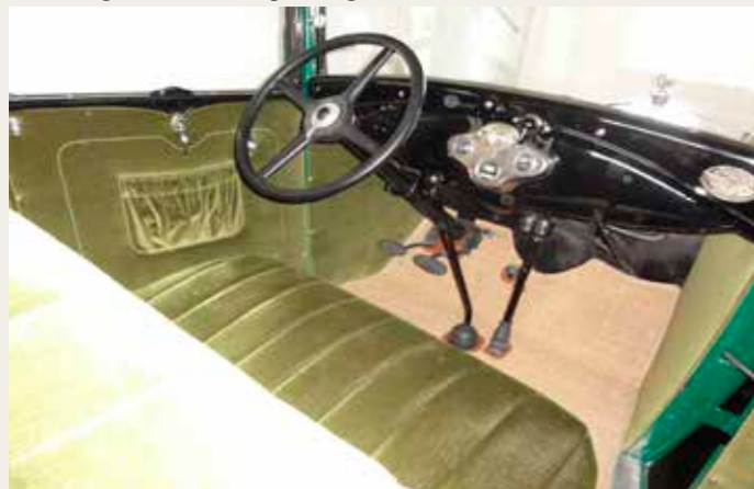
Førerpladsen og sæderne efter restaurering - flot.