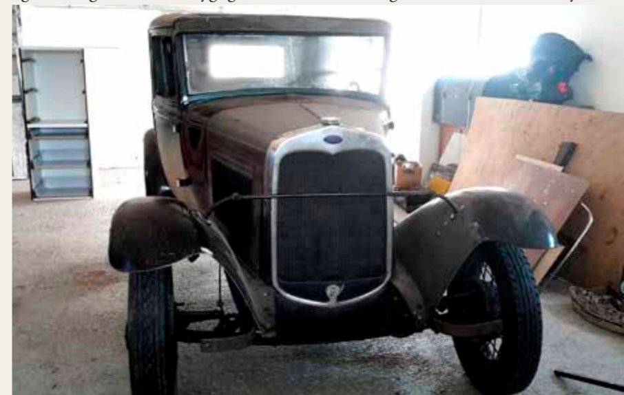
Ford'en inden restaureringen.

Stadig spøjte den 4-dørs model, hvorfor? En mere sjældnen model og lidt herskabsagtig p.g.a. 2 ekstra døre, der i øvrigt gav lettere adgang til/fra bagsædet. I sommeren 2016 dukkede et restaureringsprojekt op - ladefund - i Attrup. Bilen havde stået stille siden 1969, delvis uden tag, delvis manglende bund, ingen sideruder, lygter, kofanger m.v., + rust og råd. Dog en funktionsdygtig motor