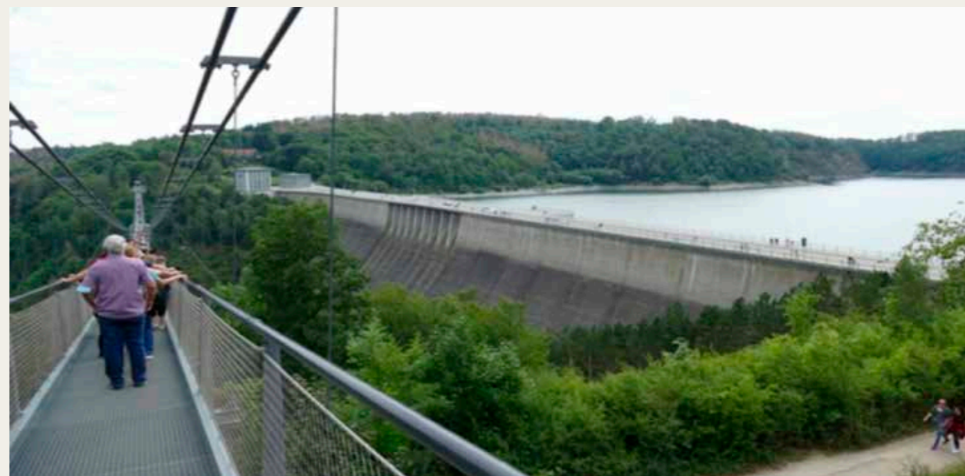
"Rappbodetalsperre" er med en længde af 415 m og en højde af 106 m Tysklands største opdæmmede sø.