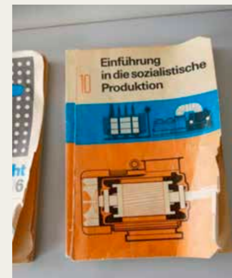
Lektüre fra en svunden DDR tid.