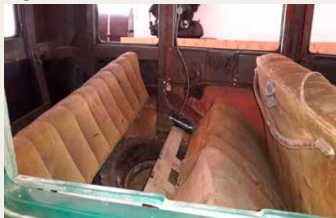
Interiør og sæder inden ompolstring.