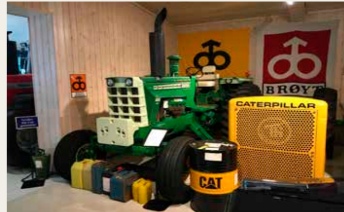
Amerikansk Oliver traktor fra 1976 med Cat V8 motor på 10,4 liter og 147 hk