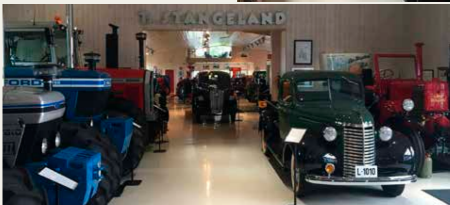
Billede der viser bredden af det udstillede. Nyere traktorer til venstre, og en Chevrolet pickup og en Lanz Bulldog til højre.