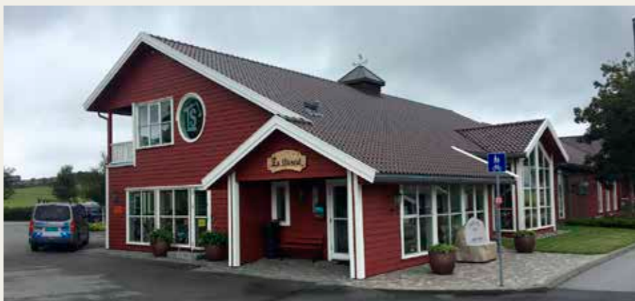
TS Museet set udefra. Ser ikke ud af meget og ingen store skilte.

Museet er oprettet i 2004 af Trygve Stangeland, grundlæggeren af et stort entreprenørfirma Stangeland Maskin, der i dag har omkring 700 ansatte. Efter Trygve Stangelands død drives museet videre af Stangeland Maskin og ikke mindst en stor gruppe frivillige,