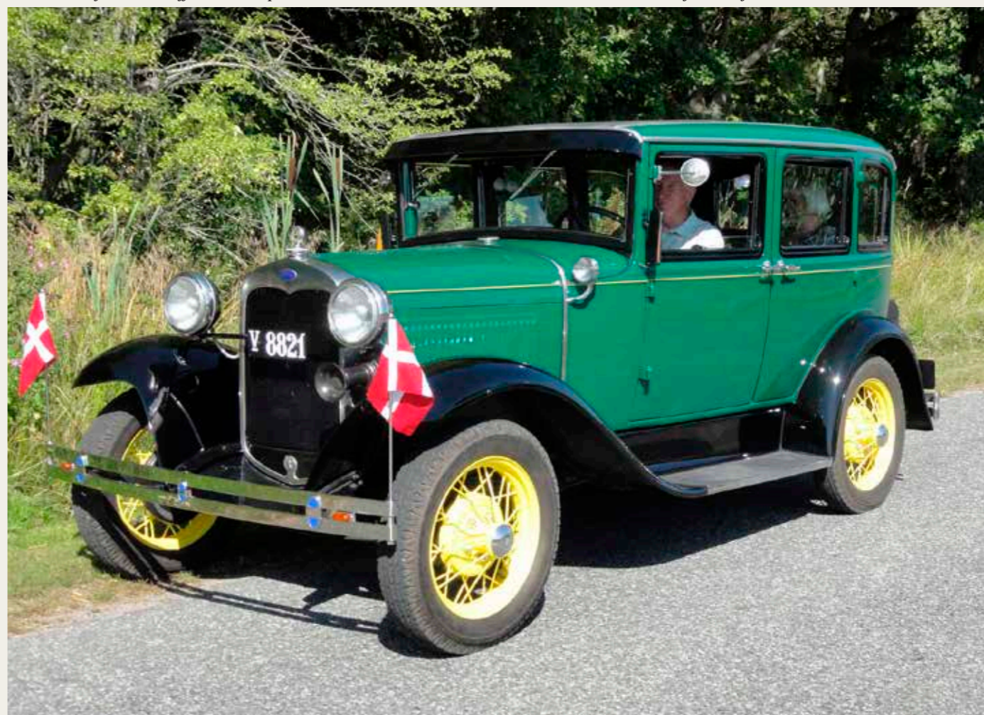
Ford A 1930 Fordor på landevejen.