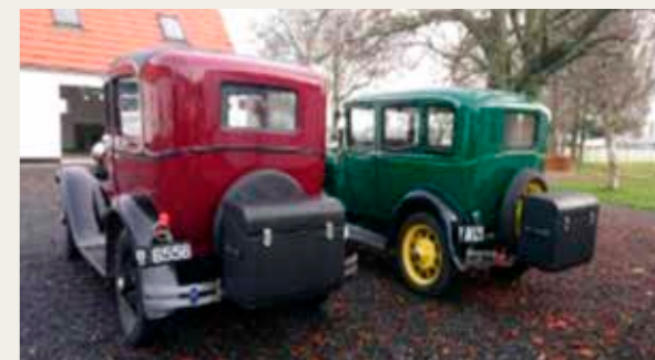
Ford A 1930 hhv. Tudor og Fordor sedans.