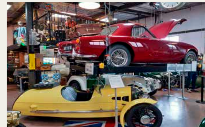
Ophængt i stålvirer Morgans første lukkede model med glasfiberkarroseri, en +4+ coupe fra 1963, udstyret med Triumph TR4 motor.