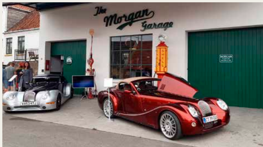
Morgan Garage i landsbyen Besser. Bilerne er Morgan Aero 8 fra henholdsvis 2004 og 2017.

En grøn 4 hjulet model 4/4 fra 1936. En produktion på kun 22 stk. må have været noget af en økonomisk udfordring. Og en Morgan Drophead 4/4 fra 1947, med en samlet produktion på 164 stk. Bilen er udstyret med en Standard Special 1200 cc motor på 39 hk. Ophængt i stålvirer Morgans 1. lukkede model med glasfiberkarroseri, en +4+ coupe fra 1963, udstyret med Triumph TR4 motor. Bilen blev fundet i San Louis i USA og efterfølgende totalt renoveret. Ej specielt eftertragtet model – kun 26 stk. produceret. Den opmærksomme læser vil bemærke et af pladmæssig nød etableret indskudt hængedæk i baggrunden af billedet. Her er bl.a. parkeret 2 børne Morgan køretø-