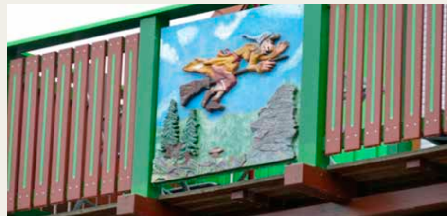
Altan udsmykket med motiv „Heksen fra Brocken „Bloksbjerg“