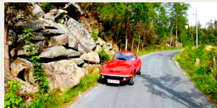
Snoede vej i Harzens smukke landskab, det rette element for en Opel GT.