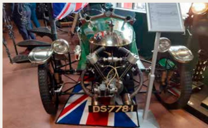
En 3-hjulet Morgan Aero fra 1923 med en 2 cyl. Britisk Anzani motorcykelmotor