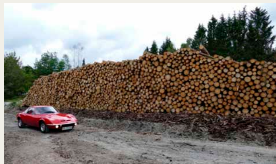
En del af Harzen er ramt af omfattende skovdød .En af mange stakke af 3 og 6 meters stykker træ.