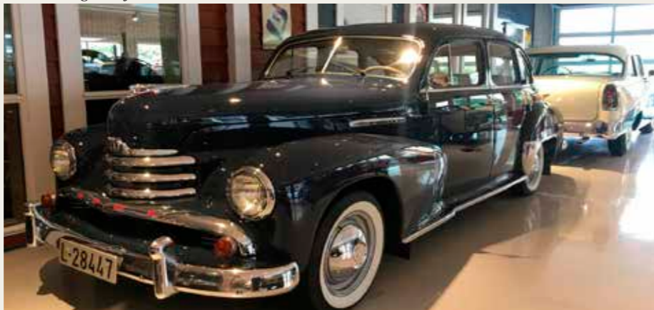
Opel Kapitän 1952.