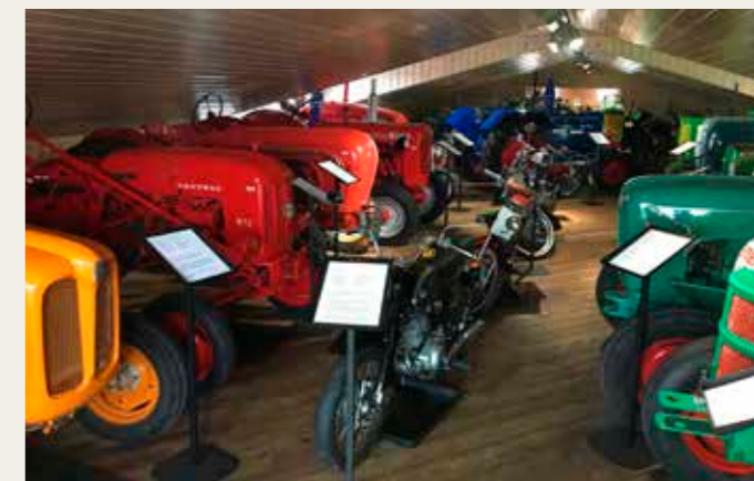
Motorcykler og traktorer godt klemt inde på 1. sal i bygningen. Bland traktorerne en dansk Bukh.