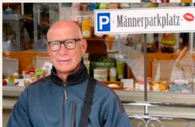
Når nu konen skal på shopping er det dejligt at de forretningsdrivende har tænkt på hvor den mandlige part kan opholde sig. Den tyske service fornægter sig ikke. Manglede bare lige fadøllen!