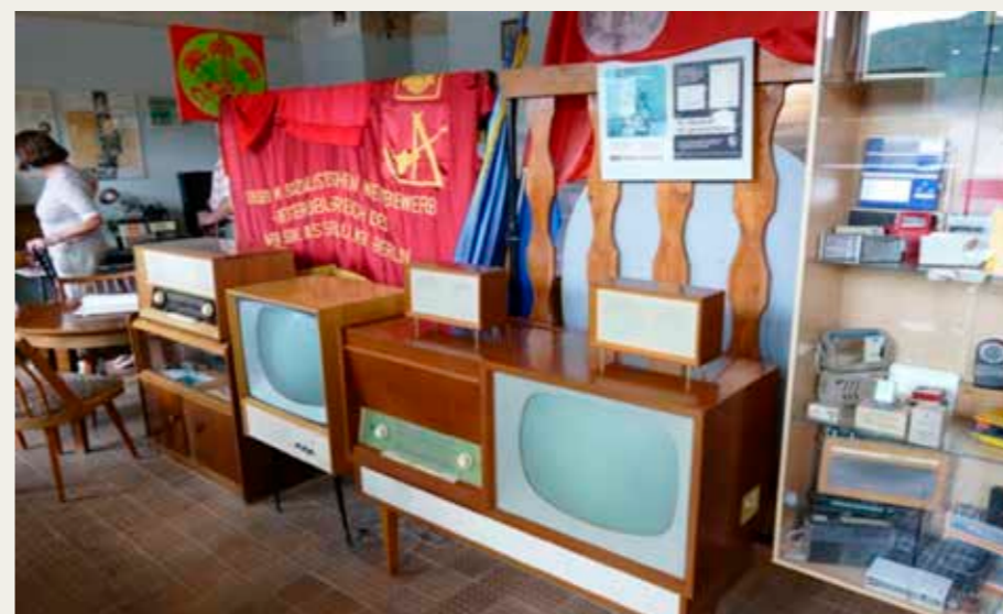
I Thale var vi inde på DDR museum, der lå på 6. sal i en stor møbelforretning, hvor en hel etage var indrettet med relikvier fra hele DDR perioden