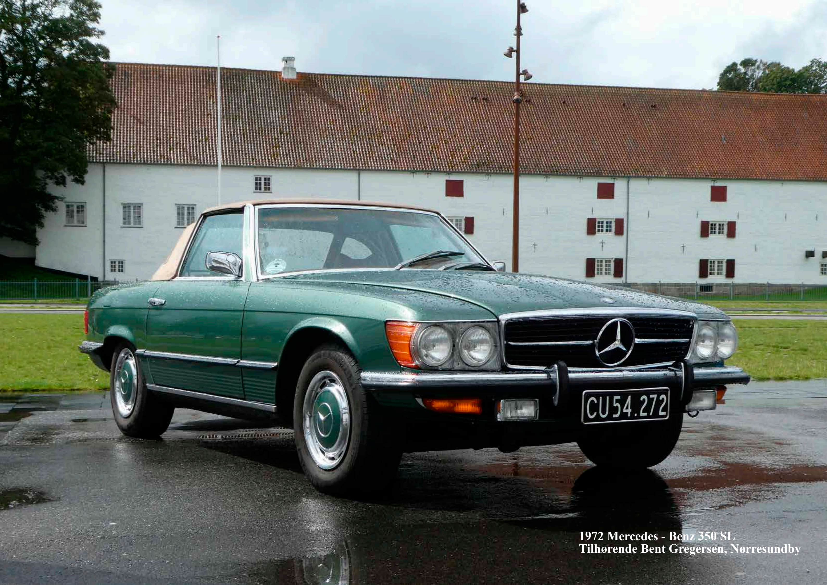
1972 Mercedes - Benz 350 SL Tilhørende Bent Gregersen, Nørresundby