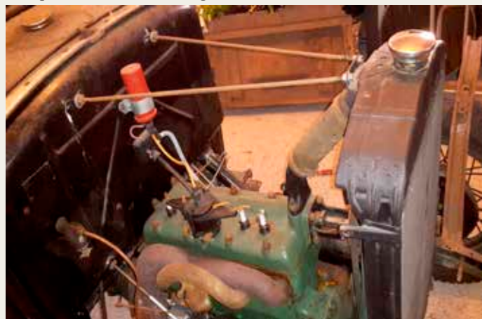
Et kig i teknikken.