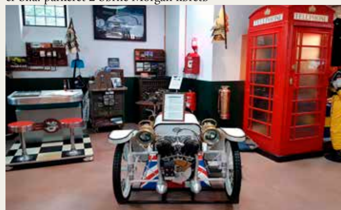
Det lille hvide 3-hjulede køretøj er replica af en årgang 1910 Morgan Runabout.