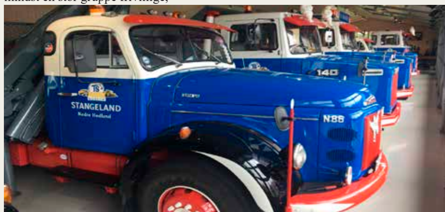
Meget flotte Volvo og Scania lastbiler! Dem ville jeg gerne have nøglerne til. Og den flotte række lastbiler set fra den anden side.