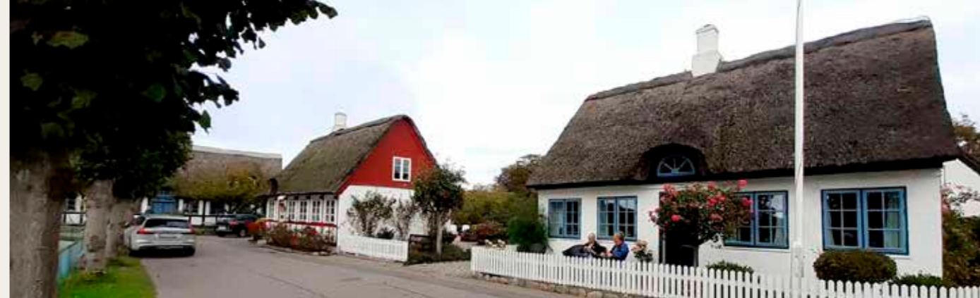
Samsø'sk landsbyidyl fra Nordby.