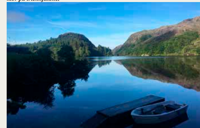
Udsigt fra vores hytte. Der er virkelig smukt i Norge!