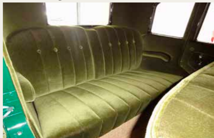
Flotte sæder efter ompolstring.