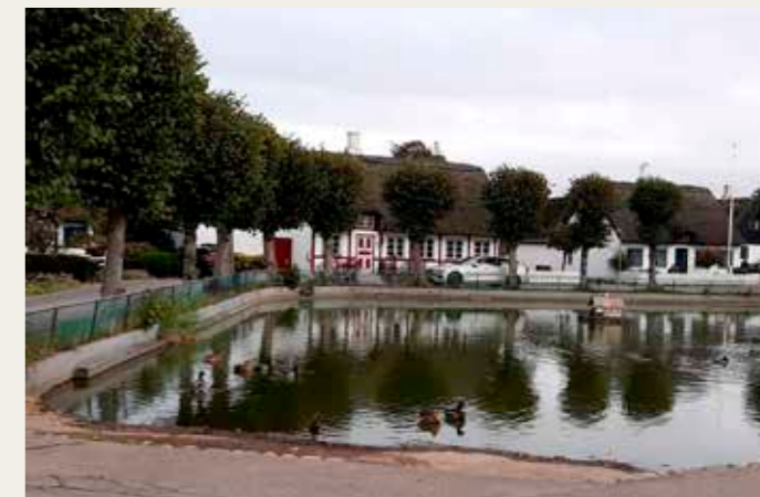
Idyl ved gadekæret i landsbyen Nordby.