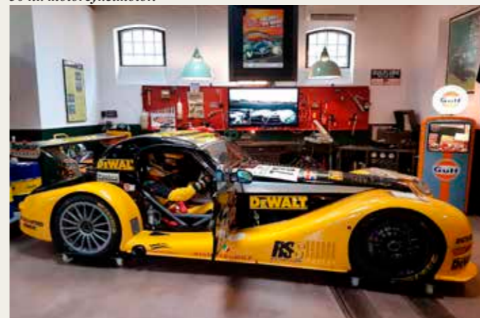
En Morgan LeMans racer, som deltog i 2002 24-timers løbet.