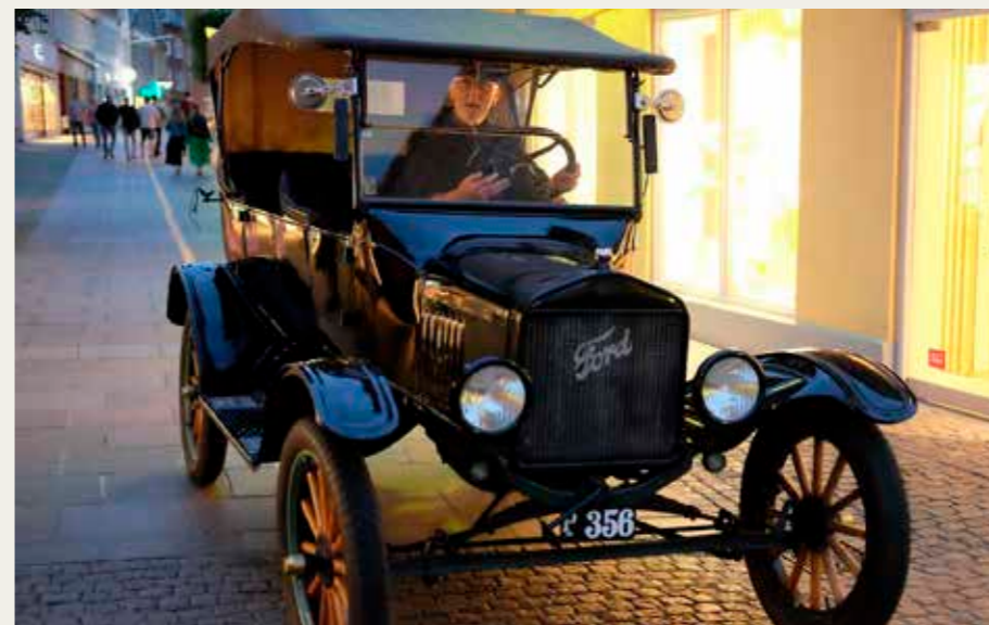
Gert Olesen var i høj humor over at få lov til at køre sin gamle Ford Model T fra 1923 i Aalborgs gader.

over Per Mogensens Ford AA – tale om følgende biler