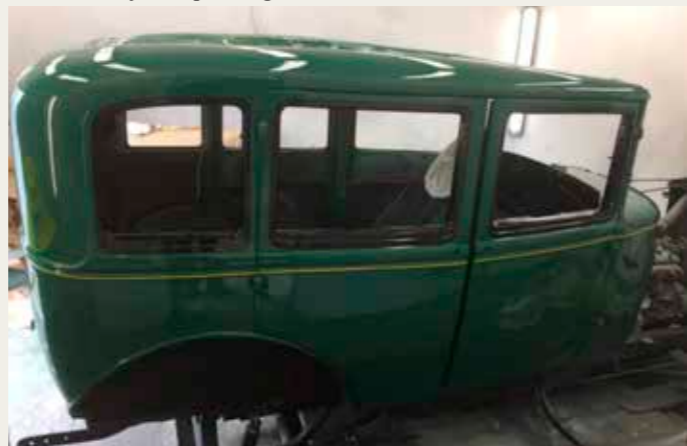
En nylakeret karosse.