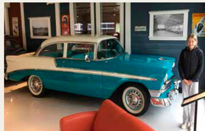
: Flot Chevrolet Bel Air i en ny tilbygning til museet, der med tiden skal blive til en genskabelse af lokalerne fra en lokal GM-forhandler.