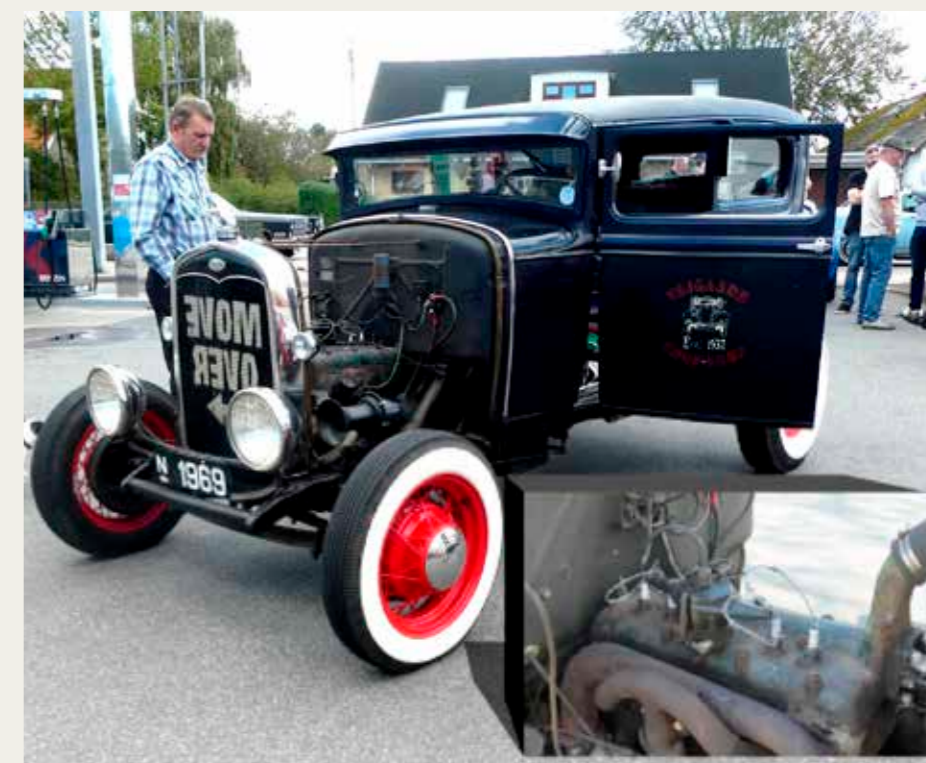
Det var ikke alt, der var restaureret til "Showroom" kvalitet. Denne Ford Model A fra 1931 havde mistet noget af sin originalitet, men den giver sikkert sin ejer mindst lige så store oplevelser. Som det fremgår af det indsatte billede er tændrørskablerne med til at understrege det rå look.

Nålemagervej 1, 9000 Aalborg Telefon: 96 31 47 00 WWW.FLAUEKJOLD.DK