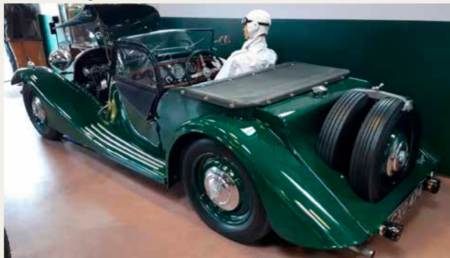
En grøn 4 hjulet model 4/4 fra 1936.