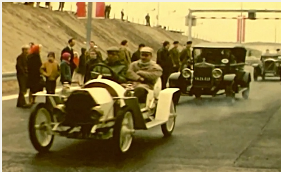
Ved indvielsen den 6. maj 1969 kørte veteranbilerne også igennem Limfjordstunnelen.

Selve fejringen af jubilæet fandt sted den 12. maj 2019, og begivenheden var delt op i flere events. Hovedbegivenheden, som Aalborg Kommune stod bag sammen med DGI, var en vandretur gennem Lim-