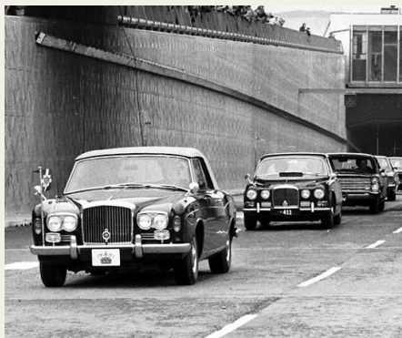
Ved Limfjordstunnellens åbning i 1969 kørte Kong Frederik IX forrest i sin nye Bentley Cabriolet.