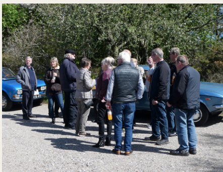
Hver gang der var et stop fandt deltagerne hurtigt sammen til hyggelig snak.