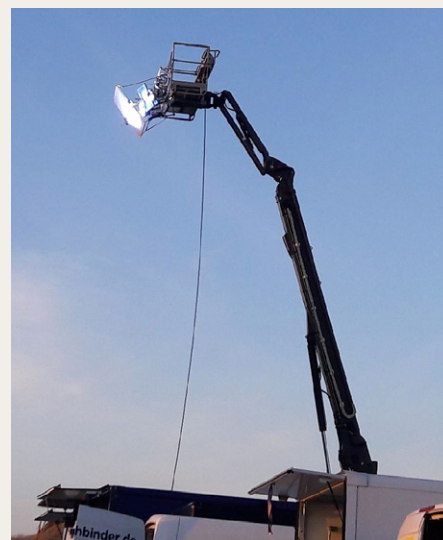
Når man ikke kan tage sig sammen til at filme om dagen, må man jo skabe sit eget dagslys.