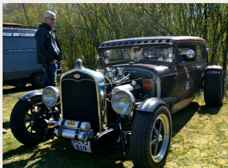
Der var mange forskellige køretøjer til stede.

Der var gratis kaffe og rundstykker, som kunne nydes i det dejlige solskinsvejr, der