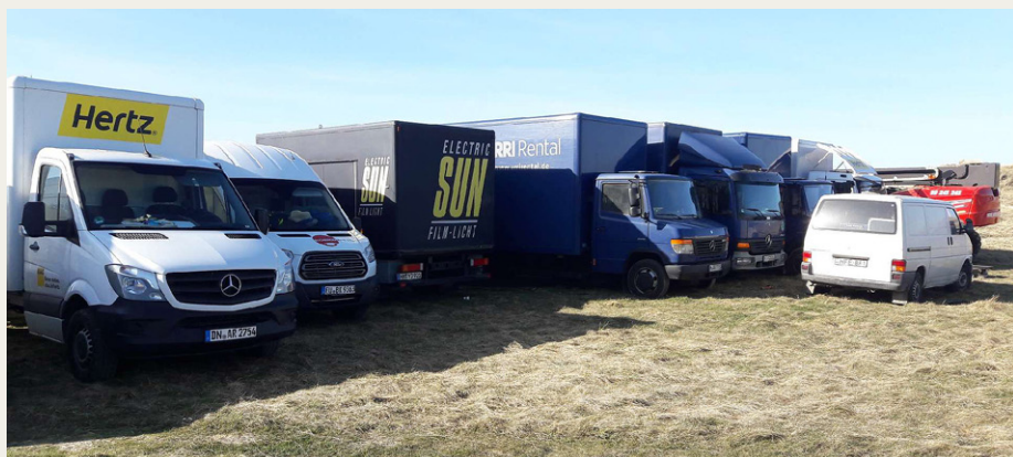
Hele seks lastbiler skulle der til for at transportere alt udstyret.