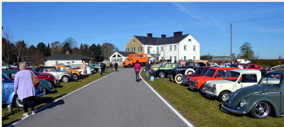
Indkørselen til Memphis Mansion og den fine træfplads med musik i græsplænen.