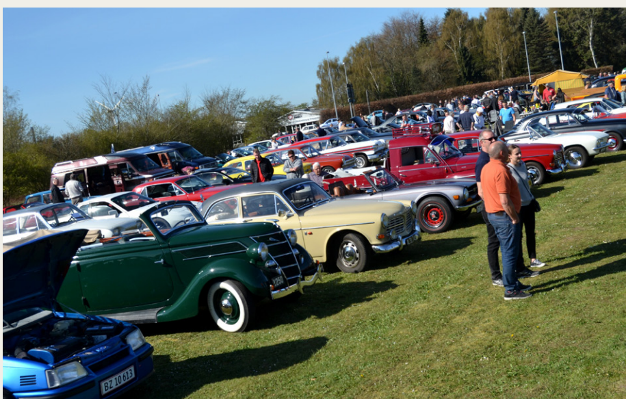
Kik ud over træfpladsen.

stod på hele dagen. Om middagen var der mulighed for at købe sandwich og drikkevarer eller spise i restauranten. Der var virkelig pres på alle steder, for i stedet de forventede 130 - 150 deltagere, kom der over 400 deltagere, men der var plads til alle på det dejlige areal omkring Museet.