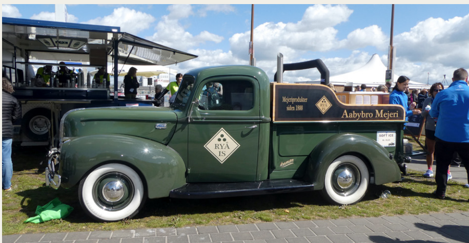
På den anden side af Nyhavnsgade blev der leveret masser af lækker softice ud fra Rya Is' flotte 1941 Ford V8 1½ Tons Pickup Truck „Isbil“.

til at sætte på bilen plus deltagerliste, dagsprogram, kørselsanvisninger, madbillerter til sandwich og is og (som det vigtigste?) en parkeringsbillet, som gav tilladelse til at parkere i slotsgården hele dagen. Efter alle køretøjer var linet op i nummerorden kørte vi i kortege ind til Aalborghus Slot. Det vil sige, vi startede som en kortege, men da der ikke var nogen form for ekstra trafikregulering, blev vi delt op af lysreguleringer og vigepligtsregler. Det gik nu ganske udmærket, og omkring klokken 09.45 var de fleste på plads i Slotsgården. Det var i forvejen bestemt, at bussen, en deltagende lastbil og Lindhardts Daimler „Krone 5“ skulle parkere uden for porten.