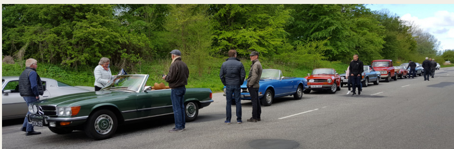
Bilerne bliver linet op i nummerorden på Skydebanevej inden vi kører ind mod Aalborghus Slot.