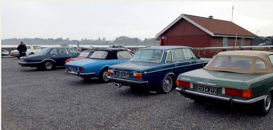
De sidst ankomne køretøjer blev henvist til en regnvåd grusparkeringsplads.

havnen på telefon, satsede vi på, at de selv havde valgt at køre til Øster Hurup, så vi vendte bilerne og kørte mod bestemmelsesstedet: Restaurant Neptun på havnen i Øster Hurup. Inden vi nåede Dokkedal var det begyndt at regne. I Øster Hurup mødte vi de øvrige deltagere, som ganske rigtigt havde valgt at køre til restauranten,