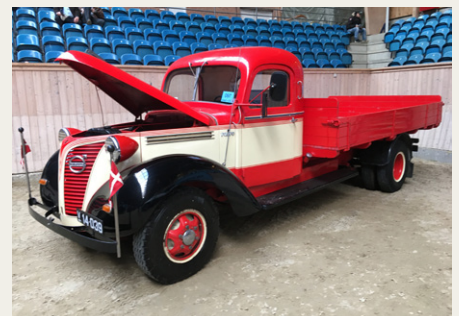
Volvo Lastbil fra 1939. Kilometertælleren viste 915.594 km!