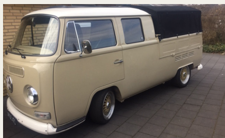
Kims sandfarvede VW Bus fra 1971.