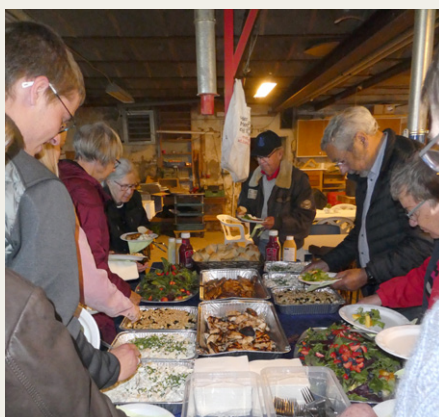
Efter køreturen var der dækket op med grillstegte koteletter og kyllingebryst og hertil masser af kartoffelsalat og salat. Senere kom der også grillstegte polser på bordet.

Madum Sø. Her var Post 2 med endnu et spørgeskema, der skulle svares korrekt på. I den medleverede information om mange fine ting i området, var det rimeligt overskueligt at finde svarene. (Man bliver klogere på mange ting).