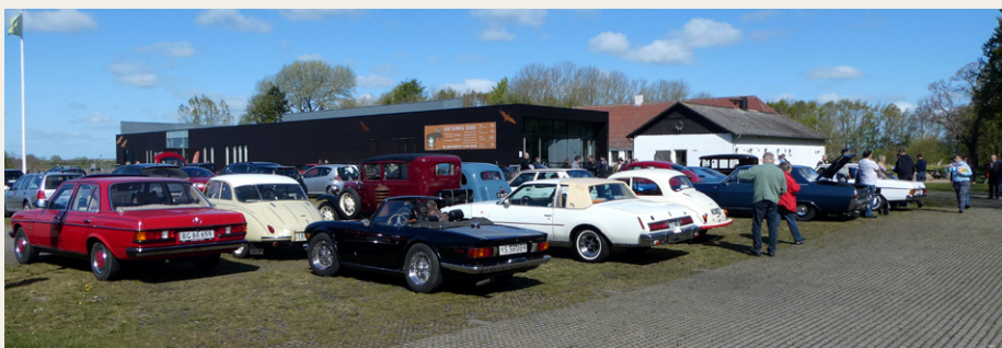
Første stop på turen var ved Lille Vildmosecentret ved Dokkedak.