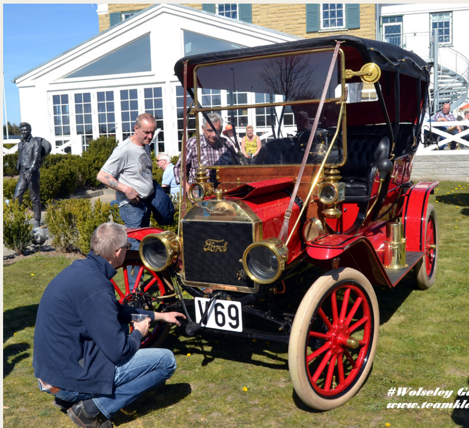
Nok træffets ældste køretøj.