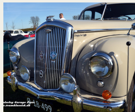
Der var også andre fine Wolseley'er på dagen.