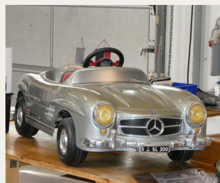
Normalt er en Mercedes-Benz 300 SL uopnåelig for almindelige mennesker, men i Aars kunne man erhverve sig et eksemplar for en overkommelig pris.