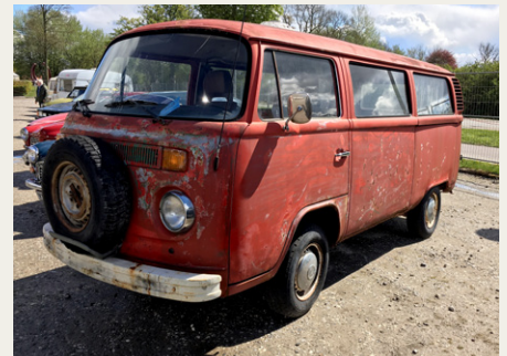
En Folkevogn fra sidst i halvfjerdserne med masser af „patina“.