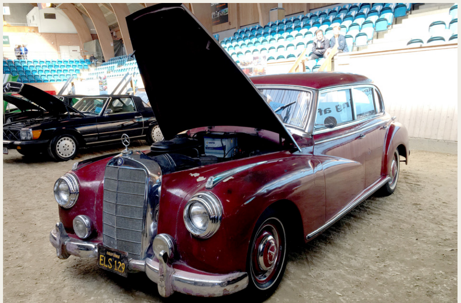
Den „spændende“ Mercedes Adenauer.

Mercedes 300 Adenauer fra 1954, som trængte til den helt store tur, beskrevet som „med en flot patina“, læs: den er rusten overalt, interiøret er i laser, lak og krom er grim, gik for 180.000,- det er biler som går for over 750.000,- i Tyskland, når de er toprestaurerede, men der var også et stykke vej!