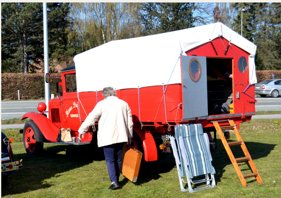
Der er mange udgaver af „Auto Campere“, her en af de lidt ældre årgange.