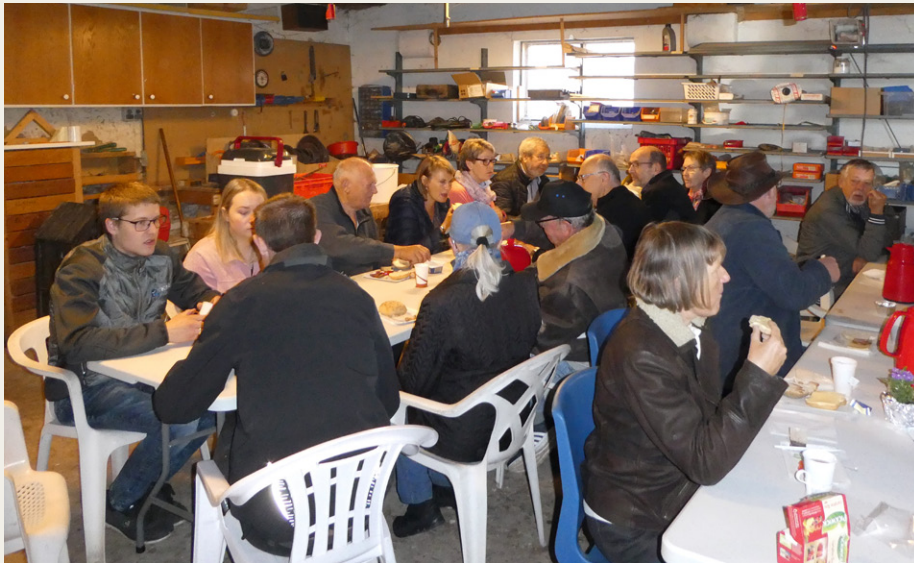
Efter ankomsten til Veddum var der kaffe eller te med rundstykker til alle deltagerne.

Efter endt pause og aflevering af løsnin-ger, kørte vi videre mod vest af pæne ruter over Lindenberg, Håls, Gjerding, Sejlstrup og Hellum for at holde pause ved