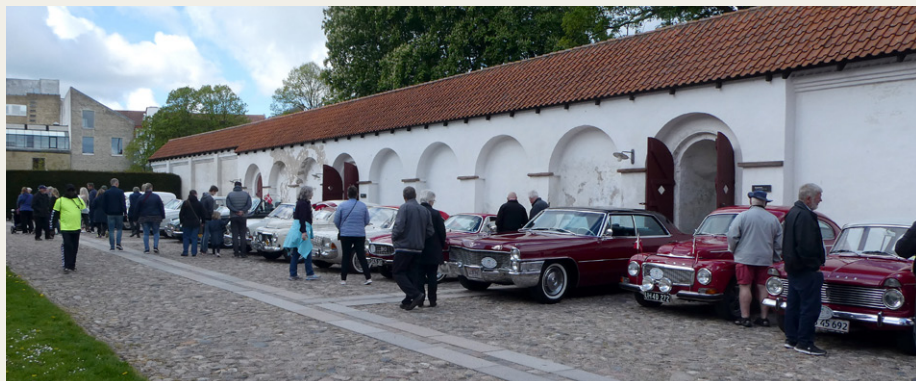
Smukke biler fra tresserne langs vestmuren i Aalborgbus Slots gård.

Sidst på formiddagen fik vi mulighed for at veksle vores madbilletter for velsmagende frokost fra Nadias Sandwich, og som dessert var der lækker is fra Ryå Is' gamle Ford V8 isbil, som var parkeret på Honnørkajen lige over for slottet.