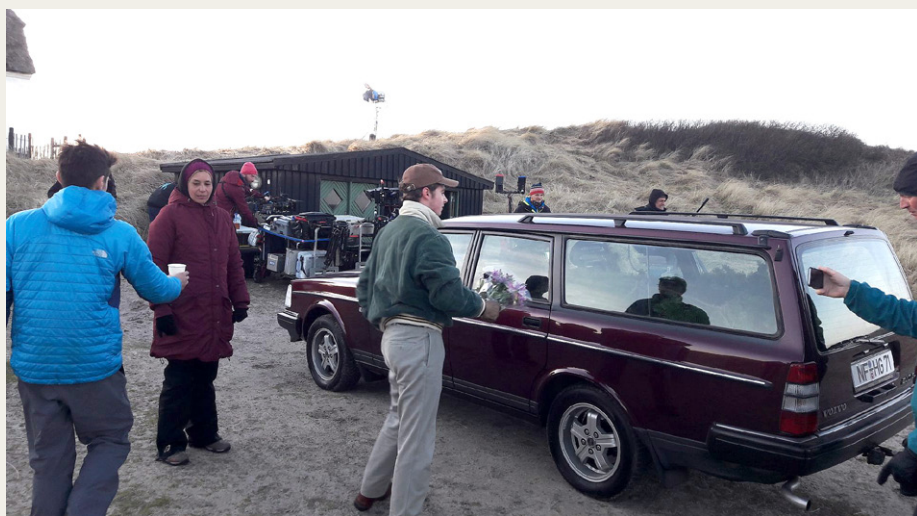
ABs Volvo 240 med tyske nummerplader og juletræ i bagagerummet.