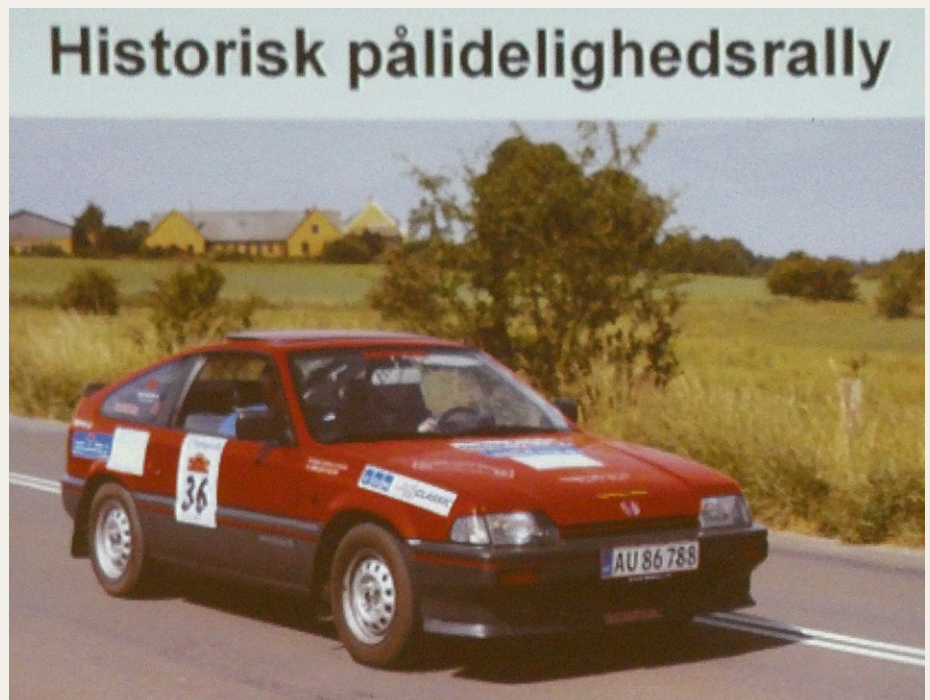
Vinderbilen fra FDM DASU Classic 2018 ligner enhver anden Hoda Civic Coupé fra 1986 bortset fra numre og klistermærker.