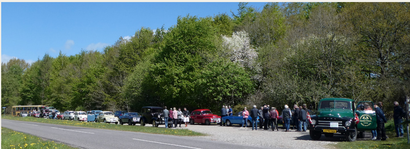
Alle 22 deltagende køretøjer - med en enkelt undtagelse - er her parkeret på Post 2 ved Madum So. Den ene undtagelse er en Opel Kapitän, som mistede bremseevennen undervejs. Heldigvis kunne alle fire passagerer fortsætte turen i bussen.