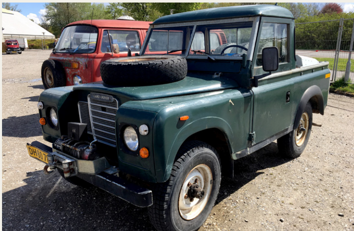
Land Rover'en jeg ikke fik med hjem.