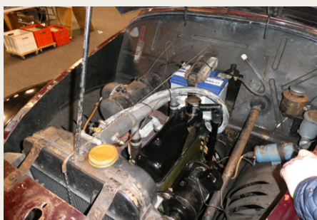
Og her et kik ned i Hanomag's motorrum.