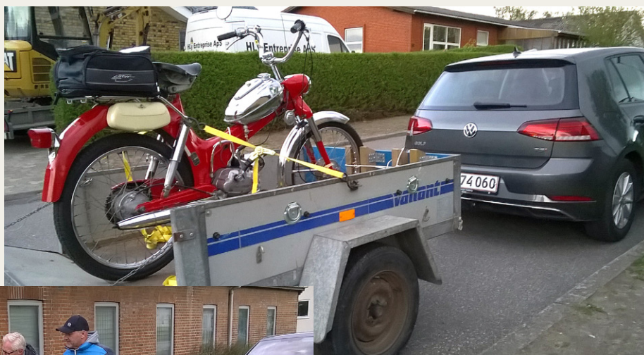
Formanden klar til afgang fra Sønderholm mod Forchhammersvej 5 i Aalborg.

Fire friske fyre plus fotografen er klar til at trodse vejrgudernes rasen og kulde.