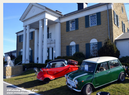
Memphis Mansion i perspektiv.