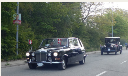
Lindbards Daimler „Krone 5“ kører som den første bil fra travbanen ind mod Aalborgbus Slot.