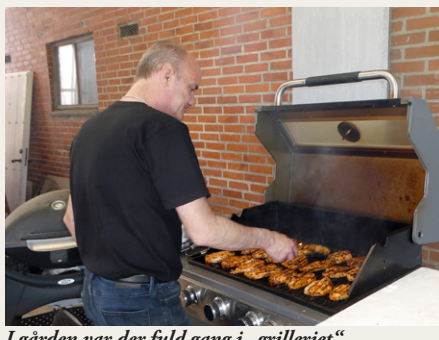
I gården var der fuld gang i „grilleriet“.