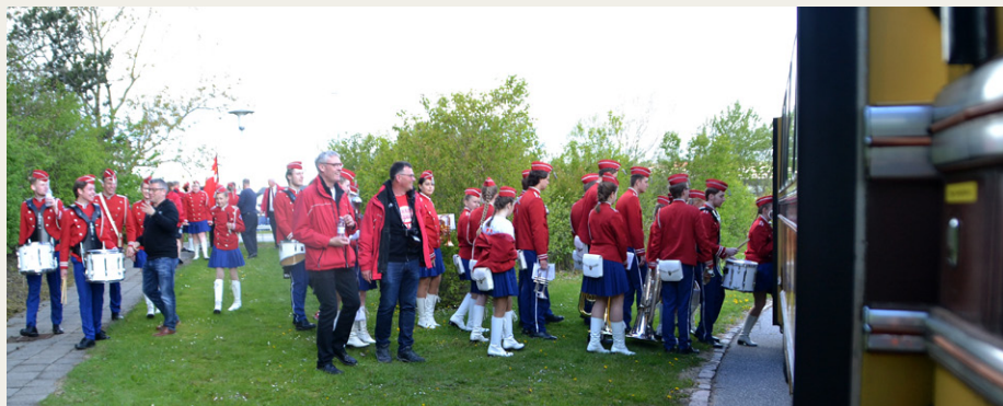
Aalborg Garden stiger om bord på bussen ved Tjener-Kokkeskolen på Rørdalsvej, efter at garden var gået forrest gennem Limfjordstunnelen.