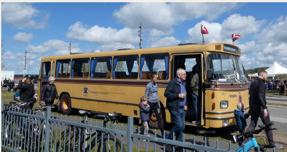
Vores fine gamle bybus havde fået sit helt eget „Stoppsted“ udenfor slottet.