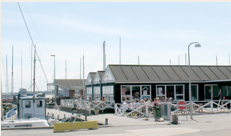
Restaurant Neptun er placeret helt ude ved kanten af havnebassinet, og om sommeren, hvor dette billede er taget, er der virkelig muligt at nyde den gode udsigt sammen med den gode mad.

Derefter gik turen østpå mod Egense – et planlagt smut indenom Klarup og Storvorde blev valgt fra på grund af tidspresset – og efter en smuk tur ned omkring Skellet nåede vi Kystvejen mellem Egense og Egense Havn. Planen var jo, at vi skulle møde nogle flere deltagere på