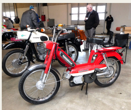
På stumpemarkedet i Aars var det også muligt at købe en - på vores breddegrader - meget sjælden Peugeot 103 knallert fra 1973.