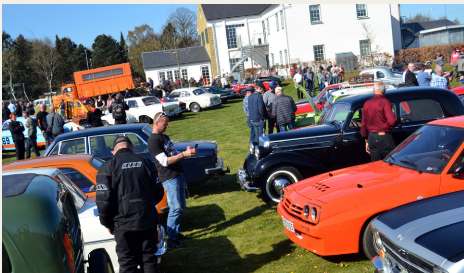
Kik ud over træfpladsen.