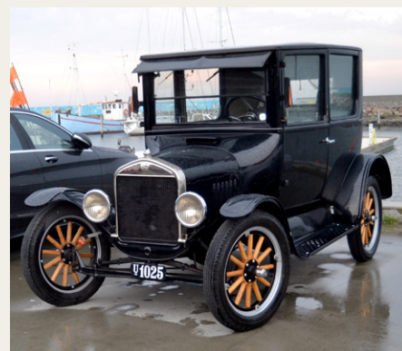
Dagens ældste deltager var denne flotte Ford T fra 1925.