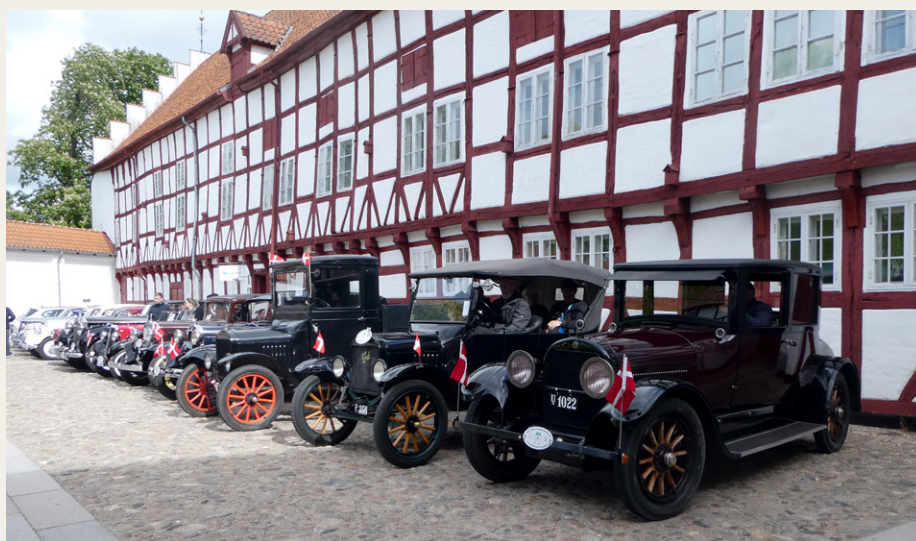
Man havde placeret de ældste biler lige inden for porten til Aalborgbus Slots gård.