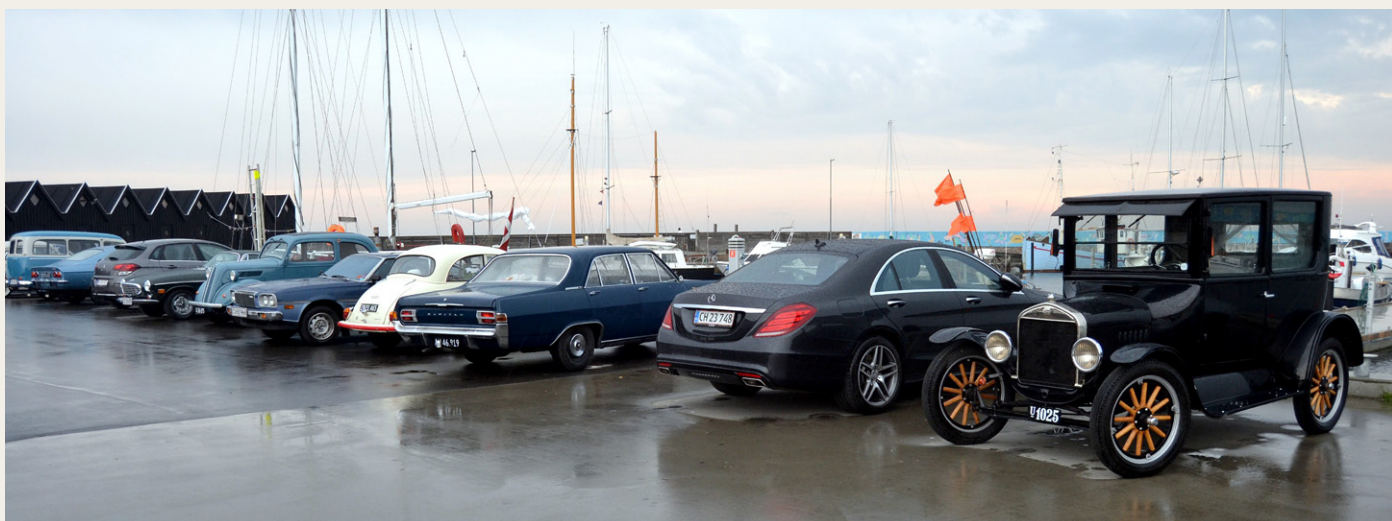
En enkelt moderne Mercedes Benz havde sneget sig ind mellem de flotte veteranbiler på den våde havneplads i Øster Hurup.