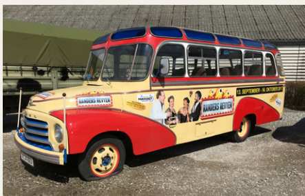
Den fine Opel Blitz.