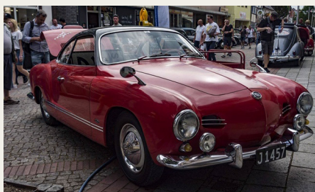
Rassers røde Karmann Ghia fra 1957