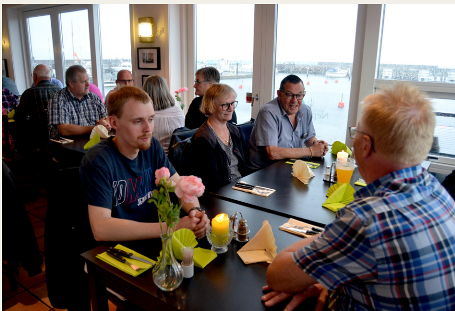
Mens vi ventede på maden kunne vi nyde den flotte udsigt over havnen i Øster Hurup.