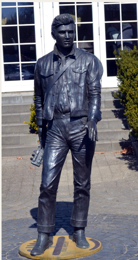
Elvis – Ham selv.