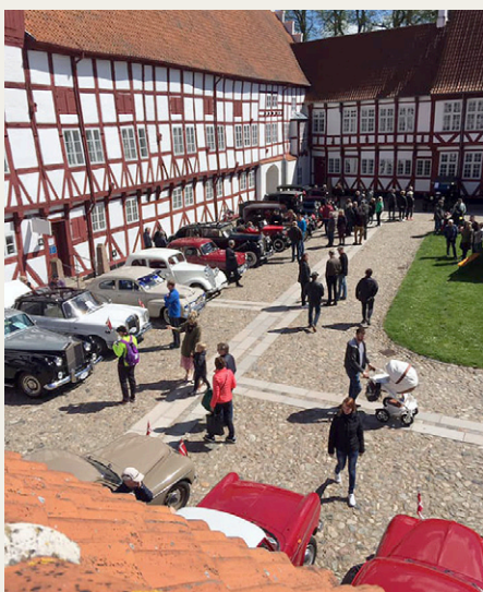
Flot view ned over slottets gård med de mange flotte veteranbiler.

af konfirmanden sammen med vores bil. De havde selv medbragt en professionel fotograf, som tog en række billeder af den unge dame ved og bag rattet i vores dejlige Peugeot. Da vi spurgte hvorfor det lige var vores bil, der blev udvalgt blandt de mange flotte køretøjer, var svaret, at konfirmanden var helt vild med Peugeot'ens flotte blå farve.