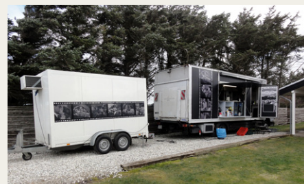
Køkkenvogne, så der kunne laves mad til alle.