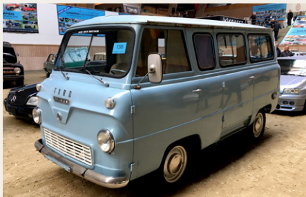
Den sjove Ford Thames fra 1963.

På auktionen var der ikke så mange rigtig gamle biler. En enkelt førkrigs Ford A Roadster, rigtig fin, gik for 155.000, ellers var Morris 1000, Volvo Amazon og Chevrolet Corvette i overtal. Priserne lå pænt højt, syntes jeg, i forhold til, at det er auktion. En sjov Ford Thames fra 1963, på svenske papirer og som trængte til lidt TLC, gik for 31.000, og en spændende