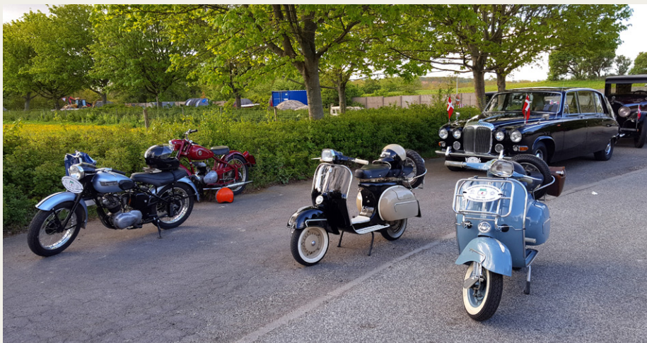
De tohjulede deltagere med „Krone 5“ i baggrunden er klar til afgang fra travbanen.