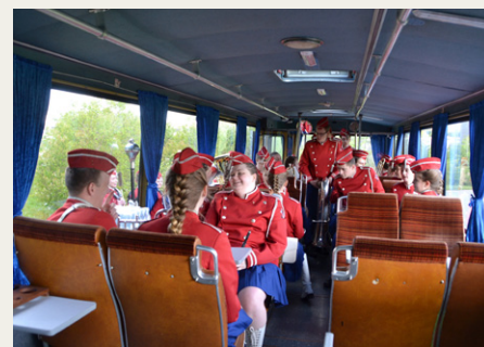
Aalborg Garden bygger sig i den gamle bybus.

For de deltagende køretøjer startede dagen ved travbanen på Skydebanevej, hvor alle deltagere fik udleveret et nummerskilt