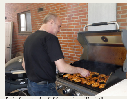
I gården var der fuld gang i „grilleriet“.