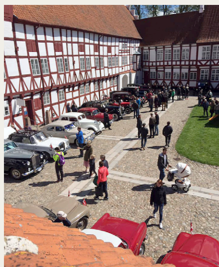
Flot view ned over slottets gård med de mange flotte veteranbiler.

af konfirmanden sammen med vores bil. De havde selv medbragt en professionel fotograf, som tog en række billeder af den unge dame ved og bag rattet i vores dejlige Peugeot. Da vi spurgte hvorfor det lige var vores bil, der blev udvalgt blandt de mange flotte køretøjer, var svaret, at konfirmanden var helt vild med Peugeot'ens flotte blå farve.