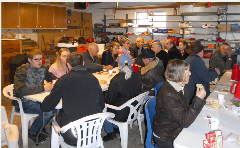
Efter ankomsten til Veddum var der kaffe eller te med rundstykker til alle deltagerne.

Efter endt pause og aflevering af løsnin-ger, kørte vi videre mod vest af pæne ruter over Lindenborg, Håls, Gjerding, Sejlstrup og Helligum for at holde pause ved