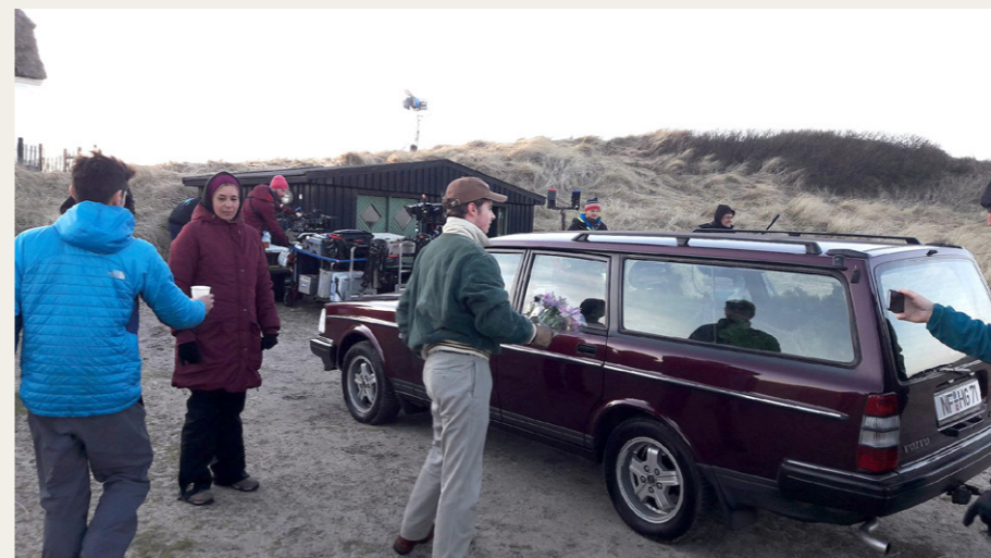
ABs Volvo 240 med tyske nummerplader og juletræ i bagagerummet.