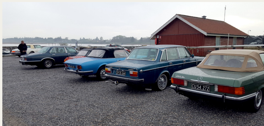
De sidst ankomne køretøjer blev henvist til en regnvåd grusparkeringsplads.

havnen på telefon, satsede vi på, at de selv havde valgt at køre til Øster Hurup, så vi vendte bilerne og kørte mod bestemmelsesstedet: Restaurant Neptun på havnen i Øster Hurup. Inden vi nåede Dokkedal var det begyndt at regne. I Øster Hurup mødte vi de øvrige deltagere, som ganske rigtigt havde valgt at køre til restauranten,