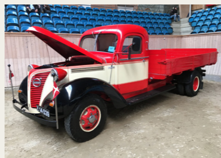
Volvo Lastbil fra 1939. Kilometertælleren viste 915.594 km!