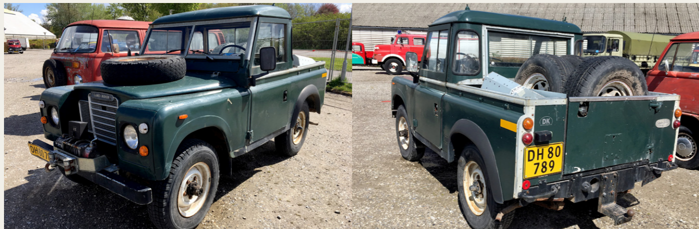
Land Rover'en jeg ikke fik med hjem.