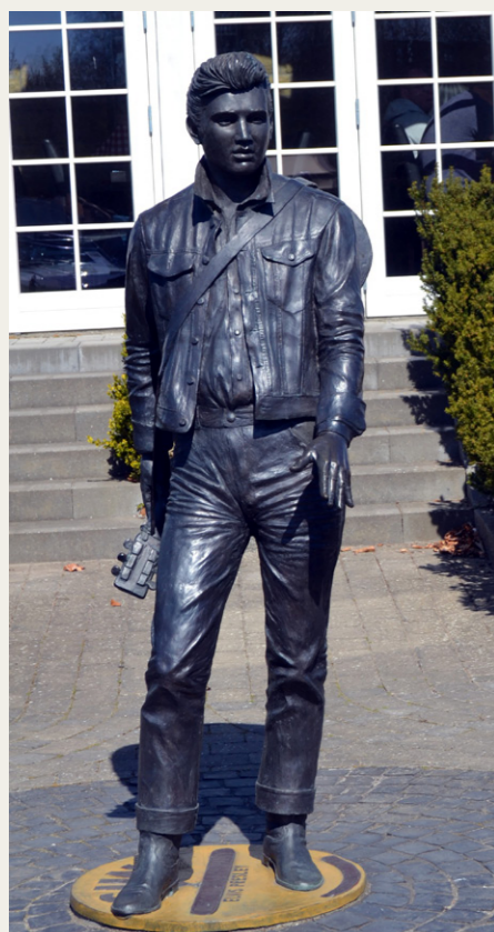
Elvis – Ham selv.