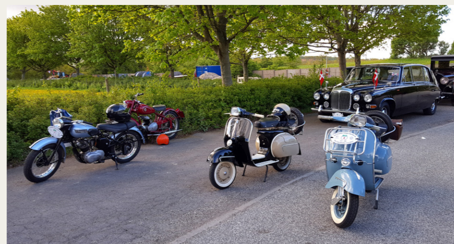
De tobjulede deltagere med „Krone 5“ i baggrunden er klar til afgang fra travbanen.