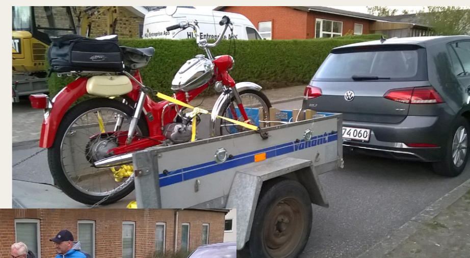
Formanden klar til afgang fra Sønderholm mod Forchhammersvej 5 i Aalborg.

kulde. Enighed om en reduceret køretur i nærområde, som gik til Egholm-færgen ad snørklede ruter. Herefter retur til Forchhammersvej 5, hvor kaffe og brød blev indtaget i varme og hygge.