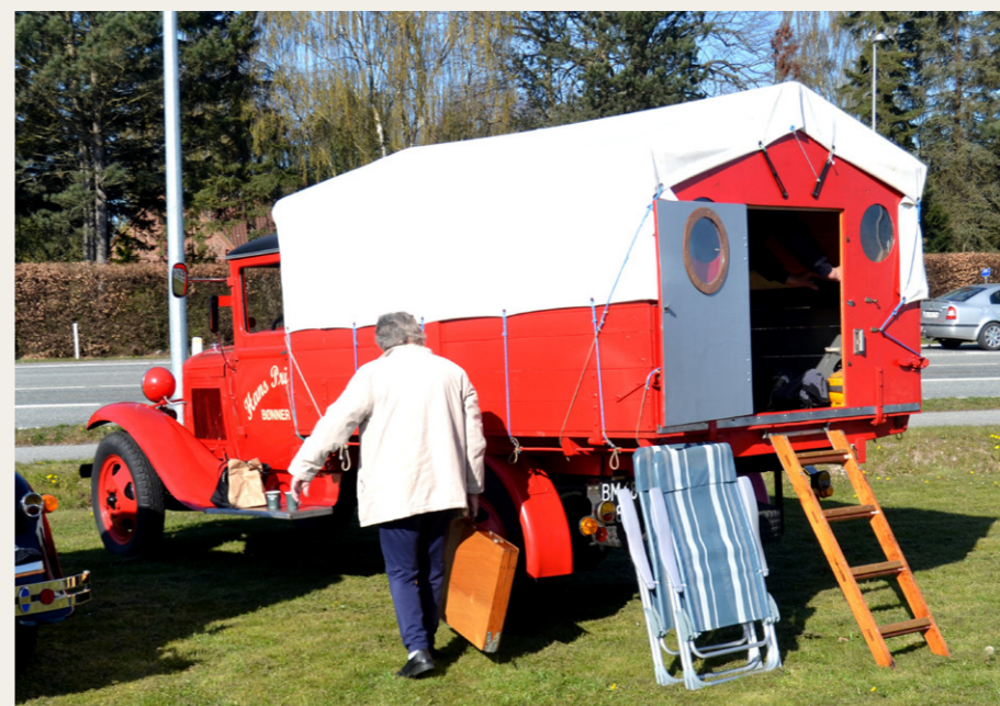
Der er mange udgaver af „Auto Camper“, her en af de lidt ældre årgange.