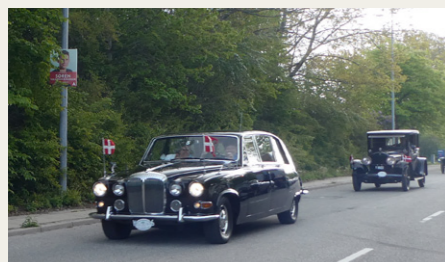
Lindbarvts Daimler „Krone 5“ kører som den første bil fra travbanen ind mod Aalborghus Slot.