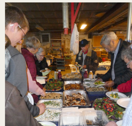
Efter køreturen var der dækket op med grillstegte koteletter og kyllingebryst og hertil masser af kartoffelsalat og salat. Senere kom der også grillstegte polser på bordet.