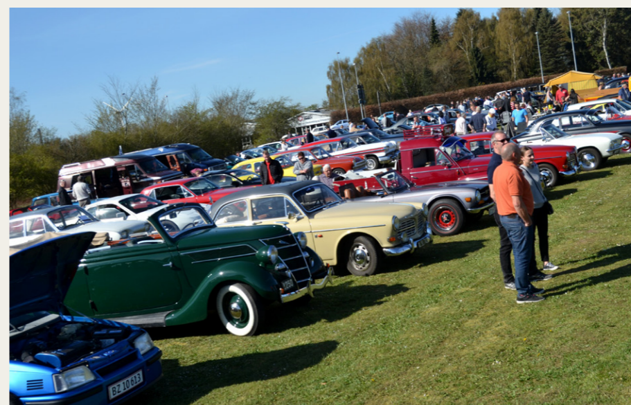
Kik ud over træfpladsen.