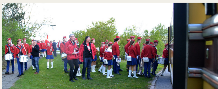
Aalborg Garden stiger om bord på bussen ved Tjener-Kokkeskolen på Rørdalsvej, efter at garden var gået forrest gennem Limfjordstunnelen.