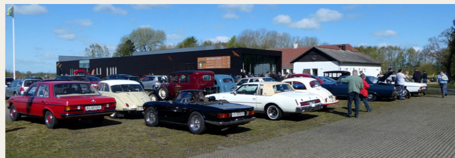
Første stop på turen var ved Lille Vildmosecentret ved Dokkedak.