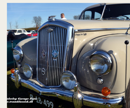
Der var også andre fine Wolseley'er på dagen.