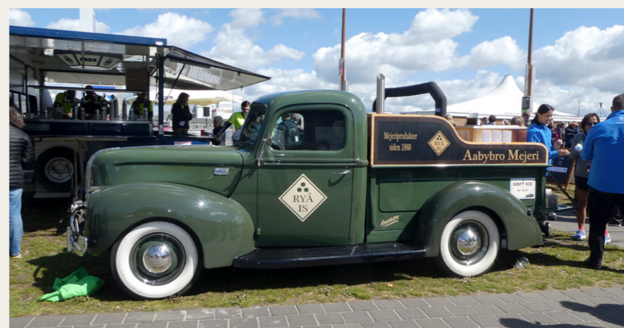
På den anden side af Nyhavnsgade blev der leveret masser af lækker softice ud fra Rya Is' flotte 1941 Ford V8 1½ Tons Pickup Truck „Isbil“.

til at sætte på bilen plus deltagerliste, dagsprogram, kørselsanvisninger, madbilletter til sandwich og is og (som det vigtigste?) en parkeringsbillet, som gav tilladelse til at parkere i slotsgården hele dagen. Efter alle køretøjer var linet op i nummerorden kørte vi i kortege ind til Aalborghus Slot. Det vil sige, vi startede som en kortege, men da der ikke var nogen form for ekstra trafikregulering, blev vi delt op af lysreguleringer og vigepligtsregler. Det gik nu ganske udmærket, og omkring klokken 09.45 var de fleste på plads i Slotsgården. Det var i forvejen bestemt, at bussen, en deltagende lastbil og Lindhardts Daimler „Krone 5“ skulle parkere uden for porten.