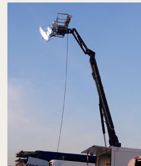
Når man ikke kan tage sig sammen til at filme om dagen, må man jo skabe sit eget dagslys.