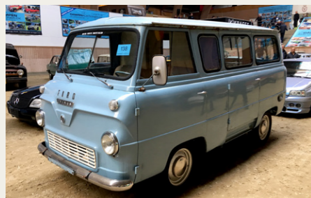
Den sjove Ford Thames fra 1963.

På auktionen var der ikke så mange rigtig gamle biler. En enkelt førkrigs Ford A Roadster, rigtig fin, gik for 155.000, ellers var Morris 1000, Volvo Amazon og Chevrolet Corvette i overtal. Priserne lå pænt højt, syntes jeg, i forhold til, at det er auktion. En sjov Ford Thames fra 1963, på svenske papirer og som trængte til lidt TLC, gik for 31.000, og en spændende