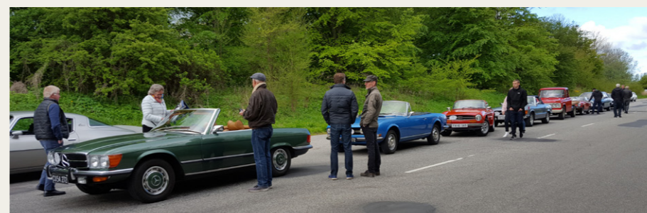
Bilerne bliver linet op i nummerorden på Skydebanevej inden vi kører ind mod Aalborghus Slot.