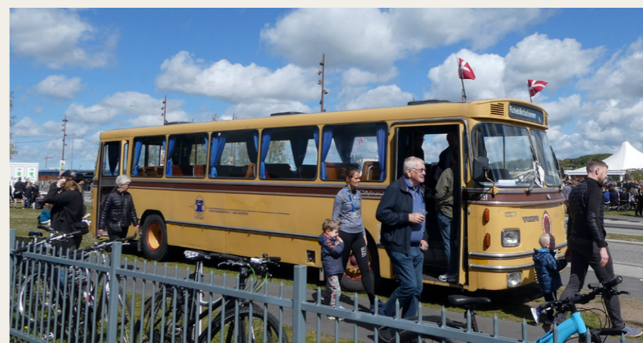
Vores fine gamle bybus havde fået sit helt eget „Stoppested“ udenfor slottet.