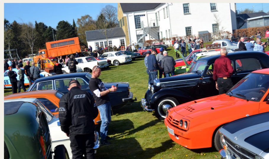
Kik ud over træfpladsen.