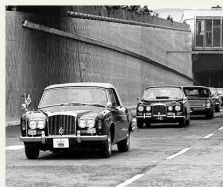
Ved Limfjordstunnellens åbning i 1969 kørte Kong Frederik IX forrest i sin nye Bentley Cabriolet.