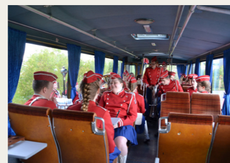
Aalborg Garden hygger sig i den gamle bybus.

For de deltagende køretøjer startede dagen ved travbanen på Skydebanevej, hvor alle deltagere fik udleveret et nummerskilt