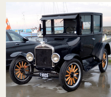
Dagens ældste deltager var denne flotte Ford T fra 1925.