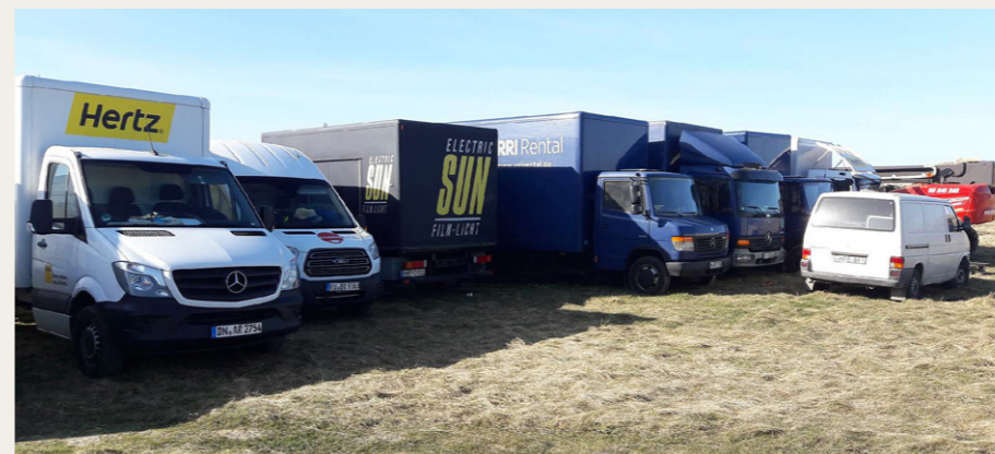
Hele seks lastbiler skulle der til for at transportere alt udstyret.