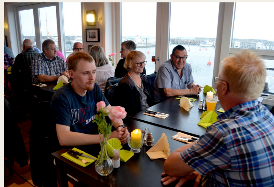
Mens vi ventede på maden kunne vi nyde den flotte udsigt over havnen i Øster Hurup.