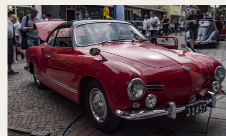
Raspers røde Karmann Ghia fra 1957