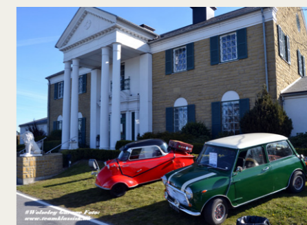
Memphis Mansion i perspektiv.

stod på hele dagen. Om middagen var der mulighed for at købe sandwich og drikkevarer eller spise i restauranten. Der var virkelig pres på alle steder, for i stedet de forventede 130 - 150 deltagere, kom der over 400 deltagere, men der var plads til alle på det dejlige areal omkring Museet.