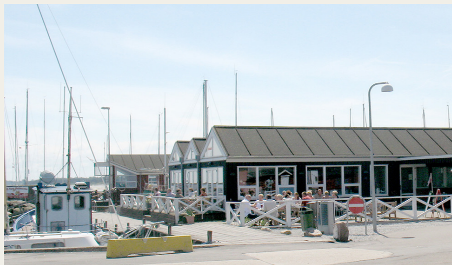
Restaurant Neptun er placeret helt ude ved kanten af havnebassinet, og om sommeren, hvor dette billede er taget, er der virkelig muligt at nyde den gode udsigt sammen med den gode mad.

Derefter gik turen østpå mod Egense – et planlagt smut indenom Klarup og Storvorde blev valgt fra på grund af tidspresset – og efter en smuk tur ned omkring Skellet nåede vi Kystvejen mellem Egense og Egense Havn. Planen var jo, at vi skulle møde nogle flere deltagere på