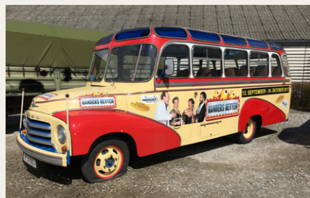
Den fine Opel Blitz.