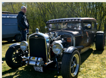
Der var mange forskellige køretøjer til stede.

Der var gratis kaffe og rundstykker, som kunne nydes i det dejlige solskinsvejr, der