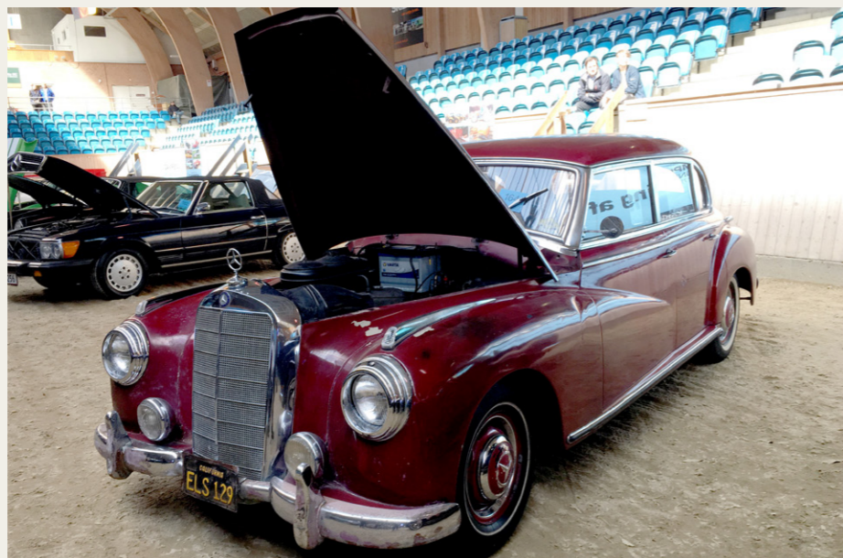
Den „spændende“ Mercedes Adenauer.

Mercedes 300 Adenauer fra 1954, som trængte til den helt store tur, beskrevet som „med en flot patina“, læs: den er rusten overalt, interiøret er i laser, lak og krom er grim, gik for 180.000,- det er biler som går for over 750.000,- i Tyskland, når de er topresterede, men der var også et stykke vej!