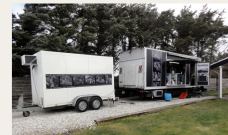
Køkkenvogne, så der kunne laves mad til alle.