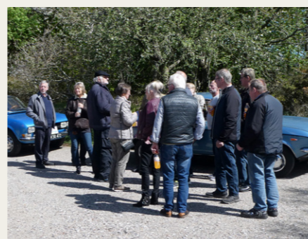
Hver gang der var et stop fandt deltagerne hurtigt sammen til hyggelig snak.