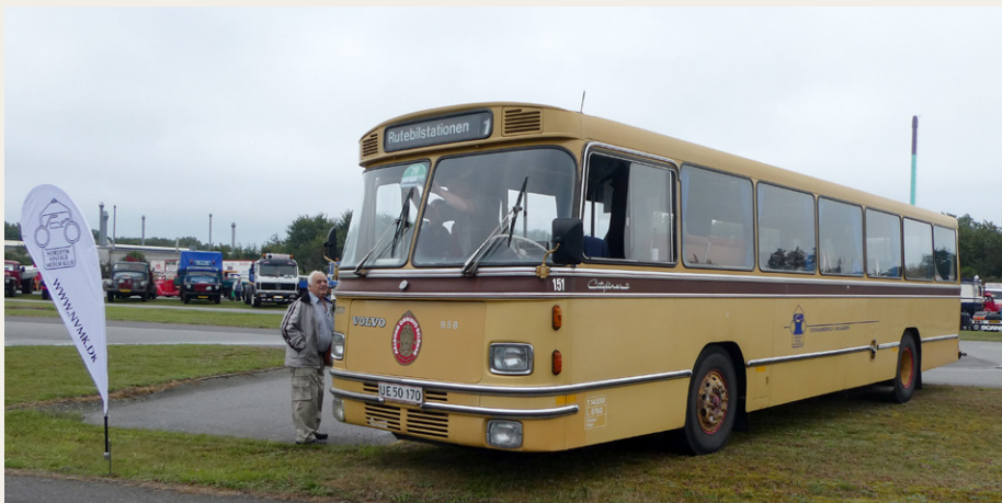
Nordjysk Vintage Motor Klub viste både „Flaget“ og bussen frem i Sæby.

Igen i år deltog Nordjysk Vintage Motor Klubs gamle Volvo bus i arrangementet, hvor den havde fået start nummer 70. Deltagernumrene tildeles efter årgang, så bussen befandt sig aldersmæssigt ca. midt i feltet, som årgangsmæssigt spredte sig