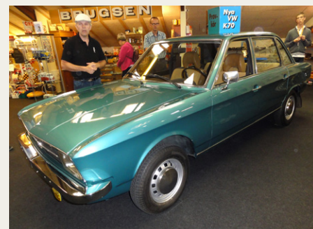
VW købte i 1969 konkurrenten NSU og umiddelbart herefter, før præsentation af K70 modellen, blev NSU-skiltet udskiftet med VW K70. Denne flotte 1973 model købte Carsten i dens nuværende stand af et svensk museum.