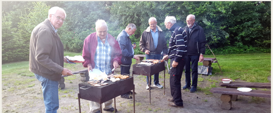
De mandlige deltagere måtte finde sig i rog og stegeos, mens de sikrede sig, at både bøffer og polser fik den helt rigtige svedne farve.