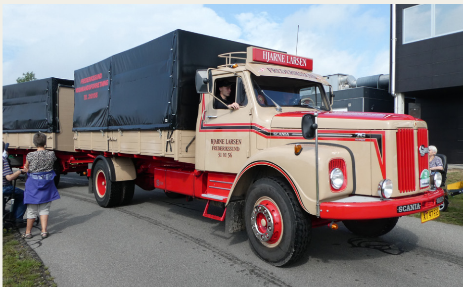
Deltagerne valgte Hjarne Larsens flotte Scania L 76 Super fra 1965 som arrangementets flotteste køretøj.