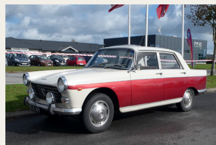
Blandt de mange flotte veterankøretøjer faldt jeg for denne flotte Peugeot 404 Berline fra 1971.