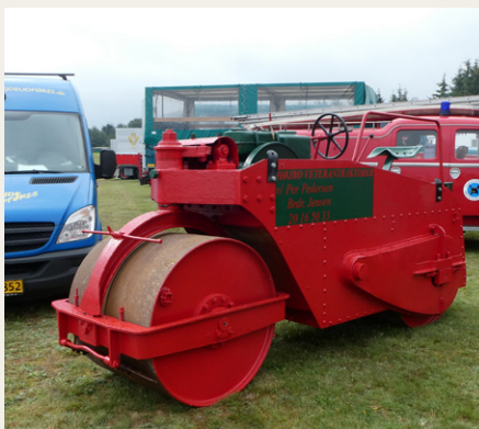
Det var ikke kun lastbiler og busser, der var udstillet på pladsen i Sæby. Blandt de mange andre ting kunne man se denne renoverede vejtrømler fra Kastrup Maskinfabrik