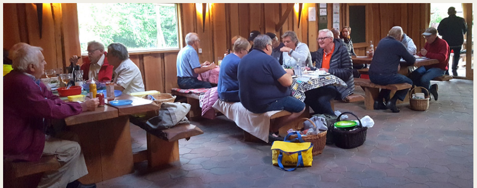
Den medbragte mad blev indtaget i ly for den kølige vind.