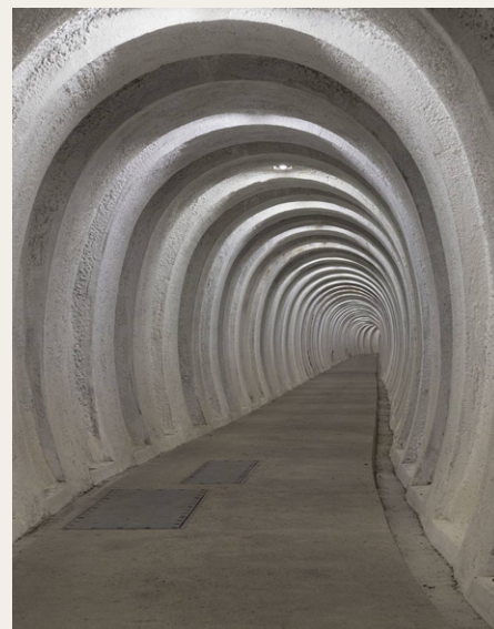
Den 4. november skal vi høre en hel masse om Regan Vest, som vi forhåbentlig får mulighed for at besøge engang i nær fremtid.

Historiske Museum og holder foredrag og viser billeder om, hvad der i daglig tale kaldes „ Regan Vest “. Regeringsanlægget Vestdanmark, der er det officielle navn, blev i al hemmelighed opført i årene 1963 - 1968. Bunkeren havde til formål at huse både regering, kongehus og forsvar i tilfælde af en tredje verdenskrig, og den har stået klar til netop det formål i mere end fire årtier. I 2014 valgte Kulturstyrelsen at frede anlægget, som i dag står komplet med alt originalt interiør. Fredningen var det første skridt mod at åbne Regan Vest for offentligheden. Bunkeren er et helt unikt stykke uberørt dansk kulturarv, der rummer en historie om Den Kolde Krig, som aldrig er blevet formidlet. Det er tanken, at vi i NVMK, så snart det bliver muligt at komme ind i bunkeren, arrangerer en udflugt til bunkeren, hvor vi – efter at have hørt hele baggrundshistorien denne aften – ved selvsyn kan se