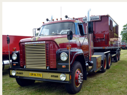
Flot International trækker med sætterravn med beboelse.