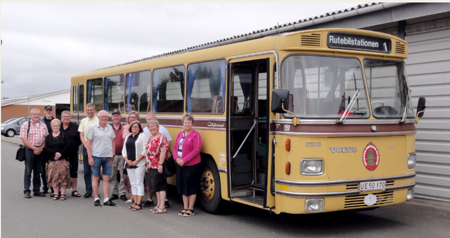
Deltagerne på turen fotograferet foran bussen. På billedet mangler fotografen Poul K.

Gennem 1960'erne og -70'erne var VW pick-up'en og „rugbrødet“ meget udbredt som arbejdsheste både for de mindre håndværksvirksomheder og for større firmaer. 99,9% har endt deres dage hos skrothandleren efter et hårdt liv, men