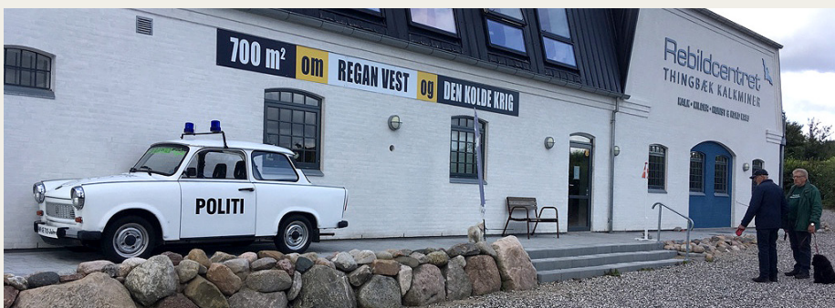
Turen sluttede ved Thingbæk Kalkminer/Rebildcentret, som blandt andet indeholder en stor udstilling om den kolde krig i halvtresserne og tresserne. Trabant'en er en gave til den gamle Skørping kommune fra deres østtyske venskabsby Gelenau.