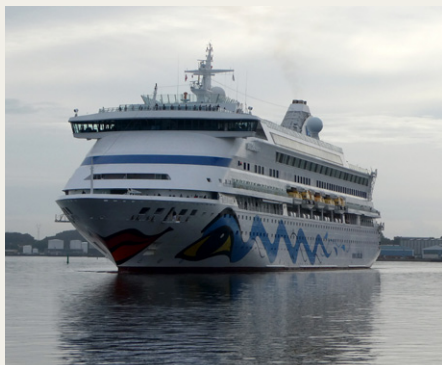
AIDAaura på vej mod Honnørkajen en tidlig sommormorgen.

Vejrudsigten for den 18. august var nogenlunde, men der var dog risiko for lidt regn. Om morgenen var vejret godt nok til at vi kunne køre til Aalborg med kalechen slået ned, men i løbet af formiddagen begyndte der at småregne. Vi var to med åbne biler, og vi håbede længe, at der blot var tale om nogle småbyger, som