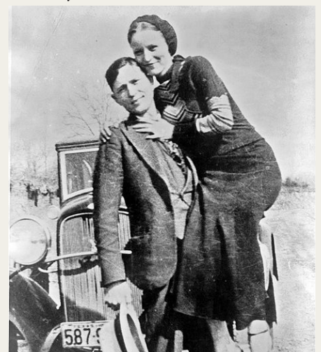
Clyde Barrow sammen med Bonnie i 1934

„For sin vedholdende hastighed og frihed for problemer overgår Ford alle andre biler, og selvom min virksomhed ikke har været strengt lovlig, skader det ikke noget at fortælle dig, hvilken fin bil man får i en V8.“ Sådan skrev Clyde Barrow i et brev til Henry Ford.