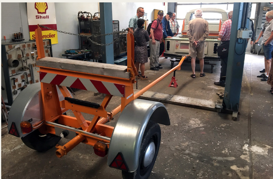
T2 dobbeltkabine under renovering, med tilhørende Westfalia efterløber.

der er flere eksemplarer bevaret på VW museet. Under renovering er en dobbeltkabine fra 1977. Denne er fundet på Grønland, hvor klimaet og veje uden salt gør, at bilerne ikke ruste som i Danmark. Efter renovering skal dobbeltkabinen sammenkøbes med en Westfalia efterløber til transport af f.eks. flagstænger eller lange rør. Inspirationen til dette kommer fra et billede på en gammel VW reklameplakat, og den sjældne efterløber er fundet i Tyskland.