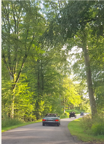
Den forreste del af kolonnen på vej gennem Oxholm Skov.