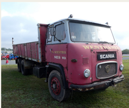
Ikke alle fremmødte køretøjer var i lige god stand. Det skal dog tilføjes, at denne Scania ikke deltog i veteranrallyet.