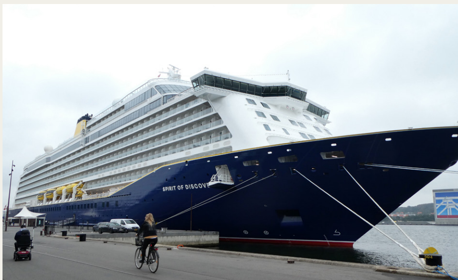
Verner Det 236 meter lange Spirit og Discovery fylder ganske meget ved Honnørkajen i Aalborg.