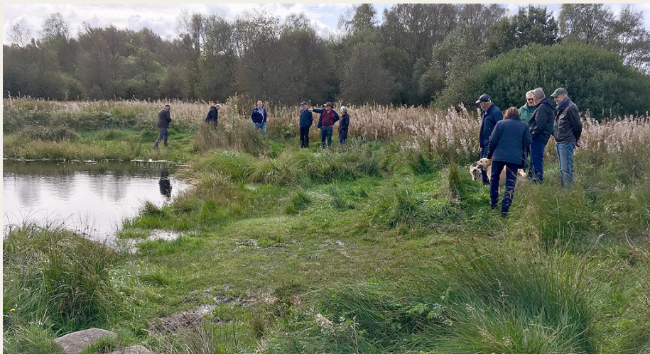
Det sumpede område ved Store Blåkilde gav våde fødder til flere af deltagerne.