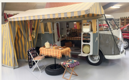
Meget flot og sjældne VW Westfalia campingbus fra 1963 med alt det originale indretning og tilbehør. Bemærk at reservehjulet anvendes som udendørs fod til bordet, der ellers er monteret mellem sæderne i bilen.