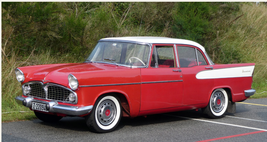
En norsk gæst var mødt op i denne meget flotte Simca Vedette Beaulieu fra omkring 1960.