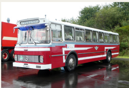
NVMK var ikke alene om at fremvise en bus. Fra Norge deltog denne Mercedes-Benz 0317 fra 1971.