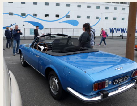
Den blå Peugeot var en populær fotomodel.

Og så så vi også mange af passage-erne, som blev fotograferet sammen med undertegnedes blå Peugeot 504 Cabriolet.