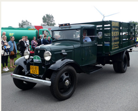
Veteranrallyets ældste deltager var denne Ford BB V8 fra 1934.

Ruten var delt i to etaper – en nordlig og en sydlig – og alle deltagerne startede på skift med at køre henholdsvis nordpå og sydpå ved starten først på dagen, og modsat om eftermiddagen. På den måde fik man fordelt belastningen på de poster, der var indlagt på ruten, fordelt over hele dagen, med det resultat, at køerne ved