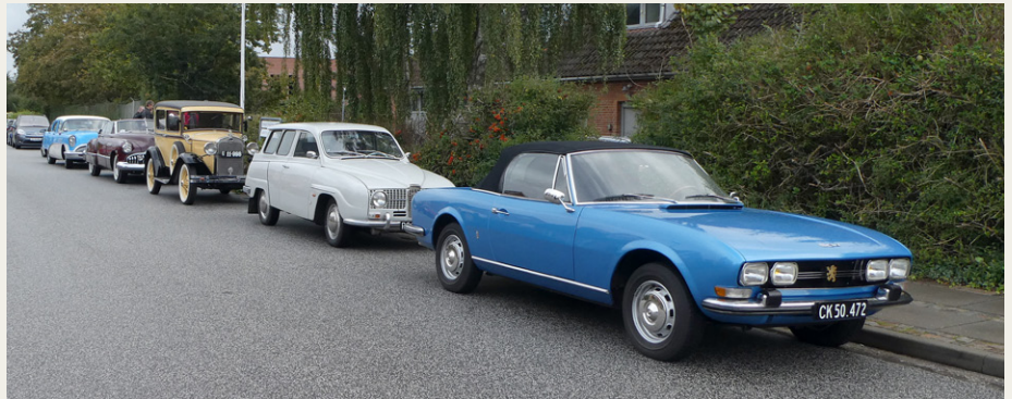
Fem af de otte biler, som startede fra Aalborg. Kalechen er slået op, fordi der kom en lille byge, inden vi startede fra Aalborg. Kalechen var nede igen inden vi kørte mod Støvring, og den blev nede resten af dagen.