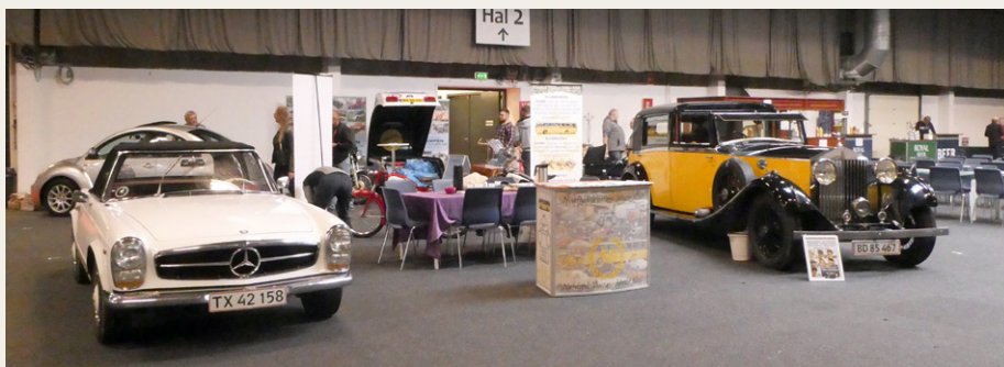
NVMK's stand på Aars Stumpemarked er klar til at modtage gæsterne.