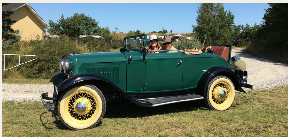
Olaf med hele familien er klar til hjemturen.