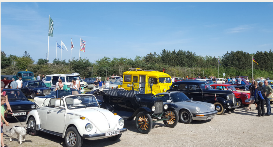
De ca. 100 køretøjer udgjorde et smukt syn i det dejlige sommervejr.