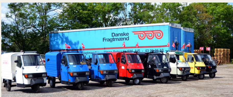
Også de helt små, som efterhånden er blevet meget populære, var kommet til lastbilstræf i Skelund.