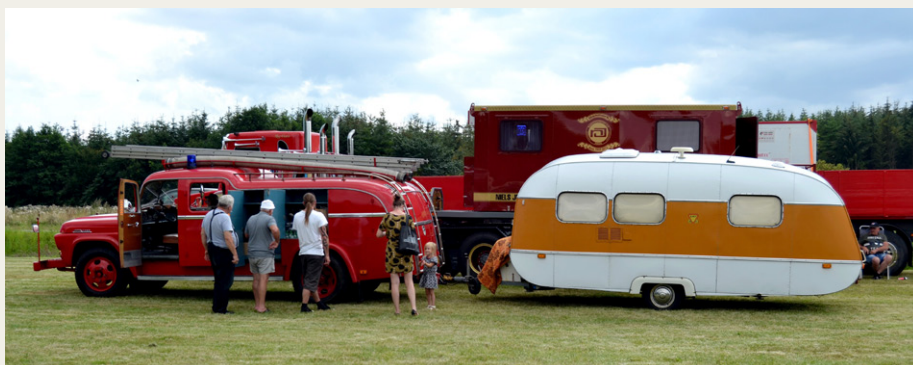
En fin gammel Brandsprøjte med bus bagefter (God til efterslukning).