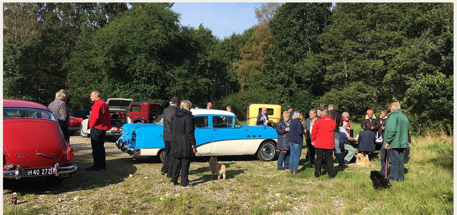
Kaffepause ved Nørlund Savværk i det smukke sensommervejr.