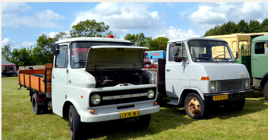
Der var også de mellemstore lastbiler/varevogne som man busker fra sin „læretid“.