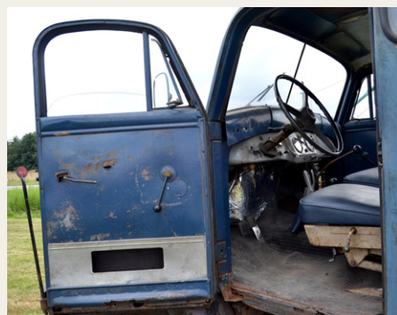
Andre kører rundt som de er, men selvfølgelig i lovlig stand.