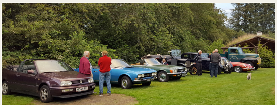
Et udsnit af de deltagende biler på plænen på Skipper Klements Plads i Ryå.