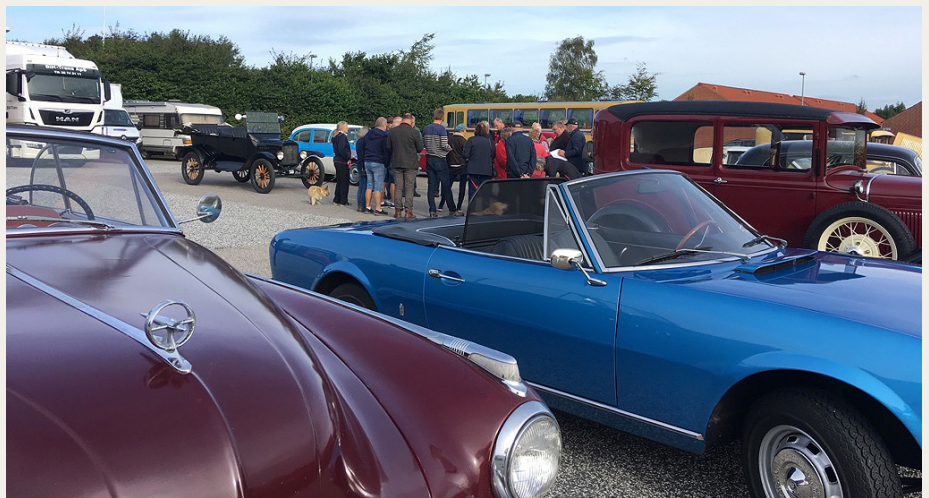
Inden starten fra Støvring mødes vi til en kort briefing.