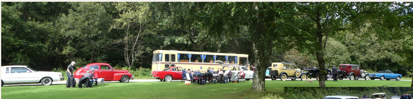
Frokost i det grønne. Den skønne natur og det dejlige sensommervejrr var en perfekt ramme om frokosten på rasteplassen syd for Skørping.