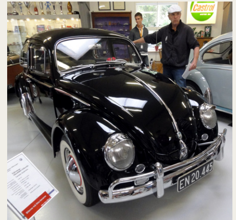
Sort 1-ejers VW 1200 de Luxe fra 1959 med 85.000 km „på klokken“ og med et usædvanligt højt udstyrsniveau. Nå ja, ejeren var en ugift, vel-lønnet person.

vi tilbudt en rundvisning af Carsten, hvilket gjorde besøget meget mere spændende end bare at gå rundt og se museet på egen hånd.