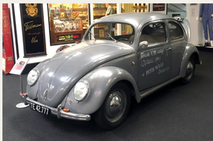
Ældste VW på museet, en Type 1 fra 1949, og som teksten på døren siger, den første VW solgt i Jylland.

uvæsentligt millionbeløb) fra en ældre mand, efter at de havde mødt hinanden på en rejse og efterfølgende havde mødtes og rejst sammen nogle gange. Bilen står i oprindelig stand og maling og med en kilometerstand på kun 48.000 km.