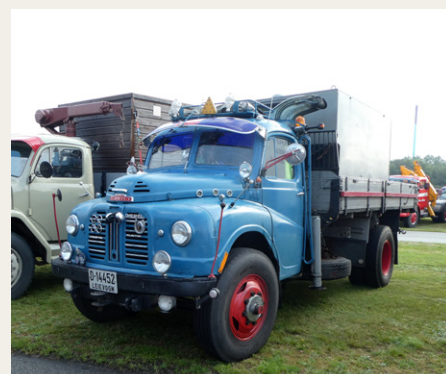
Blandt de mange norske deltagere var denne sjældne Austin Loadstar fra 1954