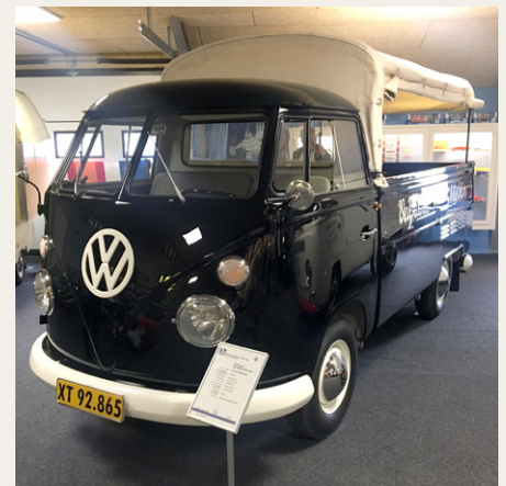
Sort T1 pick-up, der blev anvendt både til møbeltransport og som rustvojn.