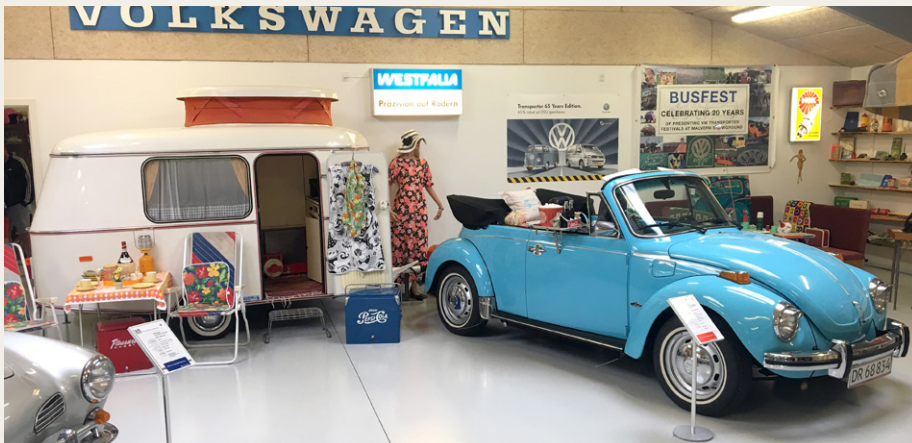
Den flotte 1303 cabriolet, som blev starten til museet. Her opstillet med Hymer Puck campingvojn og med bakke med popcorn og cola på døren, så den er lige klar til en tur i drive-in biografen.