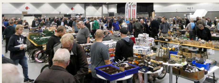
Aars Stumpemarked var meget godt besøgt denne gang.