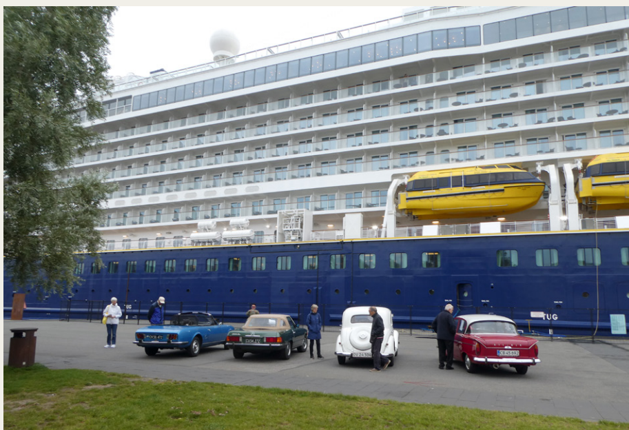
Fire biler havde fundet vejen til Honnørkajen denne kolige efterårstirsdag.

Fire køretøjer til sådan et arrangement er ikke meget, og vi kunne da også have ønsket os, at der havde været dobbelt så mange eller flere, men vi har fået tilbagemelding fra VisitAalborg, om at flere af passagererne havde udtrykt taknemmelighed over, at der overhovedet var veteranbiler til stede på Honnørkajen. Så er det jo ikke helt spildt.