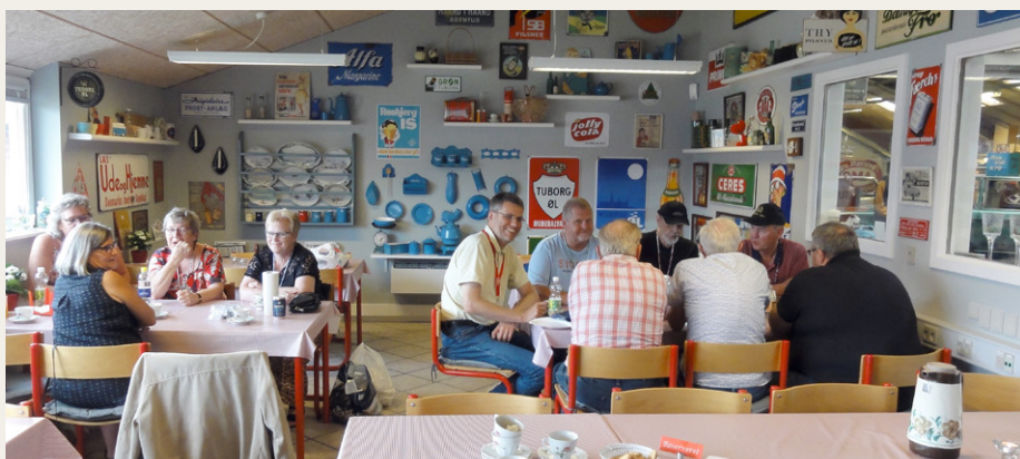
Uden mad og drikke ....., Medbragt frokost blev indtaget i cafeen. På væggene i cafeen en fantastisk samling af skilte m.v.