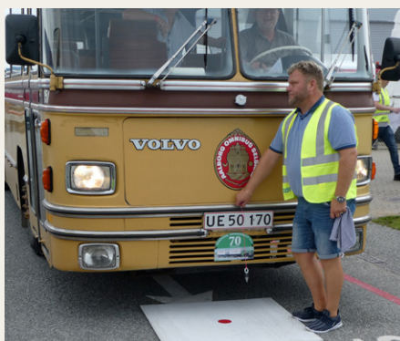
Det gælder om at få loddet til at ramme lige over den røde plet.