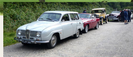
Veteranbiler på parkeringspladsen ved Store Blåkilde.