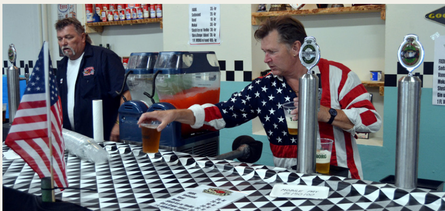
Så er baren åben.