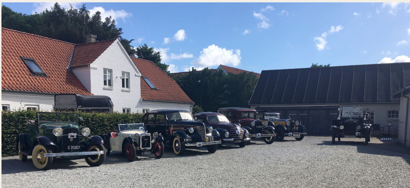
Herligt billede fra gårdspladsen imens kaffen indtages. Ford V8, Austin Seven, Chevrolet, Hanomag, Ford A, Rolls Royce og Ford T.