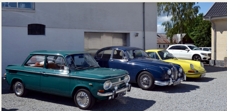
Tilskuerne kom i mange forskellige veteranbiler.