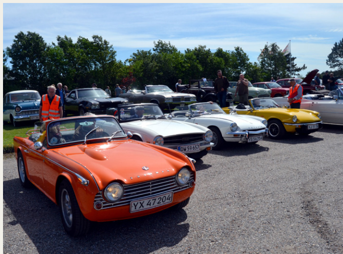
Så sætter vi rækken af Triumph biler på plads.