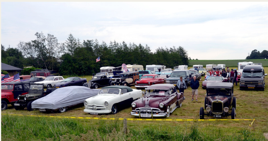
Marken overfor blev hurtigt fyldt op med amerikanerbiler, da de var færdige med at køre tur om formiddagen.

Steen Gaarden, som laver Costum Paint, viste sine færdigheder, og det var virkelig håndværk. Udenfor var der en hel