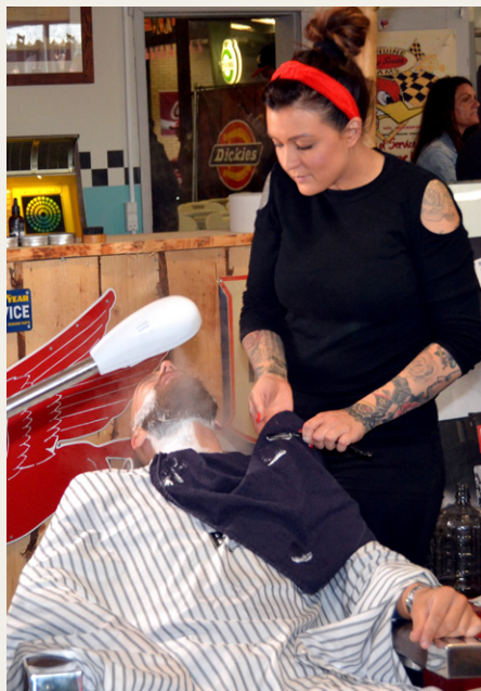
Klar til barbering, med kniven for struben.