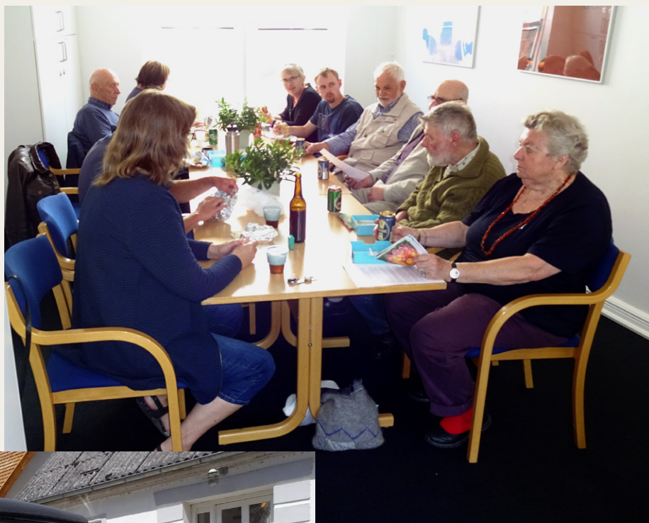
I Nibe Bios lokaler spises madpakker