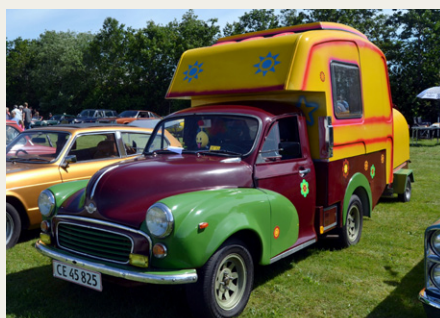
Forfra med de lidt specielle Hippie / flower-power farver.

Registreringen krævede dog, at der blev betalt afgift, da den skulle over på hvide nummerplader.