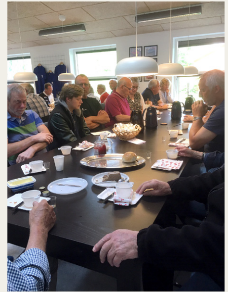
Trods de alvorlige miner blev morgenkaffen indtaget under hyggelige former i Midtvevdsyssel Veteranbilklubs flotte klublokaler på Vester Hjermitslev Skole.