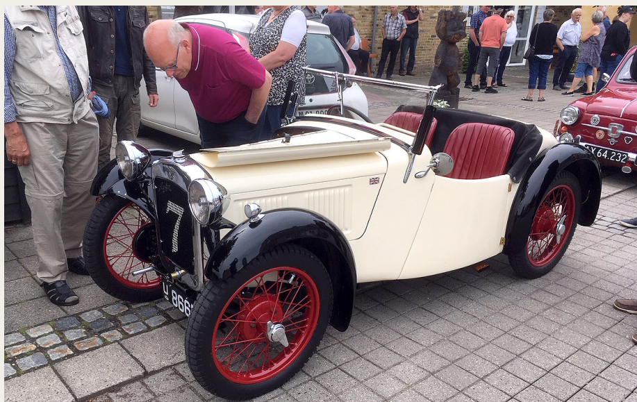
Rainer Mittelstädt's flotte Austin Seven Nippy fra 1935 blev beundret af mange af de øvrige deltagere.