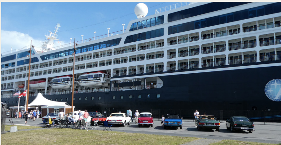
Selv om Azamara Journey ikke er noget stort krydstogtskib, ser de otte veteranbiler ikke ud af meget med skibet som baggrund.

Verdens første „Drive-in“ benzinstation blev åbnet i 1913 af Gulf Refining Company på hjørnet af Baum Boulevard og St. Clair Street i Pittsburgh, Pennsylvania under mottoet: „Good Gulf Gasoline“.