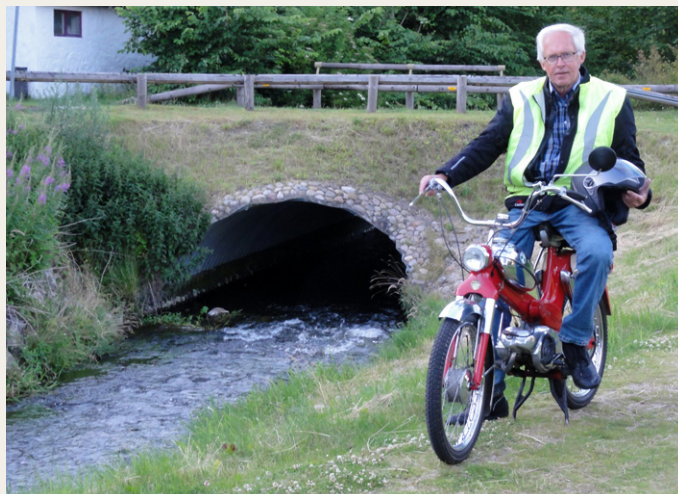
Man kan næste høre vandets rislen.