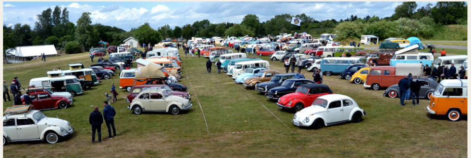
Kik ud over udstillingspladsen.

Det er et sted hvor folk hygger sig, uanset vejret, for det har jo noget med påklædning at gøre, og det er jo med at holde humøret højt uanset vejret. Og det så også ud til at gælde for deltagerne i træffet, for der var langt over 300 VW køretøjer til stede.