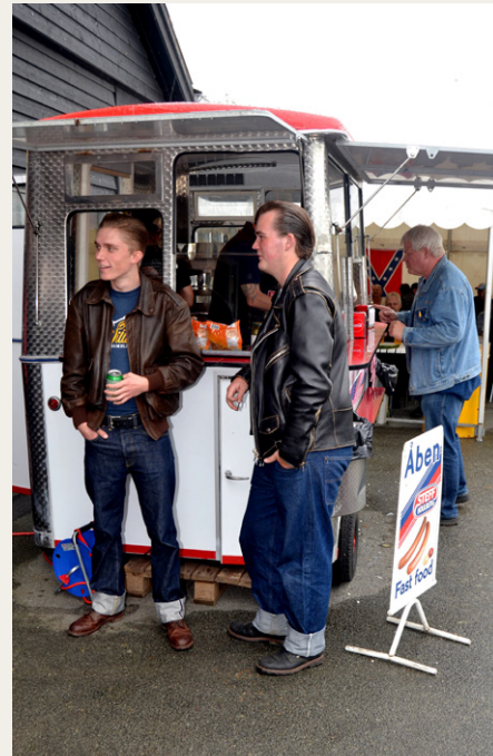
Rigtige idoler med olie i håret og opslag i bukserne, hænger ved en pølsebod.