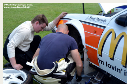
Der „makkes“ altid med et eller andet i pitten.