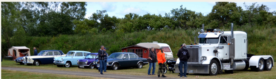
Både store og små, af andre veterankøretøjer, der var ankommet til træfområdet.