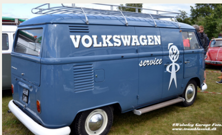
Rigtig fint med de originale reklamer på køretøjet.

Da jeg ankom, var der ikke det helt store fremmøde af andre veterankøretøjer, men vejret var også i det lunefulde hjørne. VW-bilerne var stillet frem til parade, og det så rigtig godt ud (der var orden i sagerne), og det var rigtig spændende at se så mange forskellige måder at lave sin egen stil og udseende på sit køretøj. Der holdt stadig også en del VW'er på selve Campen, og det gav anledning til en rundtur blandt campingvogne og telte. Salgsboder er der også en del af, med både nye og brugte reservedele samt mange andre gode ting.