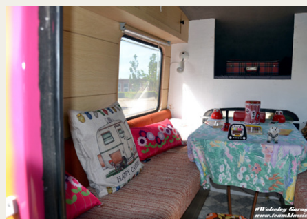
Et kik ind i den specielle autocamper, hvor der faktisk er plads for to voksne at sove.