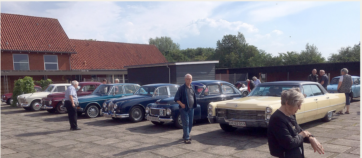
En del af de mange deltagende køretøjer parkeret ved Vester Hjermitslev Skole, hvor Midtvevdsyssel Veteranbilklub har klublokaler.