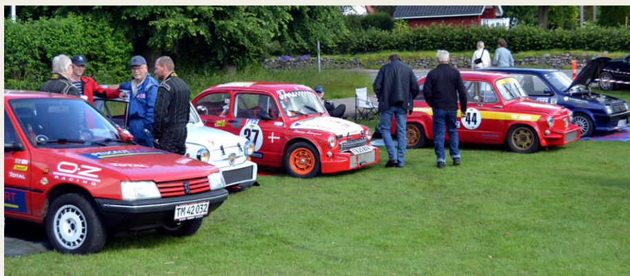
Mange forskellige slags biler er repræsenteret til dette race.

byen ligger der også et flot sted, hvor vi får lov til at parkere vore veteranbiler, som et ekstra tilbud til de mange tilskuer, der kommer på dagen.