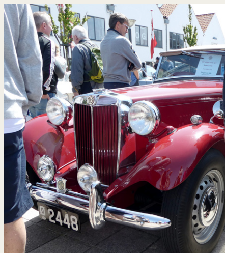
Denne flotte MGTD fra 1950 fik tredjepladsen i konkurrencen for gamle biler.

yce og en stor royal Daimler. Arrangørerne var vist bange for, at de store tunge biler ville trykke for hårdt på det sarte græs omkring fodboldbanen. Til gengæld fik de tre biler lov til at køre forrest i den lange karavane mellem Hune og Blokhus.