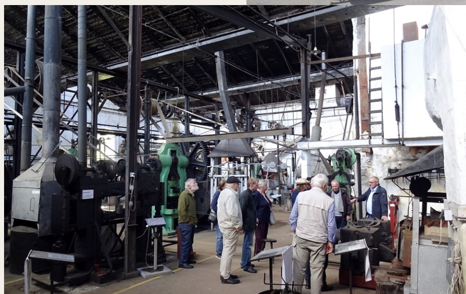
Så er der gang i Hammerværket.