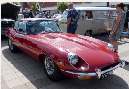
Per Pedersen fra Kås fik en andenplads med denne Jaguar E Type fra 1970.