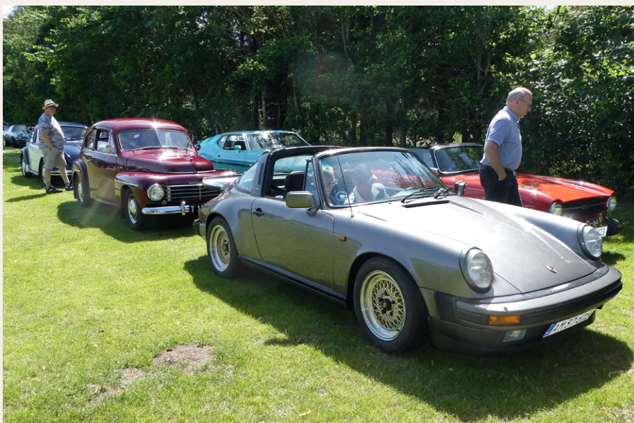
Inden afgang mod Torvet i Blokhus blev bilerne linet op på Hune stadion.