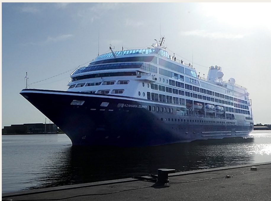
Azamara Journey ankom til Honnørkajen i Aalborg i strålende solskin.

Azamara Journey er et af tre mellemstore krydstogtskibe tilhørende et amerikansk rederi, som har specialiseret sig i at sejle på de destinationer, som de store krydstogtskibe ikke kan nå. Skibet er bygget i Saint-Nazaire ved den franske atlantehavskyst i 1999 og søsat den 17. januar 2000, som nummer seks ud af i alt otte krydstogtskibe til rederiet „Renaissance Cruises shipping company“, og det hed oprindeligt „R Six“. Skibet har båret navnet Azamara Journey siden 2007.