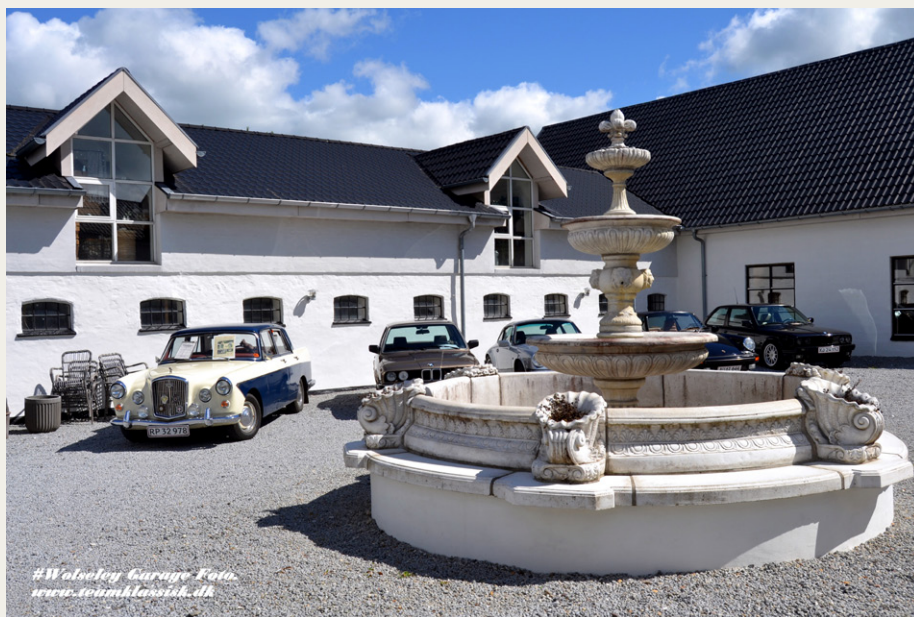
Her den fine gårdsplads vi kan holde på med vore Veteranbiler.