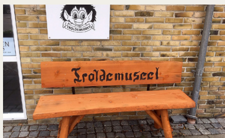
For trøtte gæster er der mulighed for at få et lille hvil på bænken udenfor Trolde-museet.