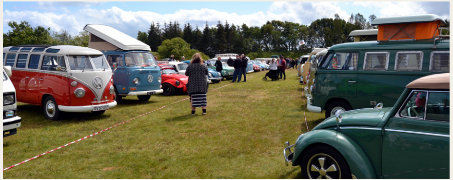
Alle de fine køretøjer stod fint på række til beskuelse.