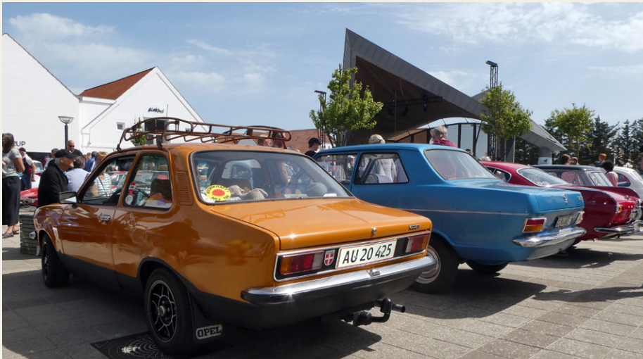
Det var ikke kun prestigebiler og sportsvogne, der prydede Torvet i Blokhus denne lørdag. Almindelige hverdagsbiler var blandt andet repræsenteret af disse to Opel Kadett. Den orange er en Kadett C fra 1979 og den blå er en Kadett B fra 1971.