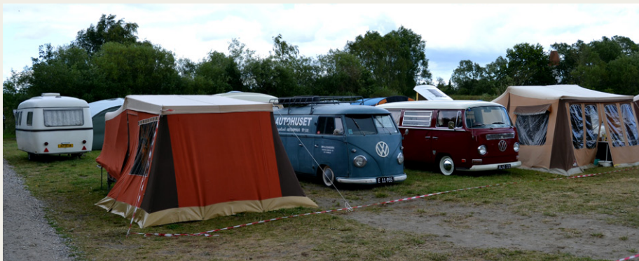
Ro og orden på Campingpladsen.