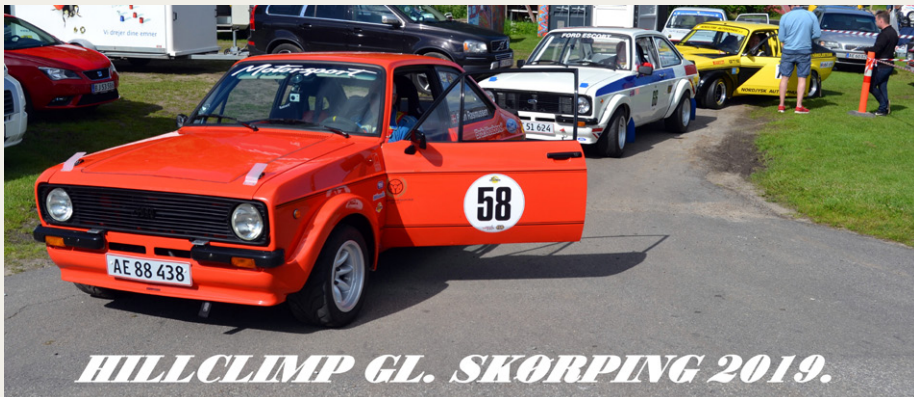
HILLCLIMB GL. SKØRPING 2019.