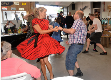
Opvisning i en god gang Swing Dance.

Jeg ankom midt formiddag, på det tidspunkt hvor de fleste var ude at køre en planlagt tur, så der var god tid til, at jeg kunne komme lidt rundt og fotografere, inden der kom mange folk, og boderne begyndte at åbne klokken 12.00.