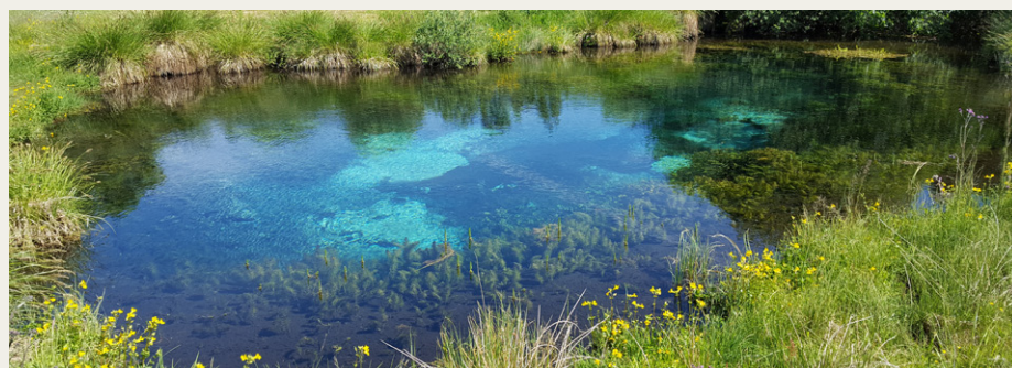
Den 14. september går turen igen til Rold Skov, hvor vi blandt andet får mulighed for at se den smukke „Store Blåkilde“.

Der vil blive gjort stop for at spise vores medbragte frokost omkring klokken 12.30, hvorefter turen går videre - rundt om og ind i Rold Skov. Omkring klokken 15.00 kommer vi til Thingbæk Kalkminer og koldkrigsmuseet, hvor man kan se billedhuggeren Anders Bundgaards værker og historien om den tophemmelige regering-bunker Regan Vest. Arrangementet slutter ved Thingbæk Kalkminer.