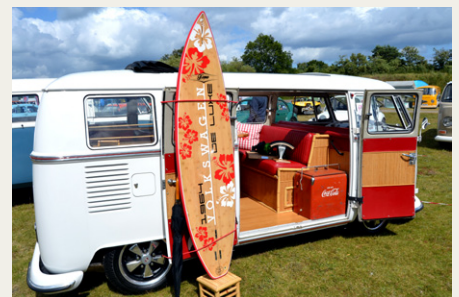
Ib Bayers fine bus med de fine præmier der allerede var opnået.