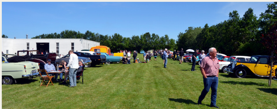
Et kik ud over pladsen.

Denne gang var der et noget specielt køretøj. En Morris 1000 ejer, der havde haft mod at bygge en Morris 1000 Pickup om til en autocamper, med hvad jeg tror, var en lille Safari campingvogn, og det var virkelig et godt og flot stykke arbejde.