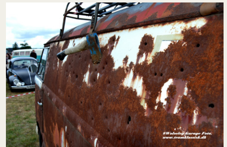
Denne norske varevogn har nok stået ude i ødemarken, været brugt til skydeøvelse og har fået det sidste „Hug“ med øksen, men alligevel kørt hele vejen til Danmark.