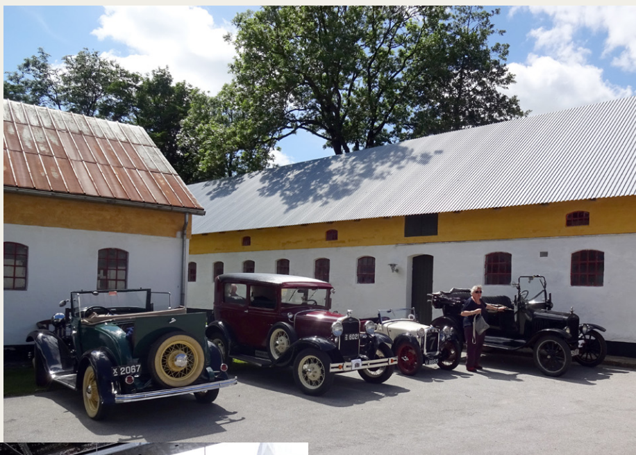
Et udsnit af vogne ved Huul Mølle

En kort rundspørge blandt deltagerne gav disse udsagn: