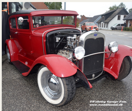
Stedet er kendt for sine Hot-Rod køretøjer.

Jeg kom over på show området, og jeg skal love for, at jeg blev positiv overrasket. Det er et sted, der er værd at besøge så snart der er mulighed for det. Det er som at komme tilbage i halvtredserne med rock i højtalerne og en kulisse, der passer helt utroligt med diverse barer og andre gode ting.