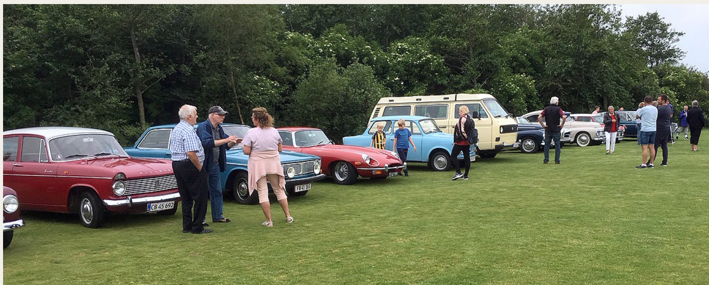
Ved Aabybro Mejeri var der også mulighed for at parkere samlet, selv om der var modt mange andre veteranbiler frem til Isens Dag.