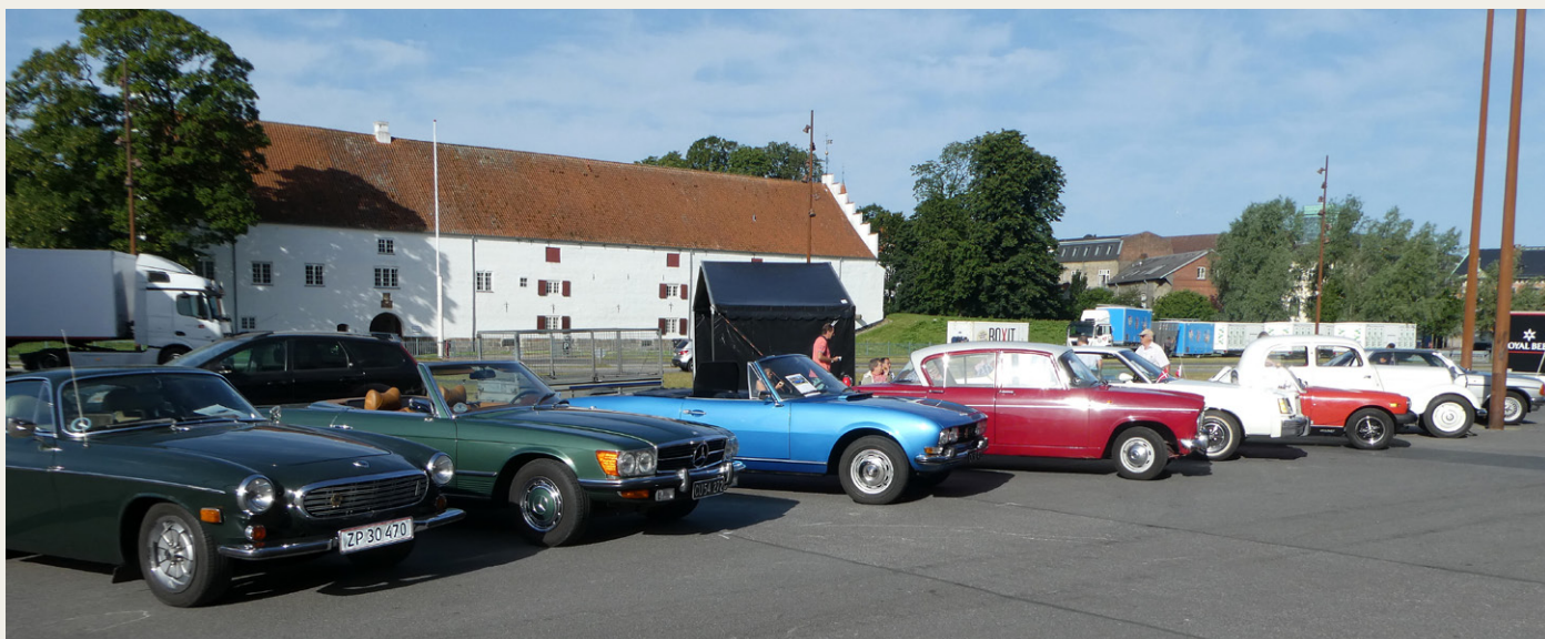
De otte deltagende køretøjer med Aalborghus Slot som baggrund.