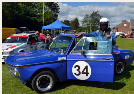
Laulund med sin B.M.W. som jeg også har set køre til Classic Race i Aarhus.

Et rigtig dejligt sted hvor pitten ligger lige midt i Gl. Skørping by, hvor man kan færdes imellem alle køretøjerne, og hvor der er mulighed for mad og drikke arrangeret af byens borgerforening. Midt i