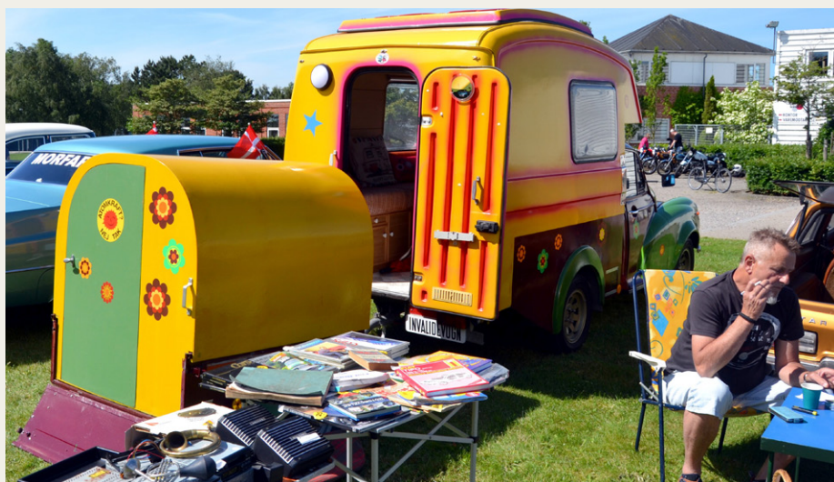
Et billede af camperen bagfra med den efterløbende trailer.