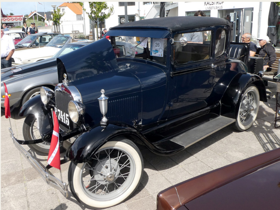
Publikum kårede denne flotte Ford A Coupé fra 1928 - arrangementets ældste deltagende køretøj - som vinder af klassen for gamle biler.