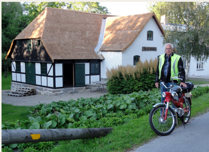
Huul Vandmølle - en lille overset naturperle.