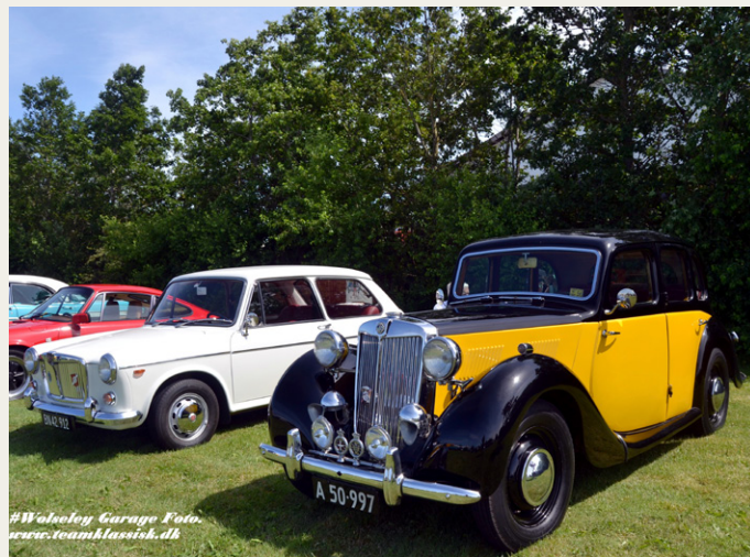
To MG'er i forskellige årgange, sjovt at se udviklingen.