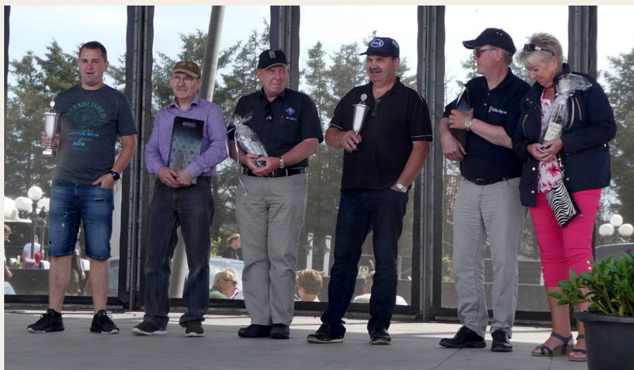
De seks vindere på scenen i Blokhus.