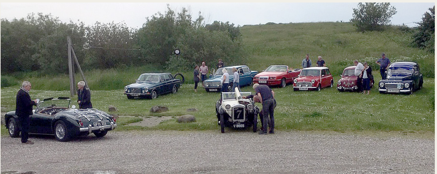
Ved Jægerum Søpark blev der „sparket dæk“ i det vekslende sommervejr.