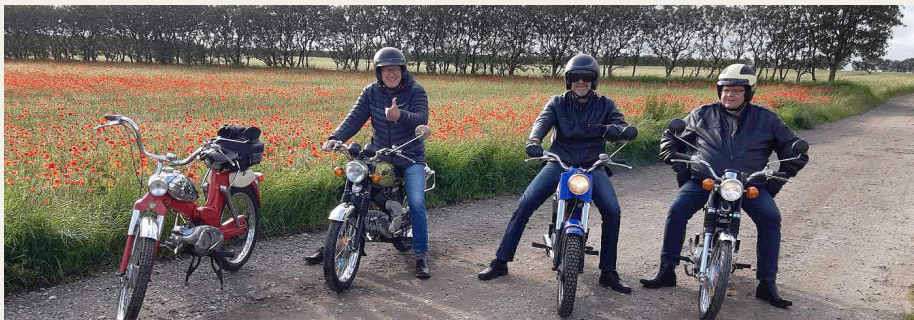
På vej tilbage til civilisationen.