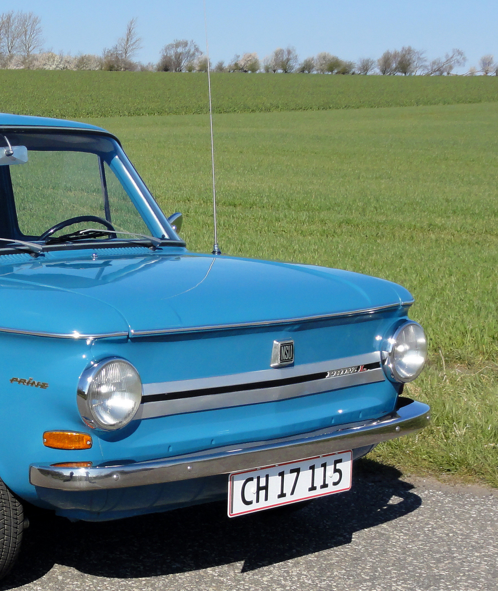
1967 NSU Prinz 4 Tilhørende Ib Høj, Aalestrup