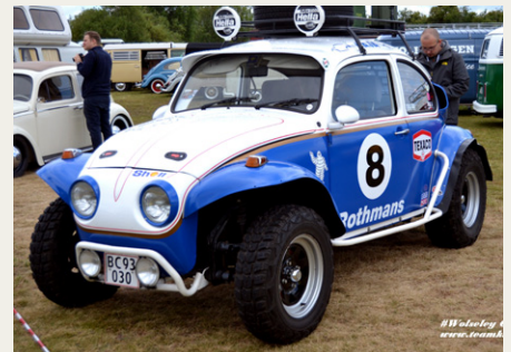
Noget speciel VW Bobbel, kaldet en BAJA.