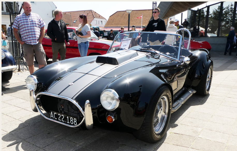
Vinder i klassen for nyere veteranbiler blev denne kopi af en AC Cobra fra 1968.

Arrangementet sluttede officielt klokken 15.30, og arrangørerne opfordrede de deltagere, som ikke ønskede at forlade Blokhus lige med det samme, til at sikre