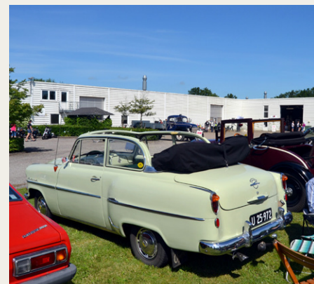
En af de mere sjældne biler. Opel Olympia Cabrio-Limousine fra 1956 med taget slået ned i det gode vejr.