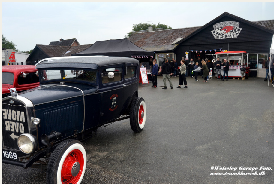
The Old Service Station - Highway 10 holder til i den sydlige del af Rold ud mod den gamle hovedvej 10, hvor der tidligere har været autoforhandler og servicestation.