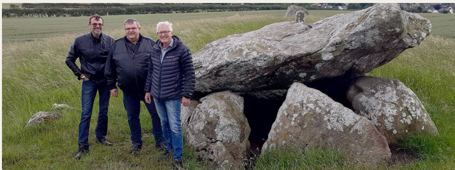
Det meste af den lille gruppe ved Troldkirken i Sønderholm.

Vi kører igen den 1. august klokken 18.30 fra Forchhammersvej 5. Poul K