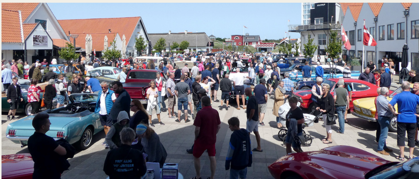
De flotte biler og det dejlige vejr trak mange gæster til Torvet i Blokhus.