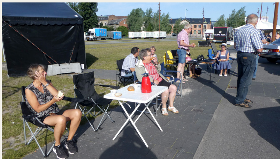
Deltagerne hyggede sig fra morgenstunden med kaffe/te og rundstykker sponsoreret af VisitAalborg.