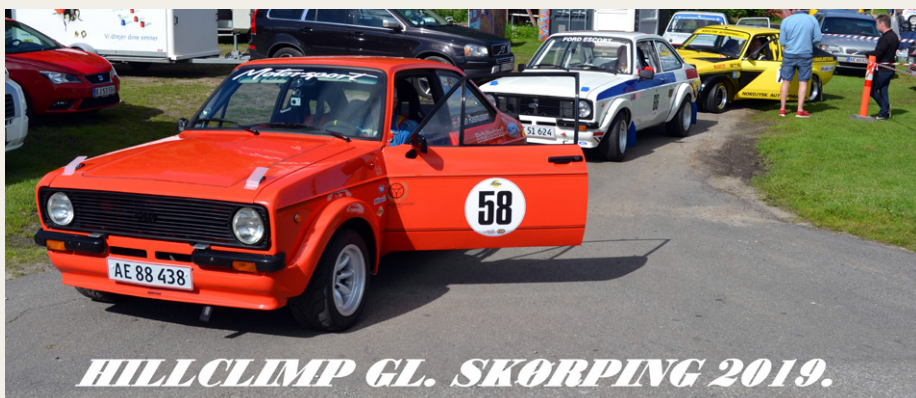
HILLCLIMB GL. SKØRPING 2019.