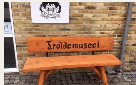
For trætte gæster er der mulighed for at få et lille hvil på benken udenfor Trolde museet.