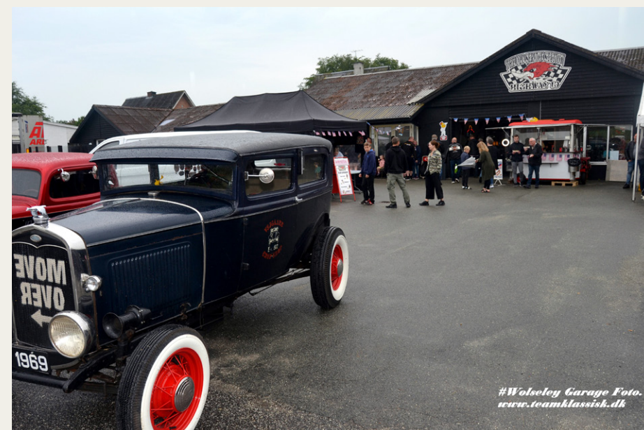
The Old Service Station - Highway 10 holder til i den sydlige del af Rold ud mod den gamle hovedvej 10, hvor der tidligere har været autoforhandler og servicestation.