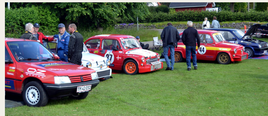
Mange forskellige slags biler er repræsenteret til dette race.

byen ligger der også et flot sted, hvor vi får lov til at parkere vore veteranbiler, som et ekstra tilbud til de mange tilskuere, der kommer på dagen.