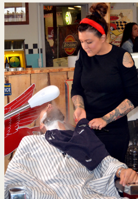
Klar til barbering, med kniven for struben.