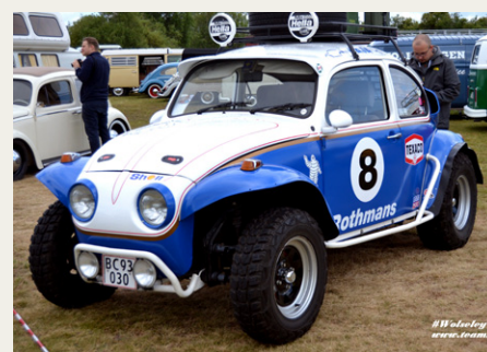
Noget speciel VW Bobbel, kaldet en BAJA.