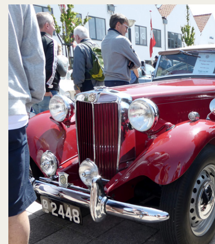
Denne flotte MGTD fra 1950 fik tredjepladsen i konkurrencen for gamle biler.

yce og en stor royal Daimler. Arrangørerne var vist bange for, at de store tunge biler ville trykke for hårdt på det sarte græs omkring fodboldbanen. Til gengæld fik de tre biler lov til at køre forrest i den lange karavane mellem Hune og Blokhus.