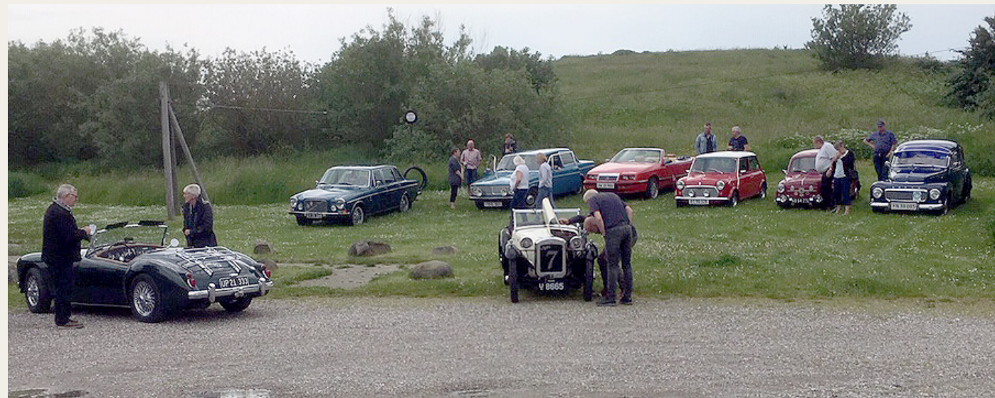
Ved Jægerum Søpark blev der „sparket dæk“ i det vekslende sommervejr.