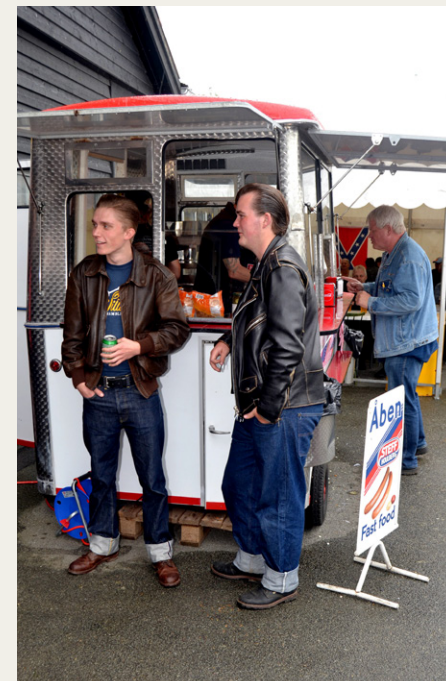
Rigtige idoler med olie i håret og opslag i bukserne, henger ved en pølsebod.