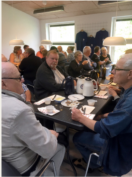
Trods de alvorlige miner blev morgenkaffen indtaget under hyggelige former i Midtvevdsyssel Veteranbilklubs flotte klublokaler på Vester Hjermitalev Skole.

Næste stop var det lille nyåbnede museum for de berømte Gjøltrolde. Museet, som ligger i Gjøl by er på kun 32 kvadratmeter, og blev åbnet i skaberen af Gjøltroldene Thomas Dams gamle værksted. Det er støtte fra blandt andre Region Nordjyllands vækstpulje, Jammerbugt Kommune, LAG-puljen og rettighedshaverne hos Dam Things, der har gjort det