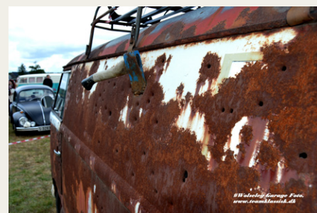
Denne norske varevogn har nok stået ude i ødemarken, været brugt til skydeøvelse og har fået det sidste „Hug“ med øksen, men alligevel kort bele vejen til Danmark.