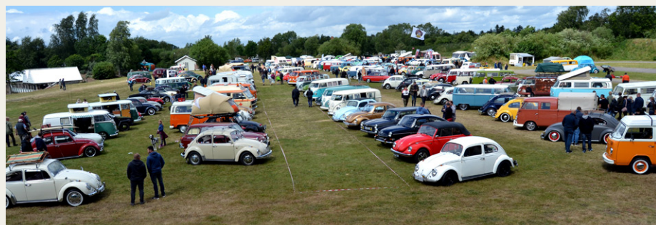
Kik ud over udstillingspladsen.

Det er et sted hvor folk hygger sig, uanset vejret, for det har jo noget med påklædning at gøre, og det er jo med at holde humøret højt uanset vejret. Og det så også ud til at gælde for deltagerne i træffet, for der var langt over 300 VW køretøjer til stede.