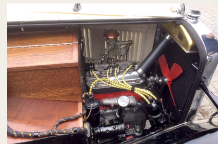
Selv i Austin's meget lille motorrum ser den lille motor ikke ud af meget.