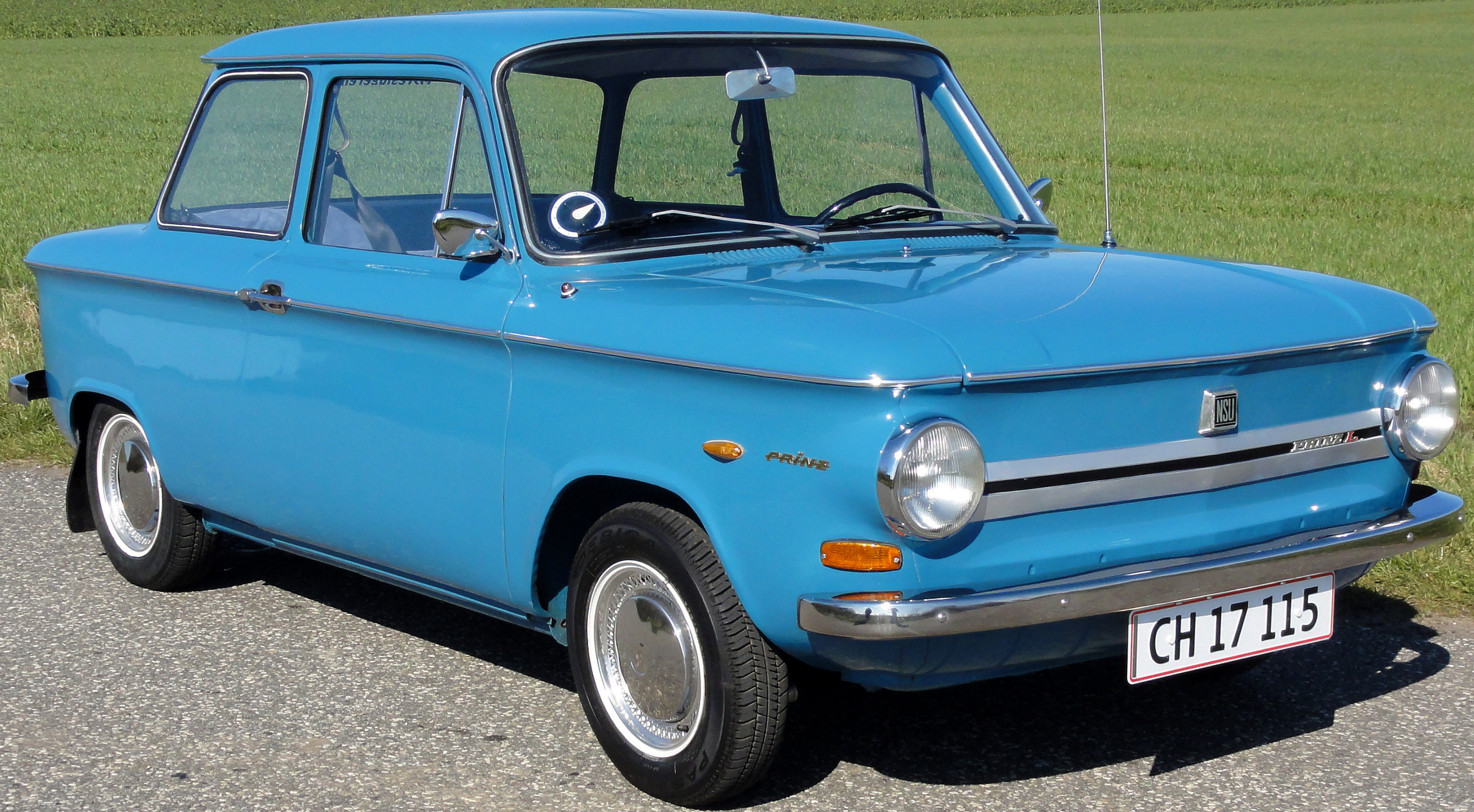
1967 NSU Prinz 4 Tilhørende Ib Høj, Aalestrup