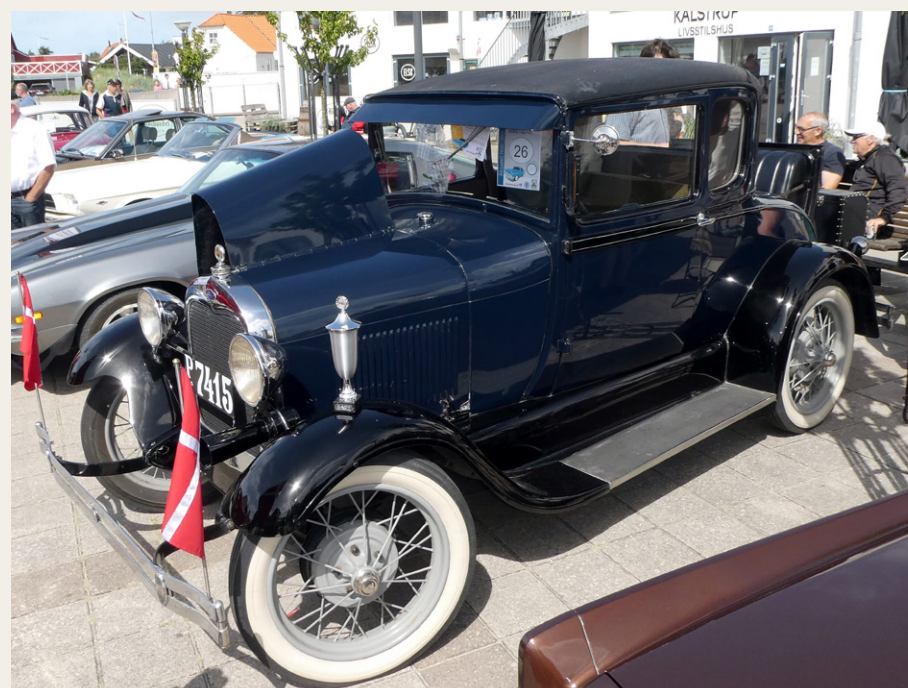
Publikum kærede denne flotte Ford A Coupé fra 1928 - arrangementets ældste deltagende køretøj - som vinder af klassen for gamle biler.