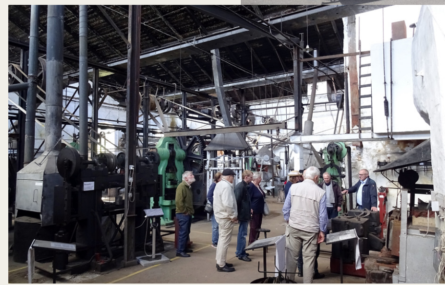
Så er der gang i Hammerværket.