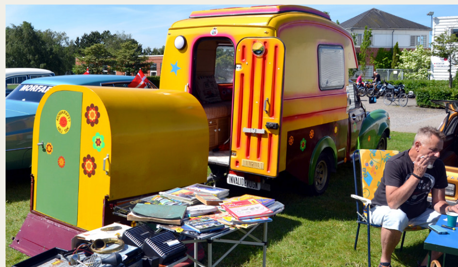
Et billede af camperen bagfra med den efterlobende trailer.