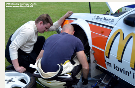
Der „makkes“ altid med et eller andet i pitten.