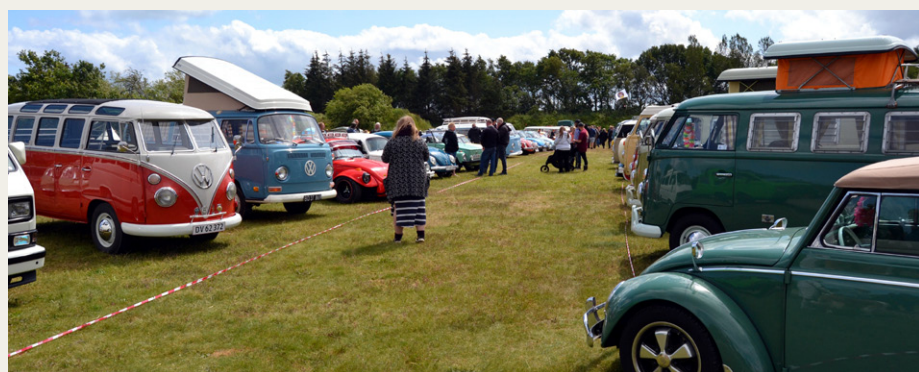
Alle de fine køretøjer stod fint på række til beskuelse.