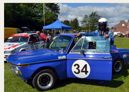
Laulund med sin B.M.W. som jeg også har set køre til Classic Race i Aarhus.

Et rigtig dejligt sted hvor pitten ligger lige midt i Gl. Skørping by, hvor man kan færdes imellem alle køretøjerne, og hvor der er mulighed for mad og drikke arrangeret af byens borgerforening. Midt i