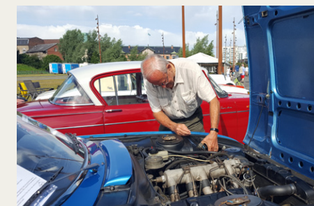
Ved ankomsten til Aalborg blev vi mødt med flere kommentarer om, at vi manglede lys i den højre forlygte. Det er der vel ikke noget mærkeligt ved - det er jo en fransk bil!

Nå, men belært af erfaringerne fra sidste år (se Hornet nummer 3 - 2018), skyndte jeg mig at kontrollere sikringerne. Denne gang var det dog pæren, der var problemet.