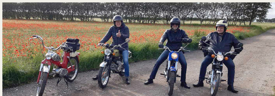
På vej tilbage til civilisationen.