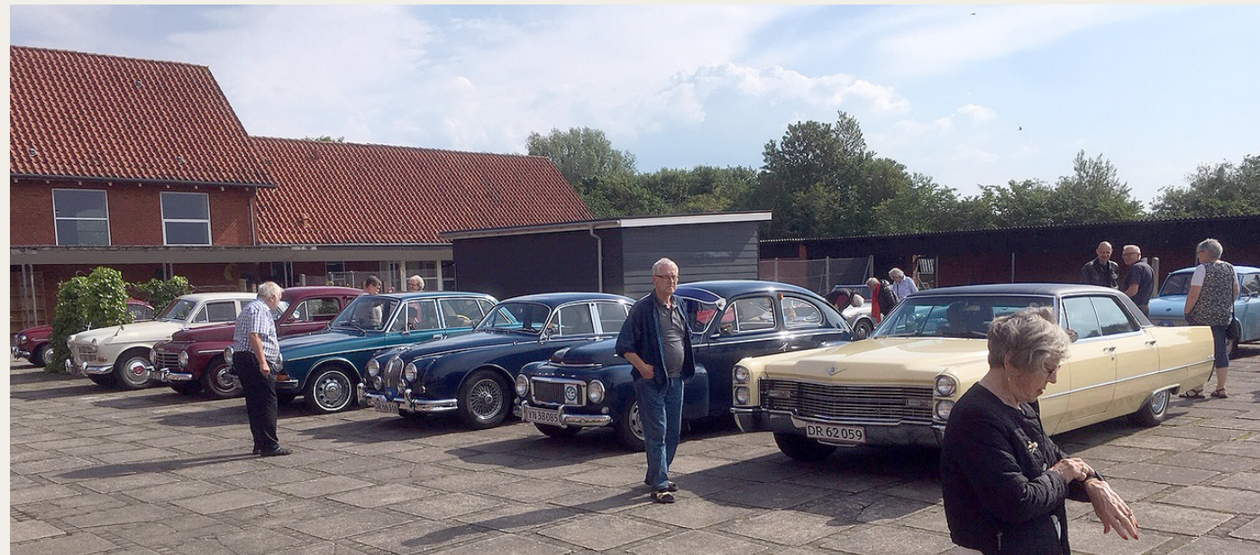
En del af de mange deltagende køretøjer parkeret ved Vester Hjermitalev Skole, hvor Midtvevdsyssel Veteranbilklub har klublokaler.