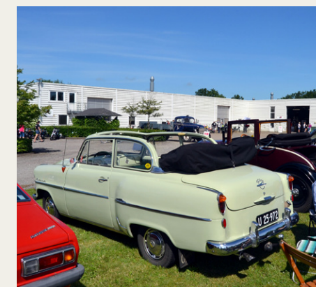
En af de mere sjældne biler. Opel Olympia Cabrio-Limousine fra 1956 med taget slået ned i det gode vejr.