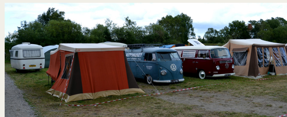
Ro og orden på Campingpladsen.