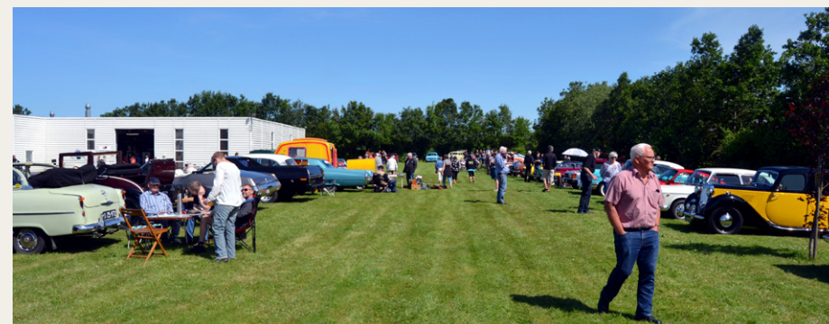
Et kikk ud over pladsen.

Denne gang var der et noget specielt køretøj. En Morris 1000 ejer, der havde haft mod at bygge en Morris 1000 Pickup om til en autocamper, med hvad jeg tror, var en lille Safari campingvogn, og det var virkelig et godt og flot stykke arbejde.