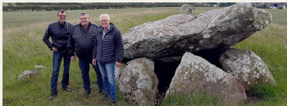
Det meste af den lille gruppe ved Troldkirken i Sønderholm.

Vi kører igen den 1. august klokken 18.30 fra Forchhammersvej 5. Poul K