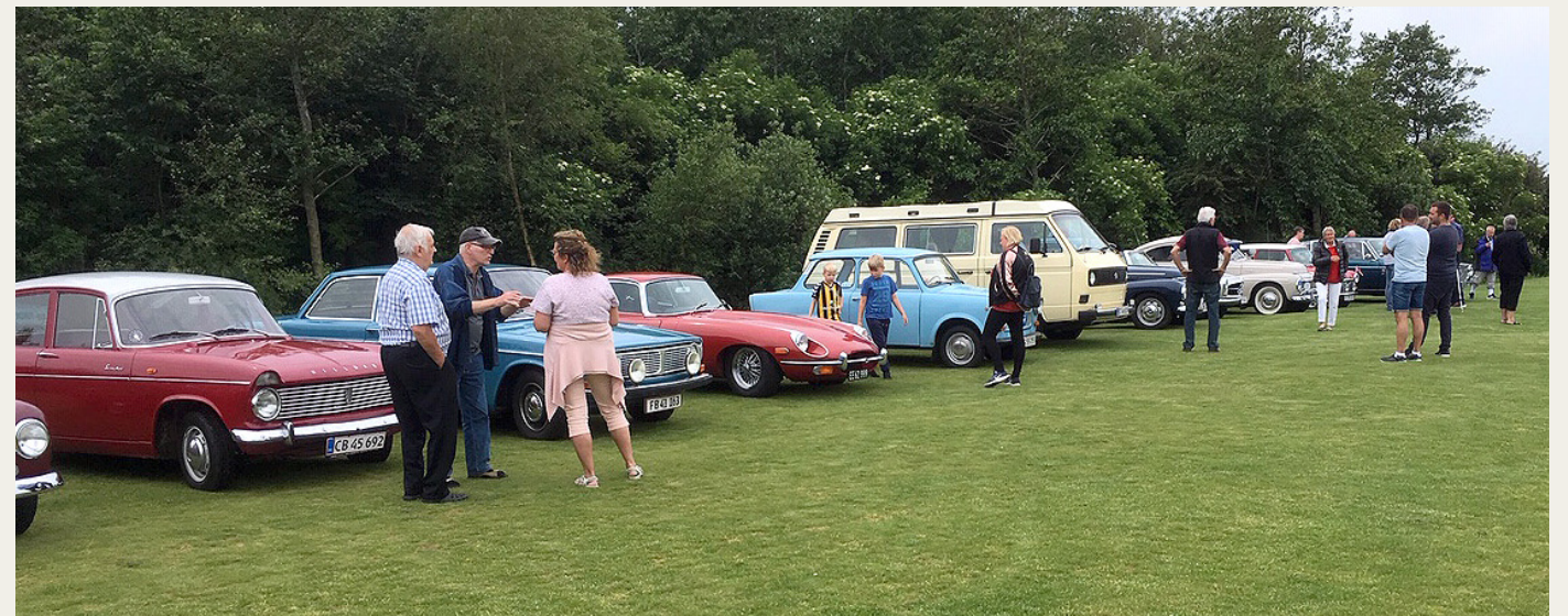
Ved Aabybro Mejeri var der også mulighed for at parkere samlet, selv om der var modt mange andre veteranbiler frem til Isens Dag.