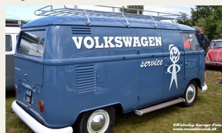
Rigtig fint med de originale reklamer på køretøjet.

Da jeg ankom, var der ikke det helt store fremmøde af andre veterankøretøjer, men vejret var også i det lunefulde hjørne. VW-bilerne var stillet frem til parade, og det så rigtig godt ud (der var orden i sagerne), og det var rigtig spændende at se så mange forskellige måder at lave sin egen stil og udseende på sit køretøj. Der holdt stadig også en del VW'er på selve Campen, og det gav anledning til en rundtur blandt campingvogne og telte. Salgsboder er der også en del af, med både nye og brugte reservedele samt mange andre gode ting.