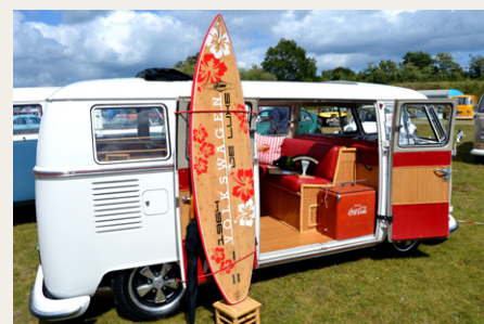
Ib Bayers fine bus med de fine premier der allerede var opnået.