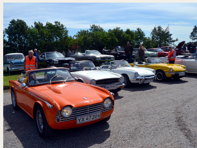
Så sætter vi rækken af Triumph biler på plads.