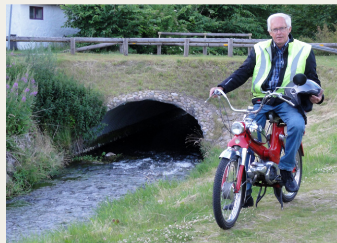
Man kan næste høre vandets rislen.