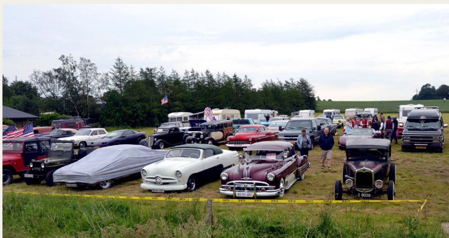
Marken overfor blev hurtigt fyldt op med amerikanerbiler, da de var færdige med at køre tur om formiddagen.

Steen Gaarden, som laver Costum Paint, viste sine færdigheder, og det var virkelig håndværk. Udenfor var der en hel