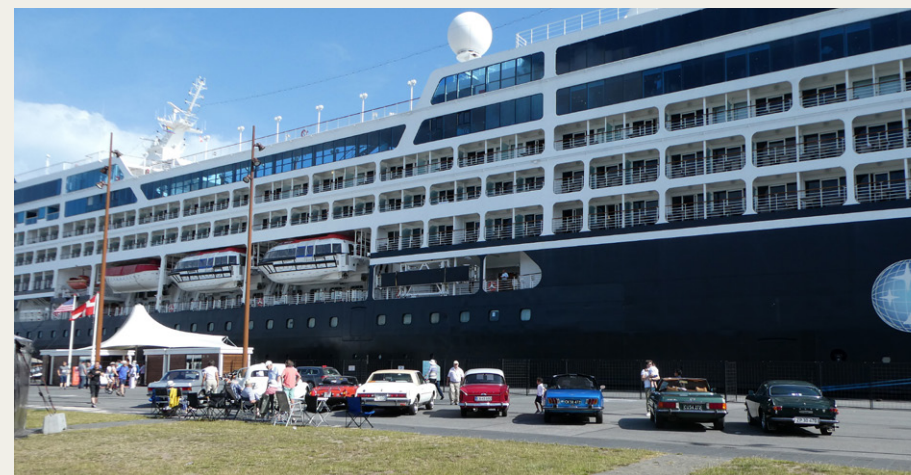
Selv om Azamara Journey ikke er noget stort krydstogtskib, ser de otte veteranbiler ikke ud af meget med skibet som baggrund.