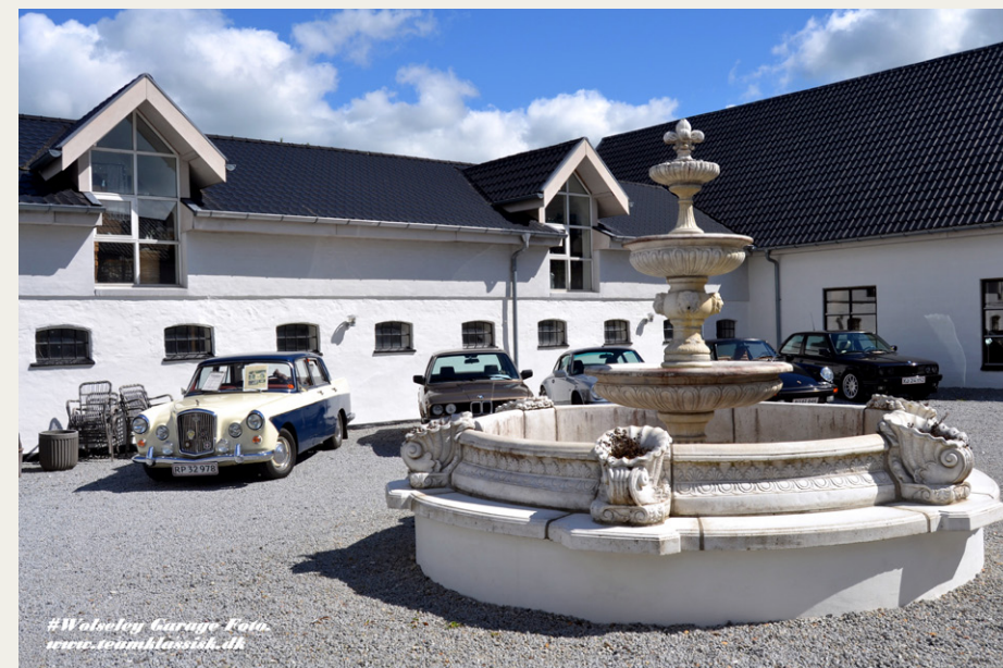
#Wolsey Garage