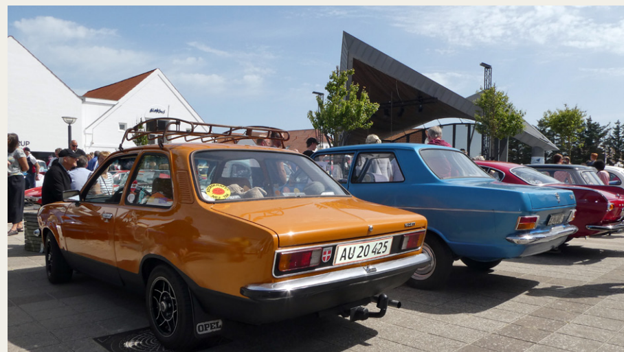
Det var ikke kun prestige-biler og sportsvogne, der prydede Torvet i Blokhus denne lørdag. Almindelige hverdagsbiler var blandt andet repræsenteret af disse to Opel Kadett. Den orange er en Kadett C fra 1979 og den blå er en Kadett B fra 1971.