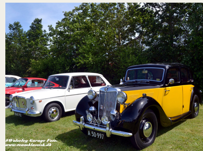
To MG'er i forskellige årgange, sjovt at se udviklingen.