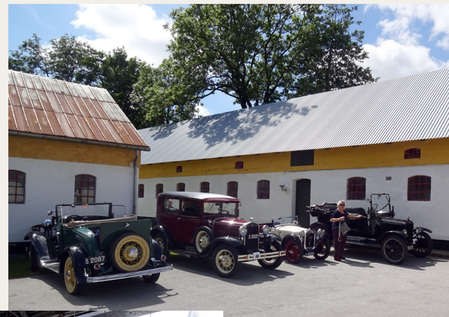
Et udsnit af vogne ved Huul Mølle

En kort rundspørge blandt deltagerne gav disse udsagn: