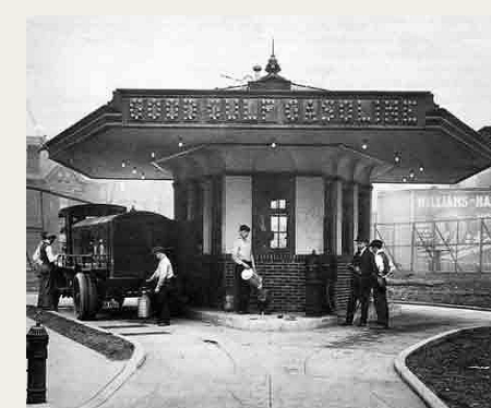
Verdens første „Drive-in“ benzinstation blev åbnet i 1913 af Gulf Refining Company på hjørnet af Baum Boulevard og St. Clair Street i Pittsburg, Pennsylvania under mottoet: „Good Gulf Gasoline“.