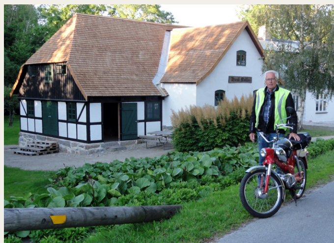
Huul Vandmølle - en lille overset naturperle.