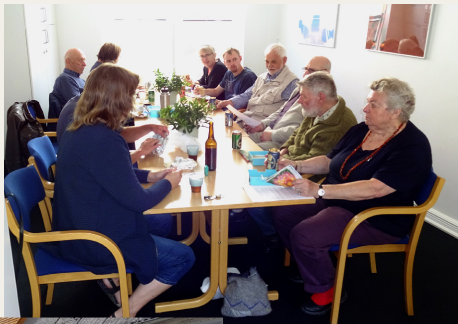
I Nibe Bios lokaler spises madpakker