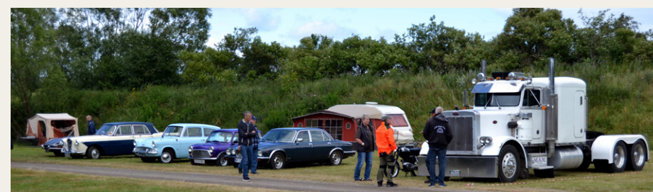
Både store og små, af andre veterankøretøjer, der var ankommet til træfområdet.