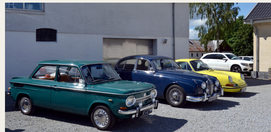
Tilskuerne kom i mange forskellige veteranbiler.