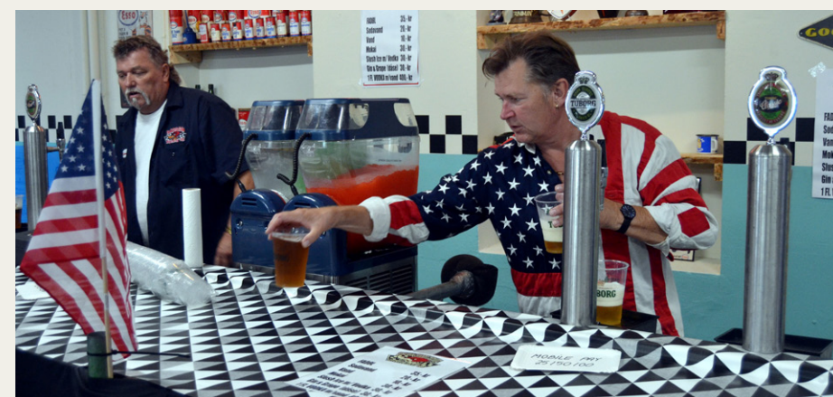
Så er baren åben.