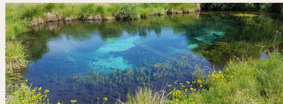
Den 14. september går turen igen til Rold Skov, hvor vi blandt andet får mulighed for at se den smukke „Store Blåkilde“.