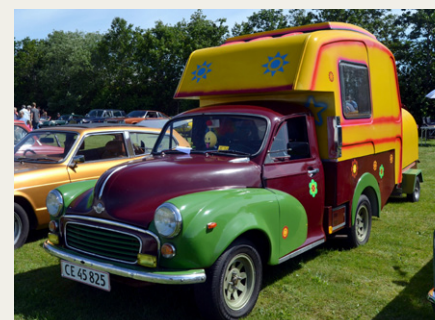
Forfra med de lidt specielle Hippie / flower-power farver.

Registreringen krævede dog, at der blev betalt afgift, da den skulle over på hvide nummerplader.