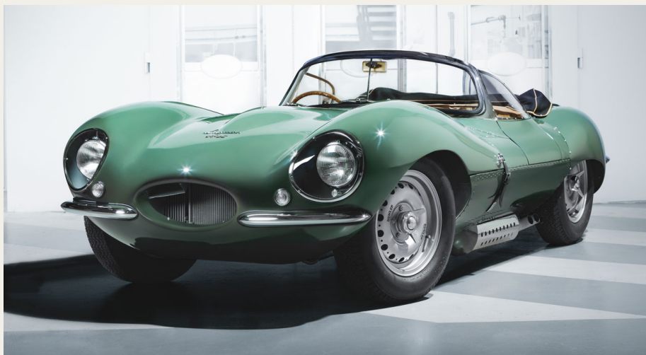
En af de ni nye Jaguar XKSS - (Pressefoto fra Jaguar)