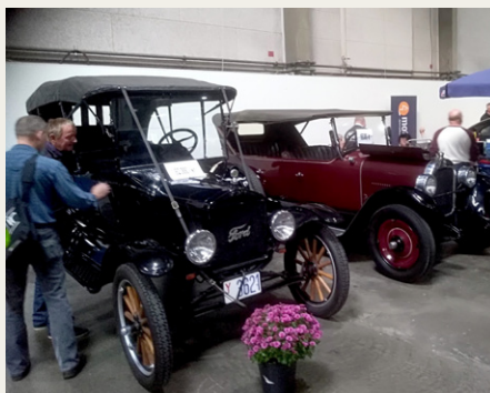
Et par rigtig gamle køretøjer, som er blevet mere sjældne at se på Fredericia Stumpemarked.