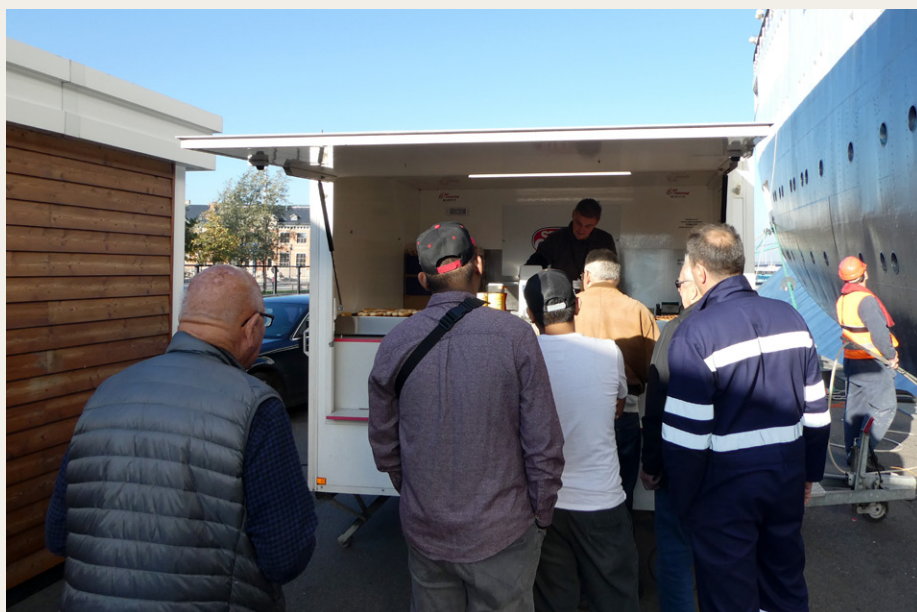
Fra pølsevognen åbnede klokken 10.00, var der kø uafbrudt indtil lukketid.

tiltrak åbne topersoners sportsvogne, så det var ikke så få MG'er, Triumph'er og lignende, han havde arbejdet på. Han var selv indehaver af en Triumph Stag fra 1972, som han havde købt som ny for ca. 2.600 £, og han var lidt forarget over, at han flere gange var blevet tilbudt hele 16.000 £ for den. Selv om han syntes, at det var en voldsom masse penge, var den ikke til salg. Han fortalte også, at han den gang også overvejede at købe en lettere brugt Mercedes-Benz 230SL. Det var måske meget godt, at han ikke gjorde det, for så havde tilbuddene nok været på et helt andet og højere niveau.