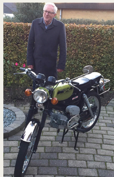
Den nye formand med sit „Flagskib“.