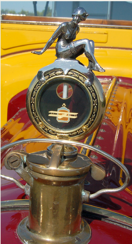
Termometer og kolerfigur på den 104 år gamle Packard.