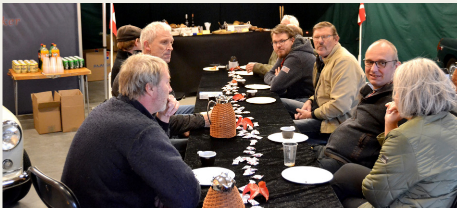
Råhygge med de mange fremmødte gæster.