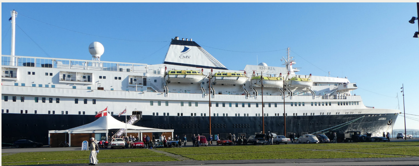
Krydstogtskibet Astoria og 14 nordjyske veterabilér på Honnørkajen i Aalborg.