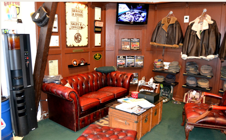
Der er også et hyggeligt hjørne.