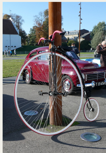
Det var ikke kun motoriserede gæster, der var interesserede i vores biler. En lokal cykelentusiast havde parkeret sin „Væltepeter“ for at kigge med.

Denne gang var det krydstogtskibet Astoria og dets passagerer, vi skulle møde. Astoria er bygget i Gøteborg og blev sat i drift i 1948 under navnet Stockholm, og det er dermed verdens ældste krydstogtskib og verdens anden ældste oceangående passagerskib. Det var også under navnet Stockholm, at skibet blev berømt, da det i 1956 kolliderede med større italienske luksusliner Andrea Doria, som kængtrede