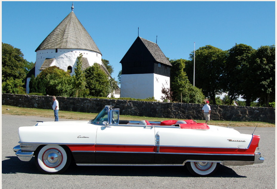
Yngste deltager var vores Packard Caribbean fra 1955 - her fotograferet foran Østerlars Kirke.