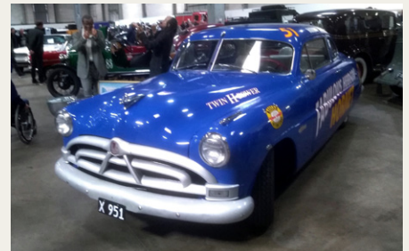
En 1951 Hudson Hornet forklædt som den ikoniske „Doc Hudson” fra filmen Cars.