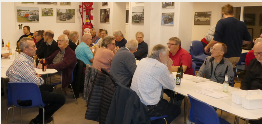
Et godt udsnit af de lidt over 50 personer, som deltog i generalforsamlingen.

Året igennem har budt på klubaftener med spændende relevante emner, vel