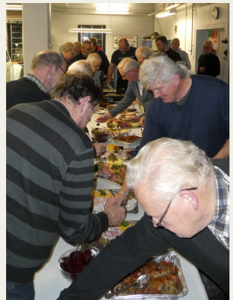
Efter afslutningen af den officielle del af generalforsamlingen blev der trængsel omkring det gode pålægsbord.

NÅR I overvejer mine ønsker og drømme, så vil jeg gerne understrege, at bussen er en „gammel dame“, - og jeg vil aldrig kunne love at der ikke dukker nye