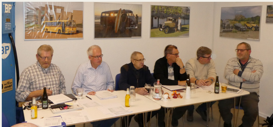
Det meste af bestyrelsen ved hovedbordet - redaktøren betjente kameraet.