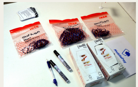
Et udsnit af de medbragte salgsvarer.