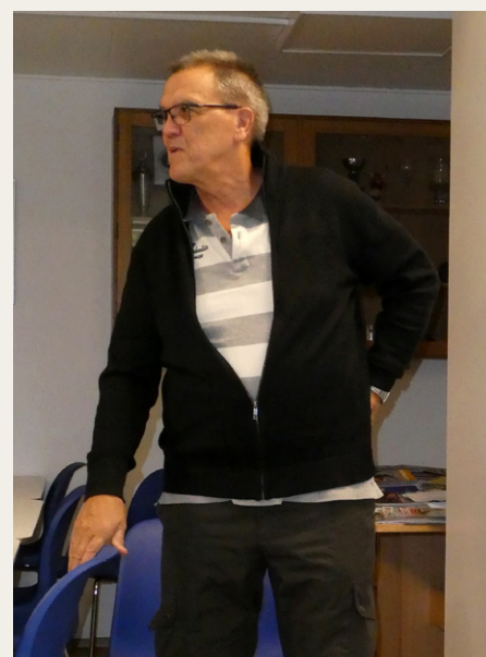
Gerner fortæller om BMC Freaks'enes oplevelser på turen til Birmingham og Coventry.