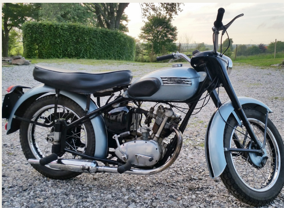
Triumph Tiger Cup, med danske papirer. Bemærk, at prisen nu er reduceret til 22.000 kr.

Ønsker man annoncen fjernet tidligere, eller forlænget ud over de tre numre skal der gives besked til redaktøren.