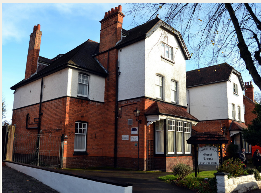
Det hyggelige hotel i Sulihull, lige uden for Birmingham, som BMC Freaks Travel boede på.