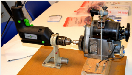
Stigs primitive, men effektive prøvestation til afprøvning af kondensatorer.