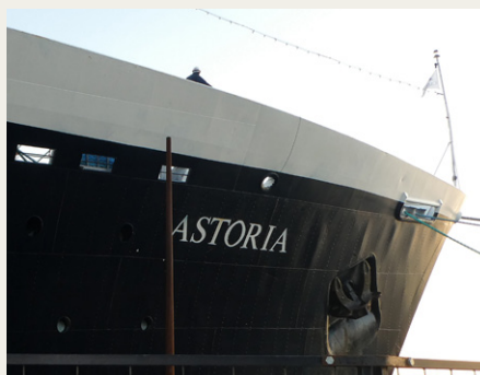
Astorias stævn lige efter, at skibet var fortojet til kajen i det smukke solskinsvejr.

Men alle bekymringerne blev gjort til skamme. Det danske efterår viste sig fra sin allerflotteste side: Skyfri himmel og solskin lige fra morgenstunden, og hele 14 køretøjer dukkede op på Honnørkajen. Hvilket smukt syn det var med den store variation, der var blandt de deltagende køretøjer med Ford T og Cadillac fra 1922 i den ene ende til 1978 Buick Regal og 1980 Mercedes-Benz 230 Coupé i den anden.