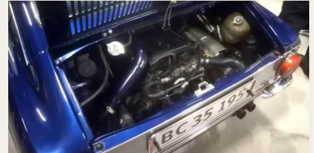
En lidt udsædvanlig motor i en Fiat 850 coupe, men mindes, da man selv havde en Fiat 850 i sine unge dage.