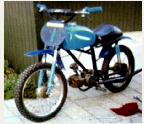
Billede af den hjemmebyggede Racerknallert.