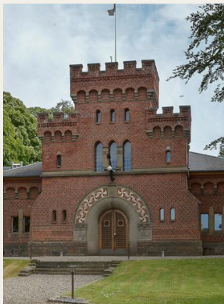
Vandteknisk Museum, Søndergade 53, Aalborg