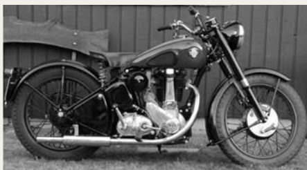
Stig's BSA der var starten på det hele.