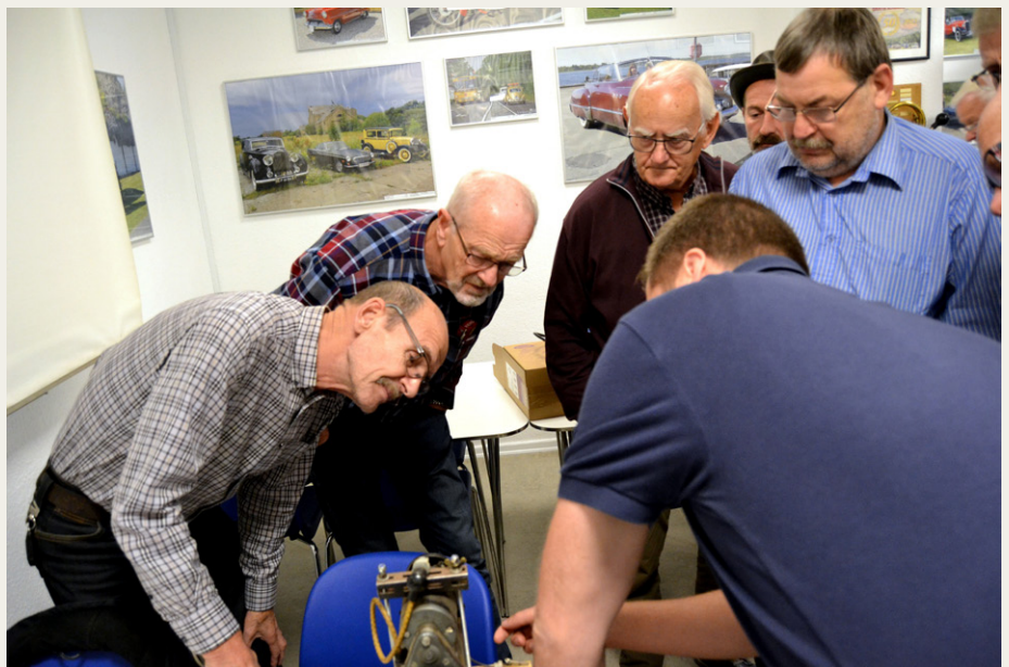
Så testes der.