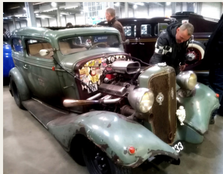
En noget anløben Chevrolet fra 1933 med en meget uoriginal V8 motor.