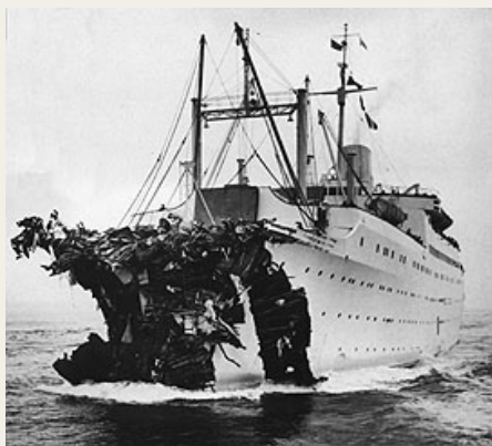
Efter kollisionen den 25. juli 1956 samlede besætningen fra Stockholm hele 572 passagerer og besætningsmedlemmer fra Andrea Doria op, og sejlede for egen kraft tilbage til USA. Fem besætningsmedlemmer på Stockholm blev dræbt ved kollisionen.