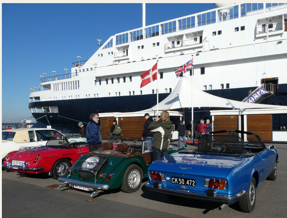
Tre meget forskellige „sportsvogne“, som alle var meget besøgt af de engelske gæster.