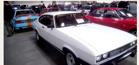
Et kikk ud over biler til salg, hvor en del skilte efterhånden blev vendt til „Solgt”.