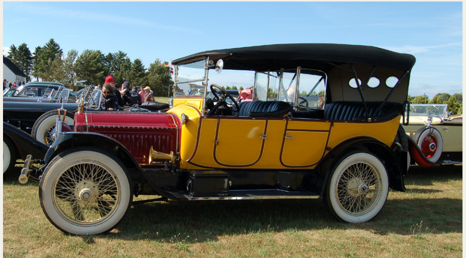
Ældste deltager i Packard-træffet på Bornholm var denne flotte tolvcylindrede Packard fra 1914.