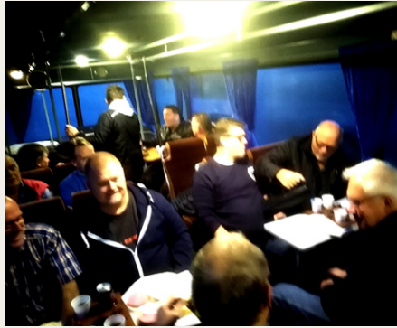
Der var som sædvanligt rigtig god stemning i klubbussen, med rundstykker, kaffe og en „lille skarp”.

Ellers var der mange gengangere med hensyn til boderne, men man finder jo altid en eller anden ting, man simpelthen ikke kan undvære. For mit vedkommende et par gamle originale klistermærker med Monroe Støddæmpere og et med AC tændrør til min veterantrailer. Ellers en masse snak i hallen med klubstandene og et enkelt kikk i kræmmermarkedet hvor man efterhånden kan finde mange bilrela-