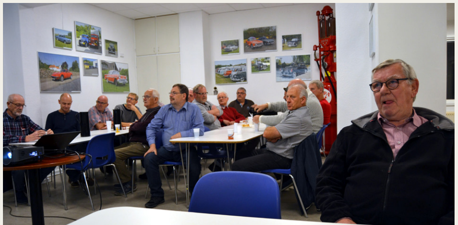
En del af aftenens forventningsfulde tilborer.