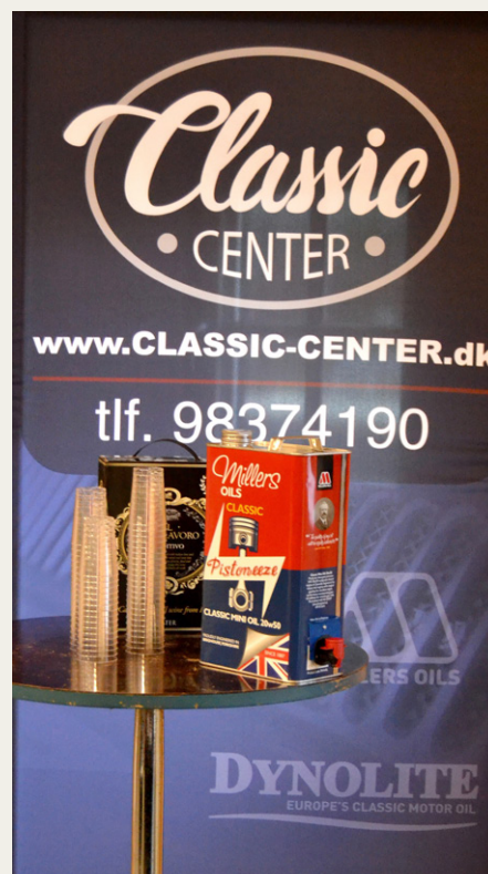
Vin-Bar med en ombygget oliedunk, jo-jo mindre kan ikke gøre det.