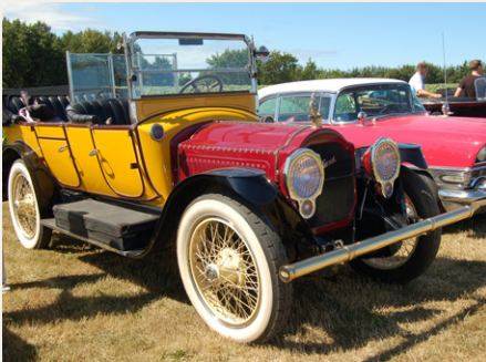
Den gamle Packard ser også ganske imponerende ud fra denne vinkel.