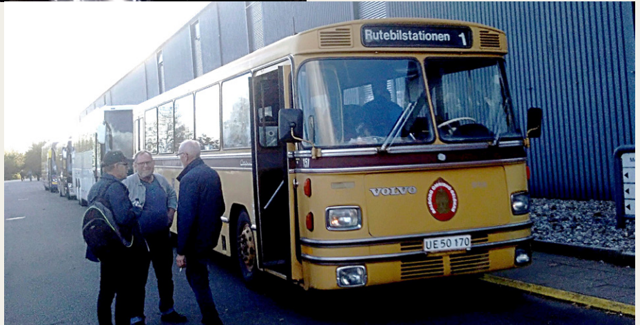
Så er vi ved at samles igen til hjemturen.