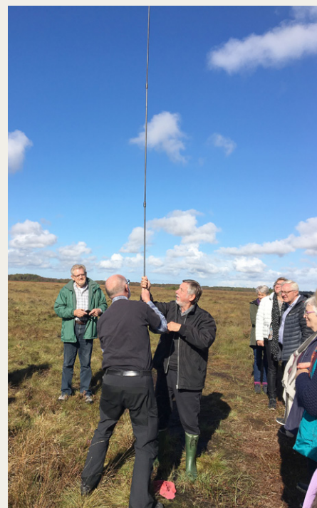
Spagnumlagets tykkelse måles med det meget lange jernspyd.