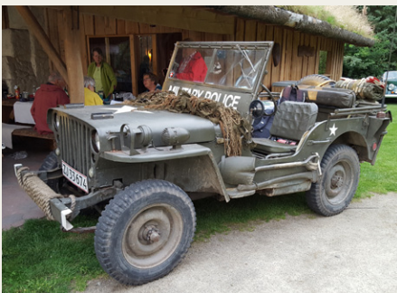
Baker Company, som tidligere er omtalt i Hornet, var forbi med en Willys Jeep fra 1941.