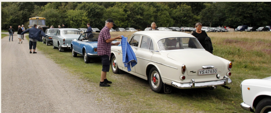
Det så ganske imponerende ud med den lange række veteranbiler på parkeringspladsen Ved Tversted søerne