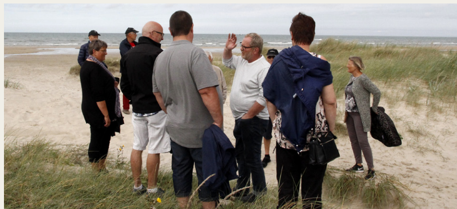
Selv ikke den smukke natur ved Tannis Bugt kunne stoppe den hyggelige snak.