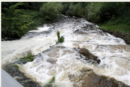
Fisketrappen, som her ses fra broen over åen, er kommet i politisk uvej, og fremtiden for både den og elværket er usikkert.