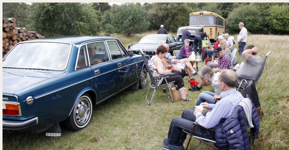
Efter vandreturen ved Tversted søerne blev stolene og enkelte borde slået op i det skiftende sensommervejr.

stadig leverer for at holde denne kulturhistoriske perle i gang.