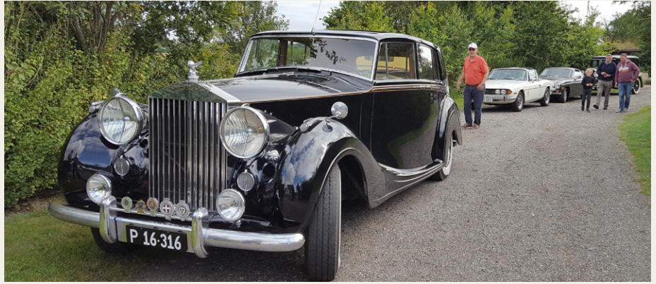
Så er der næsten klar til afgang, med Rolls Royce'n i front.

Det var interessant at se denne udstilling, og ikke mindst at se hvor velbevarede mange dele er efter styrtet og over 70 år i jorden. Ud over flydelene er der udstillet billeder fra opgravningen, plancher om