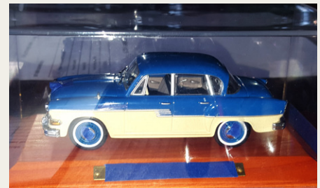
Den sidste opgave gik ud på at identificere denne bilmodel. Vi kan nu afsløre, at det er en Sachsenring, som i halvtredserne blev bygget på den tidligere Horch fabrik i Zwickau.