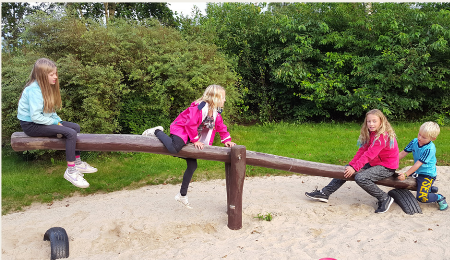
Børnene hyggede sig på den fine legeplads.

flytypen og om det tyske luftvåben i Danmark under krigen, samt fotos af pilotens personlige ejendele, som er overdraget til og udstillet på Nordjyllands Historiske Museum.