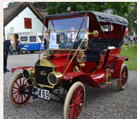
Træffets ældste køretøj, en rigtig fin Ford T.