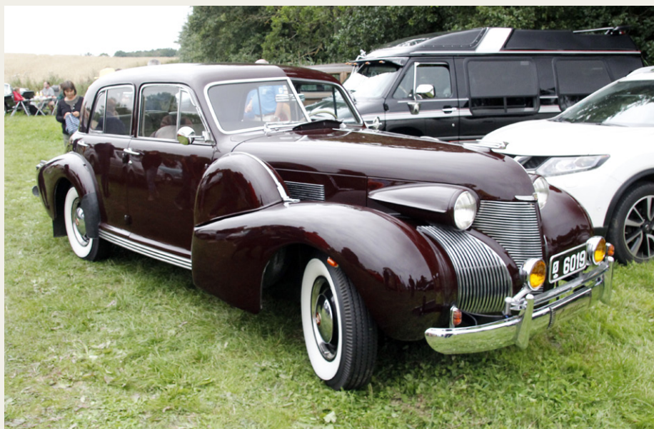
Ud over vores klubbus var denne flotte Cadillac Model 60 fra 1939 absolut et af de mest iøjnefaldende køretøjer.