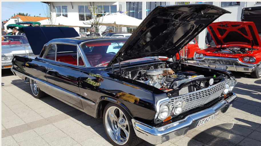
Publikums favorit var denne Chevrolet Impala med noget større fælge, end den var født med.