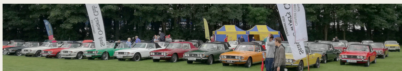
Lørdag på Silverstone. Der var nok mellem 60 og 80 Triumph Stag udstillet, hvor de ca. 60 stod ved Stag Owners Club (SOC).