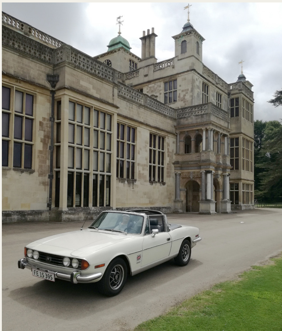
Vores første udflugt, mens vi boede i Colchester, gik til Audley End House and Gardens i byen Saffron Walden.