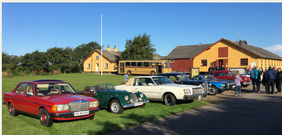
Deltagende biler og personer i morgensolen foran Vildmoseporten.