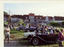
Hver tirsdag aften i juni, juli og august mødes veteraner fra det sydøstlige område til "Åben bil" på Hovedengen i Ribe.

Der er altså langt at køre til Kalø Vig eller andre steder, sådant en hverdags aften, så vi må da kunne finde en dag eller to om måneden at mødes, og et sted hvor der er plads til mange køretøjer.