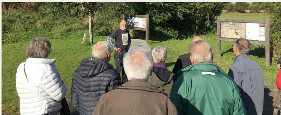
Vores guide fortæller ved mindestenen for de nedstyrtede engelske flyvere.

Tilbage på Gård 18 fortsatte rundvisningen, og vi fik fortalt historien om, hvordan staldgårdenes ene staldlænge i