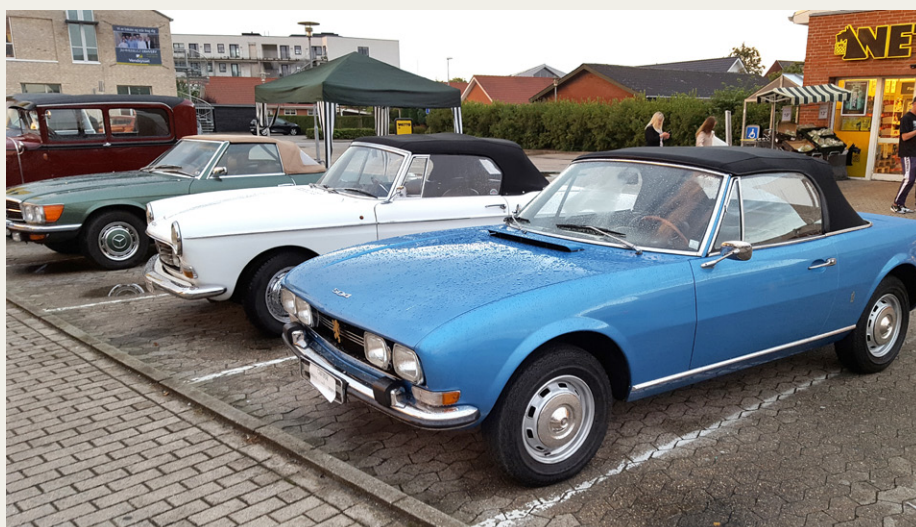
Efter regnbygen var Per Mogensen ikke helt så meget til grin. Midt under regnbygen var der megen aktivitet omkring to af bilerne, mens Per Mogensen kunne tage det roligt.