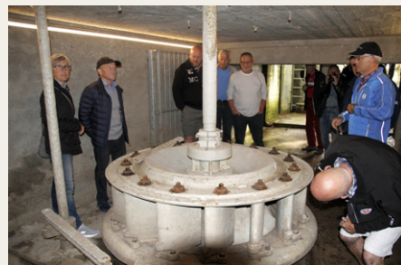
Den ældste af turbinerne er ikke længere i drift, men indgår i den permanente udstilling på elværket