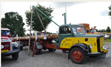
En noget speciel Tømmervogn.