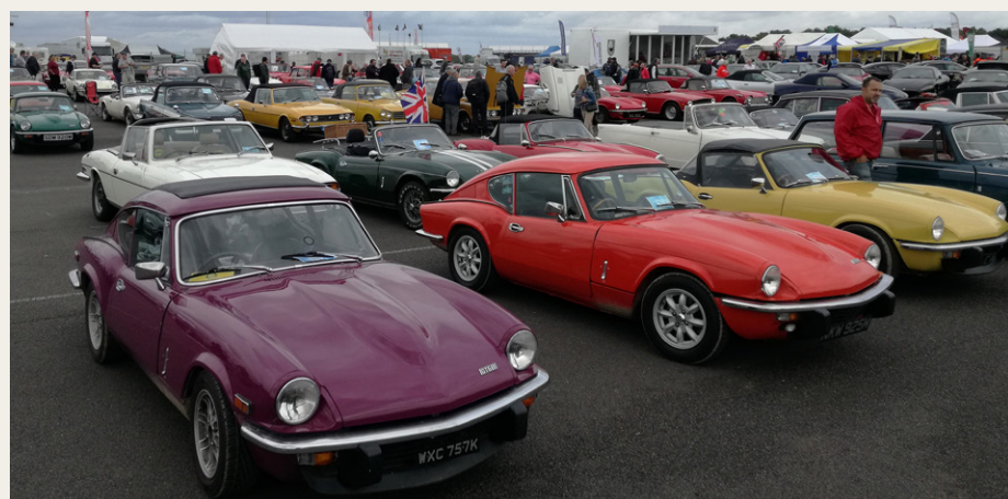
Triumph Klubben. De er også på rundtur på racerbanen om lørdagen - flot syn.

Venedig, en utrolig flot lille by. Efter en overnatning i Bourton-on-the-water og et besøg på deres lille museum, Cotswold Motoring Museum & Toy Collection, samt en tur mere rundt i byen, kørte vi videre til Tadmarton. Her skulle vi overnatte de næste tre dage, hvor vi skulle til Silverstone Classic Race.