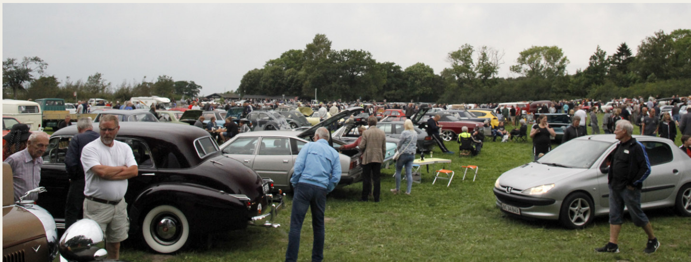
Selv om en del køretøjer tydeligvis var kørt hjem inden vores ankomst, var der dog stadig masser af både biler og mennesker.