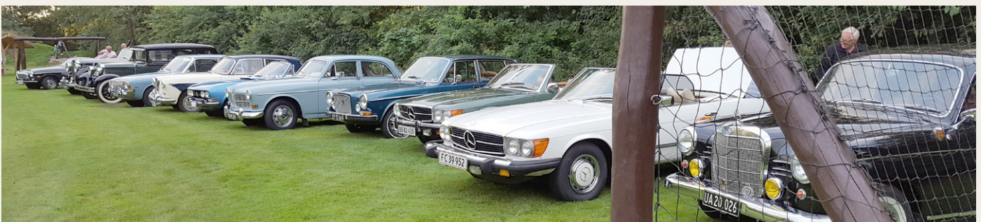
Rækken af flotte biler på Skipper Klements Plads i Ryå.