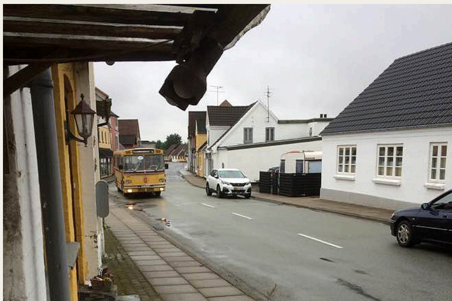
Nordjysk Vintage Motor Klubs gamle bybus fanget på vej gennem Jerslev i regnvejr.

Den lille anekdote herover, er faktisk utrolig præcis. Generelt set var der en eminent flot logistik - bortset fra at post 1 tog lidt længere tid end forudset, så var der