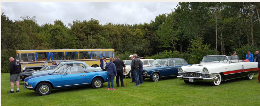
Kort efter vi ankom til parkeringspladsen ved Bindslev Elværk, dukkede andre gæster frem for at studere og diskutere gamle biler.