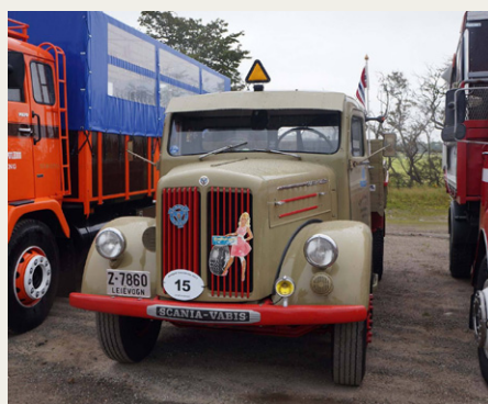
Fortidens kæmper kunne godt virke som dværge i forhold til deres lidt yngre kolleger.