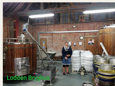
Loddon bryghus. Her er der også lavet optagelser til Midsomer Murders (Barnaby).