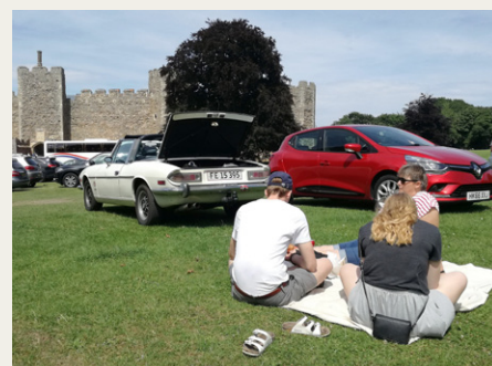
Frokost ved Framlingham Castle.