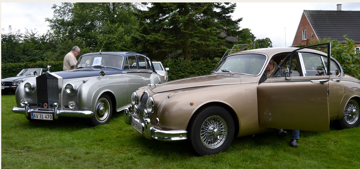
Man kan da kun føle sig vel til pas i så godt et selskab.