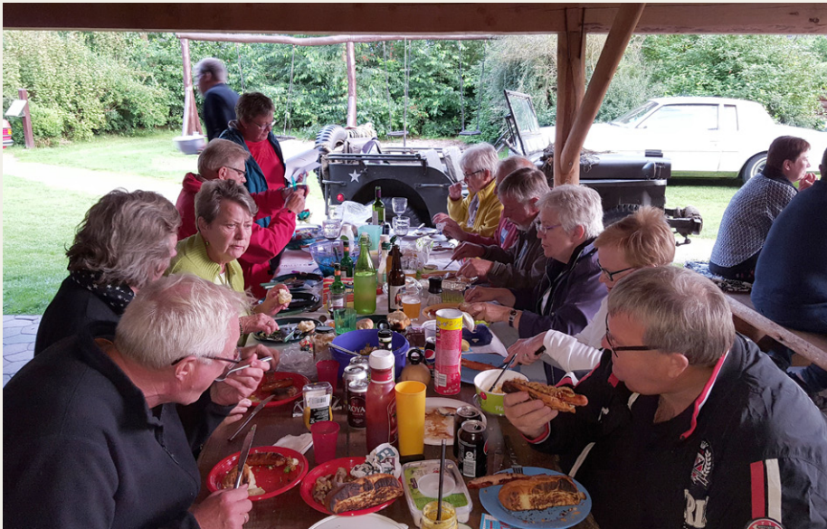
Så er der dømt hygge med grillmaden på bordet.