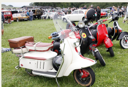
Denne flotte Heinkel 150 Scooter fra 1962 mødte vi også sidste år.

Ved ankomsten til parkeringspladsen ved Kalø Vig, var der vist en kvindelig passager, som var lidt overrasket over, at vi andre ville kigge på gamle biler, i stedet for at gå den lange tur ud til slotsruinen. Det skal til damens undskyldning siges, at overskriften på tidligere beskrivelser af turen var "Kalø Slotsruin", og at ordet biltræf overhovedet ikke var nævnt. Det