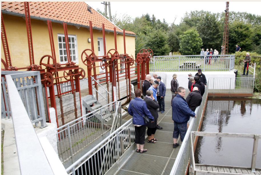
De to store sluser foran det gamle elværk regulerer vandstrømmen til de to turbiner, hvoraf kun den ene er i drift. Slusen længst væk er til at regulere overløbet.