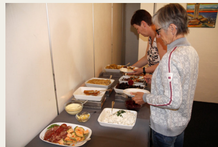
Selv om buffeen på Tannishus ikke var stor, så var der rigeligt til alle, og det var virkelig lækkert.