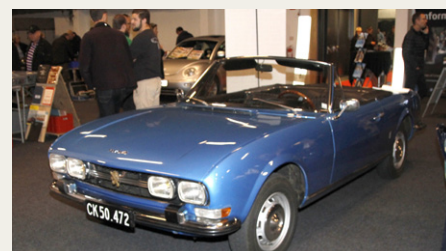
Min „nye” Peugeot var en ukendt model for flere gæster, men der var almindelig enighed om, at det var en flot model.