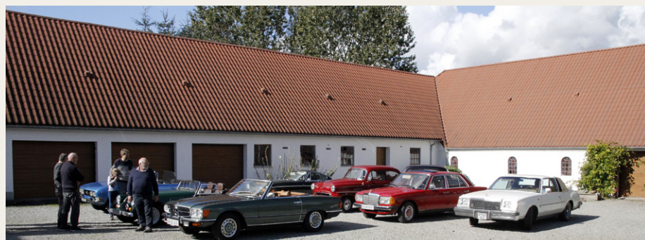
De deltagende biler samlet på Bentes gårdsplads.