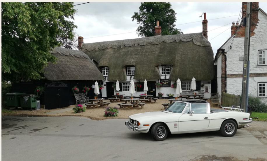
Lokation hvor Midsomer Murders (Barnaby) er optaget.

og jeg kørte videre mod området vest for London, for at besøge flere lokationer, som er brugt til optagelser af TV-serien Midsomer Murders (Barnaby). Vi startede i Henley-on-Thames derefter Loddon