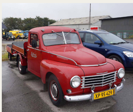
Det var dog også deltagerne, som godt kunne klare sig med „kørekort light“.