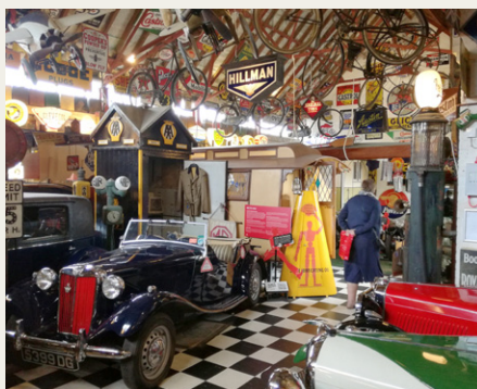
Besøg på et museum i Bourton-on-the-Water.

Derefter kørte vi til Bourton-on-the-Water, som også bliver kaldt det lille