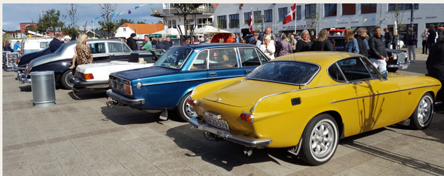
Ud af de 56 deltagende køretøjer, kan en stor del af ejerne skrive „Medlem af NVMK“ på visitkortet.