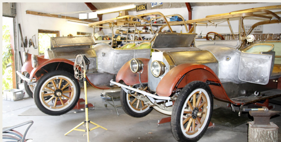
De to Pierce Arrow fra 1915.