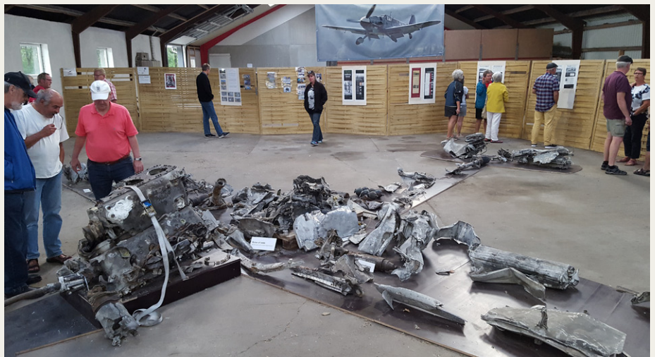
Udstillingen i ladebygningen med bl.a. motoren fra Messerschmitt'en opstillet på plader, der angiver omridset af flyet, så man kan se, hvor de forskellige dele har siddet.