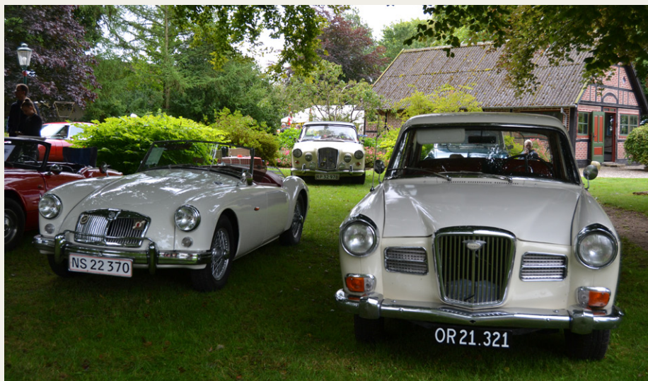
Hvid er en populær farve.