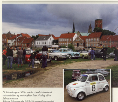
På Hovedengen i Ribe mødes et halvt hundrede veteranbiler- og motorcykler hver tirsdag aften hele sommeren. Ribe er lidt uden for NVMKs geografiske område, men måske kan vi lære noget - Gerner har et godt resultat som kan læses på side 5. Men hvis I lige kaster blikket på side 2 først, der sker noget allerede søndag og mandag...