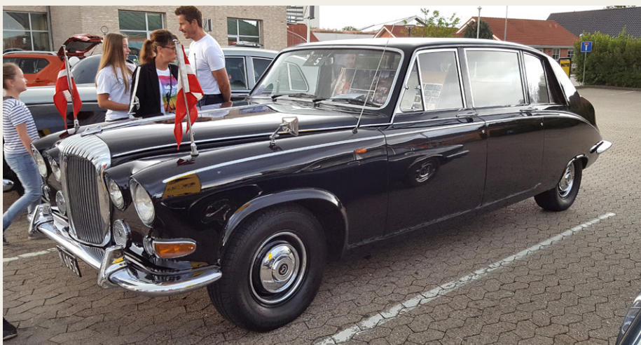
„Mejeristens“ flotte Daimler Limousine har tidligere tilhørt Kongebuset under navnet „Krone 5“, og den tiltrak mange mennesker.