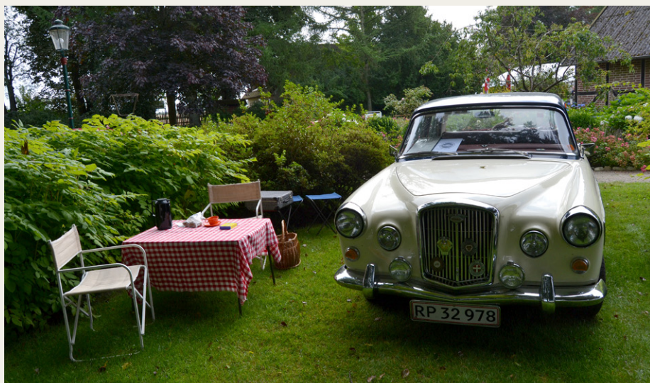
Mit eget lille hyggelige hjørne.

Tekst og Foto: Gerner Nielsen (Mr. Wolseley)