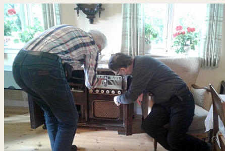
To tekniknorder studerer det gamle B&O anlæg i stuen på Vildmoseporten.

1949 efter kvægtuberkulosens udryddelse blev ombygget til beboelse og grisestald, så de kunne forpagtes ud og blive hjem for en familie. Efter gården er blevet museum, er beboelsen ført tilbage til et udseende som i 1949 ved hjælp af frivillig arbejdskraft og donationer af møbler og andet indbo, der passer til en indretning fra 1940'erne, og i laden er der oprettet en stor udstilling om Vildmosen. Vi afsluttede besøget på Vildmoseporten med smørebrød i stalden.