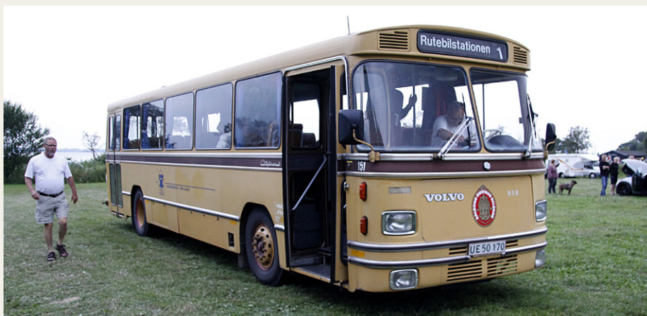
Verner Så er bussen ved at være klar til afgang

Efter et par timer var der tyndet så meget ud på parkeringspladsen, at det var tid at vende tilbage til det nordjyske. Endnu en dejlig tur i godt selskab.