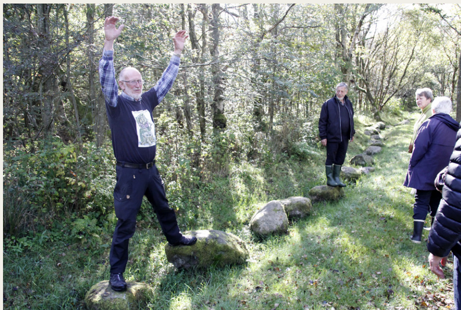
Trædestenene ved Åby Bjerg.

Under rundturen gjorde vi holdt flere steder, bl.a. ved Mindestedet, hvor et engelsk bombefly styrtede ned under Anden Verdenskrig, ved Centralgården, som blev bygget samtidig med de 19 staldgårde, og hvor alle de ansatte boede, og som nu er efterskole, og ved trædestenene, en stenrække gennem mosen, som er anlagt omkring år 250. Endeligt holdt vi et ved et område med uopdyrket højmoser, hvor