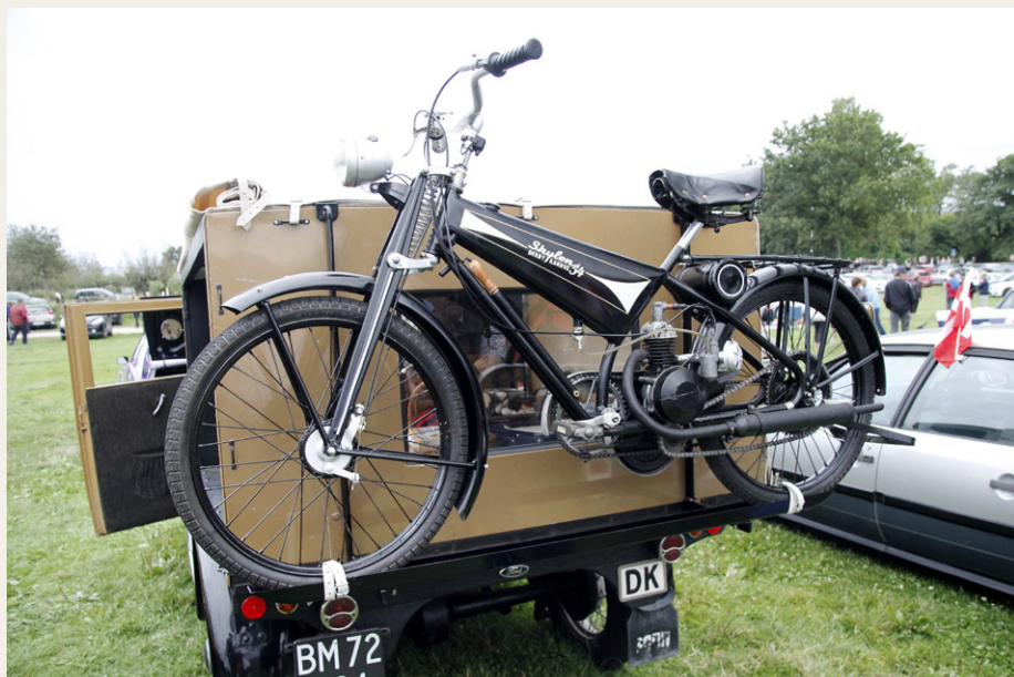
Ejeren af denne flotte Ford Model A Pick Up fra 1931 havde i sidste øjeblik fremstillet et specielt ophæng, så han kunne få sin nyrenoverede Skylon knallert med til træf.