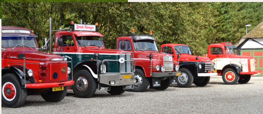
En flot række lastbiler.