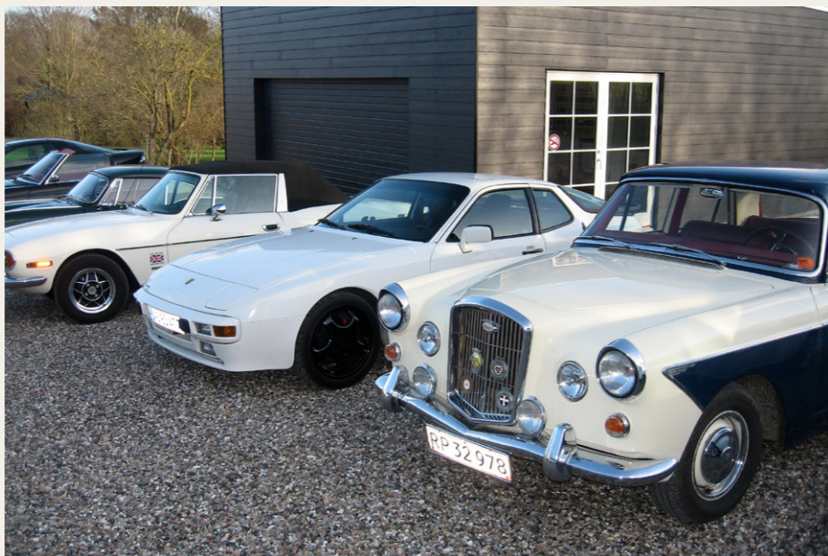
Et uddrag af de mange flotte veteranbiler.