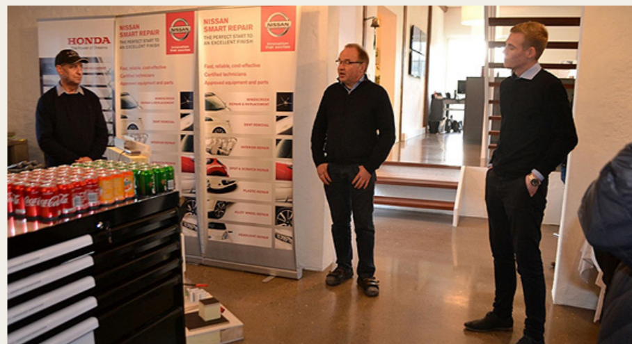
Vi blev alle samlet indenfor i det flotte udstilling/showroom.