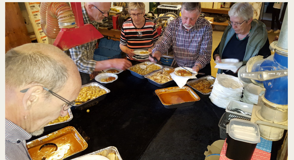
For de, der nåede tilbage til Veddum, blev der serveret en lækker frokost.