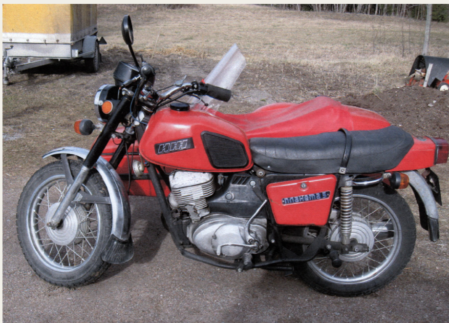
Hvis man søger efter denne motorcykel på internettet, vil man få at vide, at den hedder IZH, men de kyriliske bogstaver på tanken fortæller tydeligt, at den kun hedder IZ.

på russiske veje (eller mangel på samme) skal man ved kørsel på asfalt vægtilpasset luftryk (nøjagtigt) i alle hjul – ellers vil Sputnikten gerne på i omløb omkring Planeta'en.