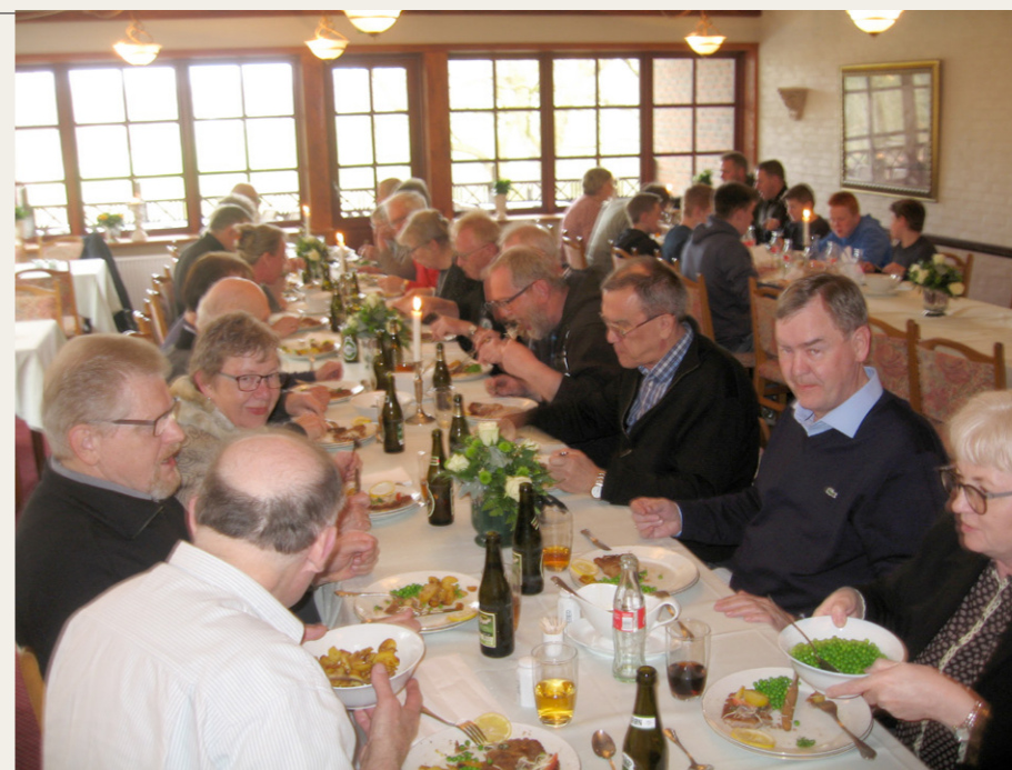
Som billedet her viser, blev der talt livligt henover spisningen.