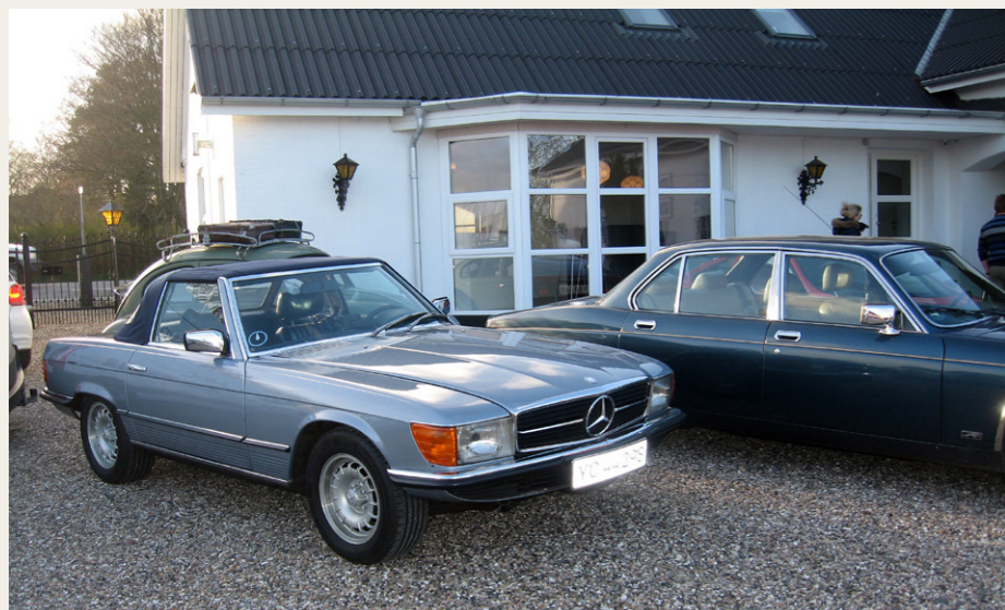
Endnu et par flotte velpudsede veteranbiler.