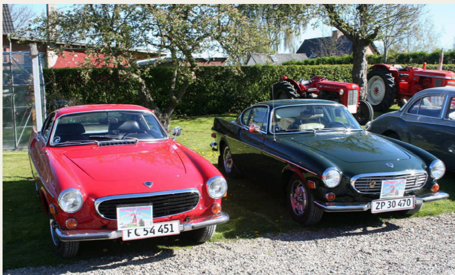
De mange deltagere, som her to styk Volvo 1800, modte nyvaskede og polerede til morgenkaffe i Veddum . .