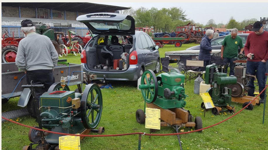
Antallet af stationære motorer var nu heller ikke overvældende.