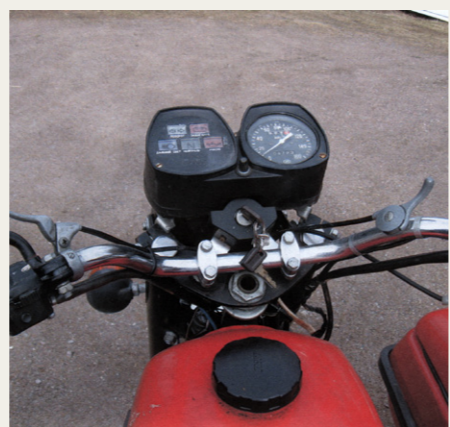
Udsigten fra førerpladsen på Sveriges eneste IZ Planeta.

DKW motoren er lige så stor en fornøjelse, og den starter under alle forhold – dog bedst når der er 10 – 20 grader (minus altså), for når der er varmegrader i luften, skal man sparke to til tre gange, hvilket føles lidt bagvendt, men når nu