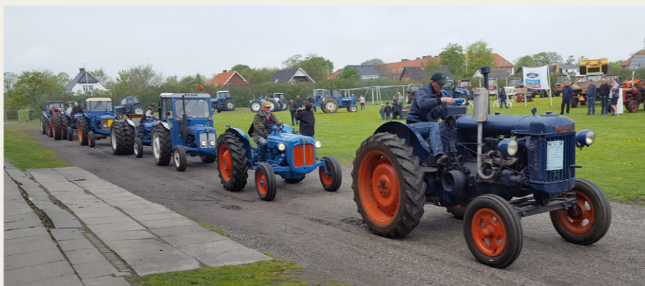
Måske var det for at fejre 100 året for den første Fordson traktor, at man lod de mange blå Ford traktorer føre an i opvisningen på det gamle stadion i Brønderslev, endda med en gammel Fordson Major helt i front.