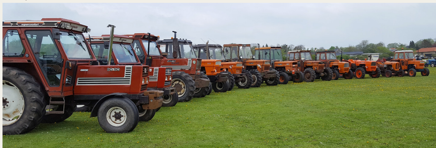
Det var ikke Ford det hele - Her er det 12 forskellige Fiat traktorer, der er linet op.