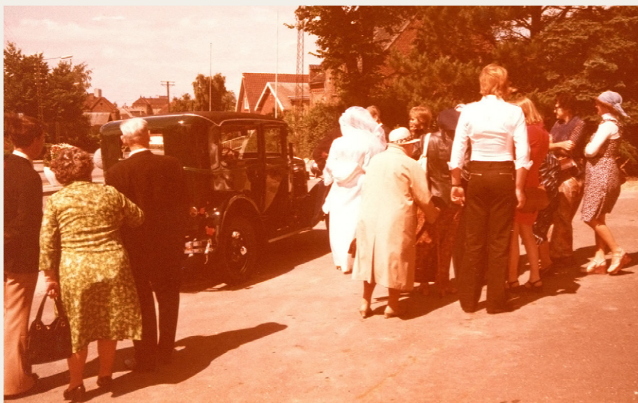
Den nyrestaurerede Ford A blev beundret af en stor skare mennesker i Vejgård.