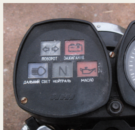
Kendskab til russisk vil ikke skade, hvis man vil forstå betydningen af advarselsslamperne.