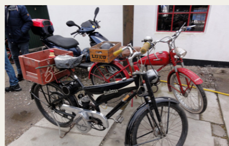
Gæsterne kom ikke kun i busser og veteranbiler, et par fine gamle knallerter havde også fundet vej til Dansk Motorsamling.