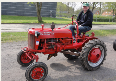
En lille Farmall Cup fra 1949, 9,75 hk, fylder ikke meget på cindersbanen