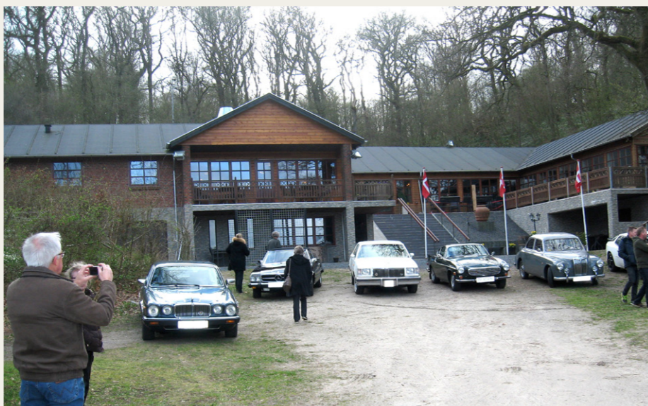
Lidt parade af nogle af de deltagende biler foran Skivum Krat - og tid til at snuppe lidt billeder.