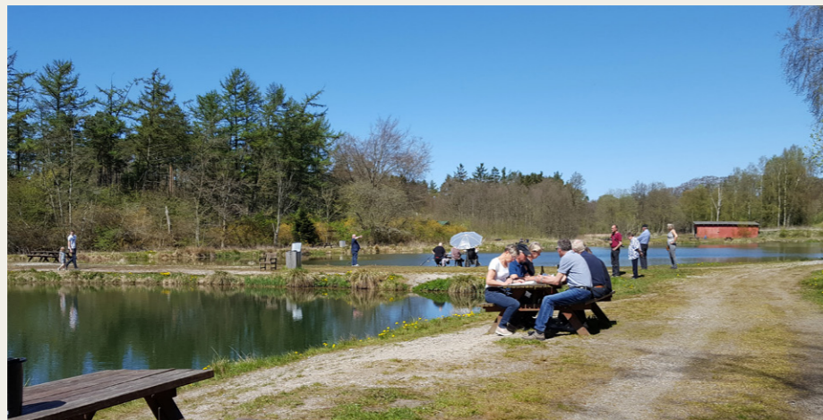
Ved fiskesøerne blev borde og bænke taget i brug, mens opgaverne blev løst