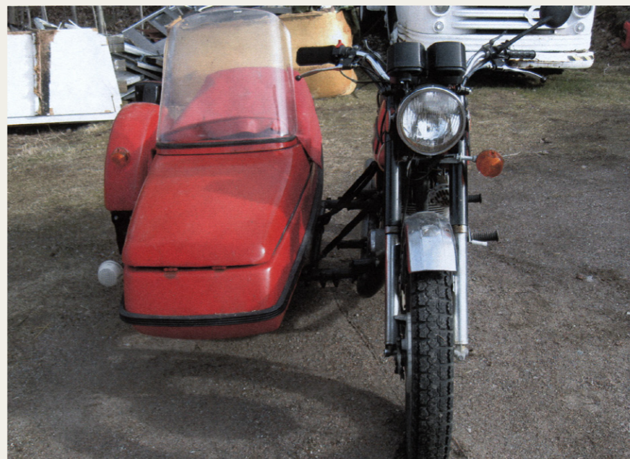
På billederne ser IZ'en relativt fiks og smidig ud, men det er synsbedrag. At sammenligne den med en MZ 250 er som at sammenligne en Harley Davidson med en Velo Solex.