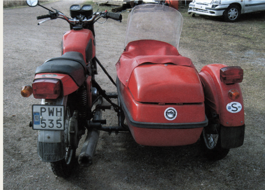
Den eneste IZ Planeta 5, der findes i Sverige, er altså ejet af en dansker.

karburatoren er tilpasset Sibirien, må man vel regne med det?