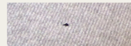
Før . . .