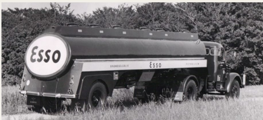
En lidt ældre tankvogn fra Gistrup.

Der vil være gratis kaffe og kage til alle.