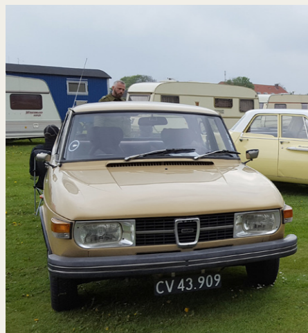
Selv om antallet var lidt mindre end sidste år, så var der biler til stede, blandt andet denne fine Saab 99 fra 1973.