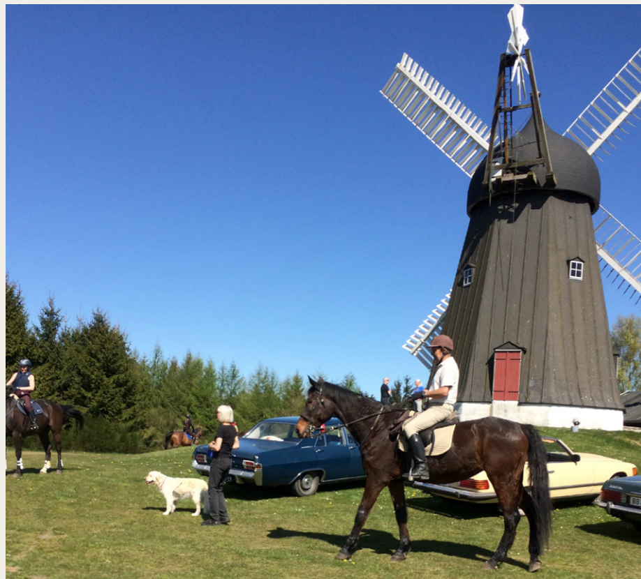
Ved Bælum Mølle mødte vi også en ryttere, som var ude for at nyde det gode vejr. Man forstår dem godt.

and Take, hvor vi fik lidt til ganen samt løst den sidste opgave på turen.