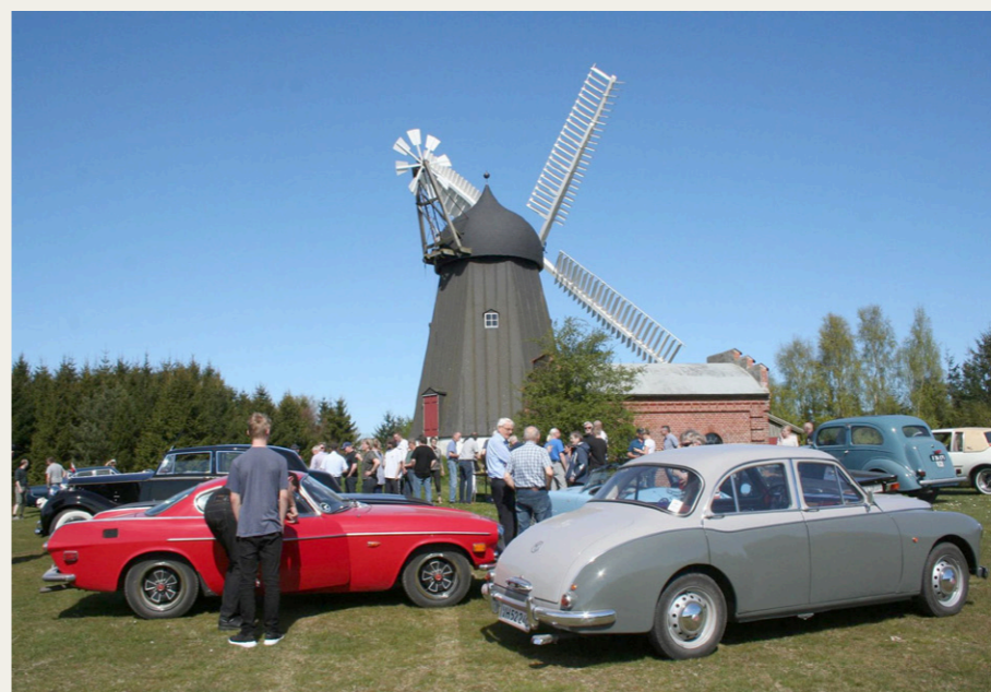
Bælum Mølle tog sig rigtig godt ud omgivet af veteranbiler i det smukke sommervejr.

I år var der tilmeldt 24 køretøjer og 66 personer.