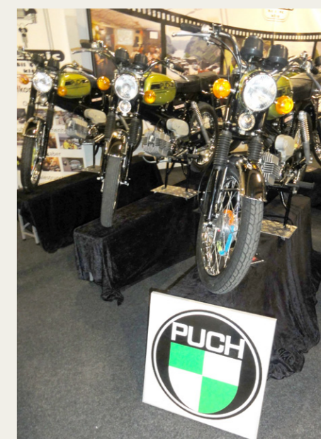
Hos Aalestrup-klubben kunne disse flotte Puch-knallerter nok drive en smule misundelse frem hos mindst en af de „gamle“ drenge.