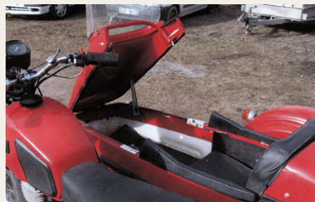
„Abent bus“ i passagerkabinen.

Hvor meget man nu skal lægge i valget af modelnavne, er jeg lidt usikker på, men som det tydeligt fremgår af billederne, hedder motorcykler „Planeta 5“, og en to-cylindret variant hedder „Jupiter 5“, men eftersom det hele er lavet til at køre