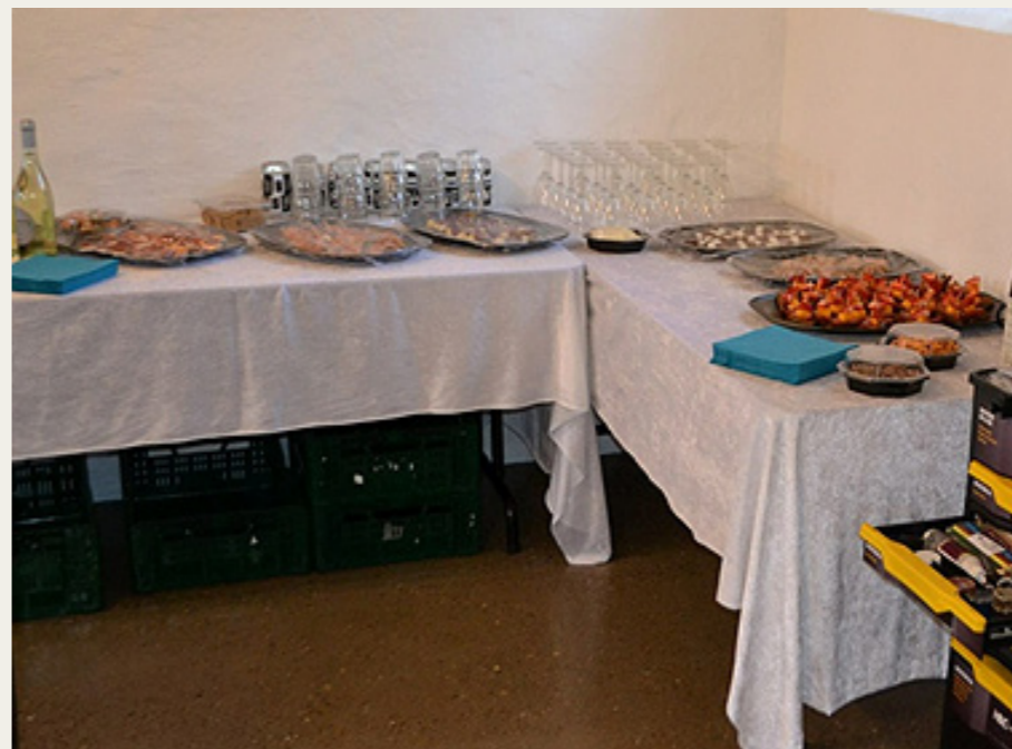
Aftenen blev afrundet med pindemadder og et glas vin eller øl.