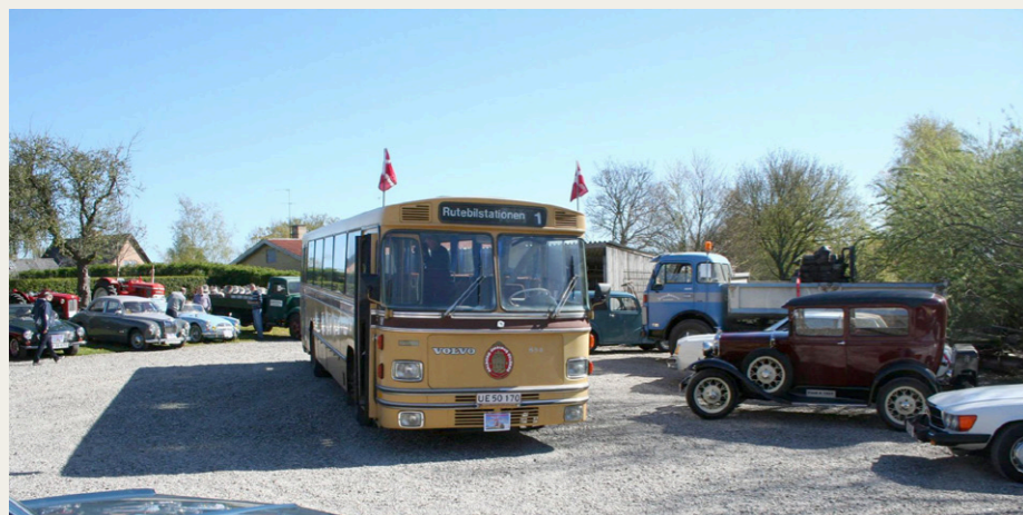
Veteranbiler og blå himmel med klubbussen i centrum - så bliver det ikke meget bedre.

Vel ankommet til Eriksens værksted, blev vi budt velkommen og budt ind på kaffe og rundstykker i det hyggelige og flot pyntede værksted. Forinden var Eriksens bagård blevet indtaget af 24 flotte gamle