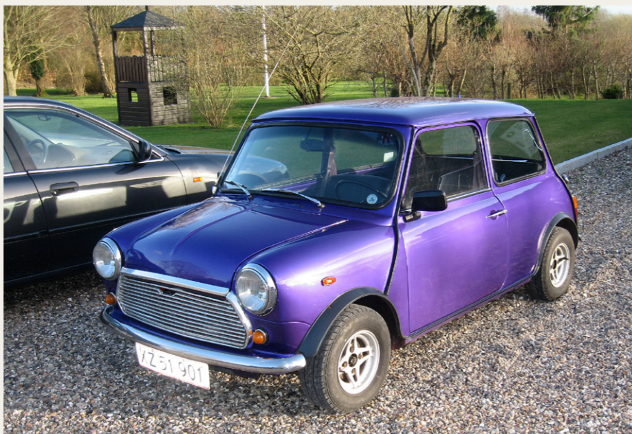
En af aftenens flotte nypudsede veteranbiler.

Carheal har virkelig godt fat i det internationale marked, hvorimod det