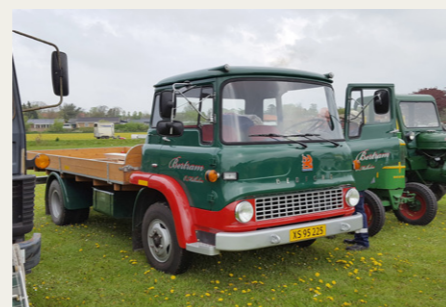
Denne lille Bedford var en flot repræsentant for de lastbiler, der havde fundet vej til Brønderslev.