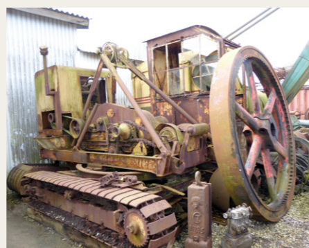
Bag den store hal ligger et af de mange fremtidige projekter, endnu en gravemaskine fra Pedersbaab Maskinfabrik. Der skal vist bruges rigtig mange timer, før den er graveklar