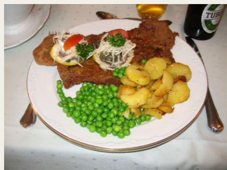
Her et billede af aftenens menu, der blev afrundet med Citronfromage og kaffe.

En sjov lille historie der også hører til denne aften var, at et lille selskab på ca. 10 personer havde hørt om aftenens arrangement, så de koblede sig på samme menu.