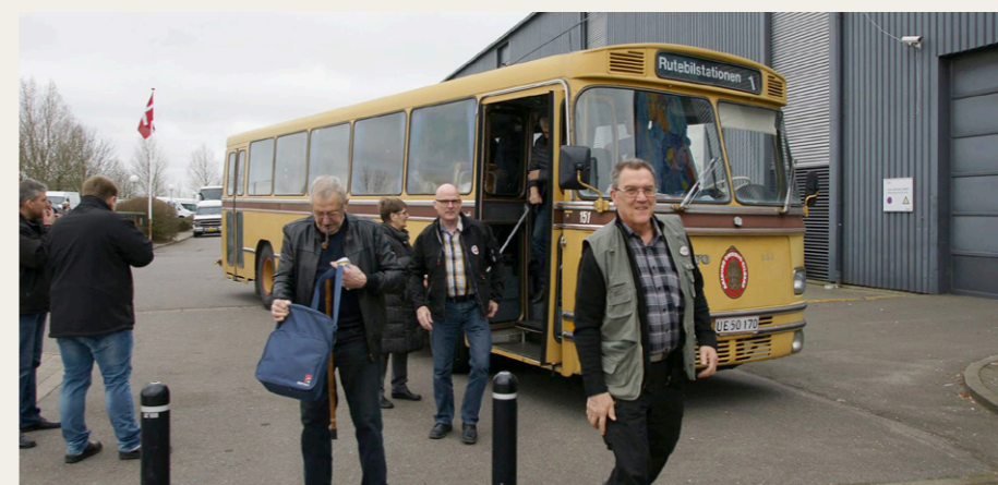
Den gamle bus fra NVMK har nået målet ved messecentret i Fredericia.