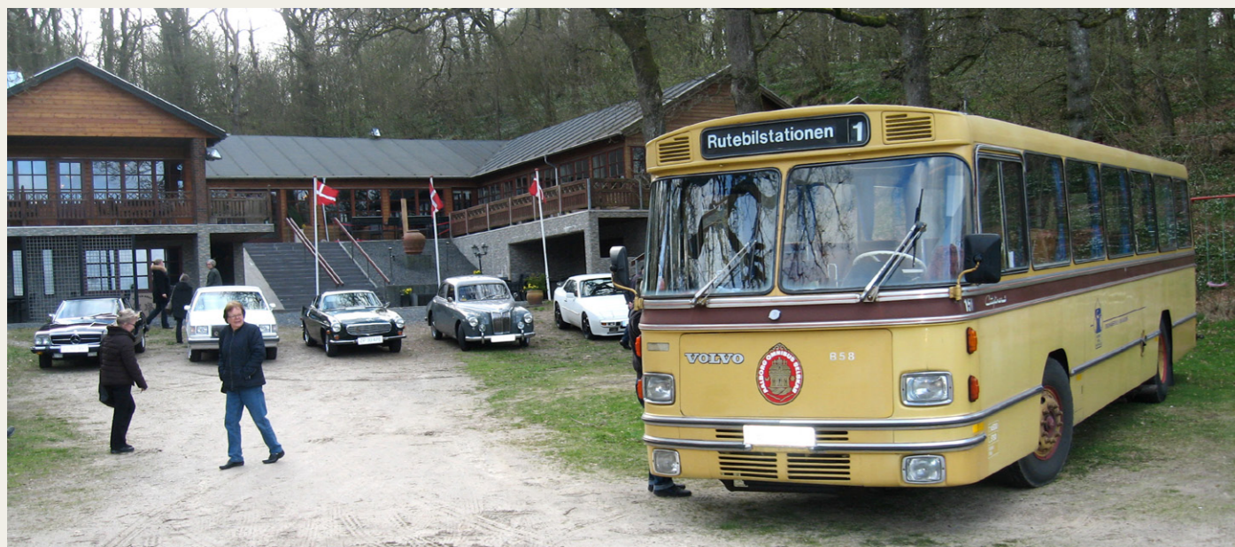
Klubbens tur-bus var ligeledes repræsenteret på denne tur.