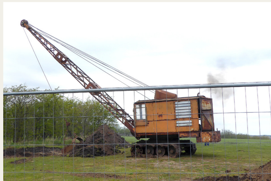
Den gamle PM1 gravemaskine fra Pedersbaab Maskinfabrik AS i Brønderslev gravede store huller i marken bag motorsamlingen.