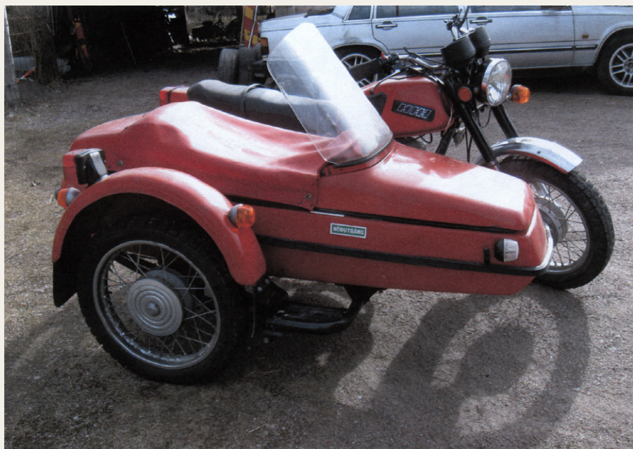
Sidevognen „Sputnik“ bærer præg af at være fremstillet på fabrikkens afdeling for kampvogne.