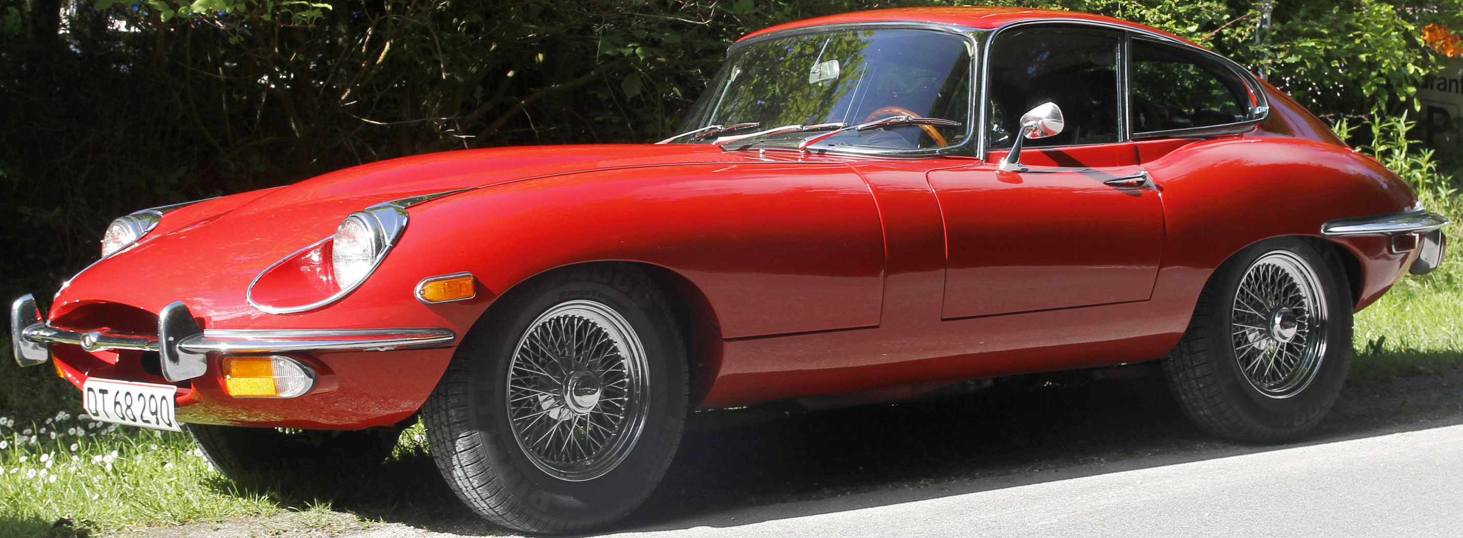
1970 Jaguar E-Type 4,2 ltr. Tilhørende Per M. Pedersen, Kås