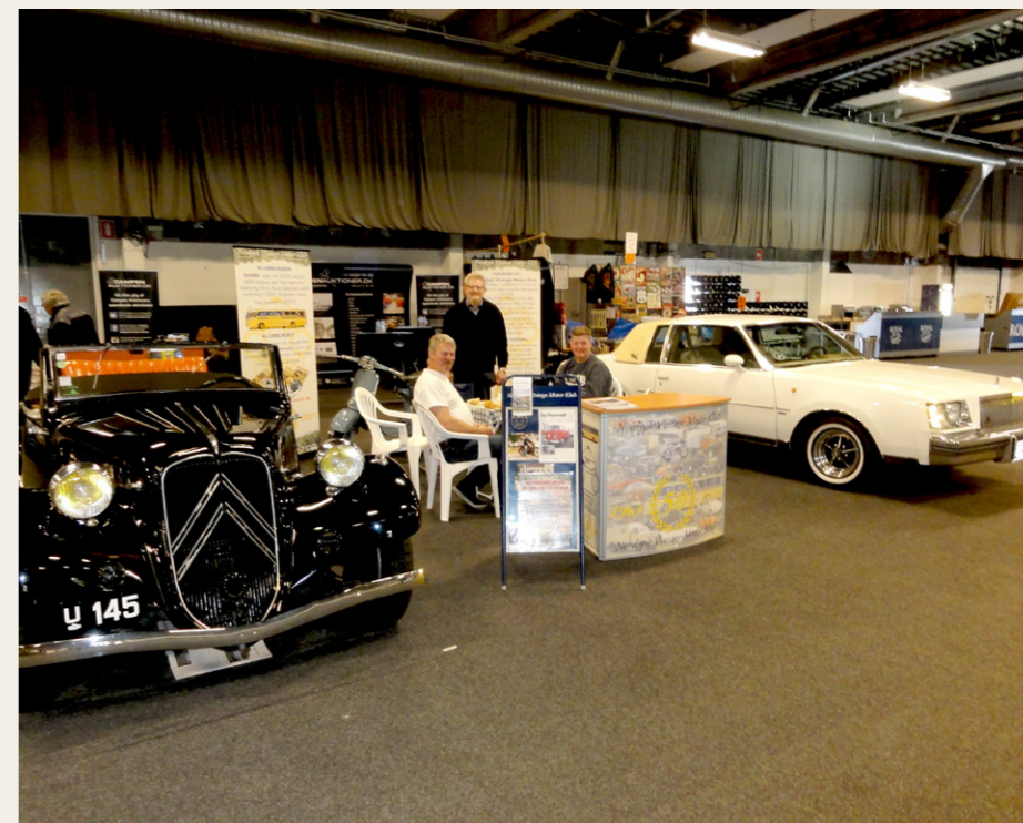
Efter opstilling af køretøjer, borde, stole med mere var der lige tid til en kop kaffe, inden portene blev åbnet for publikum.

Messecentret er under ombygning. Hal 2 er væltet, hvad der normalt er placeret