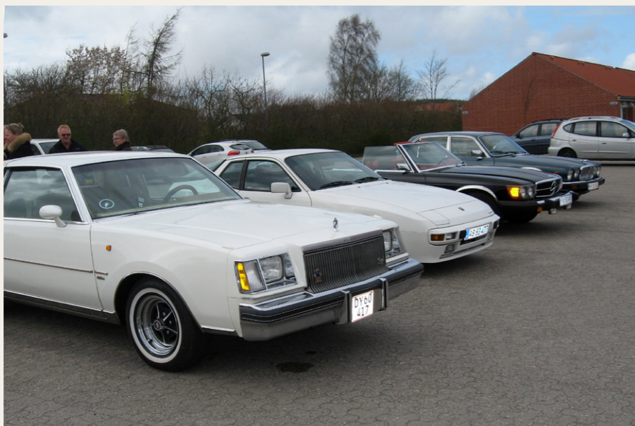
Deltagerne er ved at gøre sig klar til afgang fra Shell i Støvring.