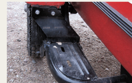
Et solidt trinbrædt letter adgangen til sidevognen.