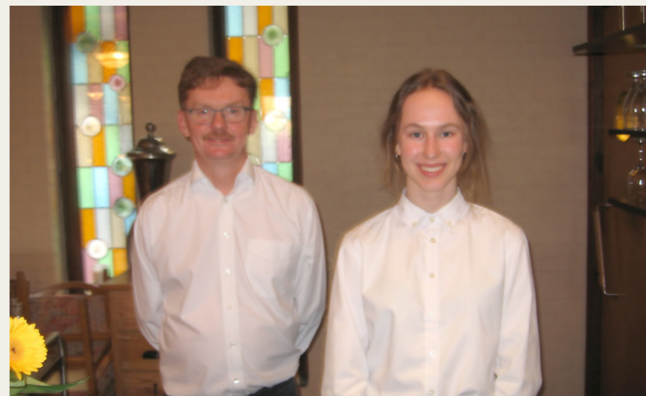
Aftenens værter som vi kan takke for den, dejlige veltillavede Wienerschmitzel og citronfromage samt en rigtig hyggelig og personlig atmosfære.

Det viste sig som aftenen skred frem at de faktisk også var medlemmer af NVMK, men bare ikke havde fået sig tilmeldt, så alt i alt endte vi jo med at de 22 blev til 32 deltagere.