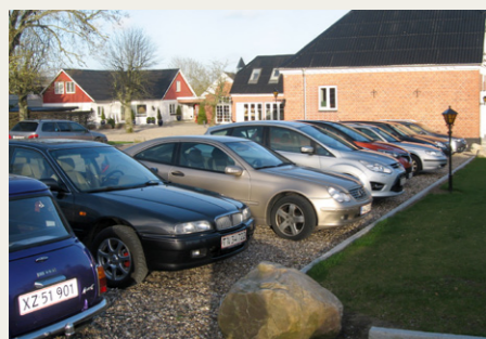
En del var også mødt op i deres privatbiler.