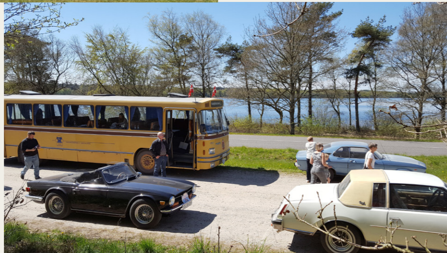
Opholdet ved Madum Sø blev lidt kortere end planlagt, selv om deltagerne nød det gode vejr og den flotte natur ved søen.