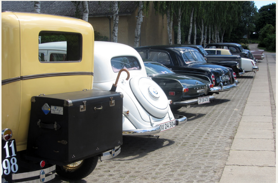
Jeg ved ikke, om det var en forudelse, der gjorde, at den gamle Opel Kapitän blev parkeret modsat alle andre, men det gjorde det noget nemmere, da den skulle skubbes igang.