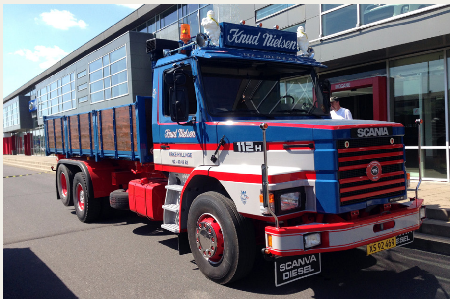
Nyeste lastbil var denne flotte Scania T112H fra 1985 med Nopa tippelad. Måske ikke en rigtig veteranbil endnu, men istandsat så den fuldstændig ser ud, som en ny entreprenorlastbil kunne se ud i 1985

Inden start på løbet var der mulighed for gå rundt på pladsen og beundre de 110 deltagende køretøjer, hvor den ældste var en Ford AA fra 1931 og den nyeste en Scania T112 fra 1986, men størstedelen fra 1960'erne og -70'erne. Deltagerne kom i år, ud over Danmark, fra Tyskland, Holland og Sverige. Starten gik i år lidt tidligere end den plejer, ca. 9.45, og med kortere afstand mellem køretøjerne, da der ellers var risiko for konflikt med et cykelløb undervejs på ruten. En blanding af store lastbiler og cykelryttere ville ikke være det bedste på de små, snoede og bakkede veje omkring Silkeborg. Som sædvanlig gav arrangør Jens Chr. Beck en god præsentation af alle de deltagende køretøjer i forbindelse med starten.