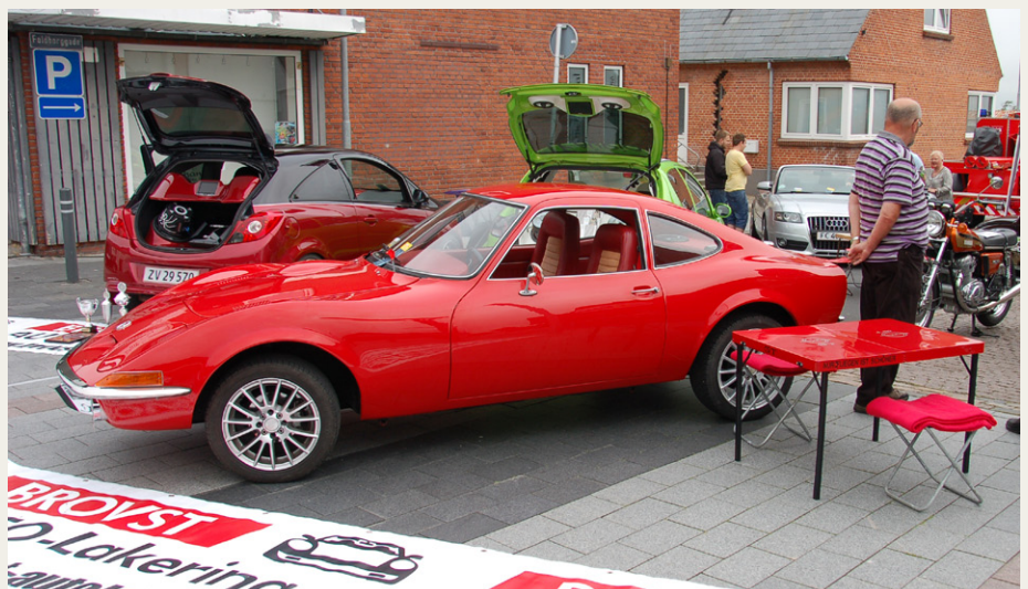
Sådan fortjener en Opel GT at tage sig ud på billeder.