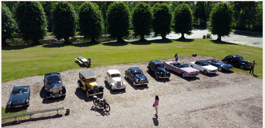
De fleste af bilerne og den ene motorcykel set fra et af vinduerne i slottet.