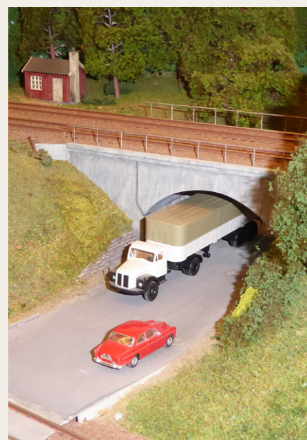
Det er dejligt at se de mange små detaljer, der er blevet plads til i det flotte anlæg. Her er det en Scania og en Volvo et sted syd for Svenstrup.