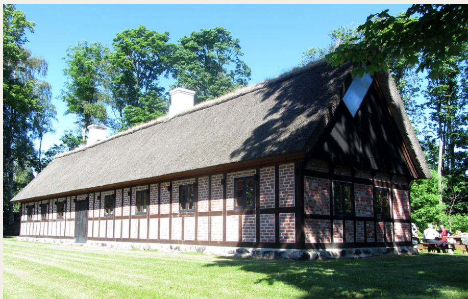
Dagen sluttede med kaffe/te og nybagt kringelkage på plænen ved Tinghuset.

Den imponerende samling er selvfølgelig beskyttet af en række sikkerhedsforanstaltninger, men det afholdt ikke et par tyveknegte for nogen år siden fra at stjæle et par malerier til en samlet værdi af flere hundrede millioner kroner. Billederne er senere kommet tilbage, men nu er det et krav for forsikringselskabet, at der skal være forbud mod fotografering inde på