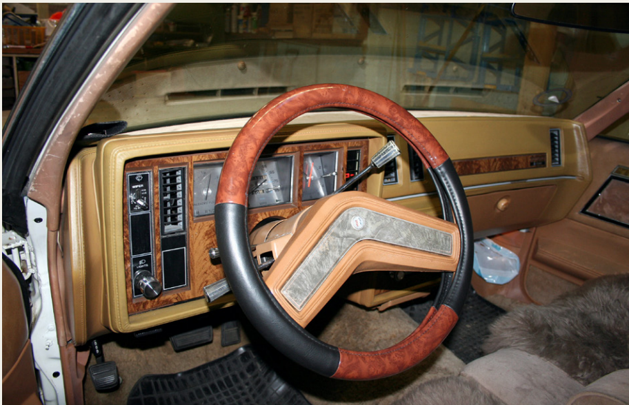
Instrumentbrættet er meget amerikansk: Ratgear, firkantede ure og store flader med noget, der ligner træ.