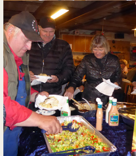
Efter løbet blev der serveret både kamsteg og oksesteg med flødestuede kartofler og grønsagsmix.