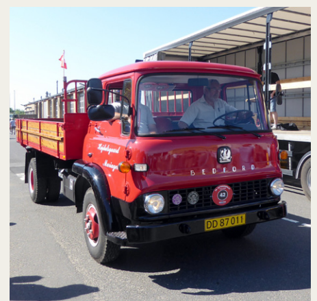
Fin Bedford K benzin fra 1965