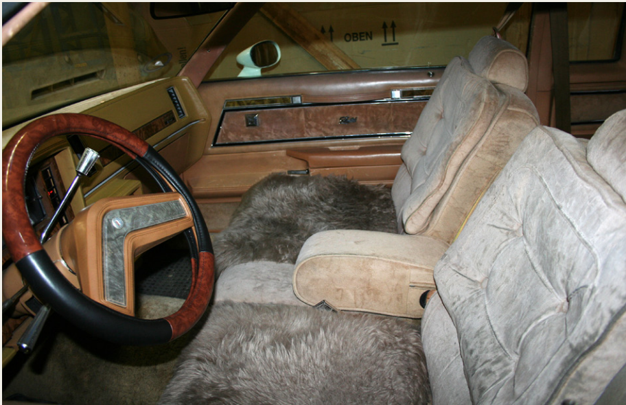
I kabinen er der lænestole så bløde, som dem vi har foran fjernsynet