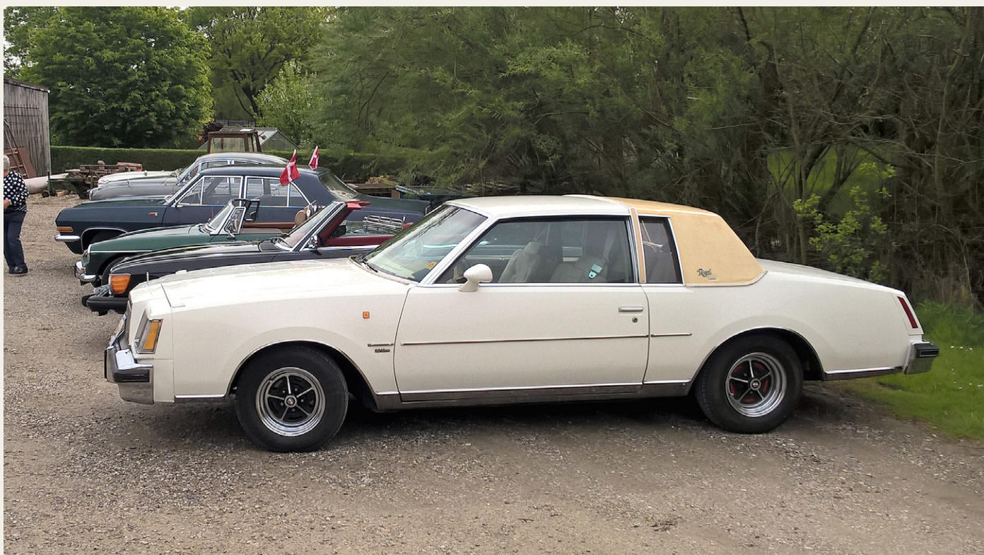
Den „nye“ Buick Regal på flojen før starten på Veddumløbet 2016.