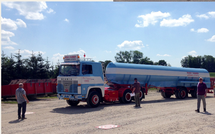
Scania LBS140, der fik en andenplads i årets konkurrence om flotteste køretøj. Fotograferet ved en post, hvor det gik ud på at ramme plet med et lod, hængende i en snor under forkofangeren

Ude på ruten var der ni poster med en blanding af spørgsmål og mere praktiske opgaver. Blandt de drilske spørgsmål var bl.a. tilladt akseltryk på to-akslet bogie før 1977 (14,5 tons, yes én rigtig), akselafstand på vores køretøj (jeg påstod desværre at, den er 5 meter, korrekt svar 5,5 meter, da Bussen er en Volvo B58-55), første NMT telefon i Danmark (1982, vi gættede rigtig) og kombiner 5 billeder af dækmønstre til lastbiler med det korrekte navn (vi havde ingen anelse og 5 forkerte...).