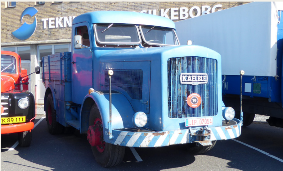
Meget speciel Kaelble „Schwerlastzugmaschine“ af ukendt årgang. Motor på ca. 14 liter og 150 hk. Motoren både lignede og lød som noget, der hørte hjemme i et lokomotiv