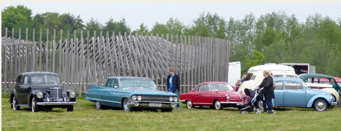
Et udsnit af de 12- 15 biler, der var til stede sidst på formiddagen.

mindre sjældne traktorer, og som noget nyt var der en udstilling af havetraktorer med forskellige redskaber. Blandt traktorerne var der en ret sjælden lille BMC Mini traktor fra starten af tresserne.