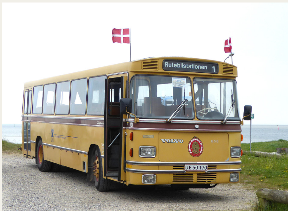
Nordfysk Vintage Motor Klubs gamle klubbus deltog også i Veddumløbet. Bussen ses her ved Als Odde.