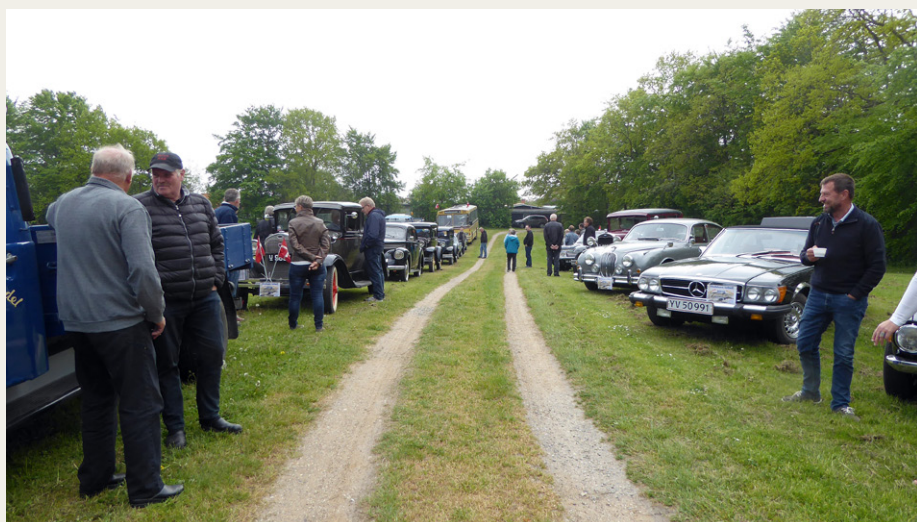
På Øster Hurup Strandpark var der tid til en lille pause og en opgave.