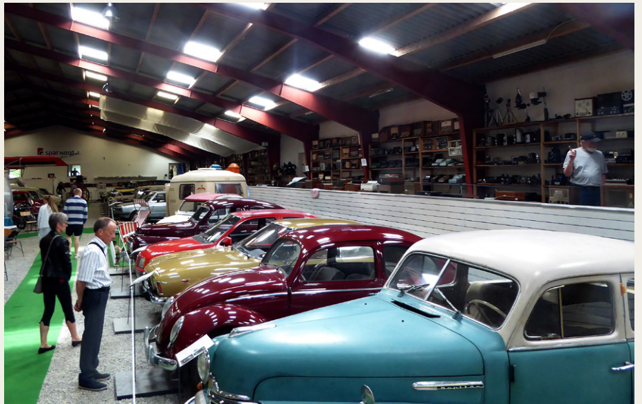
Turens første stop var ved Hjallerup Mekaniske Museum, hvor der var mulighed for at beundre den flotte udstilling.