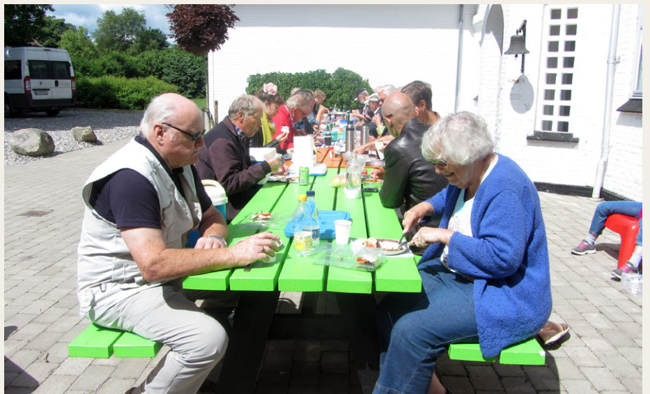
Ved Try Efterskole nød vi den medbragte frokost udendørs i det flotte sommervejr.