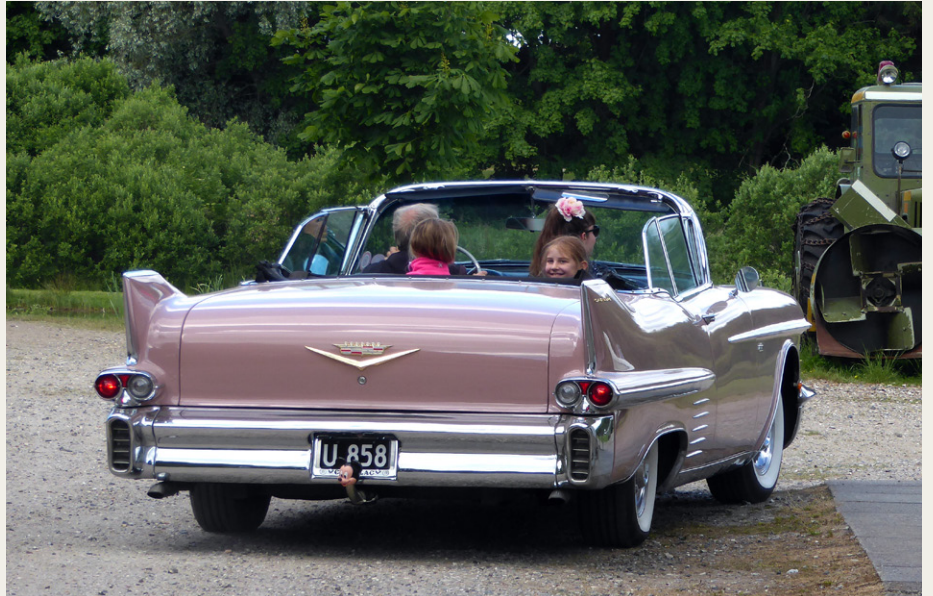
Et par heldige piger havde fået plads bag i den flotte Cadillac, som her lægger an til landing ved Hjallerup Mekaniske Museum