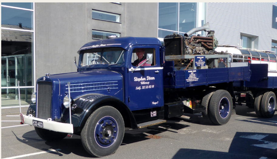
Danmarks ældste Scania Vabis, type 33315 fra 1939 ejet af Stephen Dixen fra Dragør