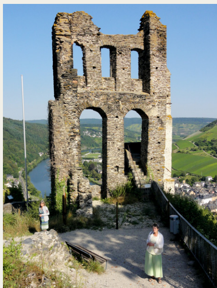
Grevenburg borgruin ved Traben-Trarbach

Vi fandt efter flere forgæves forsøg udsigtspunktet Calmont, som omfatter Europas stejleste vinmarker, højde på knap 400 m o.h. Hvad mødte vi langs med floden? Masser af oldtimertraktorer med campingvogne. Og hvad foretog de sig her? Træf i området og målet var hygge, øl- og vinsmagning. Vi så bl.a. en flot rød Güldner G30S (3 cyl., 30 hk, årg. 1964). Og i Beilstein mødte vi en Lanz Bulldog D 2416, årg. 1952, hvor vi kontant af kvinden blev oplyst, at hun var „die Besitzerin“.