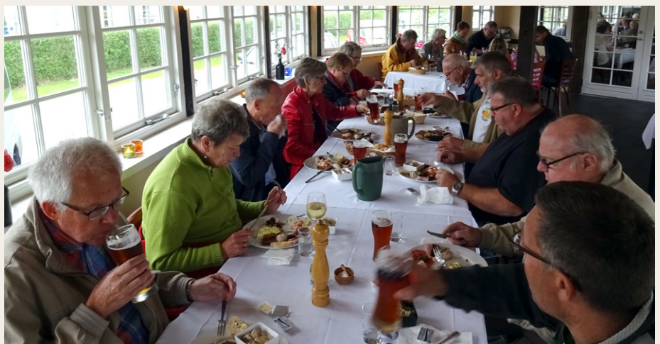
På det smukke Traktørstedet Skovgårds Raaling serverede de den bedste platte, vi nogen sinde havde fået. Selv børnene var begejstrede.