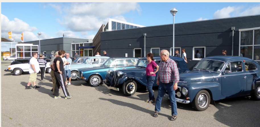
Ved afgang fra Aabybro, var der samlet omkring en halv snes veteranbiler.