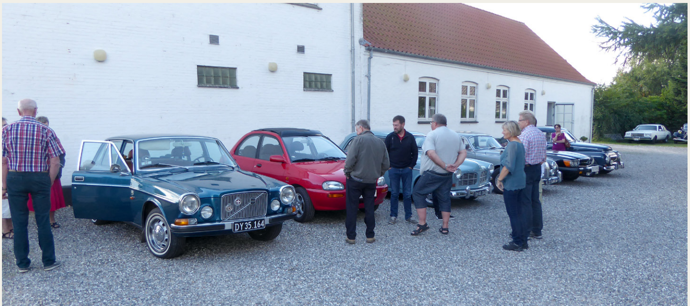
Efter den flotte frokost blev der sparket dæk og snakket biler i det flotte, næsten sommeragtige efterårsvejr på parkeringspladsen ved Skovsgaard Hotel.

Strand, hvor der var lavet en aftale med formanden for Thorupstrand Kystfiskerlaug, der havde givet tilsagn om, at han kl. 15.00 ville vise os rundt og samtidig fortælle os om alle de tiltag, som er sket i det lille fiskerleje over de senere år.