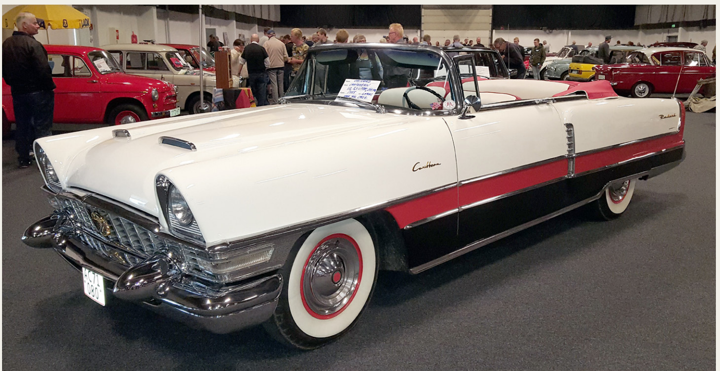
Thorben Damsgaards flotte Packard Caribbean Cnvertible fra 1955 strålede som en sol midt i udstillingshallen.