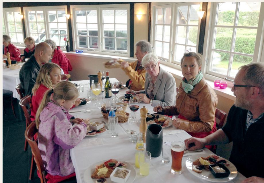
Hygge ved frokosten på Skovgaards Raaling.