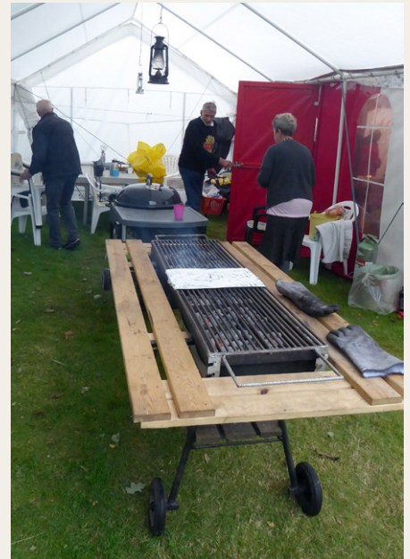
Selv Bernts store hjemmelavede grill og Weber'en kunne stå beskyttet mod regnen.