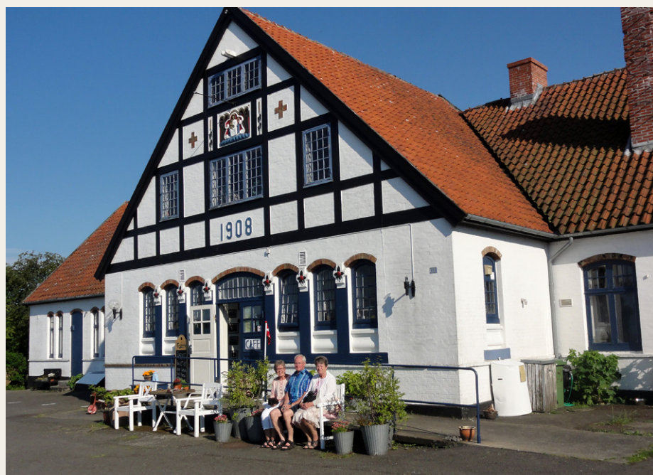
Fru Petersens Café i Østermarie serverer solskin og stegt flæsk med persillesovs . . .

Granitbrud med DGI-broen måtte ligeledes udforskes, både fra land- og fra søsiden, og selv vore kvinder vendte tomten opad. Netop denne dag foregik der i området triatlon-løb, og granitbruddets niveauforskelle „trak virkelig tænder ud“ på deltagerne.