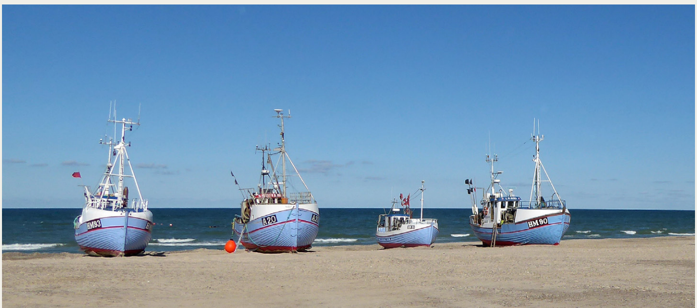
Nogle af de fiskekuttere på Thorup Strand, som er blevet landskendte gennem TV-serierne „De unge fiskere“ på DR og „Gutterne på kutterne“ på TV2.