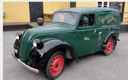
Morris varevogn fra 1950, som reklamerer for Provstindens Guf