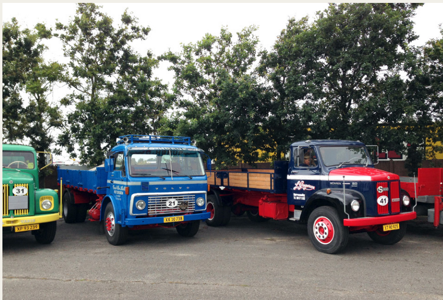
Et par fine tipbiler, som de kunne se ud ved den lokale vognmand i 70'erne: Volvo F86 og Scania L50. Volvoen endda med et læs grus, lige klar til levering på hjemvejen.

Sjællandsgade 36, 9000 Aalborg, Telefon: 98 12 10 00