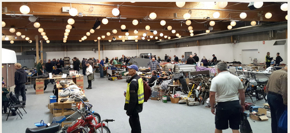
I Hal 2 kunne der godt være blevet plads til flere sælgere - og købere også for den sags skyld.