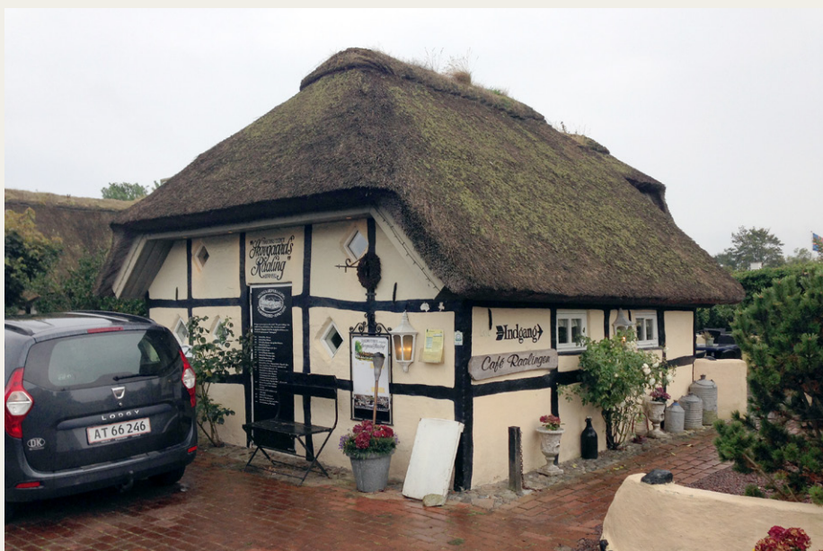
Skovgaards Raaling set udefra på denne lidt våde sensommerdag.