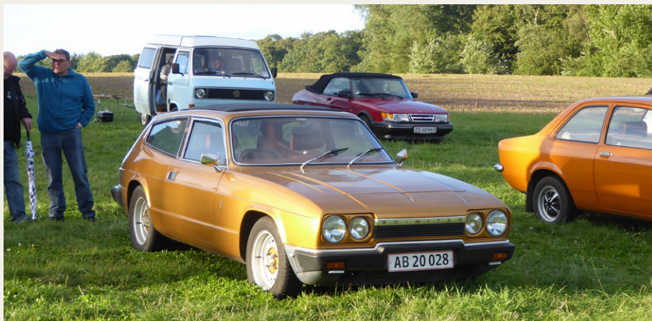
En Reliant Scimitar GTE fra 1976 er ikke noget vi ser hver dag.