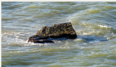
Indtil natten mellem den 18. og 19. september 1978 kunne man her beundre den 16 meter høje kalkstenssøjle Skarreklit. Nu er der kun Skarreklat tilbage, som et vittigt hoved blandt deltagerne bemærkede.