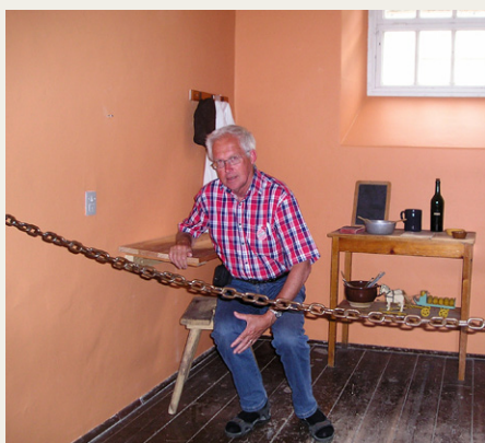
Formanden på „Vand og brød“

Medio august igen afsted på en lille tur sydover, Mosel i Midtjylland. Området viste sig som altid fra sin skønne side, med floden, vinmarker og små turistbyer som omdrejningspunkt, og eftermiddagstemperaturer på op til 28 grader. Sidstnævnte blev kompenseret ved hjælp af kølig hvidvin og dunkel Bier.