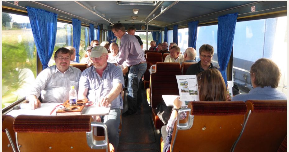
Der var højt humør og megen snak i bussen både på ud- og hjemturen.

Så der blev endelig afgang mod Kalø Vig tirsdag den 9. august klokken 17.00 fra klubhuset på Forchhammersvej. På vej nedover var der opsamling ved Haverslev og Hobro, hvorefter der blev serveret smørrebrød til de mere end 20 passagerer, som på det tidspunkt var med i bussen. Tre styk smørrebrød var der med i billetprisen på 50 kr. – det kan man da vist ikke klage over – og til dessert var der citronfromage sponsoreret af Ryå Is.