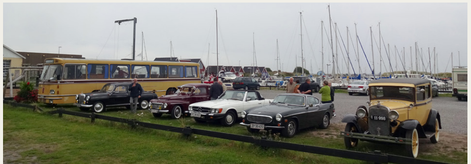
Vi parkerede ved havnen i Hou for at gå til Traktørstedet Skovgårds Raaling.