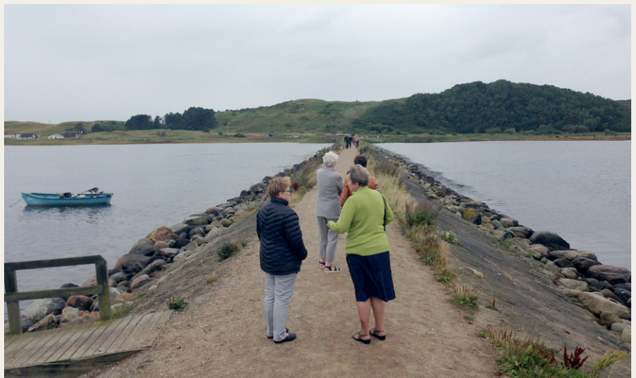
Pause på molen i Dokkedal. I baggrunden Mulbjerg.