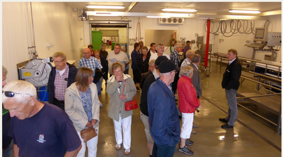
En del af rundvisningen ved Thorup Strand foregik i de kolde fabriksboller, hvor de nyfangede fisk bliver forarbejdet, inden de sendes videre til fiskeauktionen i Hanstholm.

Som afslutning på besøget blev vi også vist rundt i Redningshuset, hvor en meget stor gummibåd lå klar til at blive trukket de mindre end 100 meter ned til vandet