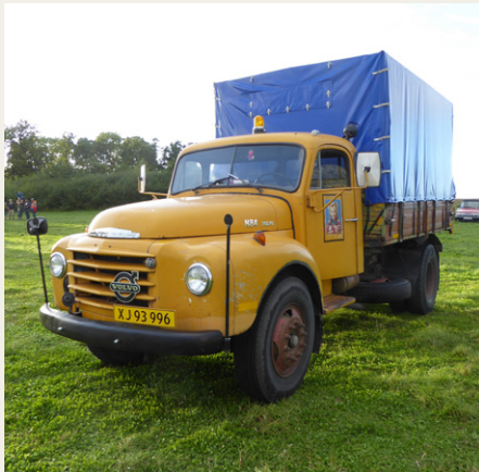
Bamsebilens søster var også tilstede ved Kalø Vig.