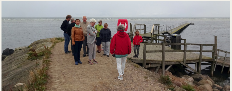
Nogle af deltagerne i det kolige sensommervej ved molen ved Mulbjergene.