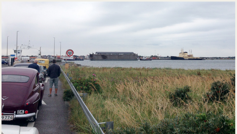
Mens vi venter på færgen i Egense. Noahs Ark sejler forbi, og i baggrunden de to isbrydere Danbjørn og Isbjørn i Hals.