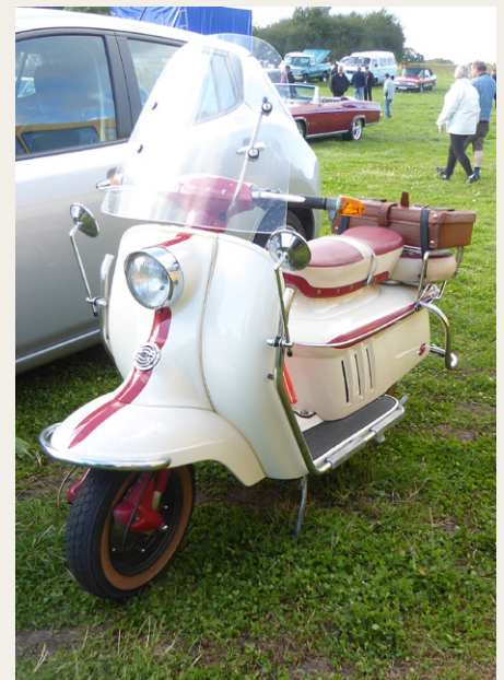
Og her en noget nyere Heinkel 150 fra 1962