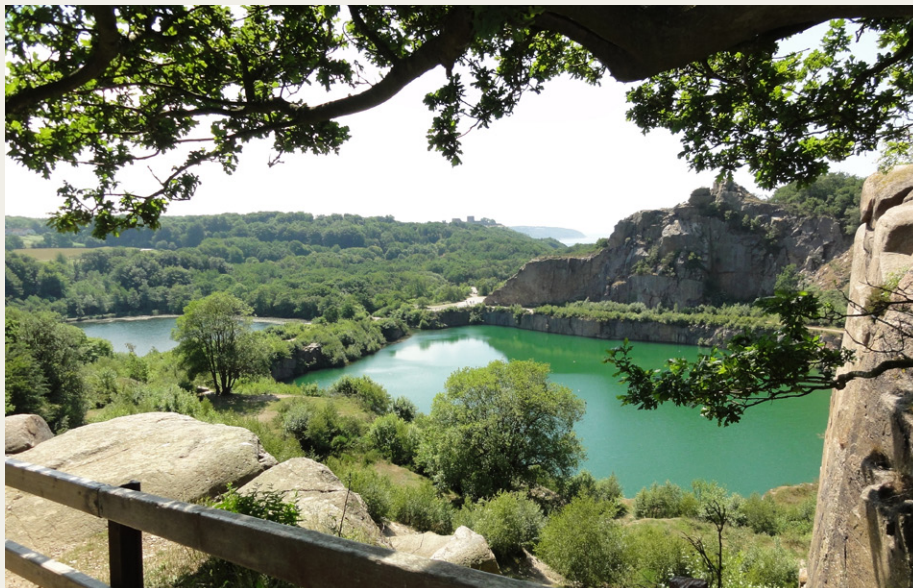
Opalsøen ved Hammeren.

Et must er hver gang at besøge Hammeren og udforske Opalsøen med dens tilsvarende klipper. Turistperlen Vang