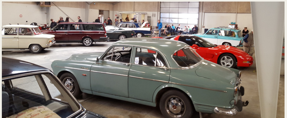
I Hal 3 var der også mange flotte og spændende biler at se på.