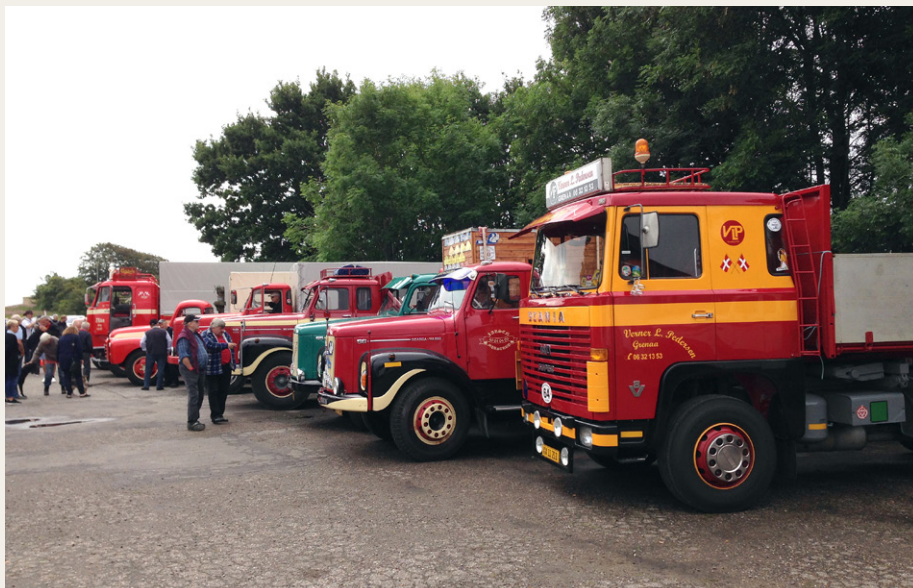
En stribe flotte Scania og Volvo. I forgrunden en LBS140 med den helt rigtige V8 lyd.