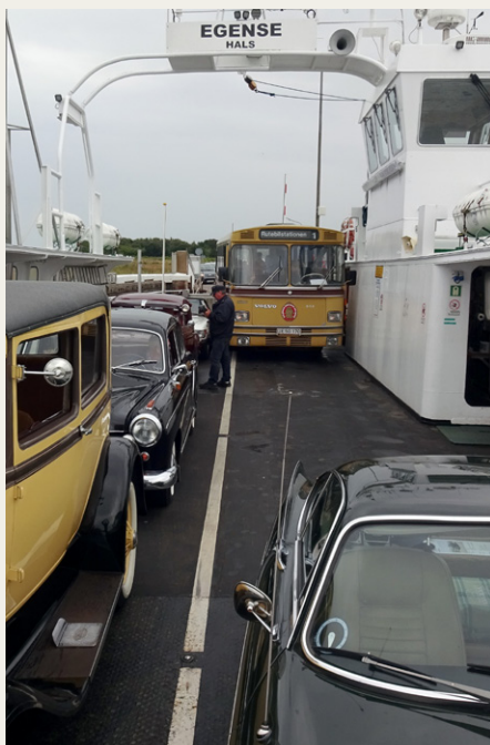
Der var plads til alle på Hals-Egense færgen, selv om det kun drejede sig om få millimeter.

Vi tog videre mod Egense for at tage med færgen til Hals. Nogen af bilernes passagerer benyttede sig af muligheden for at sejle gratis med bussen over Limfjorden. Alle veterankøretøjer inklusive bussen passede millimeter præcist på færgen, hvilket ikke mindst skyldes verdens bedste