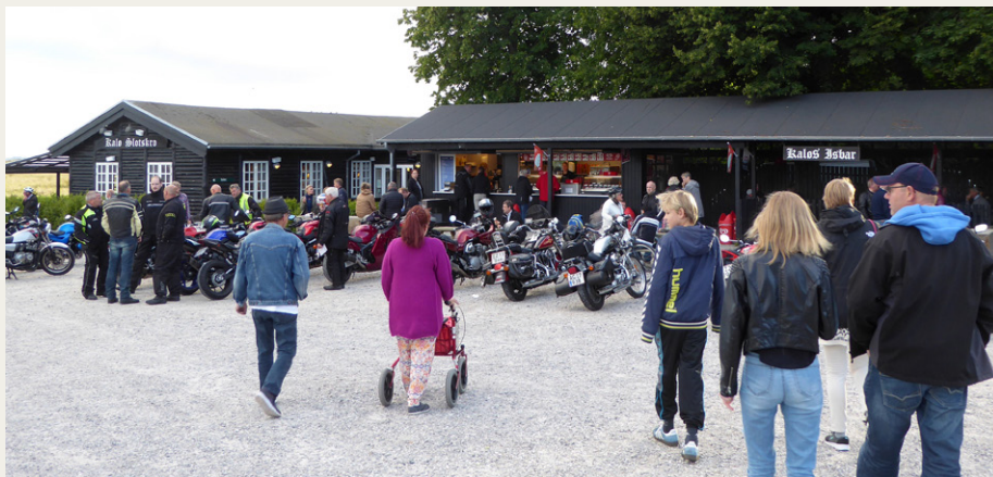
Motorcyklerne samledes foran Kalø Slotskro og Kalø Isbar.