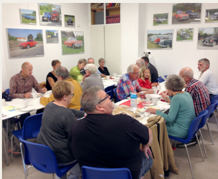
Kaffe og rundstykker i klubhuset.

Herfra kørte vi ad Egensevej, Aalborgvej langs kysten ved Mou, og fra Mou ind over Lille Vildmose. Vi kørte over de store kvægriste, der er lavet i vejene for at holde elgene inde, men selv om elgene var lukket ud i området nogle uger før vores