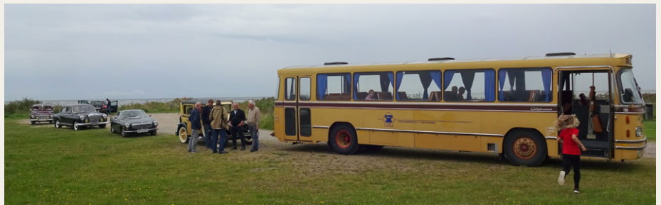
Med bussen i front ved Kattegats kyst ved Mulbjergene.