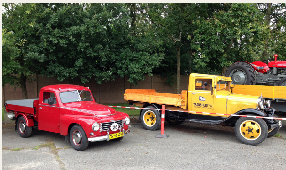
De to mindste af de deltagende lastbiler: Volvo PV 445 fra 1956 og Ford AA fra 1931.