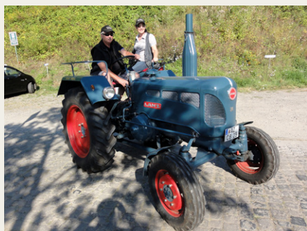
Lanz Bulldog D 2416 fra en gang i halvtredserne