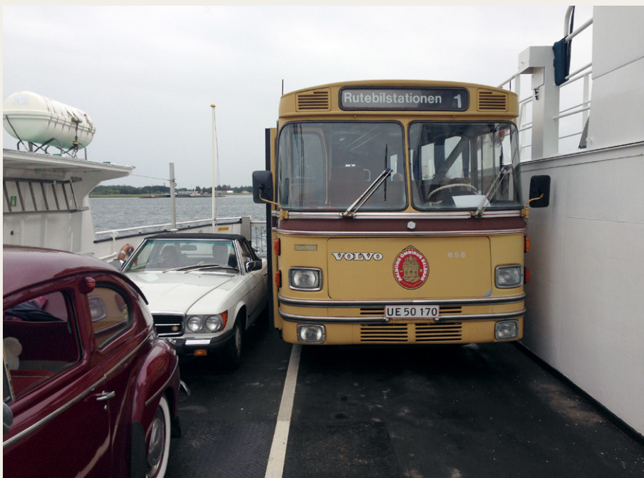
God plads på færgen.

tur, så vi desværre ikke noget til de store dyr. Videre til Dokkedal, og her kørte vi ned til stranden nedenfor Mulbjerg ad en lille vej med navn Stejlgabet. Vejen levede bestemt op til sit navn, både smal og stejl mellem bakker og træer, men med forsigtig kørsel lykkedes det at få bussen ned til stranden. Her var der strække ben pause, hvor vi alle var en tur ude på molen, og der var mulighed for toiletbesøg eller for at se en lille udstilling om kystfiskeriets historie omkring Dokkedal.