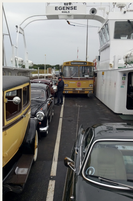
Der var plads til alle på Hals-Egense færgen, selv om det kun drejede sig om få millimeter.

Vi tog videre mod Egense for at tage med færgen til Hals. Nogen af bilernes passagerer benyttede sig af muligheden for at sejle gratis med bussen over Limfjorden. Alle veterankøretøjer inklusive bussen passede millimeter præcist på færgen, hvilket ikke mindst skyldes verdens bedste