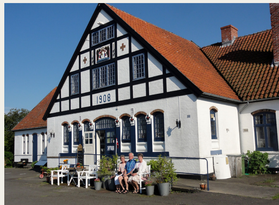
Fru Petersens Café i Ostermarie serverer solskin og stegt flæsk med persillesovs . . .

Granitbrud med DGI-broen måtte ligeledes udforskes, både fra land- og fra søsiden, og selv vore quinder vendte tomten opad. Netop denne dag foregik der i området triatlon-løb, og granitbruddets niveauforskelle „trak virkelig tænder ud“ på deltagerne.