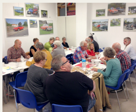
Kaffe og rundstykker i klubhuset.

Efter kaffe og rundstykker var der kl. 10.00 afgang, og med bussen i spidsen satte vi kursen øst ud af Aalborg. Omkring Universitetet kunne jeg imidlertid ikke se andre veteranbiler i spejlene, så efter samråd med Peter tog jeg lige tre omgange i en rundkørsel, indtil der igen var samling på tropperne. Herfra kørte vi ad Egensevej, Aalborgvej langs kysten ved Mou, og fra Mou ind over Lille Vildmose. Vi kørte over de store kvægriste, der er lavet i vejene for at holde elgene inde, men selv om elgene var lukket ud i området nogle uger før vores