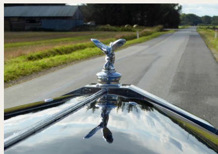
Der er en ganske flot udsigt fra passagersædet på en Rolls Royce.

Vi havde besluttet at køre til opsamlingsstedet i Aabybro, hvor der allerede var mødt 5 – 6 biler, da vi ankom. Vi fik dog straks tilbud om plads i Per Mogensens Rolls Royce, hvilket vi naturligvis takkede ja til. Per havde tilmeldt en passager, som desværre måtte melde afbud på grund af sygdom lige før afgang, så han skulle ellers have kørt alene i den store bil.