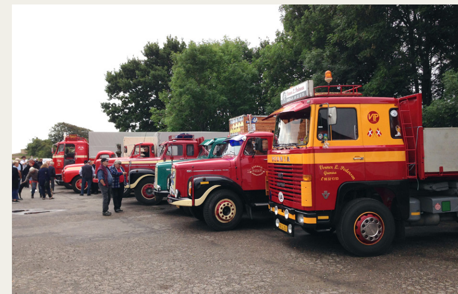
En stribe flotte Scania og Volvo. I forgrunden en LBS140 med den helt rigtige V8 lyd.