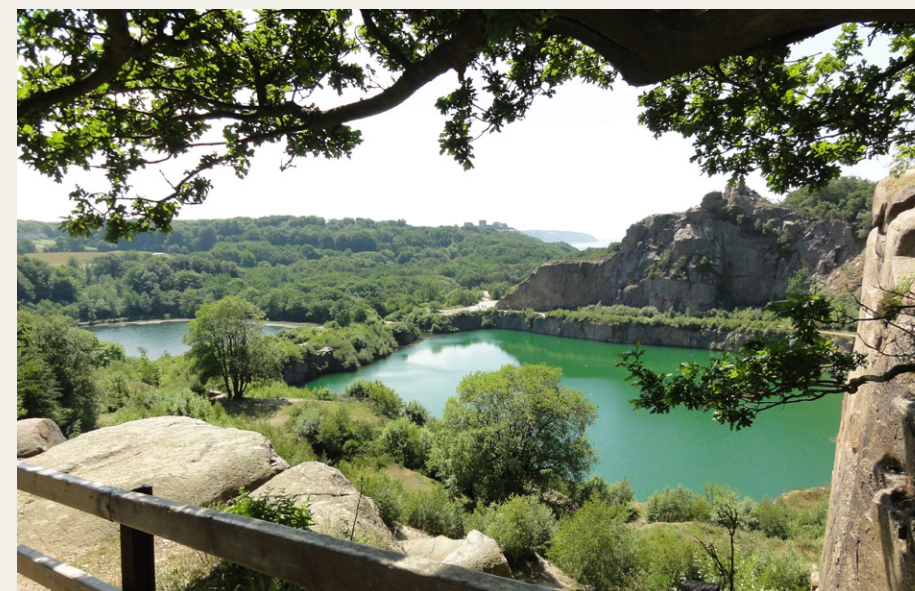
Opalsøen ved Hammeren.

Et must er hver gang at besøge Hammeren og udforske Opalsøen med dens tilsvarende klipper. Turistperlen Vang