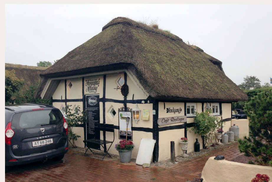
Skovgaard's Raaling set udefra på denne lidt våde sensommerdag.