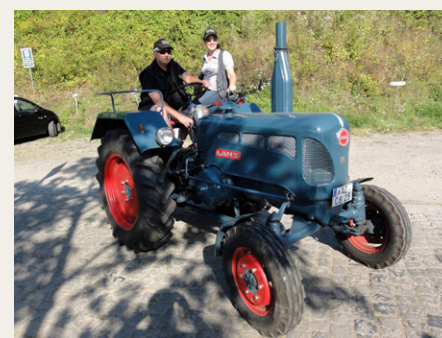
Lanz Bulldog D 2416 fra en gang i halvtredserne