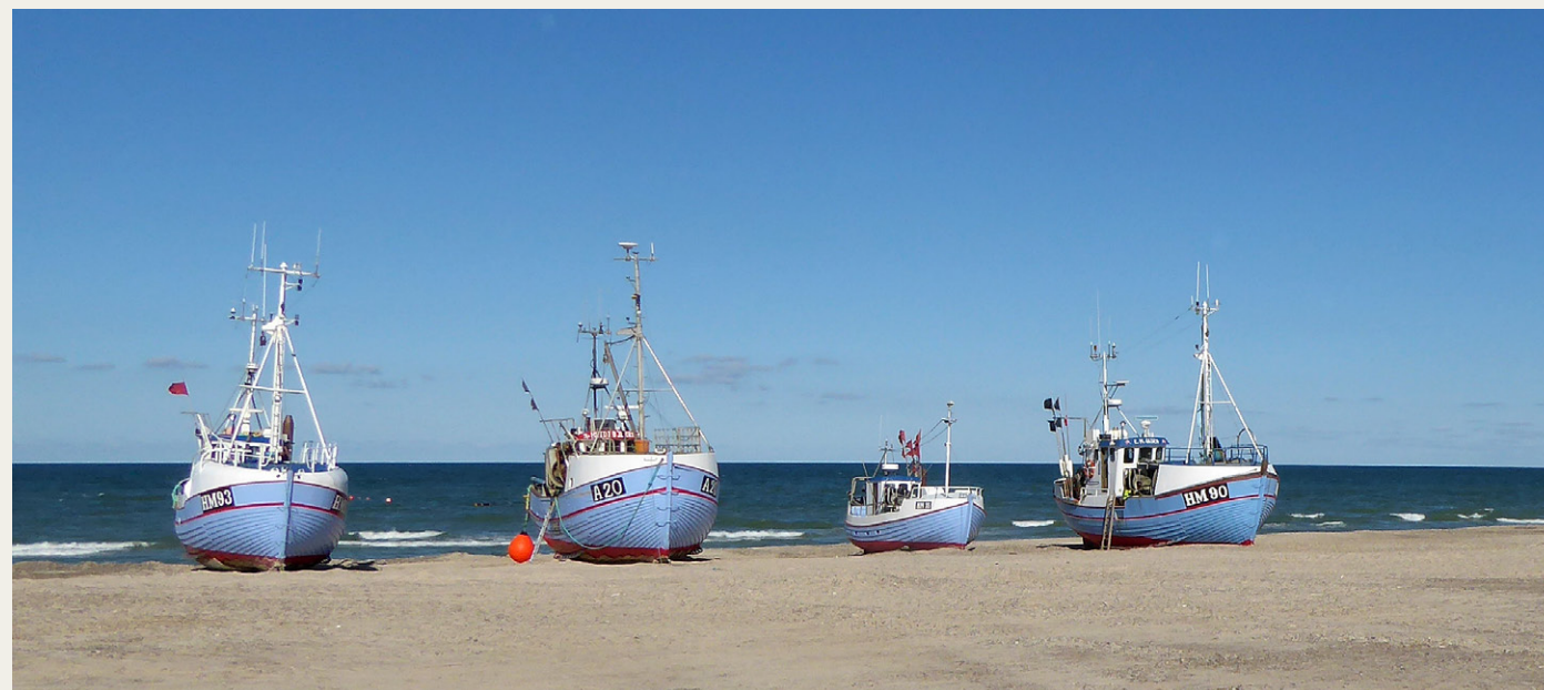
Nogle af de fiskekuttere på Thorup Strand, som er blevet landskendte gennem TV-serierne „De unge fiskere“ på DR og „Gutterne på kutterne“ på TV2.