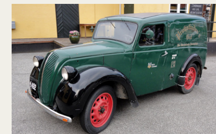
Morris varevogn fra 1950, som reklamerer for Provstindens Guf