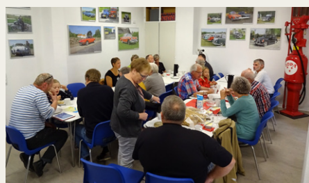
Dagen startede med morgenkaffe i klublokalerne på Forchhammervej.