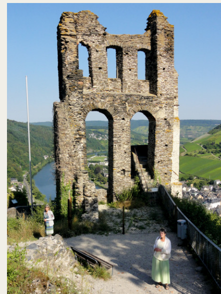
Grevenburg borgruin ved Traben-Trarbach

Vi fandt efter flere forgæves forsøg udsigtspunktet Calmont, som omfatter Europas stejleste vinmarker, højde på knap 400 m o.h. Hvad mødte vi langs med floden? Masser af oldtimertraktorer med campingvogne. Og hvad foretog de sig her? Træf i området og målet var hygge, øl- og vinsmagning. Vi så bl.a. en flot rød Güldner G30S (3 cyl., 30 hk, årg. 1964). Og i Beilstein mødte vi en Lanz Bulldog D 2416, årg. 195?, hvor vi kontant af kvinden blev oplyst, at hun var „die Besitzerin“.