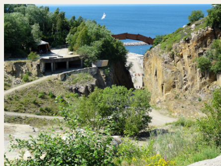
Vang Granitbrud med DGI broen

På hjemvej ophold i Middelfart og besøgte her den gamle Lillebæltsbro, opført i stål og beton og indviet i 1935. Seneste turisttilbud er muligheden for gåtur på toppen af broen.