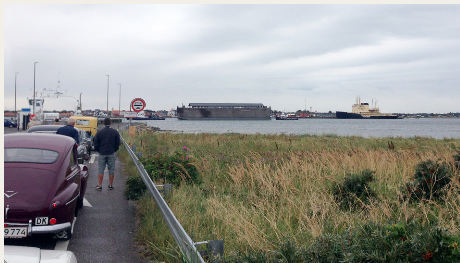
Mens vi venter på færgen i Egense. Noahs Ark sejler forbi, og i baggrunden de to isbrydere Danbjørn og Isbjørn i Hals.