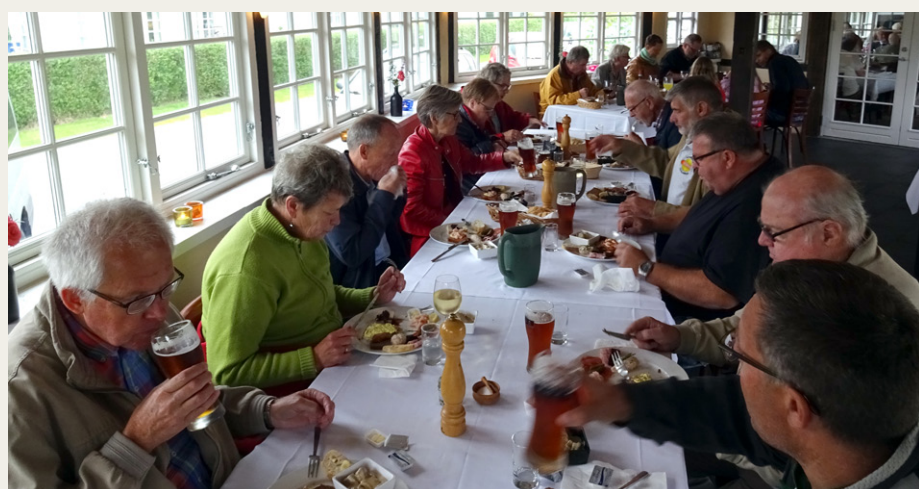
På det smukke Traktørstedet Skovgårds Raaling serverede de den bedste platte, vi nogen sinde havde fået. Selv børnene var begejstrede.

Skovgårds Raaling. Alle, også børnene, var begejstrede for platten, som vi syntes var den bedste platte vi nogensinde havde fået serveret.