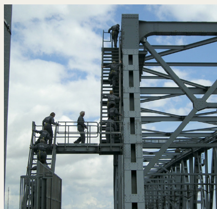
Den Gamle Lillebæltsbro forceres på en alternativ måde.

På hjemvej ophold i Middelfart og besøgte her den gamle Lillebæltsbro, opført i stål og beton og indviet i 1935. Seneste turisttilbud er muligheden for gåtur på toppen af broen.