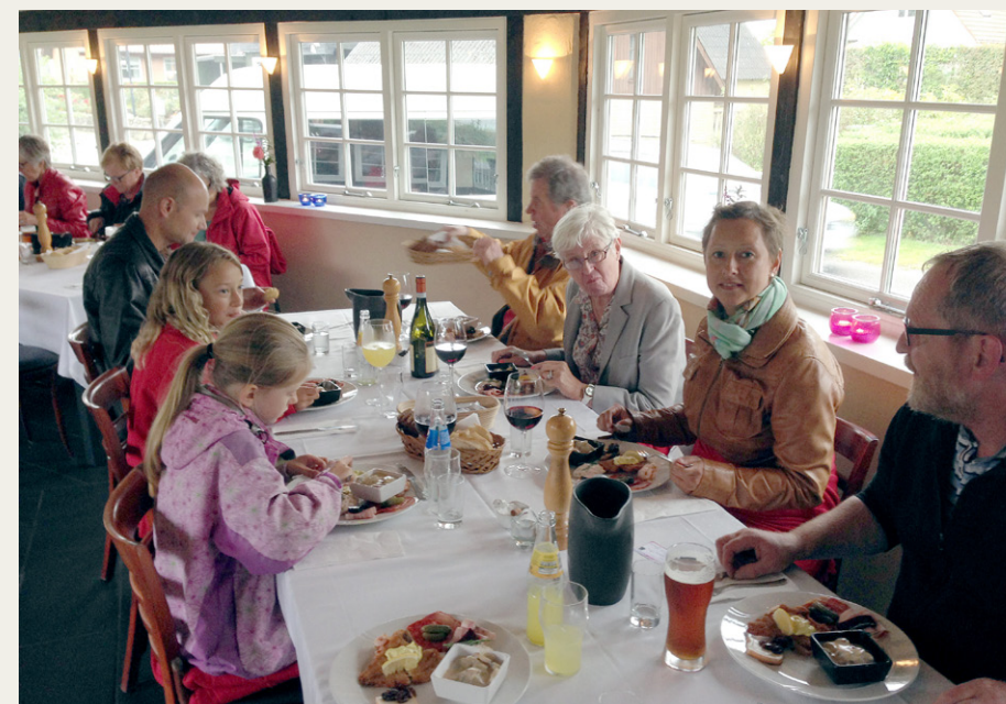
Hygge ved frokosten på Skovgaard's Raaling.