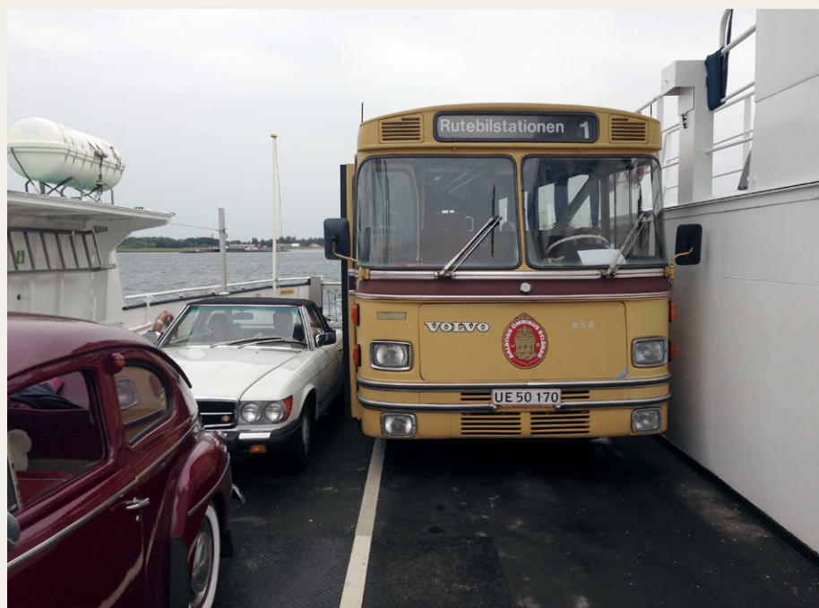
God plads på færgen.