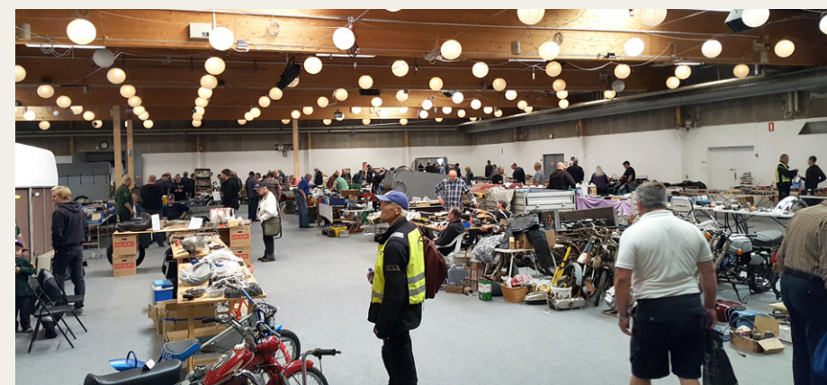
I Hal 2 kunne der godt være blevet plads til flere sælgere - og købere også for den sags skyld.