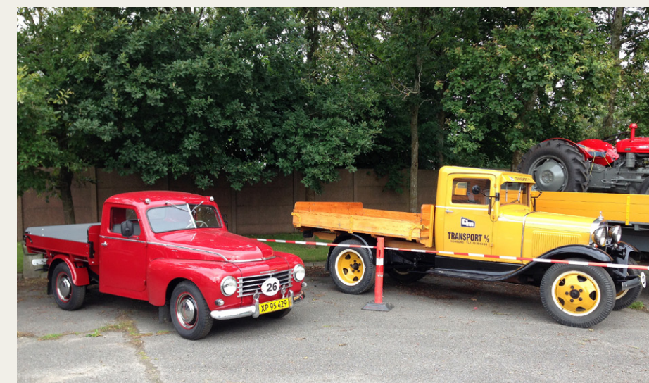
De to mindste af de deltagende lastbiler: Volvo PV 445 fra 1956 og Ford AA fra 1931.