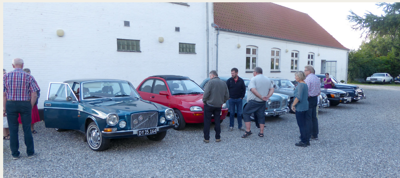
Efter den flotte frokost blev der sparket dæk og snakket biler i det flotte, næsten sommeragtige efterårsvejr på parkeringspladsen ved Skovsgaard Hotel.

Strand, hvor der var lavet en aftale med formanden for Thorupstrand Kystfiskerlaug, der havde givet tilsagn om, at han kl. 15.00 ville vise os rundt og samtidig fortælle os om alle de tiltag, som er sket i det lille fiskerleje over de senere år.