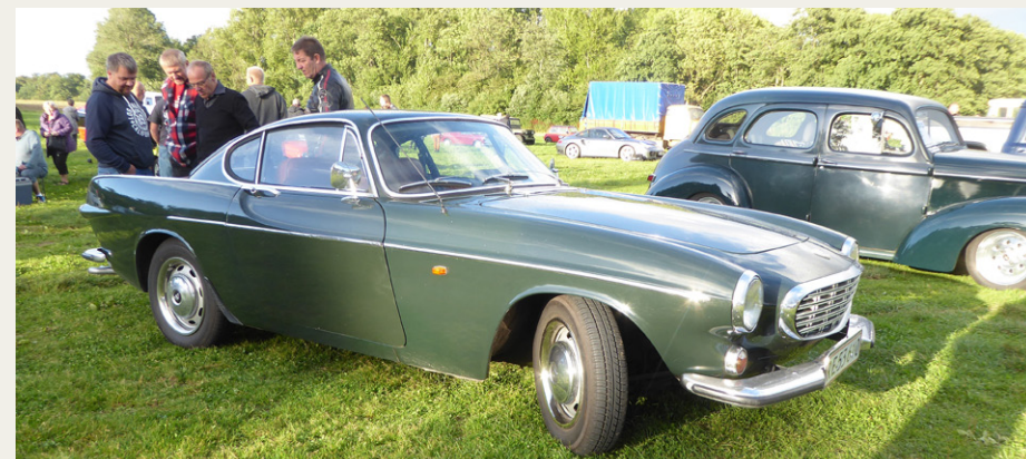
Denne Volvo 1800S ligner noget vi har set før, men hvor er det nu lige det er?