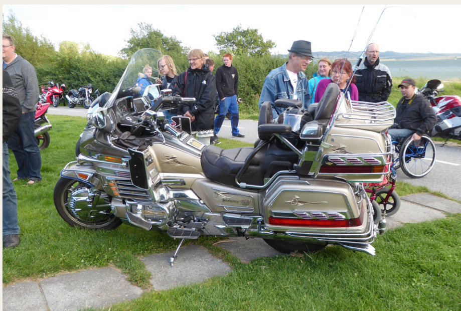
Blandt motorcyklerne kunne man se denne enorme Honda Goldwing 1500, som vel er noget af det mest dekadente, der er fremstillet. Læg også mærke til „Jydekrogen“