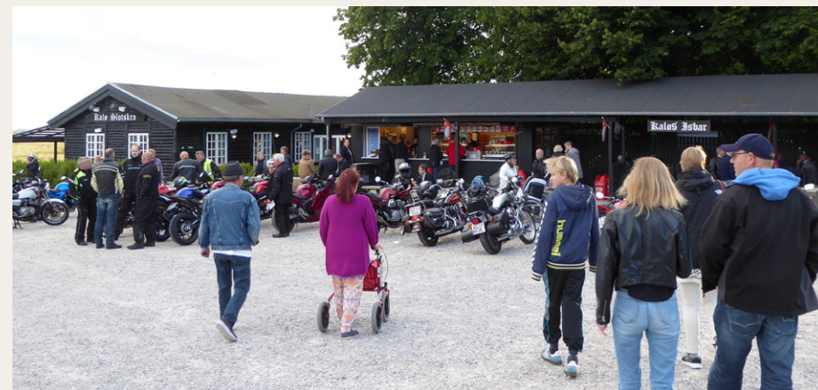
Motorcyklerne samledes foran Kalø Slotskro og Kalø Isbar.