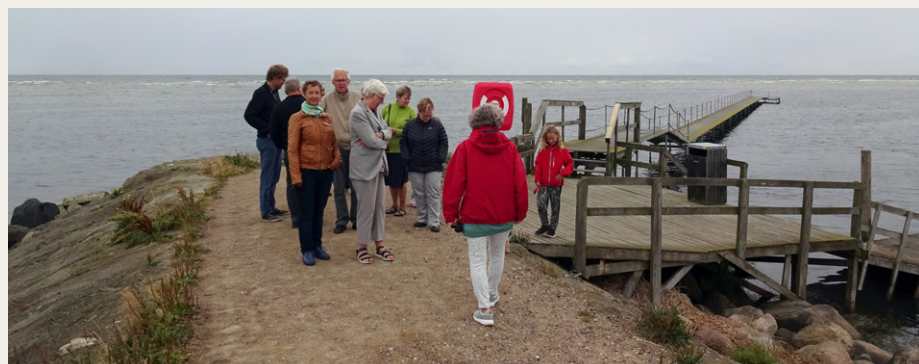
Nogle af deltagerne i det kolige sensommervejr ved molen ved Mulbjergene.

Efter kort ophold i Hals, kørte karavanen videre til Hou, hvor vi parkerede ved havnen for at gå den korte tur til Skovgårds Raaling. Vi havde fundet et unikt og smukt sted, hvor vi fik rigtig god mad og historien om Traktørstedet