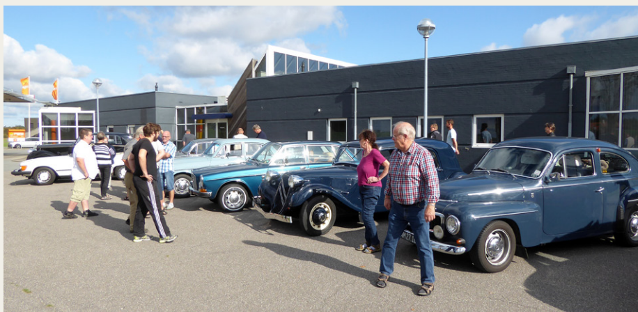
Ved afgang fra Aabybro, var der samlet omkring en halv snes veteranbiler.