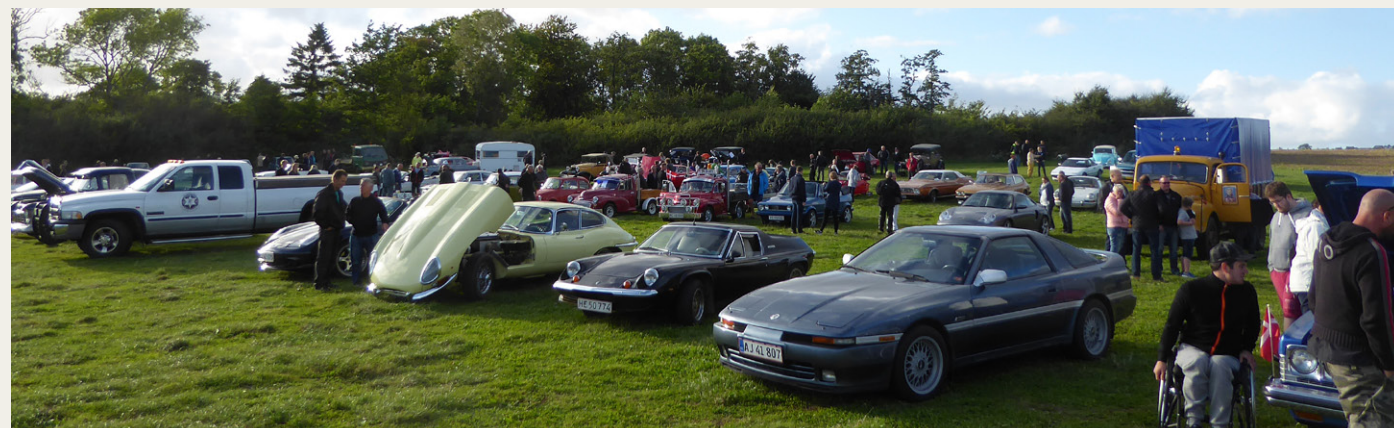
Selv om mange biler tydeligvis var taget hjem, var der stadig meget at se på.

Da vi endelig nåede frem til parkeringspladsen ved Kalø slotsruin, var klokken efterhånden blevet tæt på 19.00, og vi kunne tydeligt se på den måde, bilerne stod spredt på, at der allerede var mange, som havde forladt pladsen, og nogle af de mennesker, vi talte med, fortalte, at der i området sidst på eftermiddagen var kommet nogle kraftige regnbyger, som ganske givet havde holdt mange mennesker hjemme.