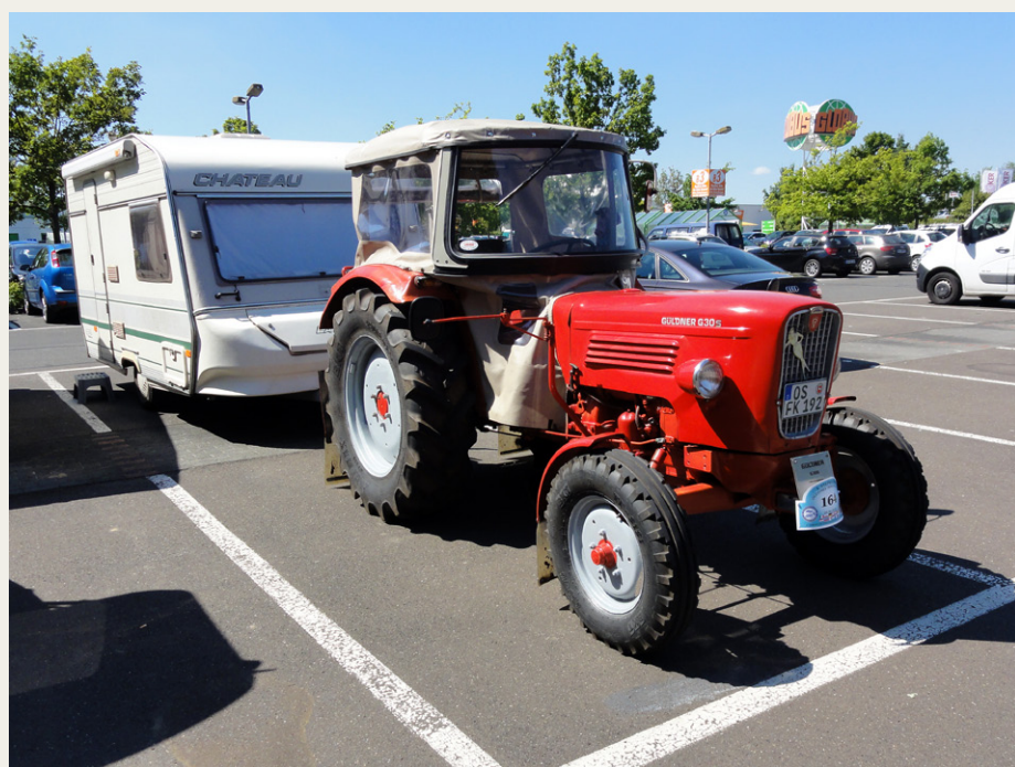
Güldner G30S fra 1964