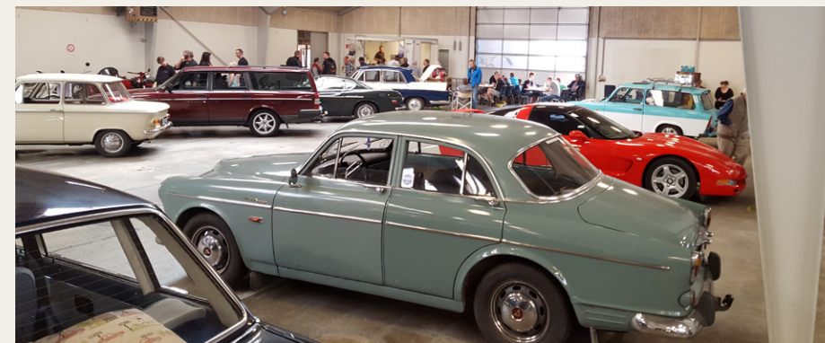
I Hal 3 var der også mange flotte og spændende biler at se på.