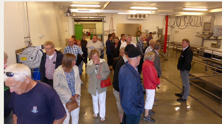
En del af rundvisningen ved Thorup Strand foregik i de kolde fabriksbatter, hvor de nyfangede fisk bliver forarbejdet, inden de sendes videre til fiskeauktionen i Hanstholm.

Som afslutning på besøget blev vi også vist rundt i Redningshuset, hvor en meget stor gummibåd lå klar til at blive trukket de mindre end 100 meter ned til vandet