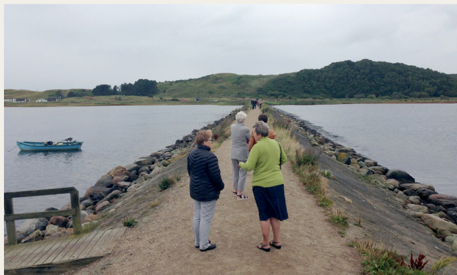
Pause på molen i Dokkedal. I baggrunden Mulbjerg.