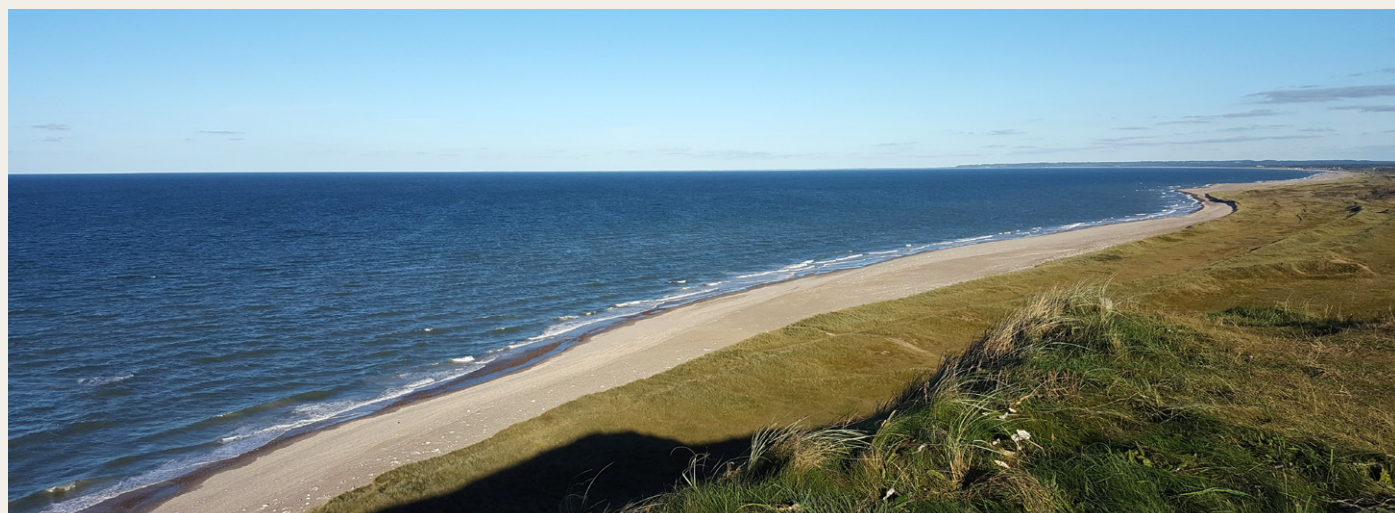
En del af den flotte udsigt fra toppen af Bulbjerg ud over Jammerbugten. Hvis man zoomer meget ind, er det faktisk muligt at ane Hirtshals lid til venstre for midten af billedet. Helt ude til højre er det lidt nemmere at få øje på Thorup Strand, hvor vi netop kom fra.