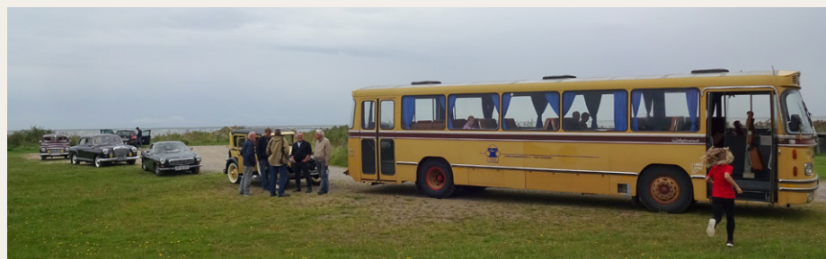
Med bussen i front ved Kattegats kyst ved Mulbjergene.