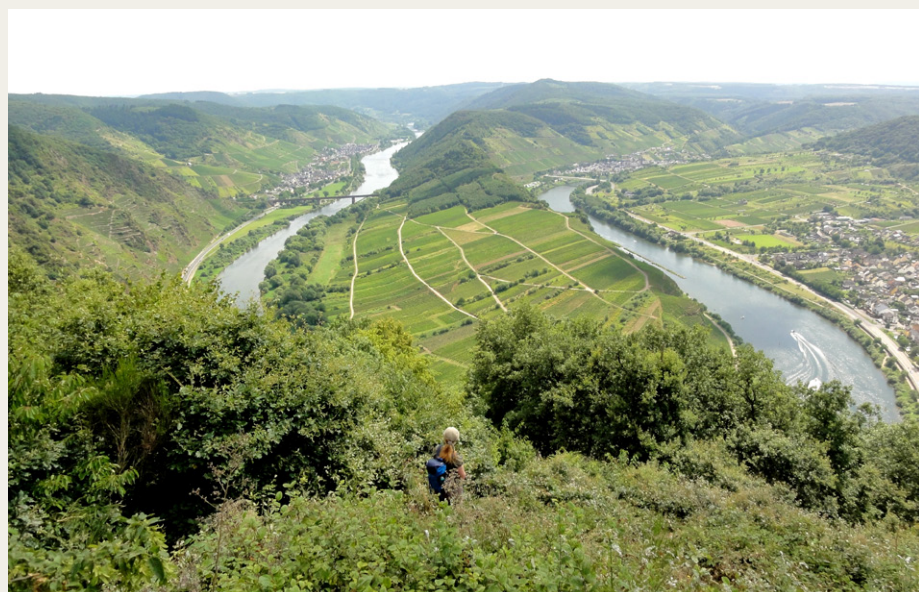
Udsigten fra Calmont over en af Mosel flodens mange sløjfer.