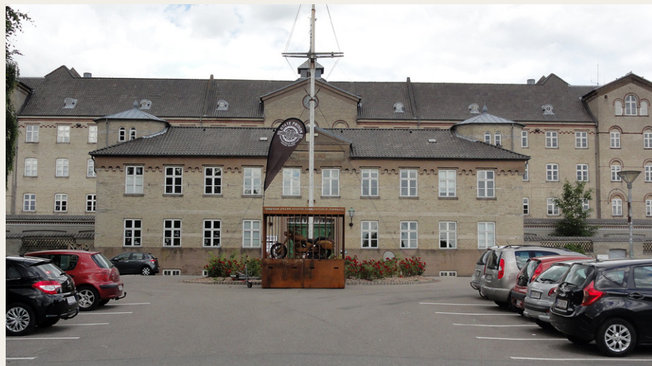
Det gamle statsfængsel i Horsens er i dag omdannet til museum - Fængselsmuseet - hvad ellers.