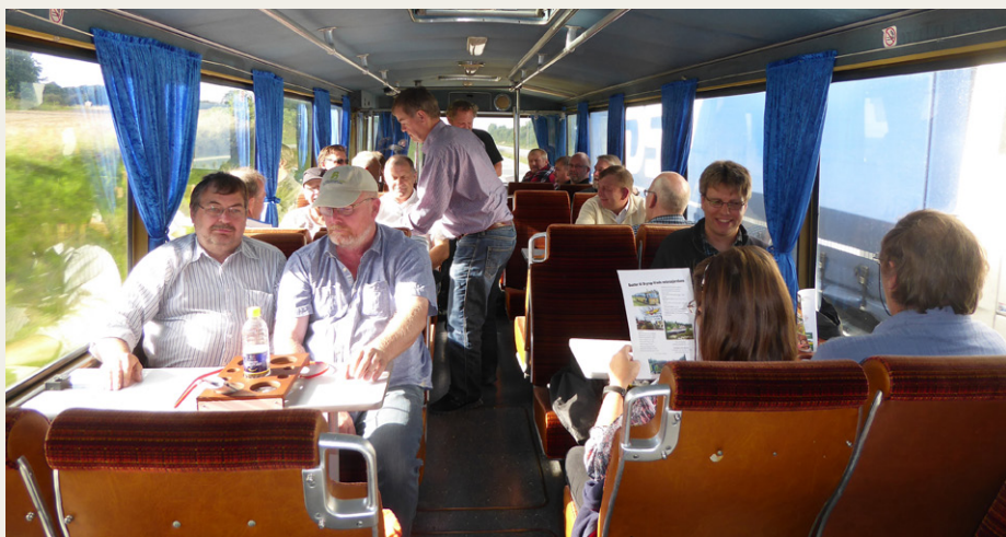
Der var højt humør og megen snak i bussen både på ud- og hjemturen.

Så der blev endelig afgang mod Kalø Vig tirsdag den 9. august klokken 17.00 fra klubhuset på Forchhammersvej. På vej nedover var der opsamling ved Haverslev og Hobro, hvorefter der blev serveret smørrebrød til de mere end 20 passagerer, som på det tidspunkt var med i bussen. Tre styk smørrebrød var der med i billetprisen på 50 kr. – det kan man da vist ikke klage over – og til dessert var der citronfromage sponsoreret af Ryå Is.