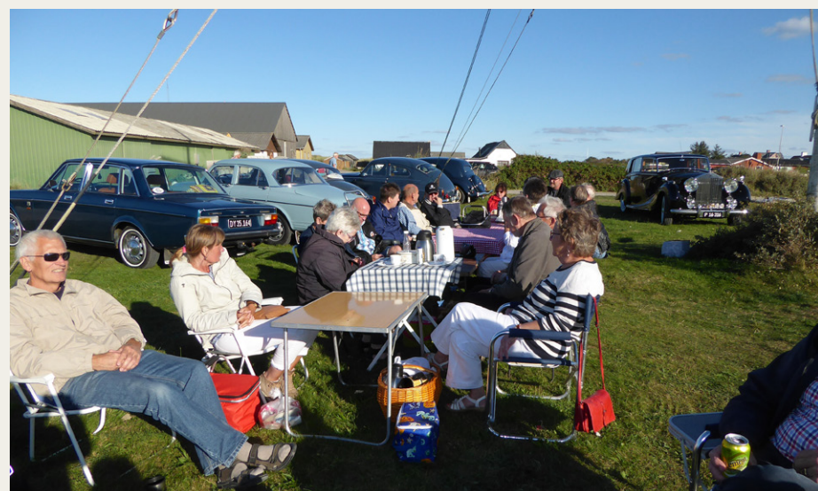
Der var rig mulighed for at nyde både eftermiddagskaffe og det smukke efterårsvejr ved Thorup Strand.