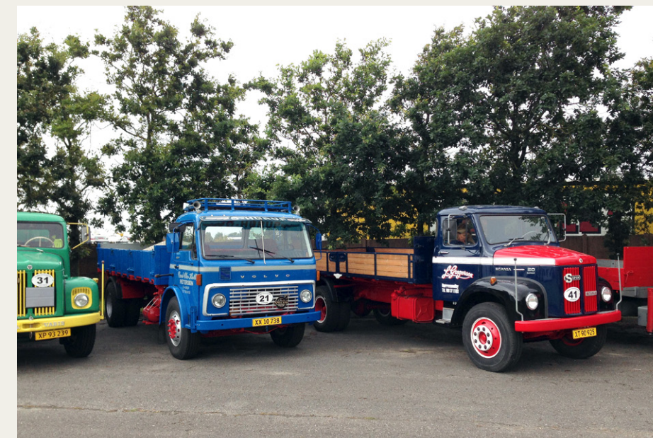
Et par fine tipbiler, som de kunne se ud ved den lokale vognmand i 70'erne: Volvo F86 og Scania L50. Volvoen endda med et læs grus, lige klar til levering på hjemvejen.

Sjællandsgade 36, 9000 Aalborg, Telefon: 98 12 10 00