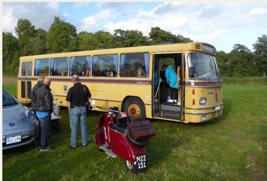
Bussen umiddelbart efter ankomsten til Kalø Vig. Den røde scooter i forgrunden er en meget sjælden Heinkel 175 fra 1954.