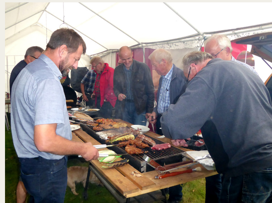
Der var trængsel og godt humør omkring den store grill. Det var for øvrigt lidt iøjnefaldende, at selv om deltagerne fordelte sig ca. fifty-fifty mellem mænd og kvinder, så var det udelukkende mænd, der stod for de kulnariske anstrengelser, mens kvinderne holdt sig indenfor i det varme telt. Det kan selvfølgelig ikke udelukkes, at kvinderne havde deltaget i de hjemlige forberedelser.