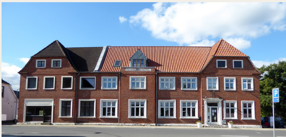
Skovsgaard Hotel danner endnu engang rammen om et af klubbens arrangementer.

Nimbus motorcykel med sidevogn. I alt var vi lidt over 30 personer med i arrangementet.