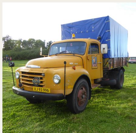
Bamsebilens søster var også tilstede ved Kalø Vig.