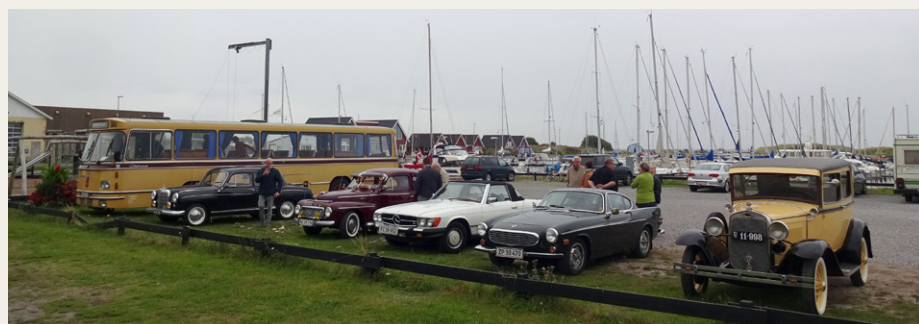
Vi parkerede ved havnen i Hou for at gå til Traktørstedet Skovgårds Raaling.