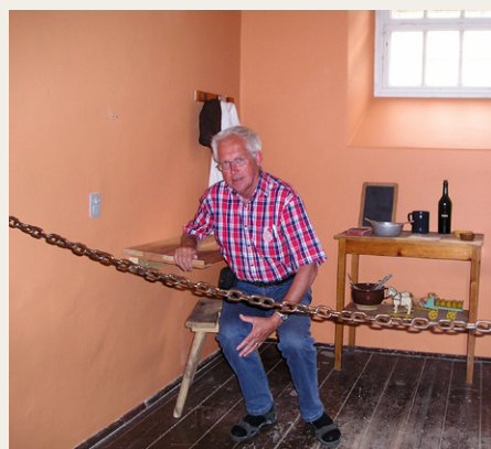
Formanden på „Vand og brød“

Medio august igen afsted på en lille tur sydover, Mosel i Midtyskland. Området viste sig som altid fra sin skønne side, med floden, vinmarker og små turistbyer som omdrejningspunkt, og eftermiddagstemperaturer på op til 28 grader. Sidstnævnte blev kompenseret ved hjælp af kølig hvidvin og dunkel Bier.