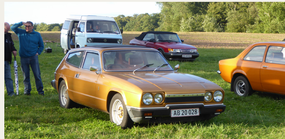
En Reliant Scimitar GTE fra 1976 er ikke noget vi ser hver dag.