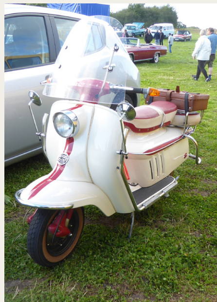
Og her en noget nyere Heinkel 150 fra 1962