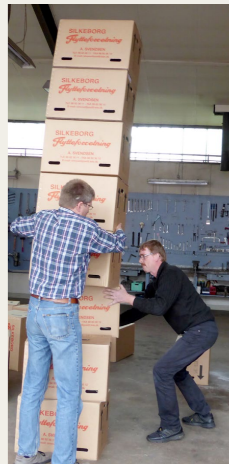
Stabling af flyttekasser på tid ved Silkeborg flytteforretning. De blev stående, så vi fik point for 8 kasser.