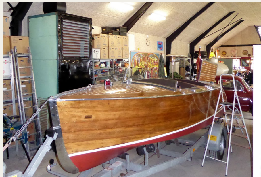
I samlingen var også denne mere end 70 år gamle Chris-Craft 17' Runabout.