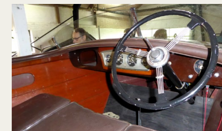
Var det ikke for de manglende pedaler kunne man næsten tro, at dette cockpit er fra en åben bil.