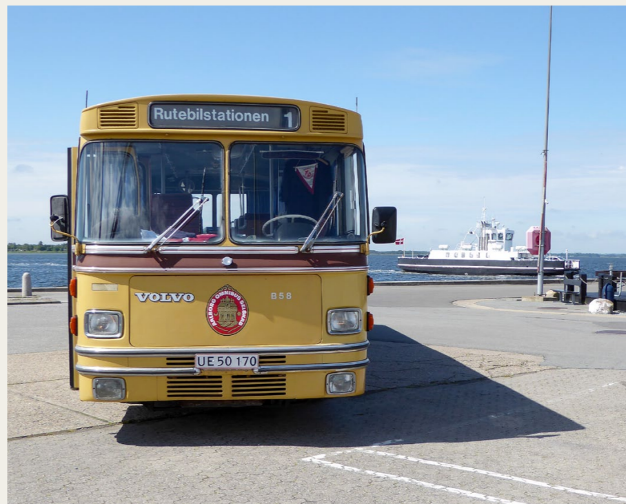
Bussen ser ganske overvældende ud i forhold til den „lille“ Hals-Egense færge i baggrunden.