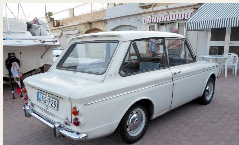
Rekverket over „garageportene“ går lang fortovet ved den lokale hovedgade. Mange af garagerne er tydeligvis indrettet som små ferieboliger.