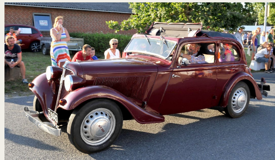
Det skaber glæde blandt store og små, når ejerne af de klassiske køretøjer viser deres veteraner frem ved Tvilum Classic Show.