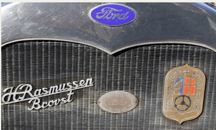
På Ford'ens køler finder vi to eksempler på tidlige udgaver af klubbens logoer. I midten er det et lille skilt med inskriptionen „Nordjysk Ford A Klub“, og til højre ser vi et tidligt skilt fra „Nordjysk Vintage Motor Klub“