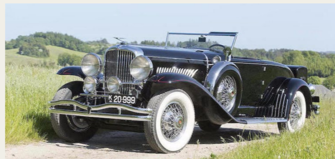
1930 Duesenberg Model J Disappearing Top Roadster by Murphy.