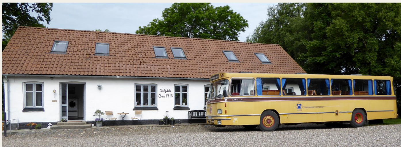
Klubbens bus var henvist til gårdspladsen, hvilket sikkert også var meget godt af bensyn til græsplænen.

Traktoren var en Massey Ferguson 65 fra en gang i starten af tresserne, og bilerne var en Fiat 600, en Plymouth Convertible fra 1951 og en meget gammel Ford TT lastbil, som var monteret med et „Til salg“