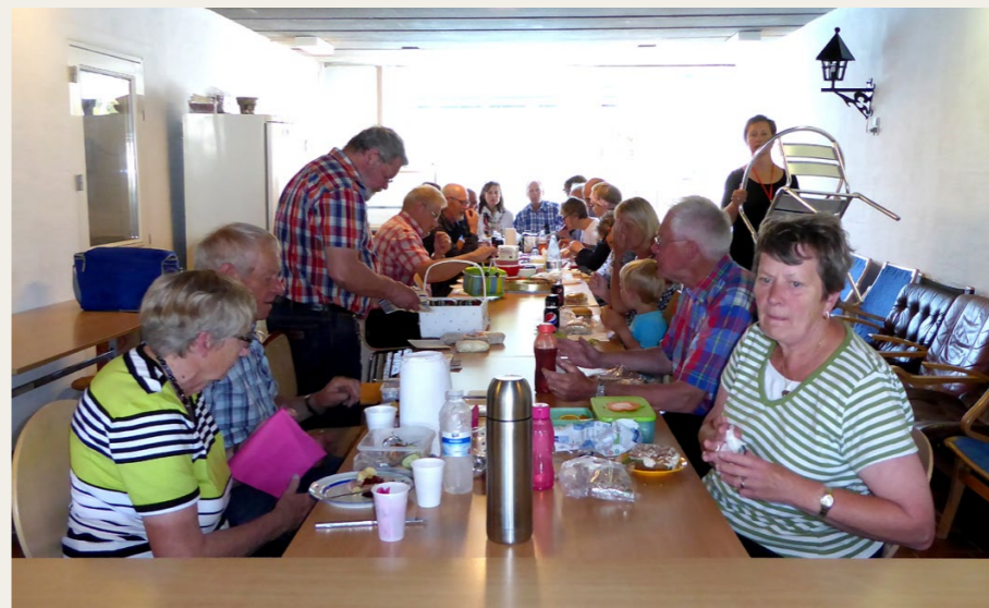
Der var plads til næsten alle ved langbordet, da der var fællesspisning i en af opholdstuerne på Hedebo Strandcamping.