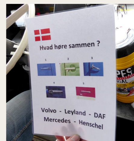
Et af de drilske spørgsmål: Hvilke dorbåndtag og bilmærker hører sammen? For en gang skyld én hvor vi havde alle fem rigtige!