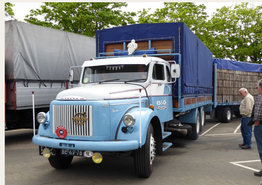
Vinderkøretøjet som årets flotteste lastbil, en Volvo L495 Titan med Turbo og Bogie. Anhængerer er lastet med et imponerende læs tomme trækasser.

På turen var i alt 9 poster med forskellige typer af opgaver, både fysiske opgaver som stabling af flyttekasser og islåning af søm, og mere eller mindre drilske spørgsmål relateret til tunge køretøjer. Undervejs syntes vi ikke, det gik alt for godt med