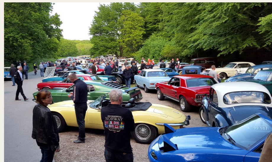
Der var fyldt op til sidste plads i Lundby Krat den anden tirsdag i juni 2015.