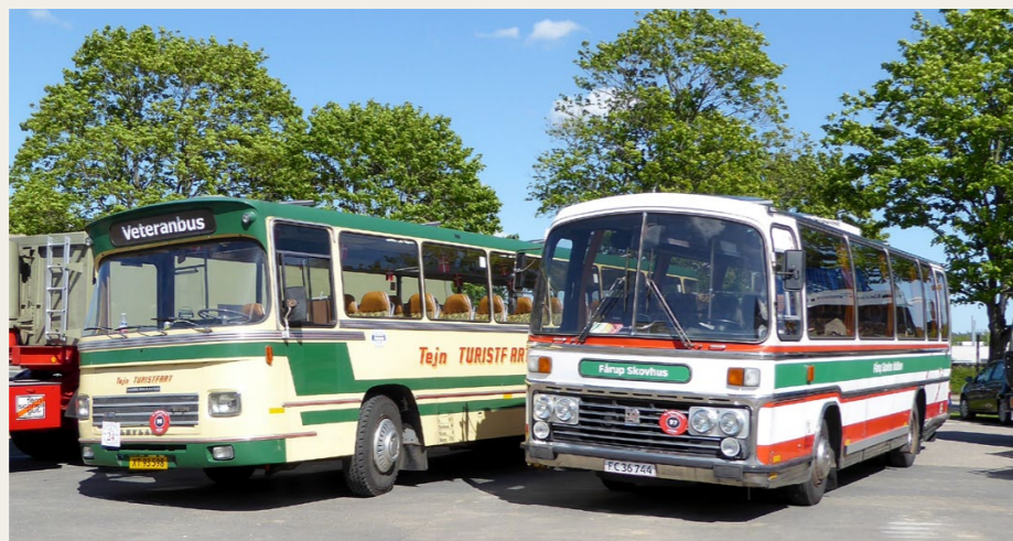
Et par af de andre deltagende busser. Fårup Skovbus bussen, en Bedford/Plaxton fra 1975 og en Leyland DAB serie II, også fra 1975, ejet af Bushistorisk Selskab.

Vi var i Silkeborg i god tid inden kl. 9.00, og indtil start på selve rallyet kl. 10.00 var der tid til kaffe og rundstykker, samt til at gå rundt og beundre alle de flotte køretøjer. Ud over danske biler, var der i år seks fra Tyskland, syv fra Holland, en fra Norge, og to fra Sverige.