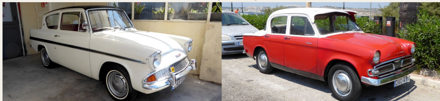
Den flotte Ford Anglia er tydeligvis et samlingsobjekt.