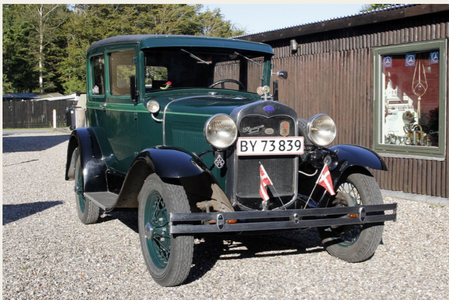
Den gamle Ford A en flot sommeraften hjemme på matriklen på Kaas Hede.