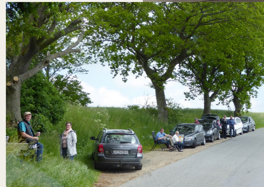
Langs ruten var der mange tilskuere med medbragte havestole, kaffekander og kameraer.

opgaverne, men det gjorde det åbenbart heller ikke for de andre deltagere, mere om dette senere.