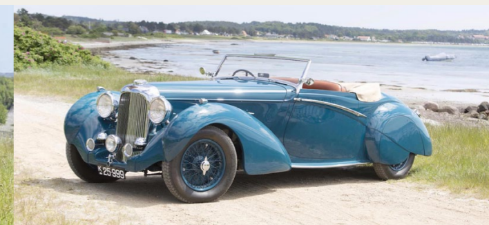
1939 Lagonda LG6 Rapide Drophead Coupe.