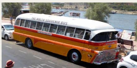
En af de få gamle Malta busser, som vi så, anvendes i dag som salgsbus for souvenirs.

Allerede den første morgen, kom vi forbi en rigtig flot Ford Anglia, som holdt parkeret bag en kæde. Af skiltene på bilen fremgik det, at ejeren var medlem af veteranbilklubben "Old Motors Club, Malta" - www.oldmotorsclub.com . Et lille sjovt sidespring her er, at da jeg efter hjemkomsten kontrollerede Facebook, var der en person, der havde offentliggjort et billede af en Opel Olympia Rekord, som han havde taget på Malta. Det sjove er, at