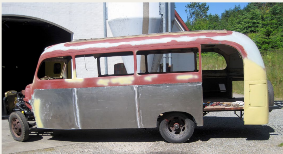
Så er karosseriet blevet genforenet med chassisrammen, og der kommet nye plader på siderne

Nu er der et stort arbejde med at trække