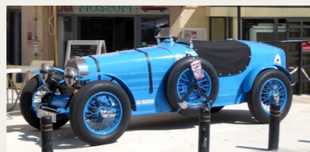
Den lille blå Bugatti anvendes som blikfang for „Malta Classic Car Museum“

Allerede den første dag på Malta fandt vi en dejlig rute, som vi gik mindst én gang om dagen i den uge, vi var der, og allerede på den første dag kom vi forbi et