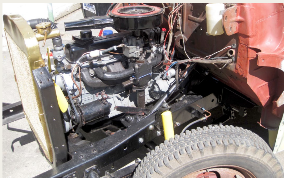
Så er der trukket rør og ledninger, og hjertet slår igen.