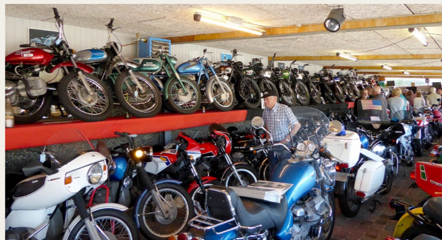
På Hedebo Strandcamping står motorcyklerne tæt pakket i flere lag.