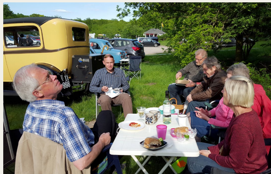
I den smukke sommeraften blev den medbragte mad nydt i mindre grupper.

fremmødte, som er medlem af NVMK, men det blev det nu ikke mindre interessant af.