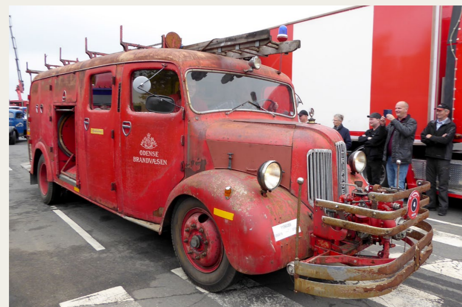
Ikke alle deltagende køretøjer var nypudsede og skinnende. Denne sjældne danskbyggede Triangel brandbil fra 1942 er nysynet og køreklar, men udseendemæssigt i stand som fundet.