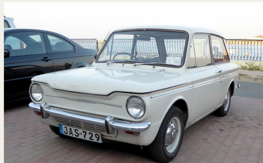
Hvem kan hjælpe Joe med hans gearskifteproblemer?