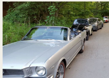
De sidste biler måtte belt op i skoven.