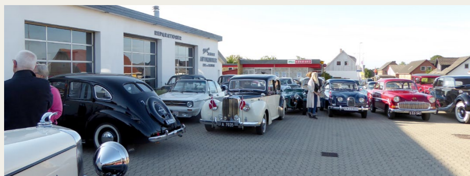
Mange af gratulanterne benyttede lejligheden og det gode vejr til at lufte veteranbilerne.