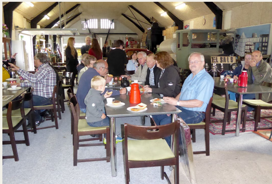
Inde i laden, garagen, værkstedet, baren eller hvad vi nu skal kalde det, var der dækket op til kaffe og morgenbrød.