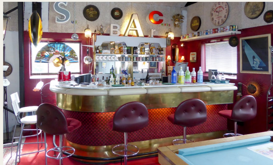
Sådan en bar burde være standard i enhver garage.

skilt. Ude i gården stod kronjuvelen, en Buick Super Eight Convertible fra 1949, klar til at tage med på udflugt.