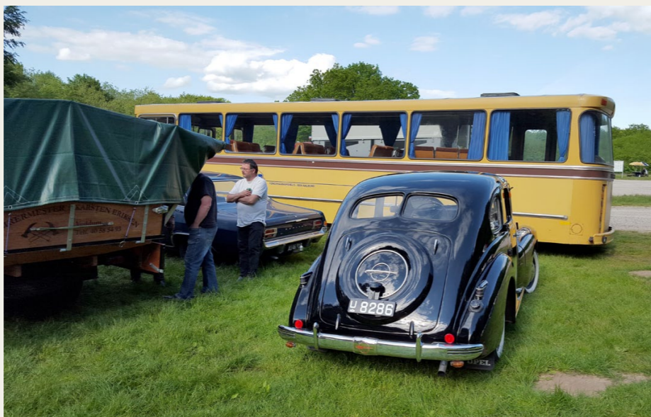
Da vi ankom med „Den Gamle Dame“ - 1939 Opel Kapitän - var der lige en ledig plads i ly af klubbens gamle Volvo bus.

Der var mindst 150 biler i „Krattet“ den aften og vel mere end det dobbelte antal mennesker inklusive en hel masse nysgerrige. Jeg tror aldrig, der har været så mange mennesker samlet til en klubaften i Nordjysk Vintage Motor Klub. Det skal dog indrømmes, at det ikke var alle de