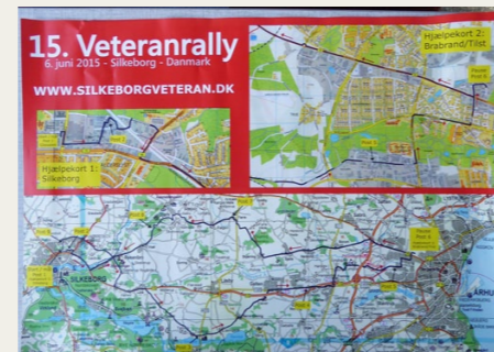
Kort, der viser den smukke tur omkring Silkeborg og Århus.