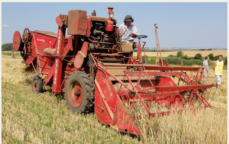
En tysk Kola mejetærsker fra 1958. Seks fod skærebord og Mercedes Benz dieselmotor.