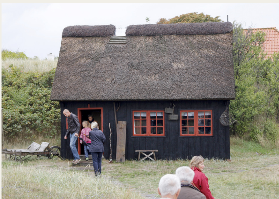
Et lille fattigt fiskerhus fra det gamle Skagen. I dette hus levede en fisker med kone, seks børn, bedstefar og husdyr. Skorstenen var bare et hul i taget.