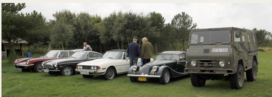
Et lille udsnit af de deltagende biler parkeret ved FDF's spejderhus „Lynghuset