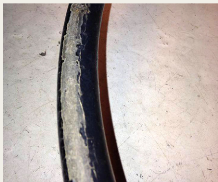
Sådan ender vores gamle rat ofte med at se ud, men det kan der nu gøres noget ved

Jeg lavede lidt research og fandt ud af, at der ikke var mange der gjorde i at restaurere gamle bakelitrat. Jeg fik indkøbt nogle materialer og værktøj til formålet og gik straks i gang med mit eget. Jeg viste det frem til nogle VW venner og fik positiv feedback og tænkte, der må være andre, der kunne tænke sig at få deres originale rat restaureret, frem for at købe