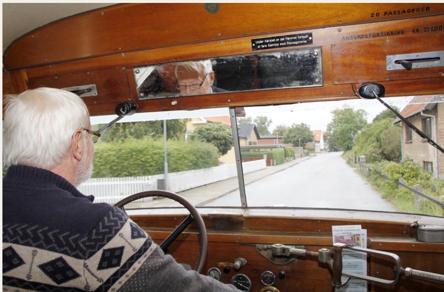
„Den accelererer bedre end den bremser“ fortalte den flinke chauffør blandt andet, selv om skiltet over spejlet siger: „Under Kørslen er det Føreren forbudt at føre Samtale med Passagererne“.

til Brøndums Hotel, tilbød han at køre os derhen, de af os, der kunne være i den lille bus. Det skulle han ikke sige mere end en gang, og så snart bussen var fuld, kørte vi afsted gennem det indre af Skagen.