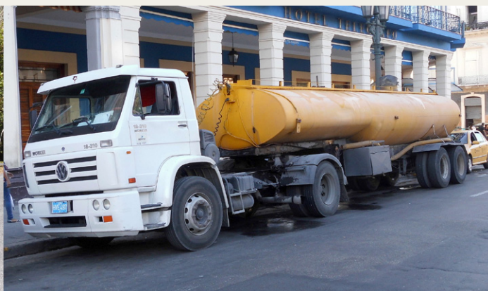
To generationer af lastbiler på Cuba. Til venstra en russisk ZIL 130 formodentlig fra en gang i firserne og til højre en noget nyere Volkswagen 18-310 Worker, som er bygget i Brasilien. Bortset fra VW skiltet er der vist mest MAN i det køretøj.