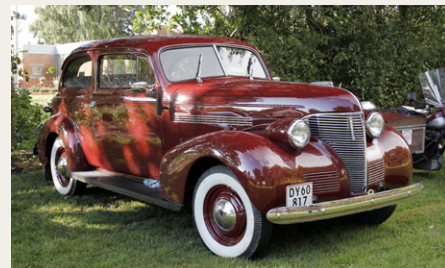
Børge Jensen mødte for første gang op med sin nyrestaurerede Chevrolet fra 1939.