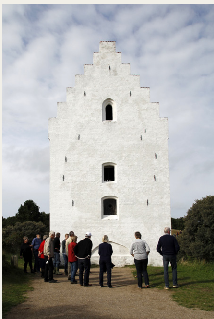
Den Tilsandede Kirke set fra det store, men ikke længere eksisterende kirkeskib