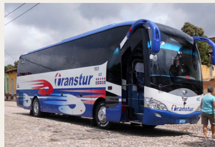
En af de nyere busser, som kører med danske turister.