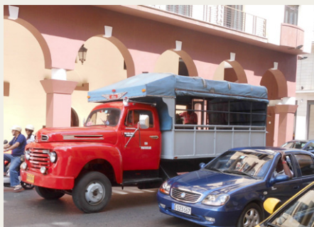
En fin gammel Ford V8 „bybus“.