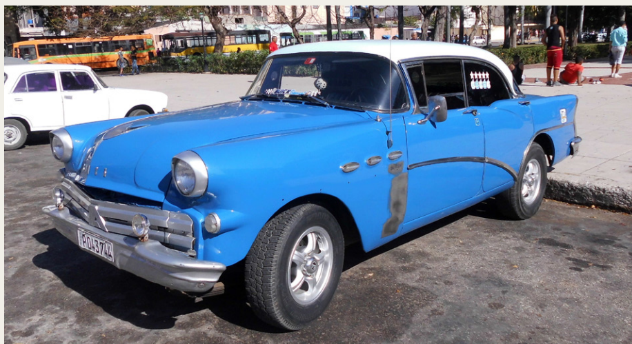
En 1956 Buick med et noget alternativt kølegitter, men når man nu ikke kan købe originale reservedele, må man jo klare sig på andre måder.