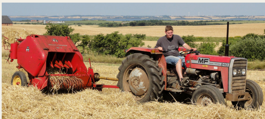
Massey-Ferguson 240 med en MF type 8 lavtrykspreser.

NB: Traktormuseets hjemmeside hedder: www.traktormuseum.net