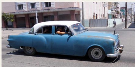
En fin patineret Packard fra 1953