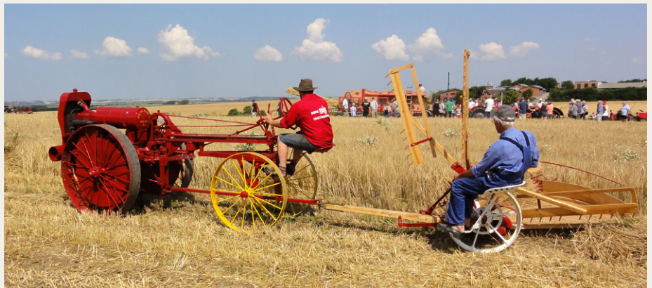
Moline Motorplov fra 1919 trækker en slåmaskine

Stort fremskridt var den dag, hvor selvbinderen blev afløst af mejetærskeren. Den