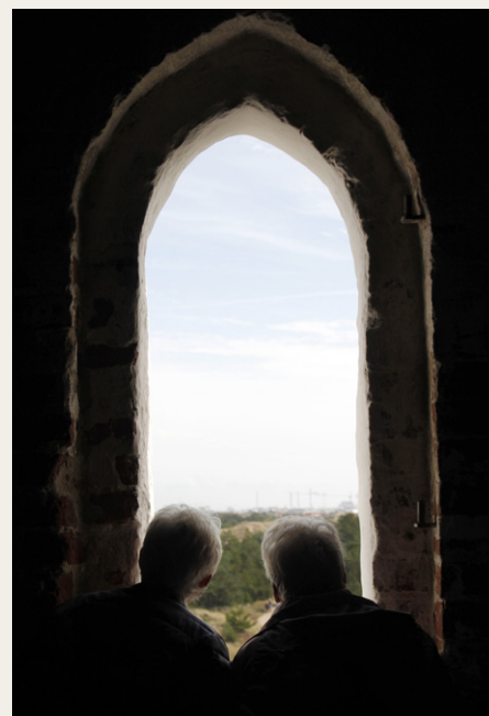
Deltagere i turen beundrer udsigten fra Den Tilsandede Kirke ind over Skagen by.