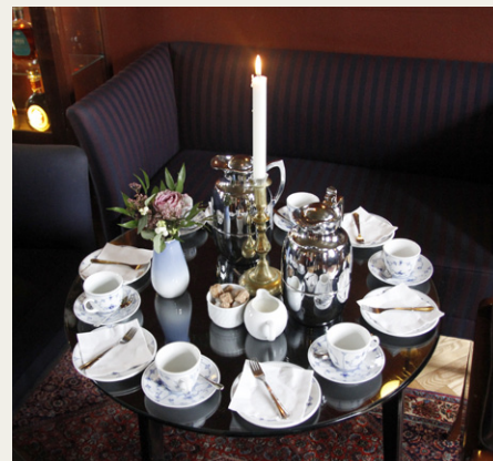
Bordopdækningen på Brøndums Hotel.

På grund af køreturen nåede vi frem til Brøndums Hotel lidt før planlagt, så der blev tid til en lille gåtur i området, inden vi skulle indenfor og have kaffe og