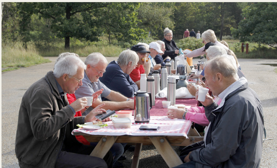
Formiddagskaffe i det grønne ved parkeringspladsen ved Den Tilsandede Kirke ved Skagen.

de respektive familier. Vi fulgte ad til Krudttårnet i Frederikshavn, hvor yderligere nogle biler ventede på os, og de sidste stødte til gruppen ved Den Tilsandede Kirke ved Skagen.