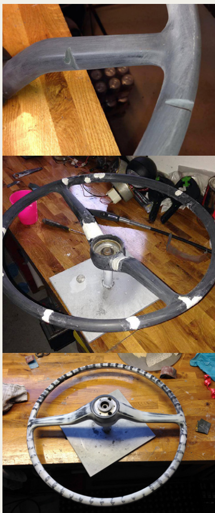
Forskellige faser i renovering af dit gamle rat.