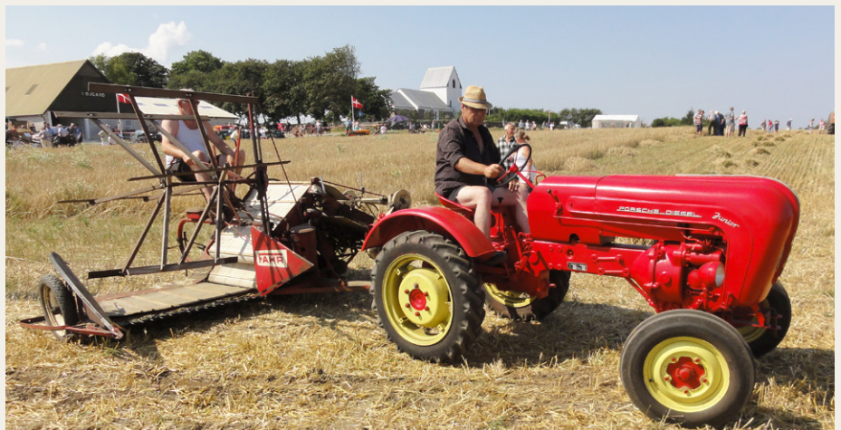
Porsche Junior med Fahr selv binder.