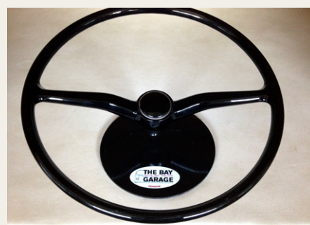
Og pludseligt passer det „nye“ gamle rat perfekt til den nyrenoverede veteranbil.