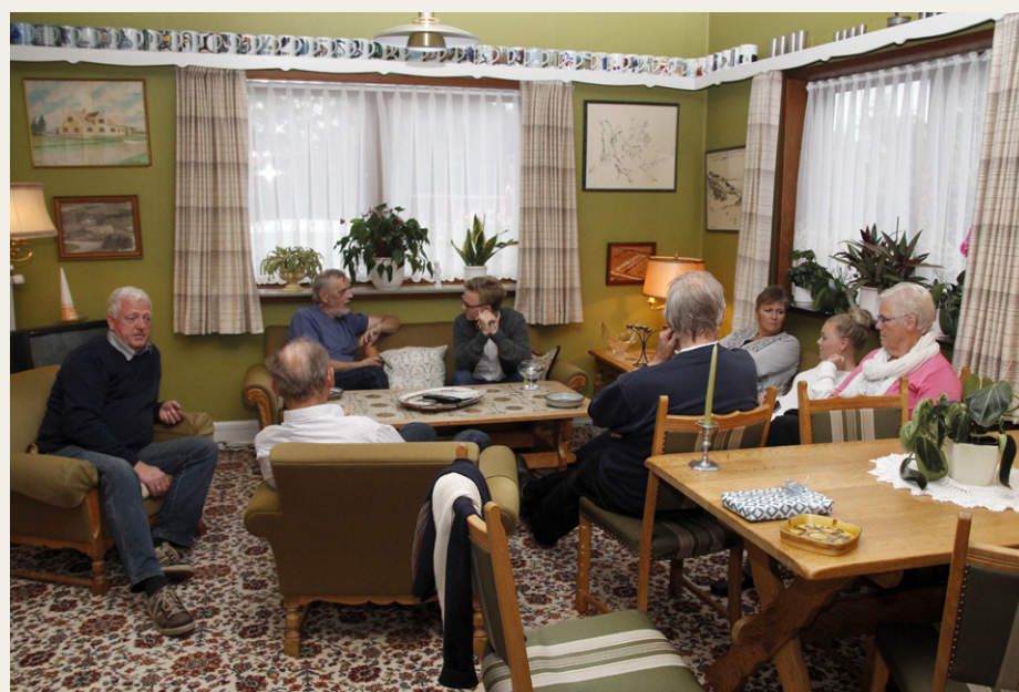
På Hotel Inger i Hulsig mødtes vi først i en hyggelig dagligstue.

meget stor betydning for, hvordan vi oplever sådan en udflugt, men selv den voldsomme regn kan ikke skjule, at hele arrangementet var meget godt planlagt og gennemført. Alt (bortset fra vejret) klappede. Der skal derfor lyde en stor tag til arrangørerne for det store og flotte arbejde, der er lagt i dette arrangement.