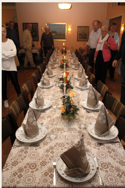
Borddækningen på Hotel Inger var meget elegant.