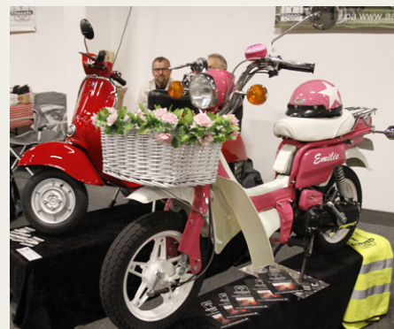
På Aalestrup Classics stand havde man taget temaet med knallerter helt bogstaveligt.