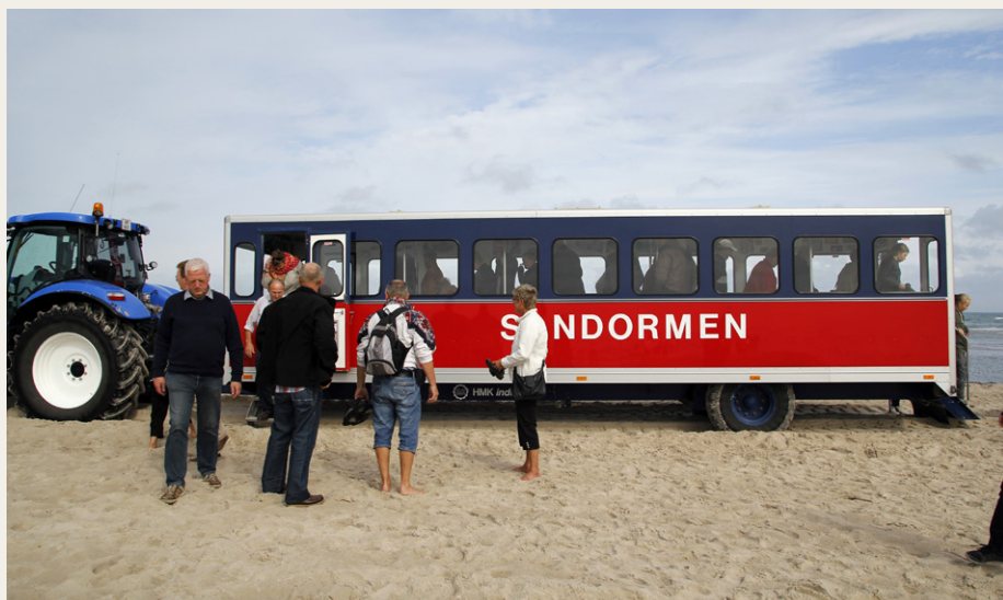
Om ikke andet fik vi da en masse frisk luft på turen ud til spidsen af Grenen.

Efter en tur op og ned ad den meget smalle og stejle vindeltrappe, der var eneste adgang til tårnet, vendte vi tilbage til bilerne, og turen gik nu gennem Skagen by og videre ud til parkeringspladsen ved