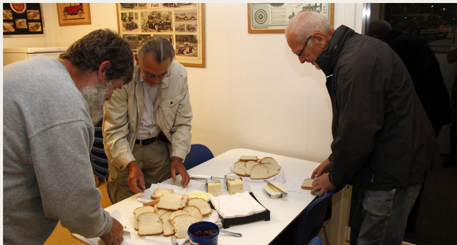
Efter foredraget var der kaffe og ostemad til alle.