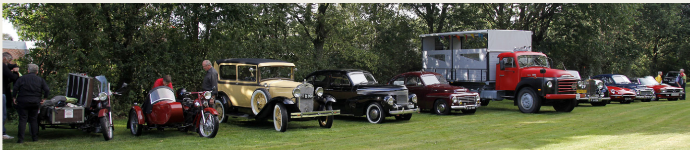
Det er svært på dette billede at se, at disse køretøjer få minutter tidligere kørte i et regulært skybrud.