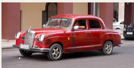
Mercedes Benz har også fundet vej til Cuba.