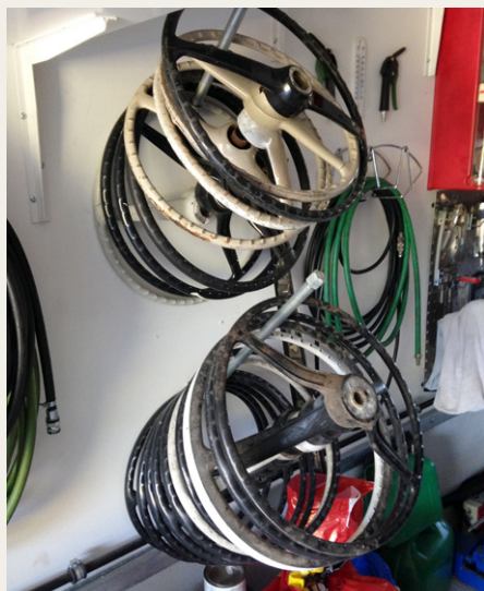
Der er efterhånden en del rat på lager.