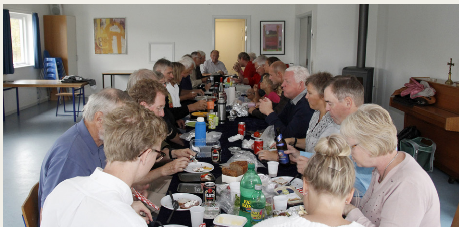
Så er alle bænket til den medbragte frokost i „Lynghuset“