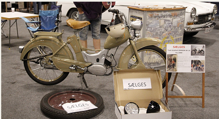
Rainers flot restaurerede Simson knallert blev solgt næsten til prisen.