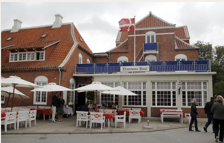
Efter besøget på Brøndums Hotel var skyerne blevet noget mere truende, og luftfugtigheden var så høj, at de fleste sygte ind under parasollerne.

Efter den værste smasken var overstået, fortalte en af lederne på hotellet om hele