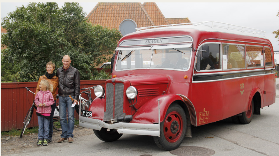
Efter ankomsten til Brøndums Hotel i Skagens By- og Egnsmuseums fine gamle Bedford bus fra 1937 var hele familien Mittelstädt bare tre store smil.

Klubbens medlemmer havde mange spørgsmål og kommentarer vedrørende bussen, og da den gode mand i løbet af samtalen blev klar over, at vi skulle videre