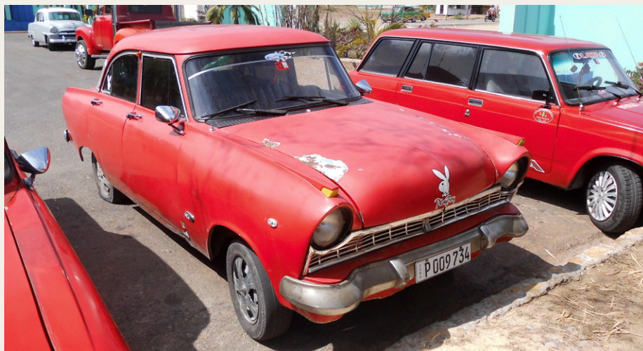
Amerikanerne er ikke alene om at repræsentere de gamle cubanske biler fra halvtresserne. Denne røde Taunus har fundet plads ved siden af en noget nyere Lada.