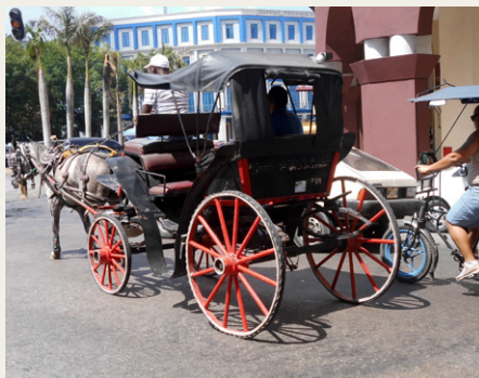
Lokal transportmiddel med biodynamisk motor.