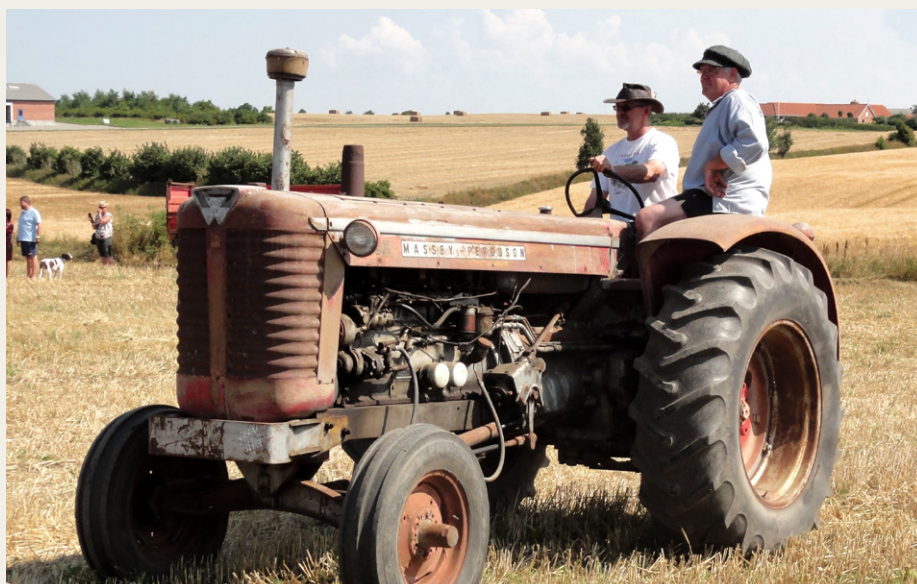
Massey-Ferguson 97 fra 1963. Fremstillet hos Moline i USA.