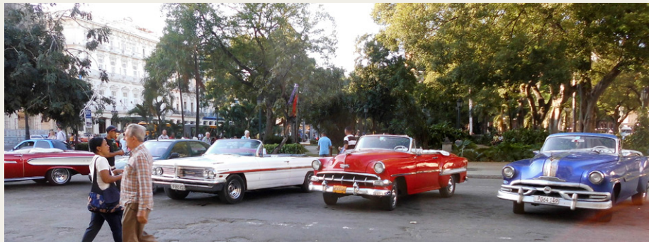
Noget af det amerikanske isenkram, som især bilmøder rejser til Cuba for at se. Den røde helt ude til venstre er en 1958 Edsel, den hvide er en 1962 Pontiac Bonneville, den røde i midten er en 1954 Chevrolet Bel Air og endelig har vi en blå Pontiac fra 1953.