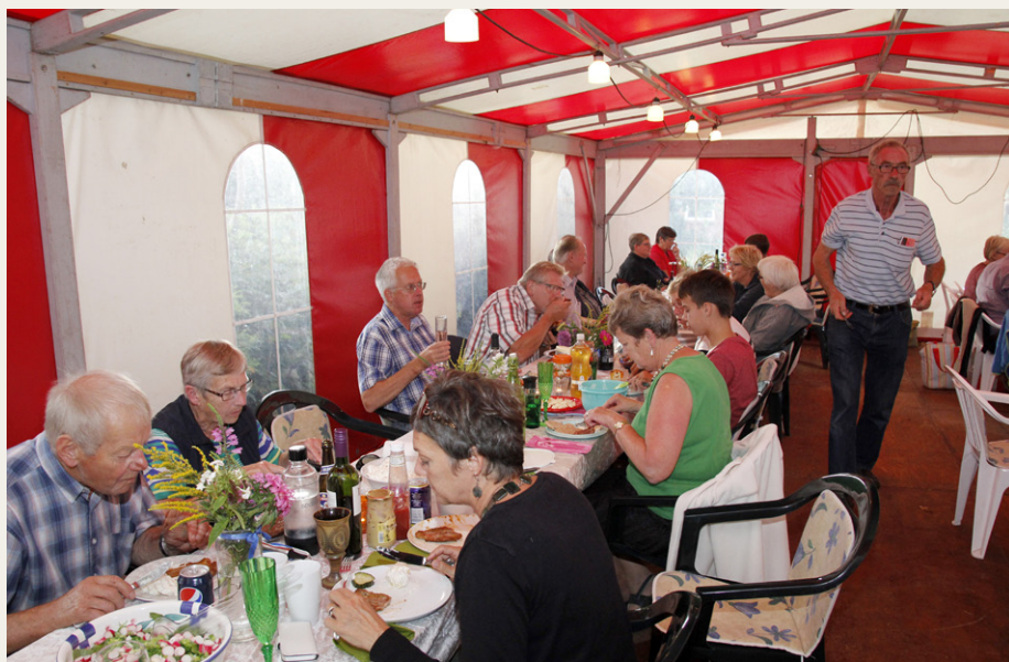
Det flotte rød- og hvidstribede telt passede perfekt til de fremmødte medlemmer og fruer.

Efter en kort indledende regn skiftede det til regulært skybrud. Vi havde tændt for „aircondition“ i den gamle Opel, det