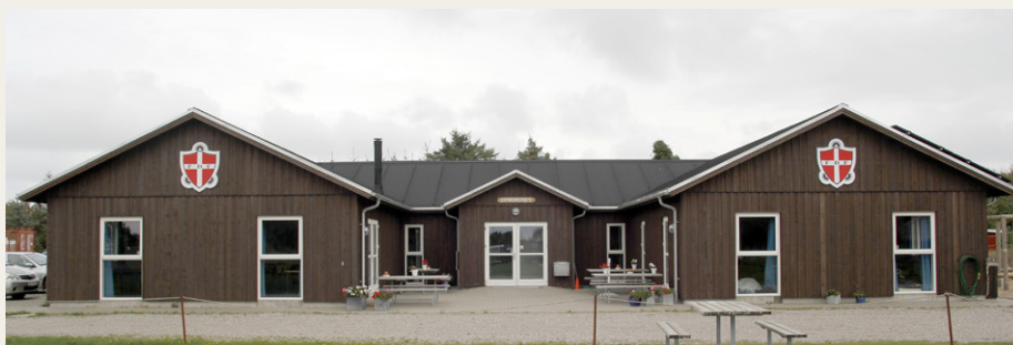
„Lynghuset, hvor vi heldigvis i det tiltagende skydække kunne få busly til vores frokost.

Ved bussen mødte vi en af de frivillige, som gør en stor indsats for at holde bussen kørende. Han fortalte om bussens historie, hvor den havde kørt i rutefart, og om hvordan den var endt på museet, og så fortalte han, at motorblokken faktisk