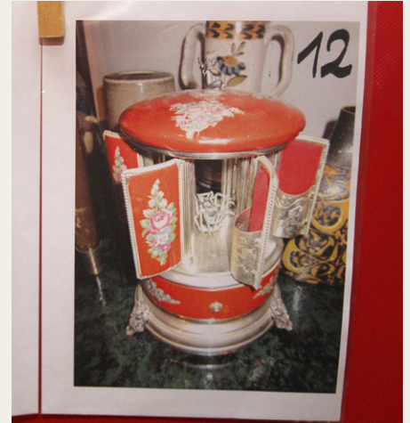
Hvem søren kunne vide at denne flotte dims er en musikalsk cigarholder?