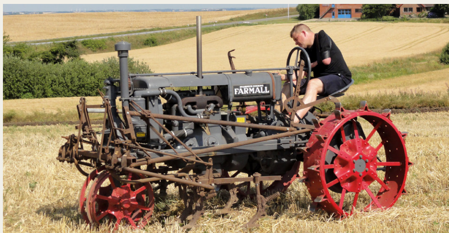
Farmall Regular traktor fra 1927