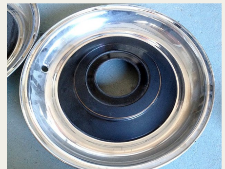
Navkapslerne skulle også udstyres med en staffing, og den skulle jo helst centrere med resten af hjulet.

Denne sidste løsning blev valgt. Det blev aftalt, at Brovst Autolakering skulle færdiggøre selve karosseriet, de fire døre og motorhjelmene med sort lak, da der er stafferinger på alle disse dele. Det blev videre aftalt, at vi skulle montere motorhjelmene, som består af 4 dele, der først skulle samles til én enhed, og der efter de fire døre og de blanke sidelister hele vejen hen ad siden, da stafferingerne netop skulle placeres med én over og én under de blanke sidelister. Og der skulle nødig blive „søgang“ i stafferingerne i forhold til listen, dørene og karosseriet hen langs siden af bilen, hvorfor dette arbejde var