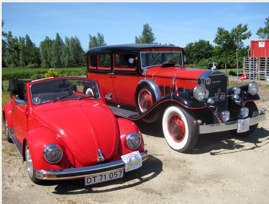
Ved Peugeot i Bejstrup var Folkevognen kommet i meget fint selskab, da den var parkeret ved siden af den største deltagende bil, en Pierce Arrow Model 41 fra 1931.