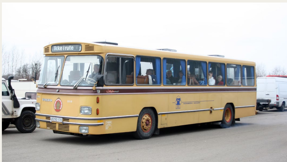
Bussen under et tidligere besøg i Fredericia.

Efter endnu et par timer eller tre, gik turen hjem over. Ryge/tissepause ved Gudenå rastepadsen. Almindelig hygge og tilfredshed med at vi tilsyneladende var de eneste der kom til stumpemarked i en „ordentlig“ bus, og så gik turen videre hjemover. Næste stop Haverslev: