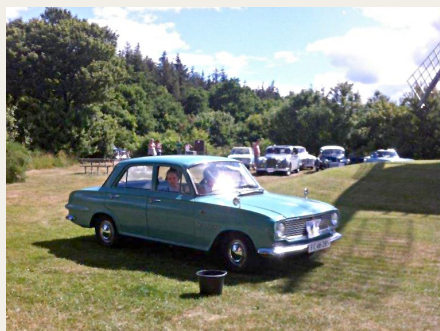
Ved Oxholm Mølle fik chaufføren bind for øjnene, medens passageren skulle kaste bolde i de spande, bilen kørte forbi.

Klokken ca. 14.30 var de første biler tilbage i Birkelse, hvor der nu skulle parkeres i skolegården på grund af en fodboldkamp på sportspladsen. I skolegården kunne interesserede igen beskue de flotte køretøjer. Vi, som havde været med i løbet, skulle samles i forsamlingshuset til buffet, leveret fra Rævhede Naturfarm (rigtig lækker), derefter dejlige islagkager og citronfrømager leveret fra Ryå mejeri