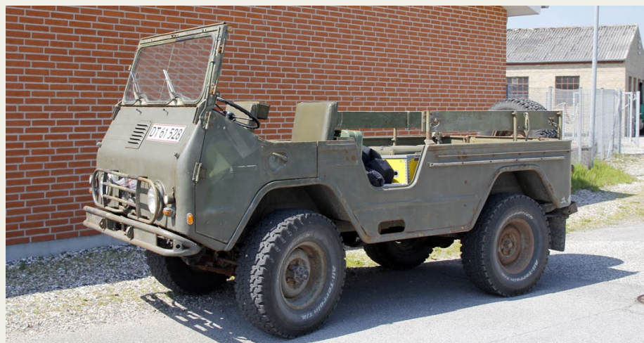
En af de sjældnere deltagere i klubbens arrangementer er denne Volvo L3314N fra 1966.

Turen mod Mariager gik gennem Norup og Assens og et meget flot landskab, og i Mariager by blev vi ledt ind gennem den ældre del af byen, hvor vi fik fornøjelsen af at køre på de gamle brosten. Vi endte nede ved havnen, hvor vi fik udleveret den