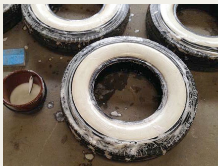
Hvide dæksider skal være hvide, og ikke grå. Det krævede masser af opvaskemiddel og knofedt at nå dette resultat.