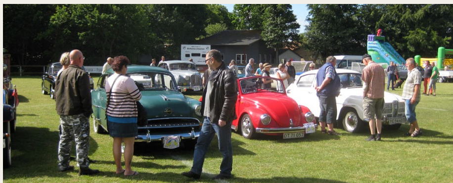
Ved ankomsten til sportspladsen i Birkelse blev folkevognen parkeret mellem andre skønne veteranbiler.

mod Post 1, som var ved Brovst Bil Syn. Co-piloten var begyndt at få farve tilbage i kinderne, og vi besluttede, at vi skulle yde vores bedste. De fem „spørgsmål til din veteranbil“ blev besvaret efter bedste evne. Vi fik fire rigtige. så det var jo en OK start.