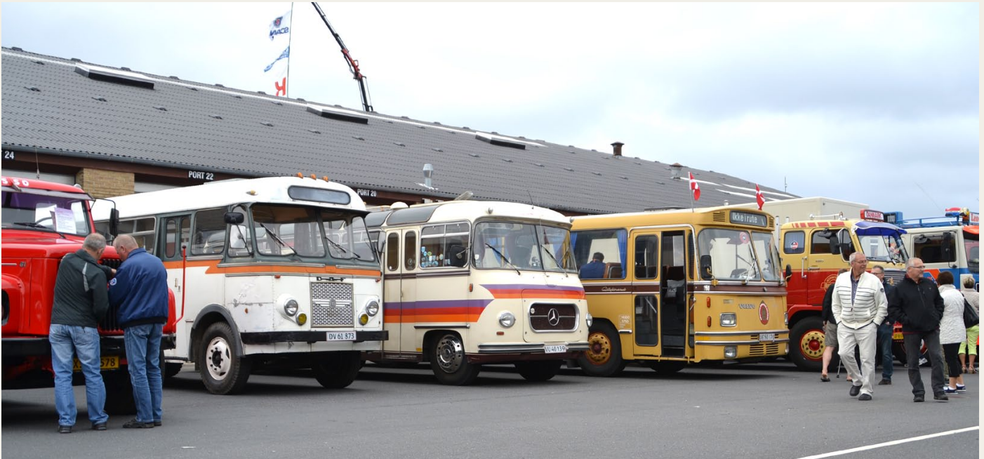
Vores fine gamle Volvo Bus i godt selskab i Silkeborg.