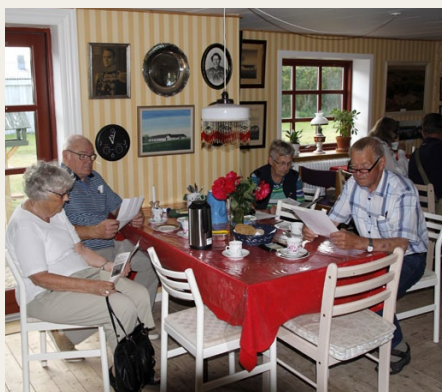
På Hanherred Egnssamling i Tranum blev der serveret kaffe og brød til de, der ventede på at komme til konkurrencen.

Ruten var lagt ud som en ring og lige numre skulle køre mod uret og ulige med uret rundt. Vi kom af sted med retning