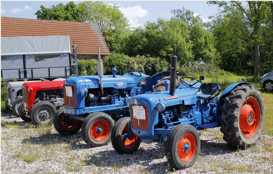
Veddum Traktorklub havde også i år fundet klenodierne frem i forbindelse med Veddumløbet.