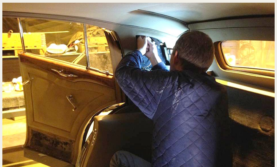
Per er i gang med at montere en af de indvendige lamper.

Stoffet til den nye himmel over fører- og passagersædet skal i øvrigt have en bemærkning med på vejen. Jan og jeg var på besøg hos F. L. BUUR i Vraa, og vi havde en stump af den gamle himmel med. Vi fandt, hvad vi søgte – passende stof til fornyelse af himlen over forsæderne. Hende vi talte med hos F. L. BUUR grinede lidt af os, og spurgte så til sidst, hvilken side af stoffet, vi ville vende ud. Vi pegede prompte på den brune side, som var næsten helt identisk med den gamle himmel. Årsagen til, at der blev grinet var, at det rent faktisk var vrangen på stoffet, vi agtede at bruge. På den anden side var stoffet hvidt med et mønster, og det stof bliver normalt brugt i forbindelse med polstring i lastbiler. Men pynt med det – vrangen passede lige i øjet, og er i dag ny himmel i den forreste halvdel af min Rolls Royce.