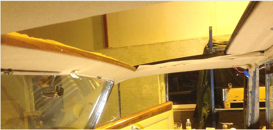
Ny „himmel“ monteres over forsædet.