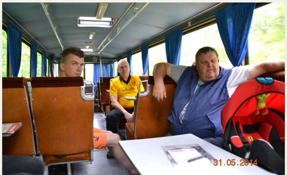
En del af det dygtige hold, som hentede en sjetteplads i Silkeborg.