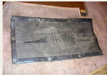
Den gamle stive „beelpad“, som efter lidt overtaelse heldigvis kunne erstattes af en helt ny.

det har rigtig mange andre også, for han har solgt en hel del af de producerede.