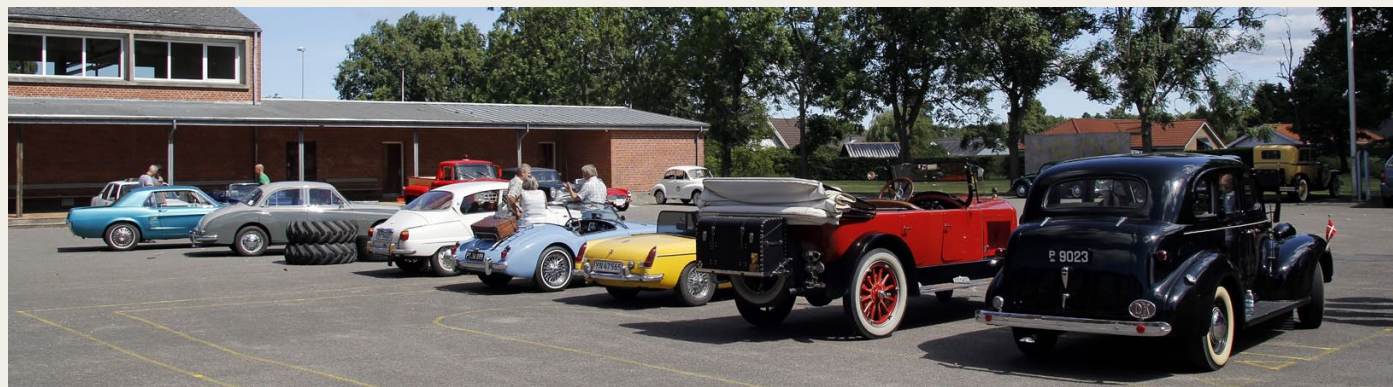
Efter løbet parkerede vi bilerne i skolegården, som ligger lige ved siden af Birkelse Sportsplads.