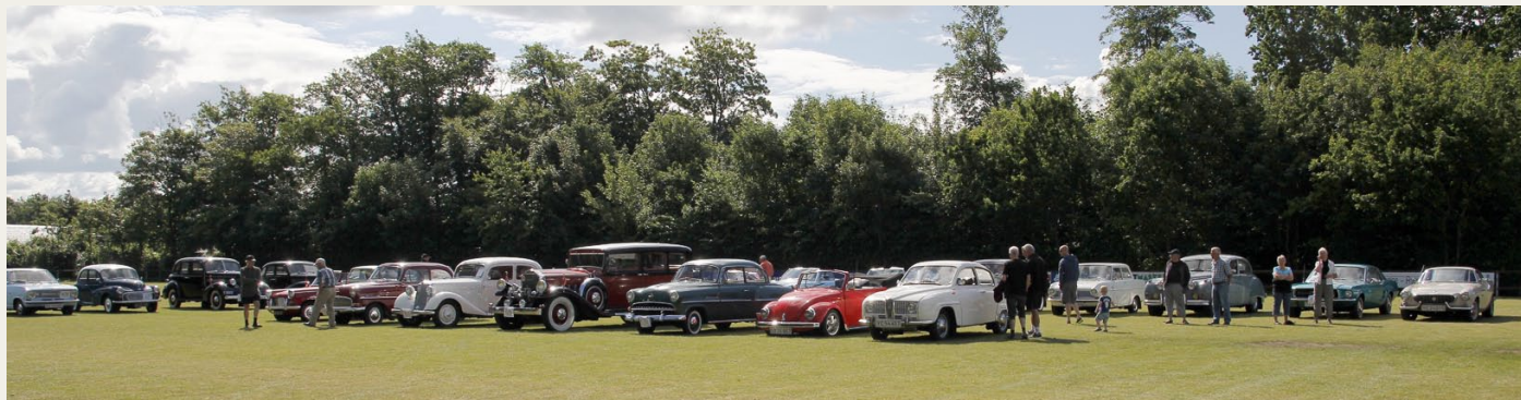
Det er et herligt syn, når så mange forskellige gamle biler samles, som her på Birkelse Sportsplads.