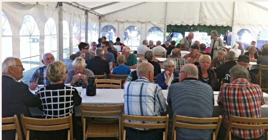
Inden starten på Jammerbugtløbet var der kaffe og rundstykker til alle deltagerne i teltet.

retur. Alle bilerne var blevet forsynet med en køreplade med numre på. Bilerne blev sendt ud på køretur med et minuts mellemrum, biler med ulige numre blev sendt til venstre, de lige numre til højre, for at undgå for megen ventetid på de indlagte fem poster med sjove prøver.