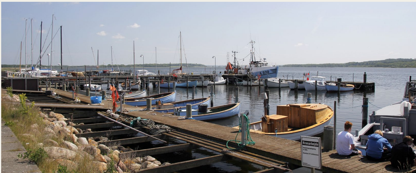
I det skønne forsommervejr er det vanskeligt at forestille sig et hyggeligere sted end den lille fiskerihavn i Hadsund. Udsigten fra Post nummer 3.

næste opgave. En hel række spørgsmål om Mariager og omegn. Alle svarene fandt vi i turistforeningens folder, som vi havde fået udleveret ved starten. Så her fik vi også fuldt hus.