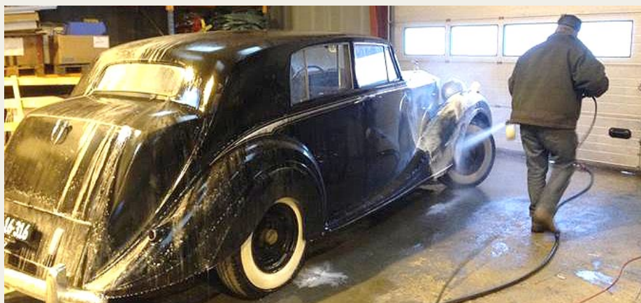
Endelig var bilen blevet så tæt, at den kunne udsættes for en storvask. Og det trængte den også til.