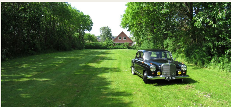
NVMK's grill-aften den 15. august afholdes på denne fine plads i Nibes sydlige udkant.