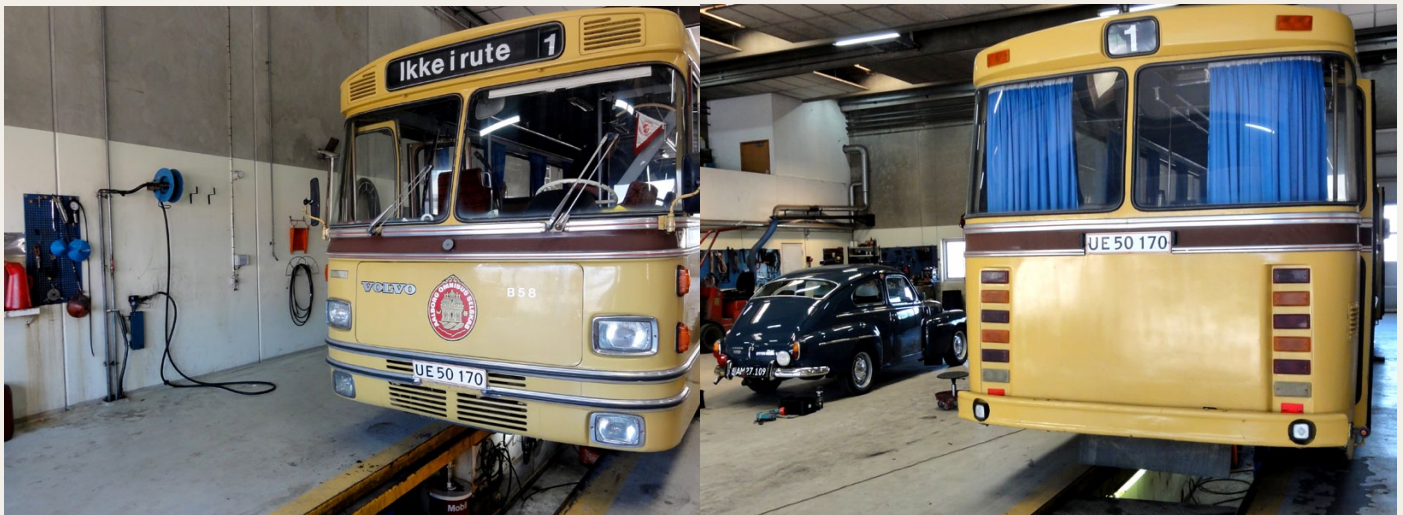
„Den Gamle Dame“ serviceres i både hoved og r . .