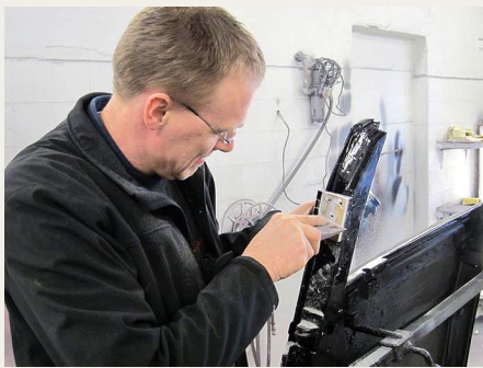
Efter maling af karosseri og døre, skulle der skrubes en del maling af igen for at få dørene til at passe.

I februar 2012 var Brovst Autolakering så langt, at vi skulle prøvemontere dørene for at se, hvordan situationen var – dels omkring hængslerne, og dels om hvordan dørene gik ind og ud af døråbningerne. Der var meget, som skulle skrubes m. v. på hængslerne og i de åbninger, som hængslerne sad i – men da det var gjort, kunne vi justere dørene til, som de skulle være.