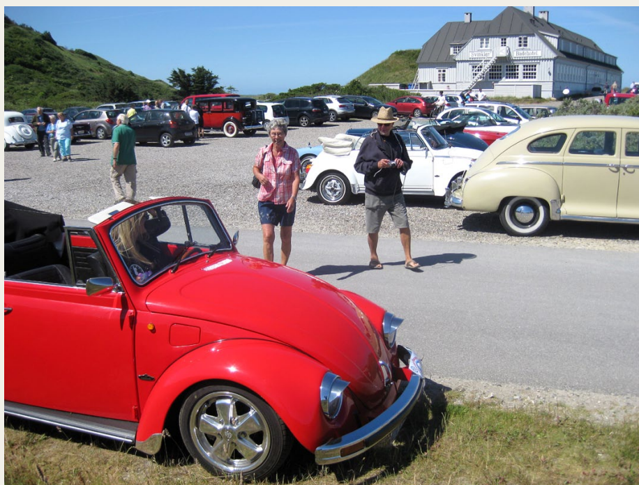
Folkevognen i godt selskab ved Svinkløv badehotel.

Videre op til Fosdalen og ned gennem bakkerne mod Slettestrand. Vejen var lidt bulet og vi slog et par gnister mod