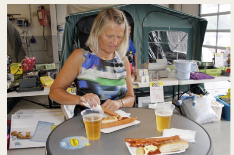
Dagens ret: To ristede med brød og fadøl.