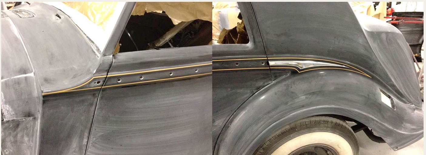
For at atafferingerne skulle komme til at sidde helt præcist, skulle dørerne monteres og justeres, ligesom pyntelisterne skulle være på plads. Bagefter skulle det hele pilles af igen, for at maleren kunne komme til at give bilen klarlak. Et stort arbejde, men det var ulejligheden værd.

nødvendigt. Derefter blev stafferingen lavet af Menne Design, Aabybro, hvorefter vi kunne demontere det hele igen. Det var et stort arbejde og meget „frem og tilbage for så lidt“ – men „den ældre herre“ fra England har helt givet ret i, at det er særdeles vigtigt for et godt visuelt resultat med stafferingerne, at såvel deres placering som deres tykkelse er nøje overvejet. Derfor er jeg i dag meget taknemmelig for de gode råd, som jeg fik af „den ældre herre“ fra England.