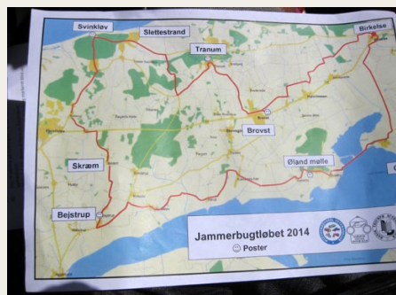
Det udleverede kort, som viser den flotte rute.