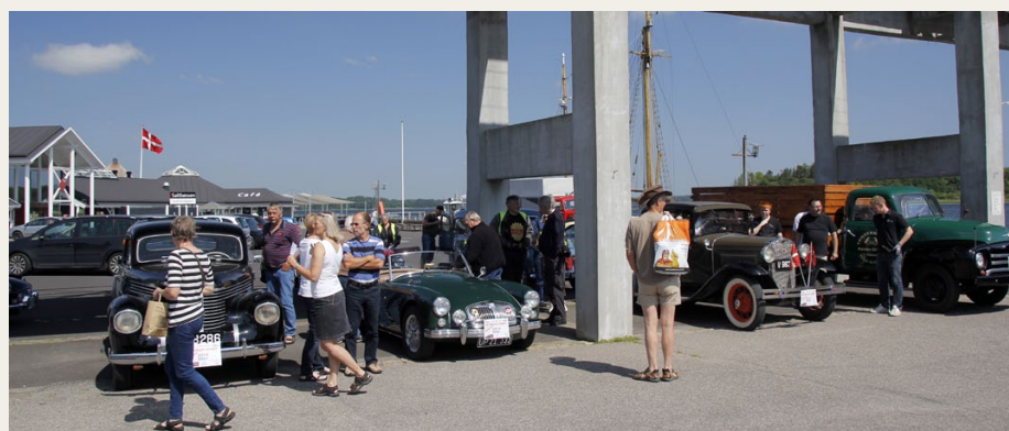
I Mariager, Rosernes By, mødtes vi under kulkranen på havnen.