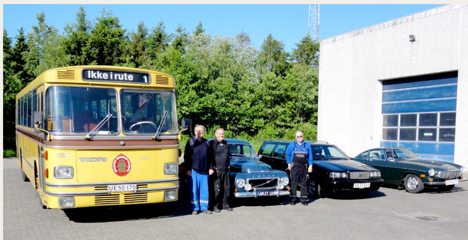
Selv om alle, der deltog i „Store Smøredag“ var kørende i Volvo, så er det altså ikke et krav, at man kører Volvo for at kunne deltage i vedligeholdelse af Bussen

Det blev til Kr. Himmelfartsdag - dagen før Veddumløbet og 2 dage før Silkeborg Veteran Rally, hvor det i år lykkedes at få