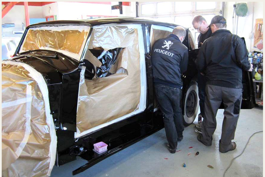
Og så skulle dørene ellers af og på - og af og på adskillige gange.

Jeg tog fat i RREC's moderklubben i England, idet jeg vidste, at de har en del tekniske eksperter tilknyttet. Jeg fik navnet på „en ældre herre“, som jeg kunne kontakte om emnet pr. telefon, og det gjorde jeg. Han havde selv arbejdet hele sit liv med at lave Rolls Royce biler, og han var bestemt ikke ked af at fortælle nærmere om, hvordan stafferinger skulle