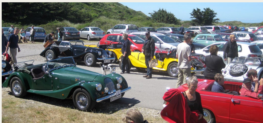
Morganklubben havde også benyttet det flotte sommervejr til en tur til Svinkløv Badehotel.