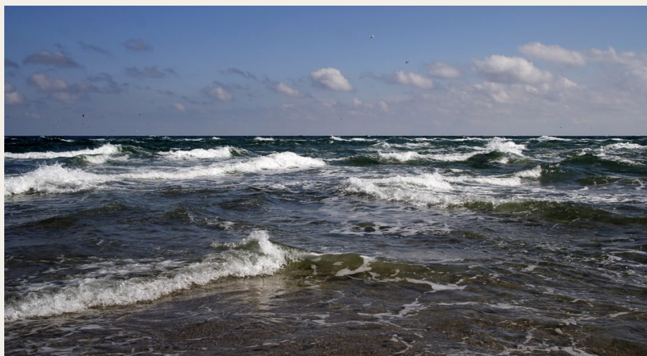
Den 30. august går turen til Skagen og Grenen, hvor vi kan opleve bølgerne fra Skagerak og Kattegat mødes.

Man skal selv medbringe alt – bortset fra borde og stole samt grill og briketter, og der er ikke tilmelding. Så bare mød op så mange som muligt til en kortere køretur og et par hyggelige timer i hinandens selskab.