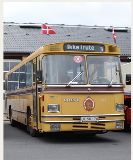
Selv om Bussen ikke er i rute, klarede den ruten ved Silkeborg Veteranrally i fin stil.