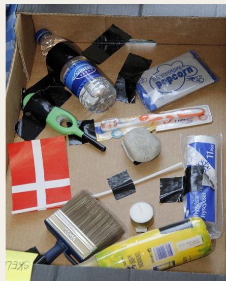
Opgaven på post 4: Kig i 30 sekunder og busk så disse ti ting.