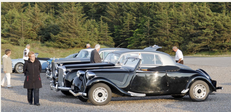
De flotte biler på parkeringspladsen blev også beundret af de øvrige gæster på Badehotellet.