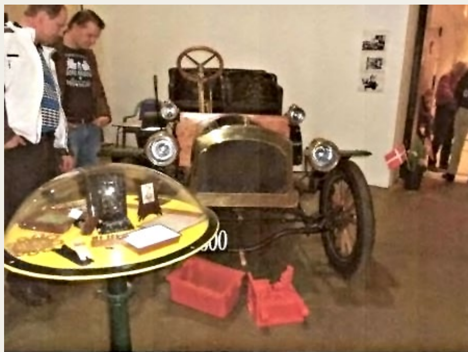
Tornadoen havde fået en meget fin plads lige ved indgangen.