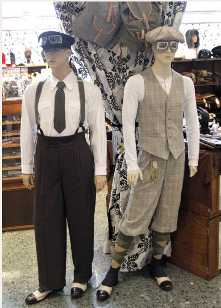
Hos Retronia kunne man købe tøj og tilbehør, som passer til vores gamle biler.

Men alting har en ende, som Shu-bi-dua synger, og lidt over halv seks begyndte vi at trække ud mod bussen, som var klar til at køre, så snart chaufførens køre-hviletidsbestemmelser tillod det, hvilket vil sige lidt før klokken seks. Så gik det eller i fuld galop mod Hüttener Berge, hvor man var advaret om, at der ville komme tre busser med sultne passagerer, som skulle spise i løbet af tre kvarter. Heldigvis var bus