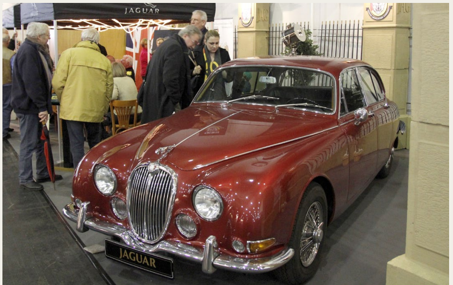
På Jaguarklubbens stand fandt vi denne meget flotte Jaguar S-Type 3,8 fra 1963.