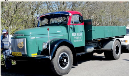
Volvo L485 fra 1964

Dermed en bred palet af veterangrej til vores besigtigelse. Og en enkel kendis i fuld gang med savning af tømmer, med assistance fra en 24 hk ASÅ dieselmotor fra 1950.