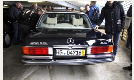
Denne bagende formåede at påkalde sig opmærksomhed på lang afstand. Disse store Mercedes-Benz 450 SEL 6,9 fra slutningen af halvfjserne var Autobahnens konge.