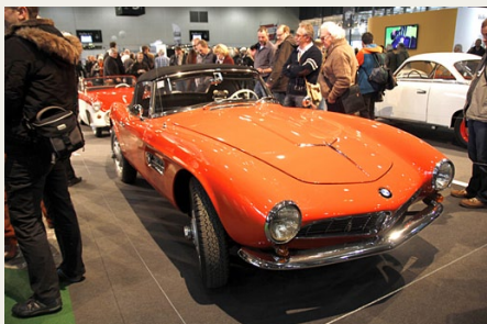
En BMW 507 er med sit flotte design altid en fryd for øjet, men med kun 254 producerede eksemplarer, er det ikke alle forundt at se en.

For et par måneder siden blev et eksemplar solgt for lidt over 13 mio kroner på en auktion i USA. Den viste bil, som ikke var til salg, er fra 1957.