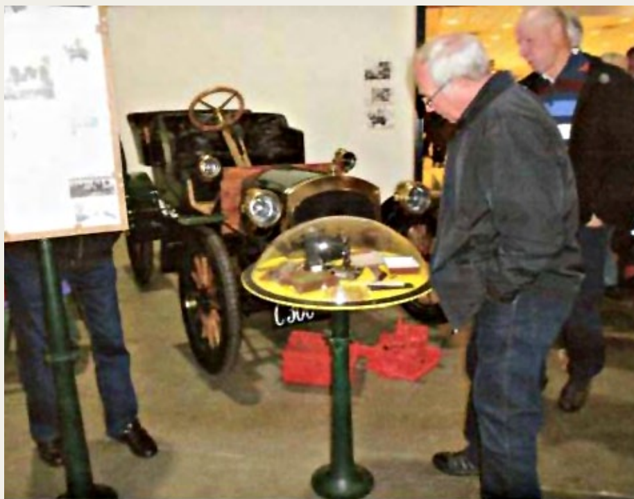
Der var stor interesse for og spørgelyst til „Farfars“ gamle ting.

Bord og stole skulle også findes frem og der skulle laves aftaler med nogle venner som kunne hjælpe med at få Tornadoen ud af værkstedet og op i traileren. Kopi af den originale motor er under opbygning,