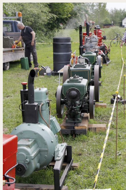
Stationære motorer er altid et stort bit ved de nordjyske veterantræf, især hvis de er bragt til live.