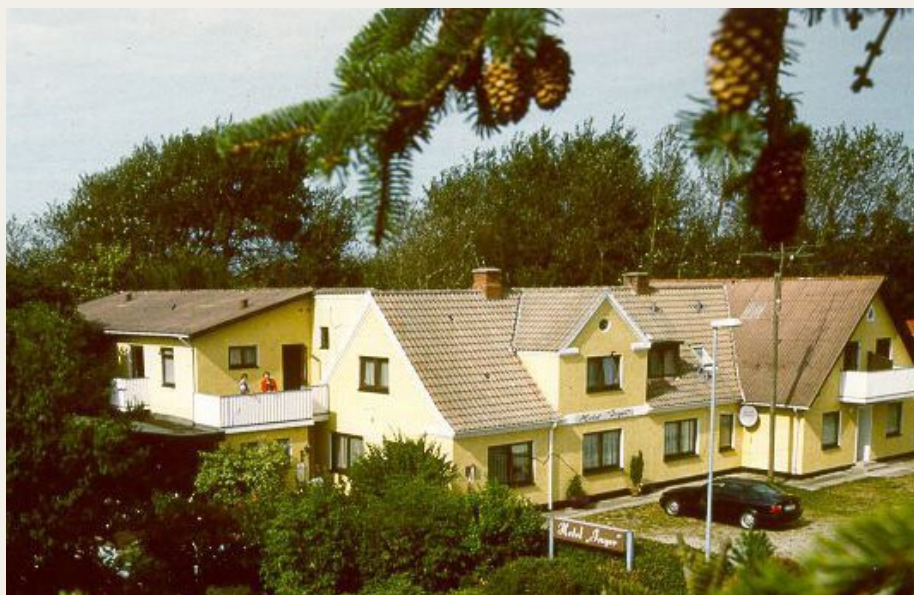
Hotel Inger i Hulsig er kendt for sit fine køkken med mange fiskespecialiteter.