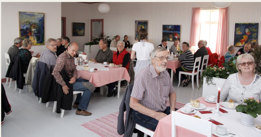
48 gæster fyldte godt i den Røde Stue på Svinkløv Badehotel.