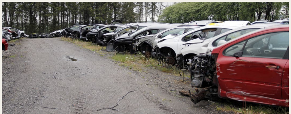
Alle skrotbilerne var linet op i lange lige rækker, sorteret efter bilmærke og model.