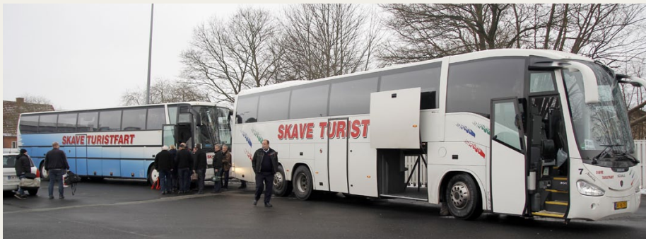
Bus nummer 2 og bus nummer 3 for afgang fra Viborg. Efter at have stået og ventet i den bidende kolde januarvind, var det en velsignelse at komme ind i varmen.