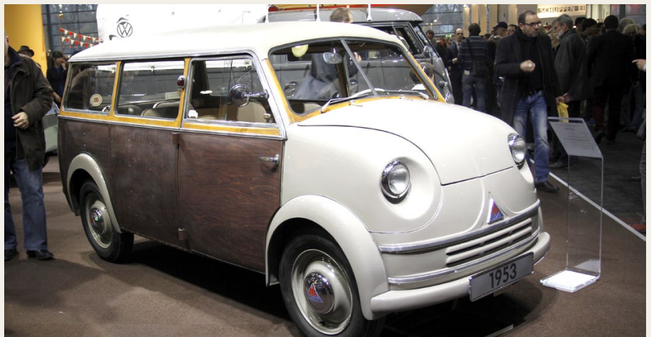
Autostadt i Wolfsburg havde en flot udstilling med „Nutzfahrzeuge“, blandt andet denne meget flotte Lloyd LT 500 fra 1953