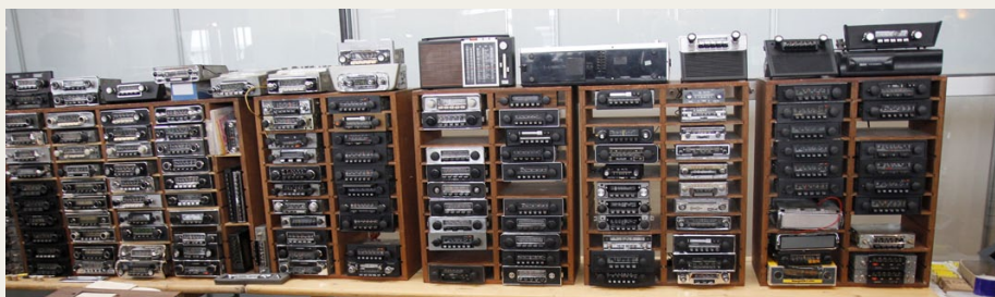
Mangler du lige en bilradio til din gamle bil, kunne du også finde den i Bremen.

nummer tre hurtigst ude af starthullerne, for enten var man på restauranten ligeglædet med, at vi kom så mange på en gang, eller også havde de bare undervurderet, hvor mange der skulle spise. Efter 45 minutter var de knap nok færdige med at betjene passagererne på den første bus, så der var flere af passagererne i de senere ankomne busser, som ikke fik aftensmad den dag.