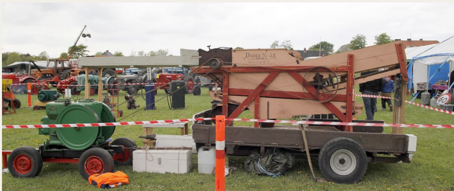
Asaa dieselmotoren trak det gamle tærskværk igennem de to dage.

det var mod hårde odds, at undertegnede med kort varsel blev sendt op på lastbil-ladet for at præsentere de deltagende biler, men med lidt hjælp fra chaufførerne gik det vist nogenlunde.