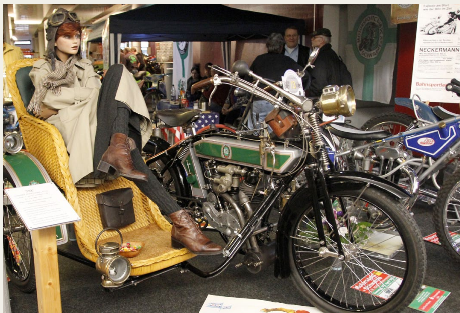
I afdelingen for motorcykler faldt vi svime over denne flotte NSU „Schwerer Zweizylinder“ Typ C fra 1913 Motorcyklen er tilmeldt et motorcykelløb i Niedersachsen den 20. og 21 juni i år.