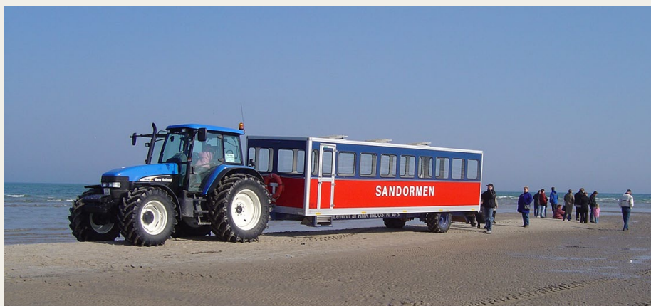
Sandormen kører hver sommer masser af turister helt ud på spidsen af Grenen.

Sommersæsonen 2014 afsluttes med udflugt til SKAGEN lørdag den 30. august 2014. Selve arrangementet starter ved Den Tilsandede Kirke kl. 10, så bare man er der på det tidspunkt, er det i orden. For de der ønsker at følges ad, er der fælles afgang fra klubhuset på Forchammersvej i