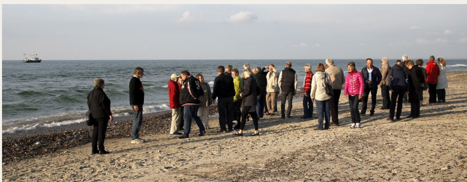
Inden kaffe og lagkage blev serveret, nød vi det pragtfulde vejr ved Jammerbugten lige neden for Svinkløv Badehotel.