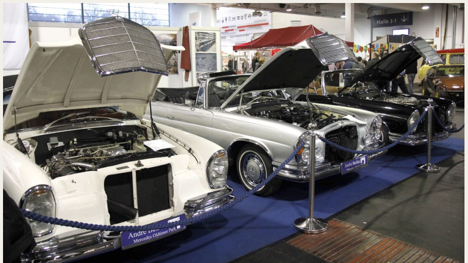
Tre søvnige og topløse Mercedes'er fra tresserne.

For et par måneder siden blev et eksemplar solgt for lidt over 13 mio kroner på en auktion i USA. Den viste bil, som ikke var til salg, er fra 1957.