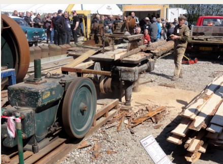
Bonderøv på arbejde

Dermed en bred palet af veterangrej til vores besigtigelse. Og en enkel kendis i fuld gang med savning af tømmer, med assistance fra en 24 hk ASÅ dieselmotor fra 1950.