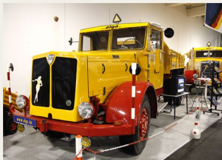
Henne i et hjørne fandt vi en stand med tre - fire store rød-gule lastbiler, alle af tysk oprindelse. I forgrunden har vi en Faun L 7 Z fra 1950. Dens 6-cylindrede motor på 13,5 liter yder 150 hk. I baggrunden holder en Büssing S 8000, også 1950.