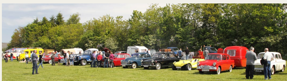
Et lille udsnit af de mange fremmodte veteranbiler.