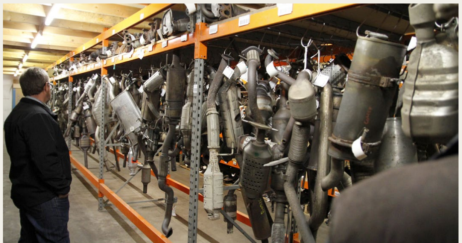
Inde i de store haller var der også styr på tingene. Her er det udstødningsrør og lydpotter i massevis.

til den rigtige lokation for at afmontere, så den hurtigt er klar til forsendelse eller afhentning.