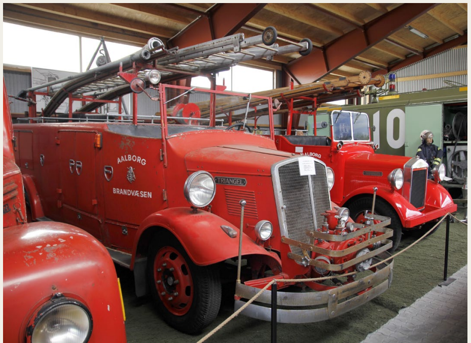
Garnisonsmuseet har tre Triangel brandbiler i samlingen. Alle tre har kørt for Aalborg Brandvæsen.