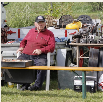
Aks Torp med det store udvalg af næsten uundværlige reservedele til et ethvert veterankøretøj.