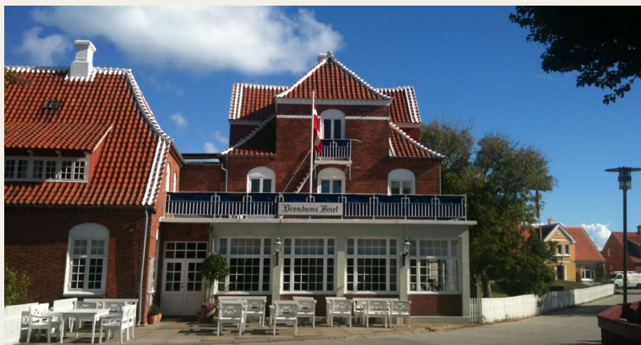
Vi skal have vores eftermiddagskaffe på Brøndums Hotel i Skagen.

Den samlede deltagerpris for arrangementet indtil dette tidspunkt, og inkl. guide ved Den Tilsandede Kirke, billet