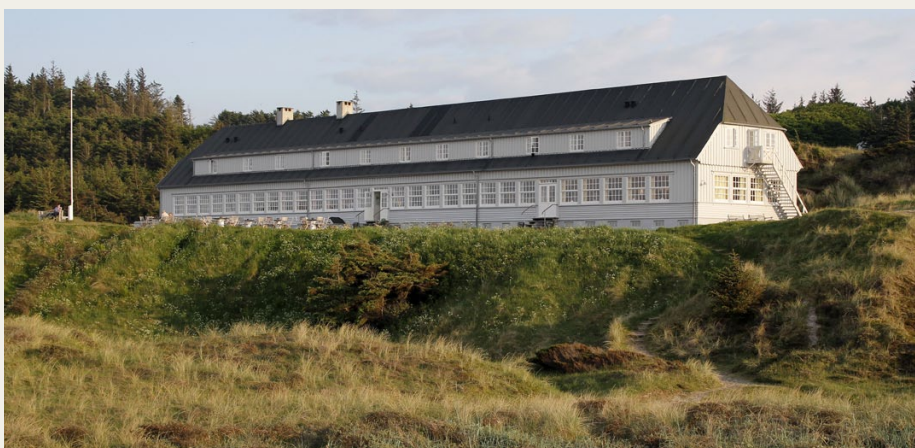
Svinkløv Badehotel bader sig i aftensolen.