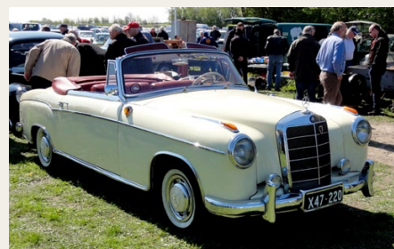
Mercedes Benz 220S Cabriolet fra 1957.

Og hvad med „lille“ jeg? Imponeret over alle disse fantastiske maskiner, men ikke ensbetydende med at ville eje dem. Så forholdt det sig helt anderledes med de ældre biler: En sød stjernebil fra 1950,erne