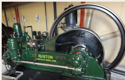
Ruston, 28 hk diesel fra 1935

Hvad imponerede mest: ALT. At man har været i stand til at indsamle og restaurere disse prægtige maskiner fra