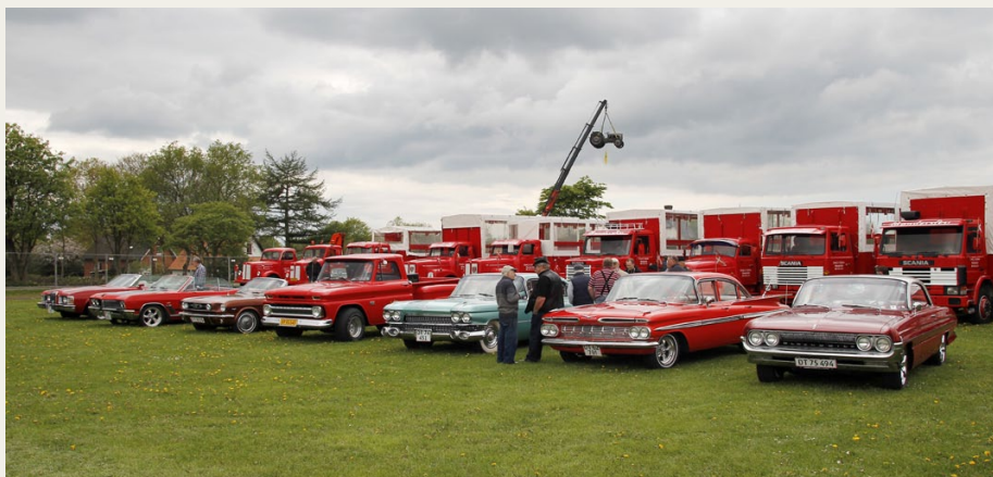
I løbet af lørdagen kom denne flok amerikanerbiler til arrangementet. Man kan spørge om hvorfor de blev benvist til området foran lastbilene, men størrelsen berettigede vel næsten til det..