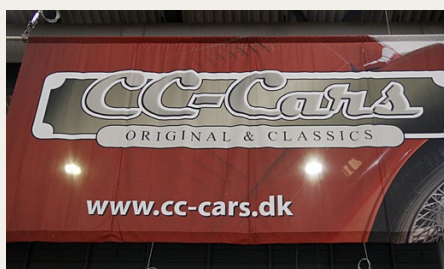
CC-Cars fra Ans havde også fundet vej til Bremen Classic Motorshow

Ud over de mange salgsstande var en række bilklubber og museer også på plads med en række mere eller mere fantasifulde udstillinger. Blandt andet så vi en udstilling med et stykke tysk vej, en servicestation og en række tyske biler fra halvtredserne, der under overskriften „Wirtschaftswunder“ viste mange af de små køretøjer, som var hjørnesten i det