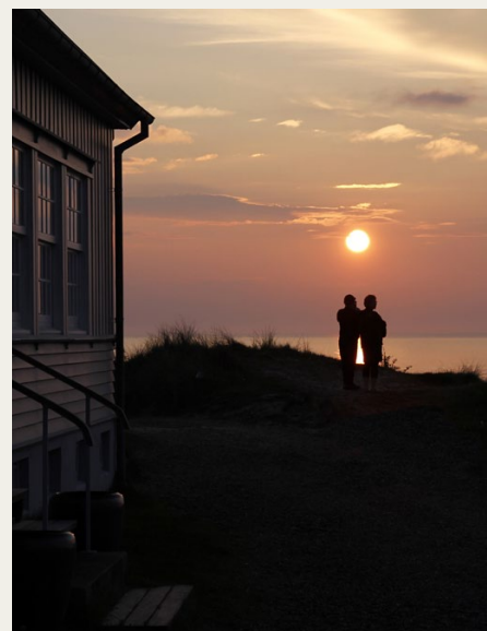
Så er det lige før solen går ned over Jammerbugten på en flot forårsaften.