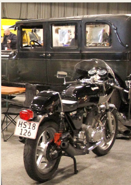
Poul Eriks Rasks 1976 Laverda 750 motorcykel.