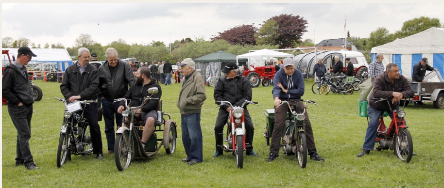
Den nystiftede Brønderslev Veteran Knallert Klub var mødt talstærkt op. Her ses en lille del af de tilstedeværende veteranknallerter.