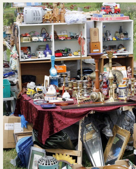
Der var mange fine ting og sager.