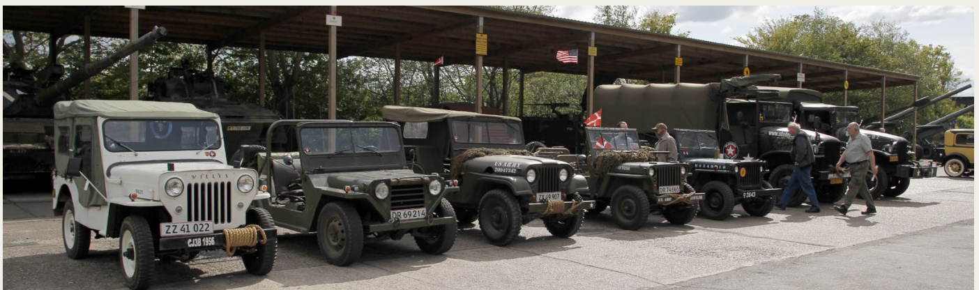
Syv militærkøretøjer havde fundet vej til Garnisonsmuseet for at fejre frihedsbudskabet.