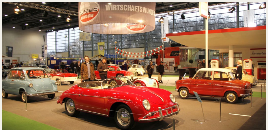
Under overskriften „Wirtschaftswunder“ havde udstillerne lavet et miljø med en række tyske biler fra halvtredserne. I første række ses en 1958 Zündapp Janus og en 1957 Porsche 356 Speedster. I næste række holder en BMW 507 (skjult bag Janus), en 1954 Kleinschnittger Spezial, en 1949 Champion CH-2 og en 1960 NSU Prinz 3. Ved tanken holder en Goggomobil, og i baggrunden en Mercedes Benz 300 SLR og en BMW Isetta.