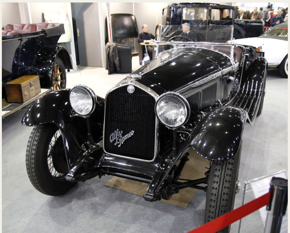
For 1.300.000 € (Ca. 9,7 mio kroner) kunne man erhverve denne imponerende Alfa Romeo 6C 1750 GS Zagato fra 1932. Det er ca. halvt pris, hvilket skyldes, at bilen på et tidspunkt har fået nyt karrosseri.