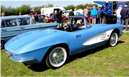
Chevrolet Corvette fra 1961.

Antallet af dagens fremmødte androg ca. 1600-1700 personer. Det gode vejr havde herudover lokket masser af unge og ældre to-hjulede, et mindre antal veteranbiler