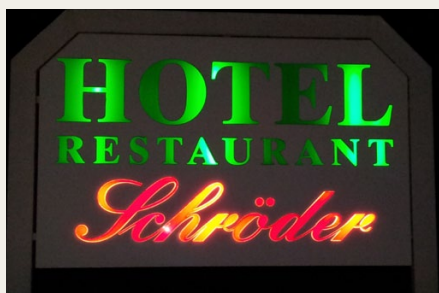
Vi spiste og overnattede på Hotel Restaurant Schröder i Gross Meckelsen.

Så gik det ellers ud over de midtjyske stepper. Bus nummer tre, som vi var med, havde næste stop ved DTC Vejle.