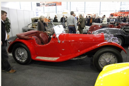
Hos E. Thiesen kunne man købe denne røde SS 100 2,5 L Roadster fra 1938 for den nette sum af 335.000 € (Ca. 2,5 mio kroner).

Vi havde hørt, at tre etager af messecentrets parkeringshus var reserveret til private, som ønskede at stille deres biler til salg, så vi besluttede os for at starte der. Og der var masser af biler til salg. Hvis du stod og manglede en ordinær Mercedes Benz eller en Porsche 911, var der et rigtigt stort udvalg, men de rigtig sjove og spændende biler var der længere imellem.