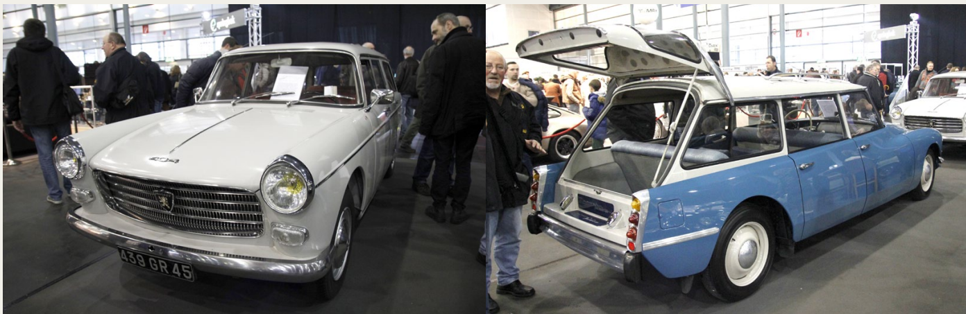
En peugeot 404 Familiale fra 1963 var allerede blevet solgt, mens kollegaen, en Citroën ID 19 F Familiale Luxe fra 1962, stadig venter på sin nye ejer.