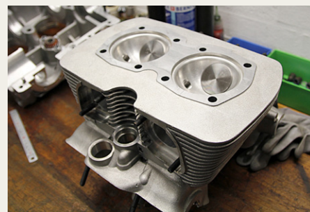
Et topstykke til en Carrera motor med store skrånede ventiler.