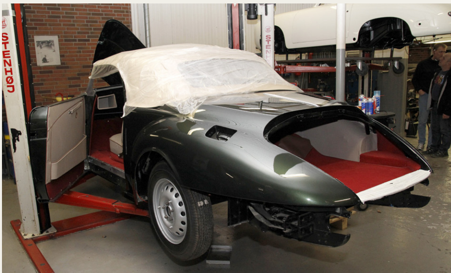
En Bristol 402 fra 1951 var nok ikke lige det vi havde forventet at finde på et Porsche værksted, men kvaliteten i arbejdet fornægter sig ikke.

I det andet udstillingslokale bemærkede man straks et køretøj, som var noget lavere end alle de andre Porsche'r. På nummerpladen står der „906 PI“, og de opmærksomme vil kunne genkende bilen fra sidste nummer af Hornet, hvor Peters passion for klassisk motorløb blev beskrevet. Bilen er en Porsche 906 fra 1966, og hele bilens racerhistorie er kendt fra den som ny blev