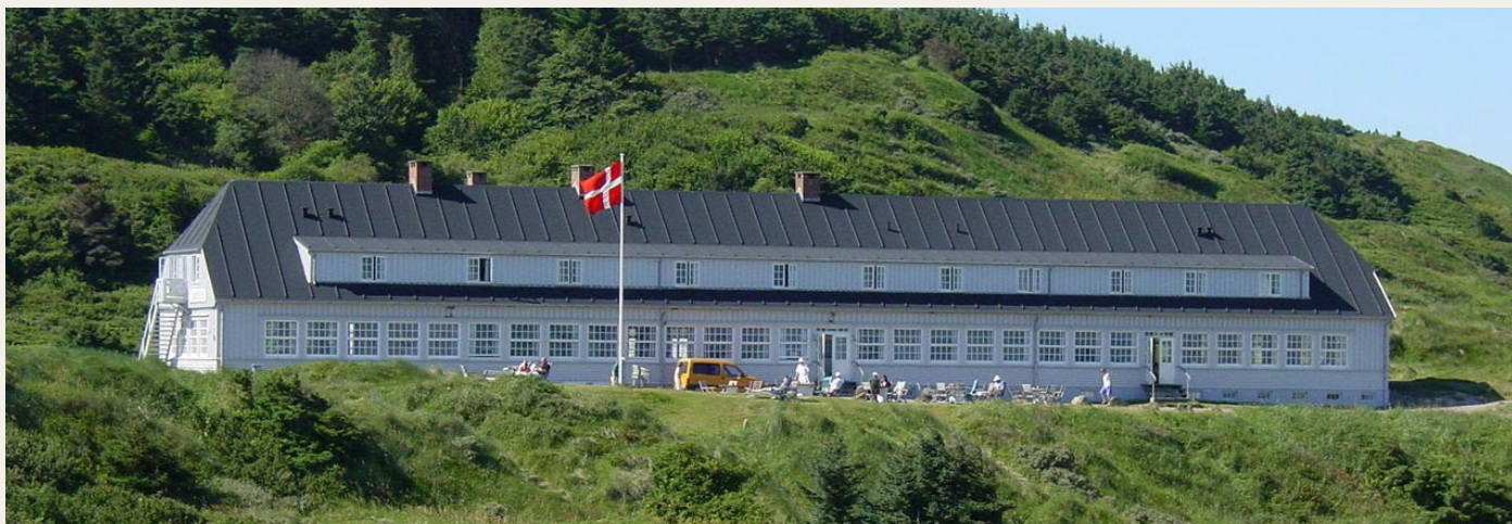
Den 19. maj går turen til Svinkløv Badehotel

Planen er, at vi alle skal ankomme til Svinkløv Badehotel omkring kl. 19.30, og der efter gå en tur ved havet – for så at drikke aftenkaffe/te med lagkage på Svinkløv Badehotel, hvilket er aftalt til kl. 20.30. Når arrangementet på Svinkløv Badehotel slutter, er der individuel hjemkørsel. Prisen for at deltage både i spisning et af de anførte steder efter eget valg og arrangementet på Svinkløv Badehotel er kr. 200 pr. deltager, mens det koster kr. 80 pr. deltager, hvis man spiser hjemmefra og alene ønsker at deltage i arrangementet på Svinkløv Badehotel. Der kan maksimalt deltage 40 personer, og derfor er der tilmelding efter „først til mølle“ princippet. Belært af erfaringerne med arrangementet hos Peter Iversen, er den følgende mandag