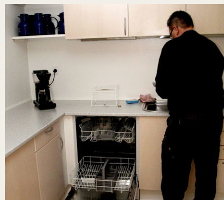
Gerner skyller bestikket af, inden det kommer i opvaskemaskinen.