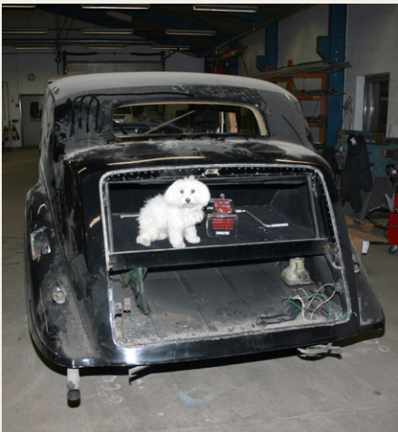
Et styk næsten demonteret Rolls Royce med Plysse til at holde øje med at fotografen ikke piller ved noget.

En anden klog mand sagde om renovering af veteranbiler, at „man skal huske, at det tager dobbelt så lang tid at samle dem, som det tager at skille dem ad“. Det har vist sig også at være korrekt i vores projekt, som jeg her nærmere skal fortælle