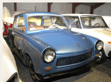
Blandt Finn Skotlander Thomsens mange udstillede køretøjer har vi valgt at vise denne Trabant P601 Standard.