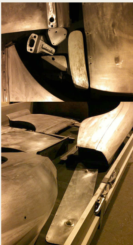
... men også et utal af afmonterede karrosseridele skulle udsættes for den kemiske afrensning.