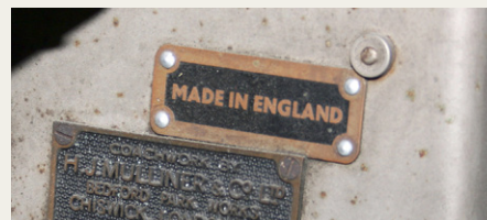
„Made in England var en speciel eksportfeature.“