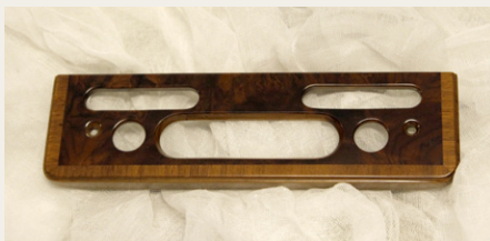
Resultatet af lakering af træværket var særdeles tilfredsstillende. Her er det noget af træværket fra instrumentbordet.

Vedrørende problematikken omkring blank eller mat lak tog jeg atter kontakt til RREC's teknisk sagkyndige. Han kunne oplyse, at træet blev lakeret med en ret mat lak, da bilen var ny, for det gjorde man dengang. Men han kunne også oplyse, at man i dag i både Bentley og Rolls Royce anvender ret blanke laktyper, og at det giver et flot resultat. Hans forslag var derfor, at vi lavede vores egen lak „midt imellem“, altså ved at lave en blanding af mat og blank lak. Vi besluttede, at vi ville lave nogle lakprøver, og træffe vores beslutning på det grundlag. Det resulterede i, at vi over 3 omgange lavede i alt 9 forskellige lakprøver, og traf vores valg der ud fra. Resultatet er vi bestemt godt tilfredse med, så et grundigt forarbejde gav det ønskede resultat.