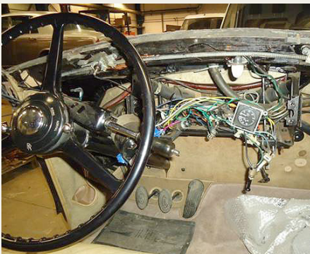
Afmontering af instrumenter og træværk afslørede et syndigt virvar af ledninger.