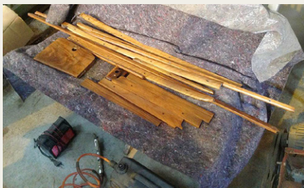
Lageret af flot nylakerede lister!