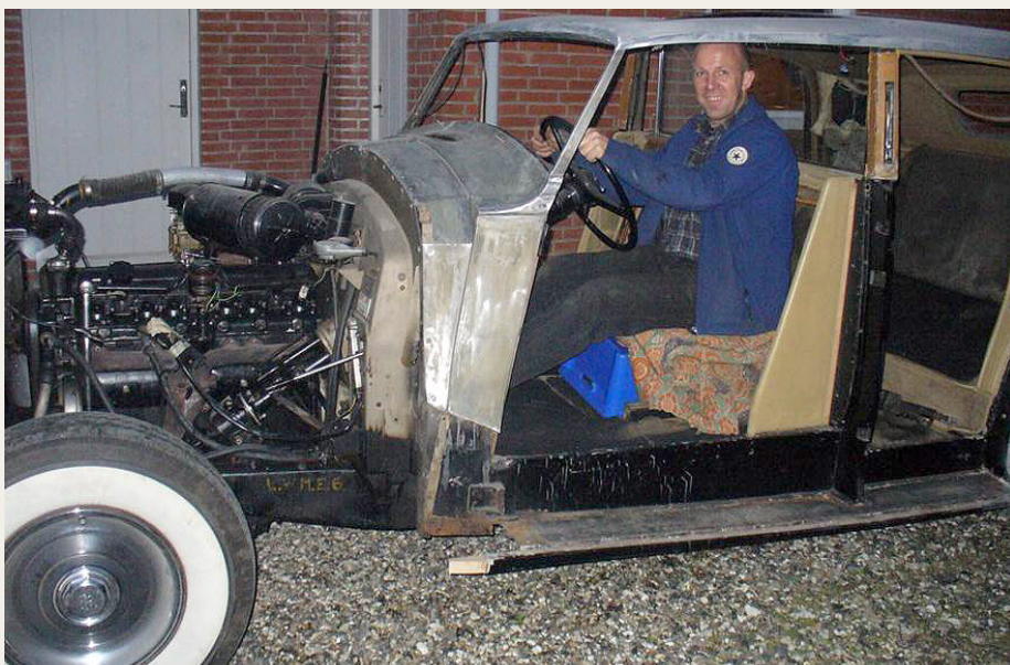
I november 2011 kørte en helt blank, skinnende aluminiumsbil og en stor 3-akslet trailer med løsdele til Brovst Autolakering.

Vedrørende det faglige om laktyper til træværket m. v. var vi i den heldige situa-