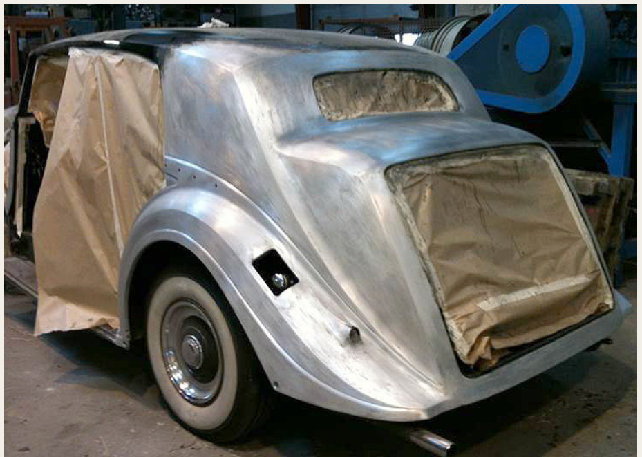
Det store arbejde med at fjerne lak gjaldt ikke kun selve karosseriet . . .

Første opgave var at finde ud af, hvordan den gamle lak skulle håndteres. Skulle den slibes af, kunne man glasblæse nogle af delene, kunne man sandblæse o. s. v. Bilen og alle karosserideler er af aluminium, så det blev hurtigt afklaret – bl.a. via kontakt til RREC's teknisk sagkyndige – at sandblæsning og glasblæsning ikke skulle prøves. Vi var dernæst bekymrede for skader på karosseriet, hvis den gamle lak skulle slibes af, idet aluminium er ret