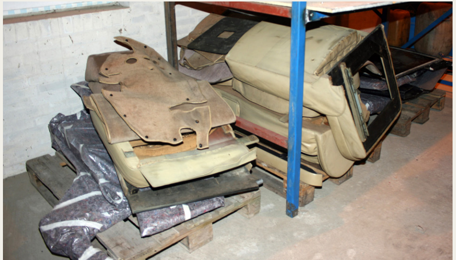
Sæder, tæpper og andre interiørdeler var demonteret og stablet på paller. Alt sammen behørigt mærket.