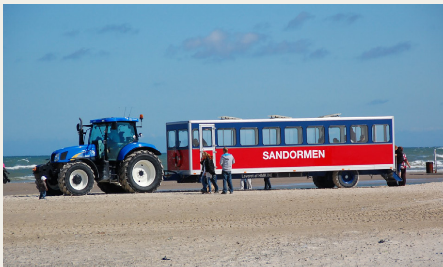
... og senere på dagen tager vi med Sandormen helt ud på Grenen.