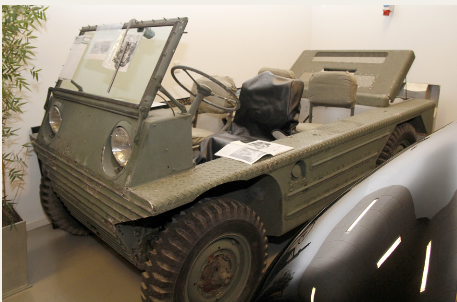
En Fletcher Flair ligner absolut ikke hvad vi normalt forstår ved en Porsche, men den var nu også beregnet til at skulle dække et behov hos den amerikanske hær. Det lykkedes ikke rigtigt.

placeret ude bagtil, hvor slige sager jo hører til. Transmissionen blev modificeret, så man fik træk på alle fire hjul, og et specielt fremdrift system skulle gøre det muligt at sejle.