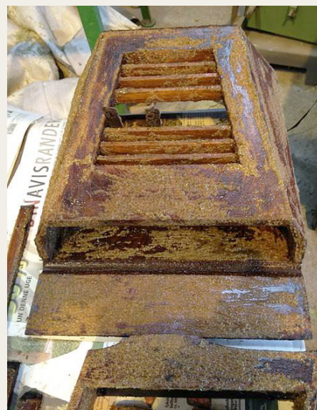
Det indvendige træværk blev også renses kemisk, så det sydede og boblede noget på værkstedet i denne periode.