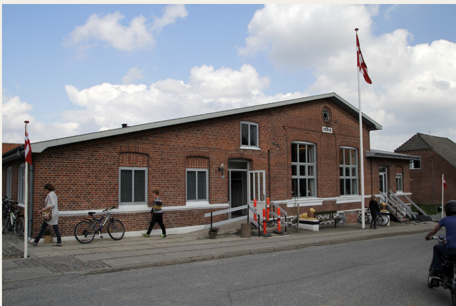
Den 30. maj starter Veddum-Løbet fra Kulturhuset Vedum Sal, som ses på billedet. Turen går hele vejen rundt om Mariager Fjord.

– 26/5 – reserveret for et eventuelt yderligere tilsvarende arrangement, hvis der kommer tilmeldinger fra en del flere end de 40, der er plads til.