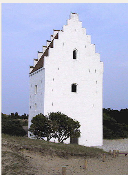
Den 30. august går turen blandt andet forbi den Tilsandede Kirke ved Skagen.

Sluttelig overvejes det at lave en mulighed for, at de der ønsker det på hjemvejen