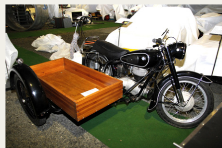
HC Hansens første motorcykelprojekt var denne BMW R25/3 fra 1956.