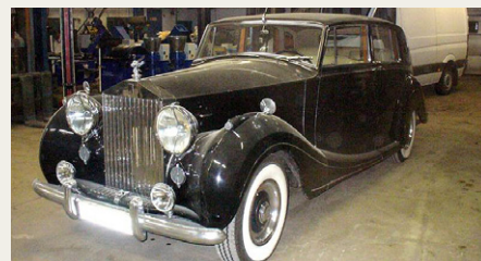
Et styk Rolls Royce, næsten færdigsamlet, men endnu ikke vasket.

Den første side af den 143 sideres præsentation, som Per Mogensen havde forberedt til aftenens foredrag