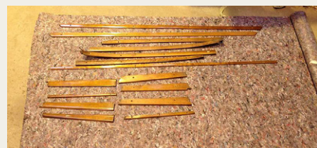
Trælister klar til afrensning hobede sig op.

Da lakken var fjernet fra bagdørene kunne vi i øvrigt konstatere, at bilen formentlig på et tidspunkt har haft et monogram placeret midt på hver bagdør, da vi, efter at have fjernet lakken på det sted på begge bagdøre, fandt 4 små skruehuller i en firkant. Men de huller er nu lukket til og godt gemt.