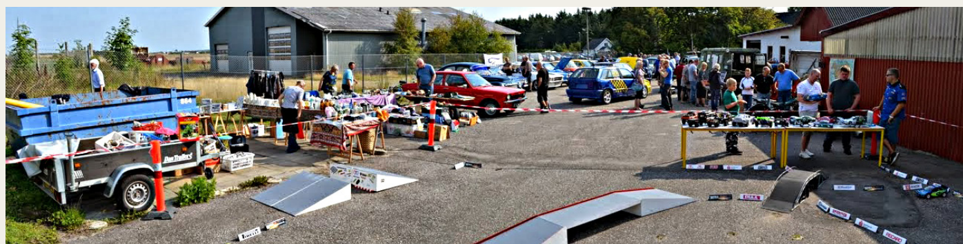
På pladsen bag NVMK's klubhus var der stumpemarked, biludstilling, RC-biler, racerbiler og meget mere.