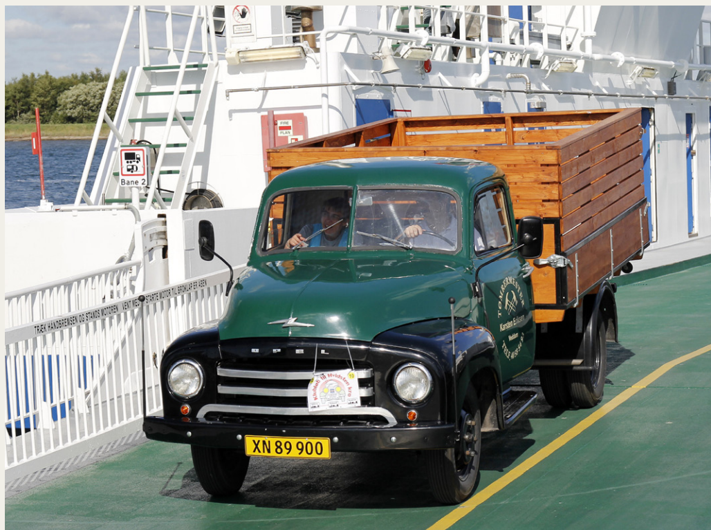
Vinderbilen, en Opel Blitz fra 1954, kørte fra borde i Udbyhøj Syd som den allersidste.