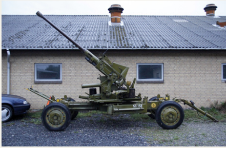
Sådan en 40 mm Bofors kanon kan skyde 120 skud per minut