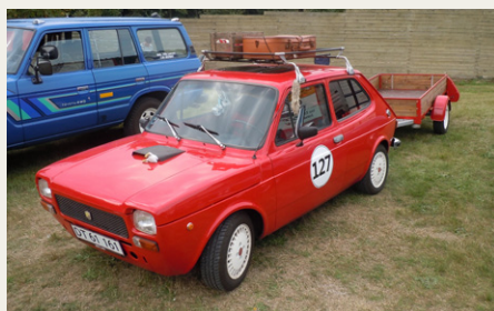
En meget lille "lastbil", Fiat 127 med tagbagagebærer og trailer