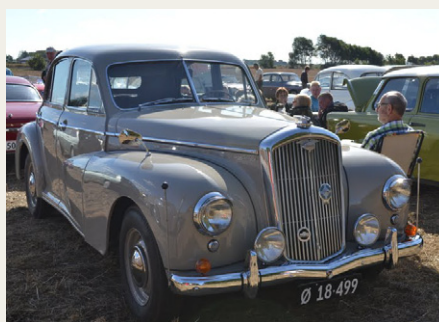
På marken holdt denne fine Wolseley 6/80 fra 1952

og fremmødet var også fint, og i år var marken bagved kommet med igen, hvilket gav noget mere luft. Dog var der ikke så mange lastbiler som der plejer, men utroligt mange forskellige bilmærker. Jeg fik en god „sludder“ med de øvrige Wolseleyejere, hvor man jo så får nye forbindelser og lærer endnu mere om dette bilmærke. Vi havde en fantastisk god dag dernede, og tager gerne turen derned til næste år.