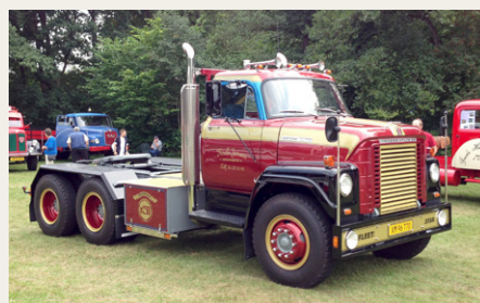
Flot IH Fleetstar med stor V8 benzinmotor og automatgear. Fantastisk „amerikanerlyd”, men godt at jeg ikke skal betale benzinregningen