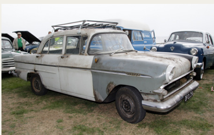
Denne Vauxhall Victor fra 1960 er vist ikke blevet vasket siden den blev hevet ud af bønsehuset, men den er blevet synet, så den må være go' nok.