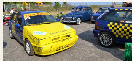
og Team Romer var mødt op med et par racerbiler.