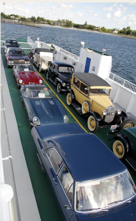
Færgen ved Udbyhøj var fyldt med veteran køretøjer. Kun en enkelt „civilist“ havde fået en lille plads på bagsmækken.

Post 1 og 4 var fysiske aktiviteter, hvor vi henholdsvis skulle vælte dåser og kaste med støvler, det sidste var dog ikke det nemmeste med rumpen i vejret og støvlen