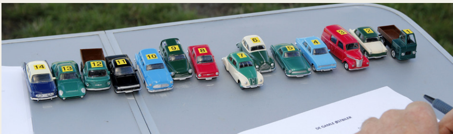
Fjorten østeuropæiske bilmodeller. Tolv af numrene skulle påføres opgavearket. En god opgave.