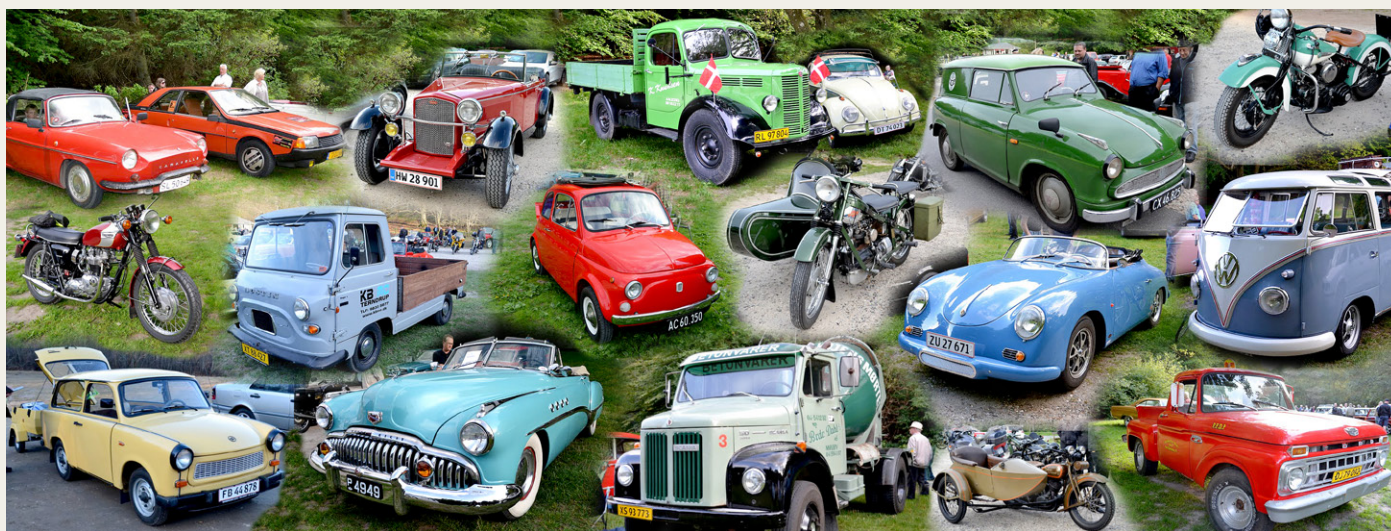
Collage med et lille udsnit af årets besøgende i Lundby Krat.