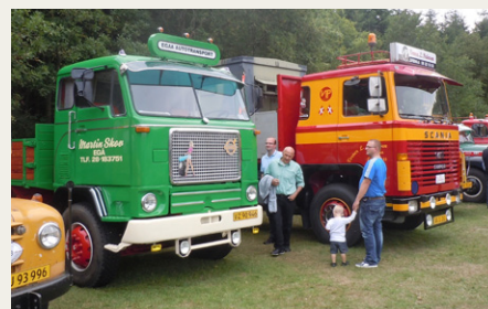
To af de helt store: Volvo Titan 495-1 (forgængeren til F88) og Scania LBS140 med Scantias første V8.