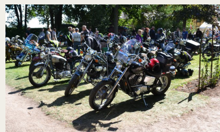
Flere af plænerne var forbeholdt motorcykler.