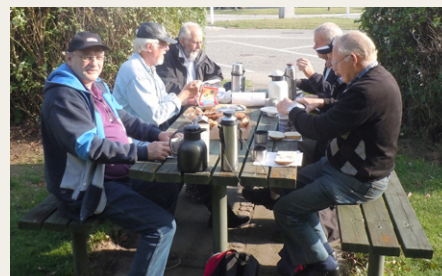
Morgenkaffe og rundstykker på en rastepads i det gode vejr