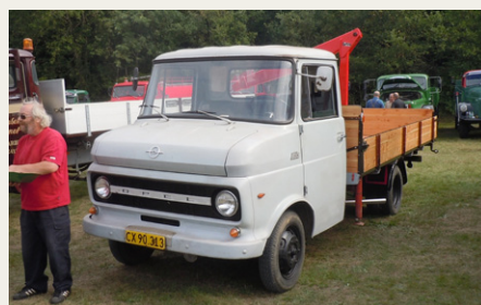
Opel Blitz, engang et almindeligt mærke for lette lastbiler