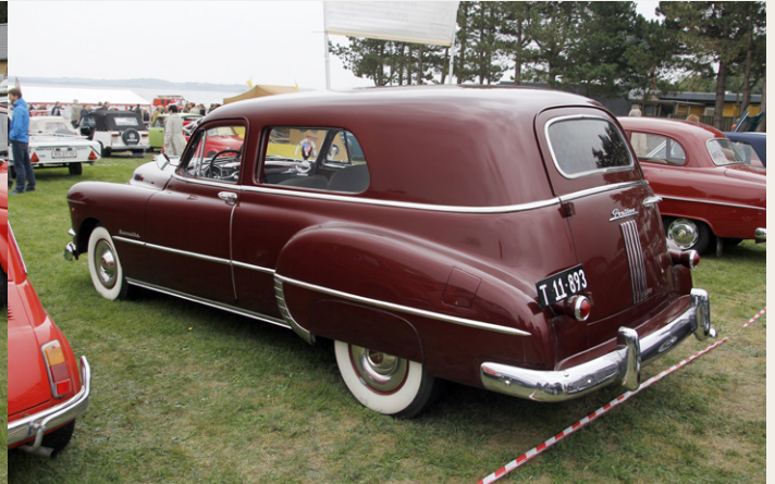
Et af de meget spændende køretøjer på Lundø Camping var denne usædvanlige Pontiac fra 1950. Karrosseriet blev bygget af Guy Barnette & Co i Memphis, Tennessee som ambulance, men den har aldrig været anvendt som sådan. En sjov lille detalje er de to sensorer, som sidder på højre side lige bag de to hjul. Hvis bilen kommer lidt for tæt på en kanstien, giver de en højlydt advarsel inde i bilen.

Det var svært at vurdere, hvor mange køretøjer, der var på pladsen i løbet af dagen, da der hele tiden var nogen, der forlod pladsen, og nye kom til. Men det var en fornøjelse at se den store variation, der var blandt både mennesker og køretøjer.