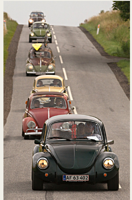
Folkevogne så langt øjet rækker.