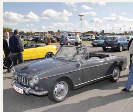
På parkeringspladsen fandt jeg denne flotte Fiat 1600 Spider, som bortset fra fronten ligner en Peugeot 404 Cabriolet til forveksling.