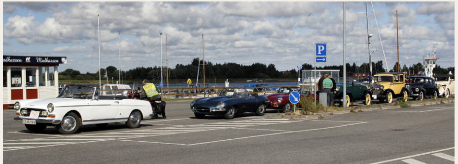
Efter de første biler var kommet over med færgen ved Udbyhøj, ventede de på at færgen skulle helte resten. Opgave to blev løst i ventetiden.