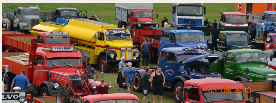
Trængsel på marken ved Skelund Pallehandel.