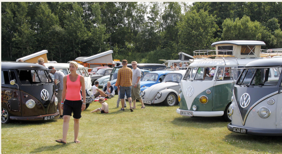
Både biler og mennesker så ud til at hygge sig i det gode vejr.

Senere på aftenen var der levende musik i Grotten, og der blev vist lyst inden de sidste forlod Grotten fredag nat.