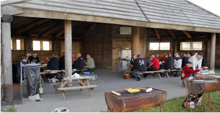
Bordene var flyttet sammen i grupper i det flotte madpakkehus ved Jægerum Søpark, så snakken gik rigtig godt hen over grillpølser og entrecote.