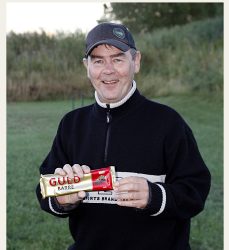
. . . og tredjepladsen gav et stort stykke Guldbarre.