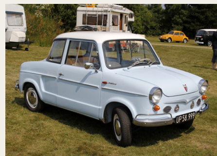
Der var også blevet plads til en lille NSU Prinz 3 blandt alle Folkevognene, men de endte jo også med at komme i samme familie.