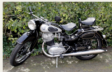
Blandt de fremmødte motorcykler var denne fine NSU Max.