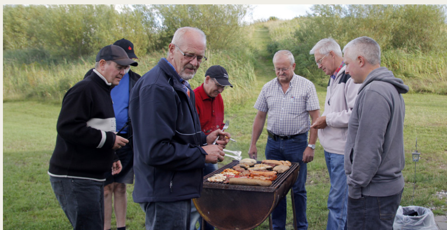
Der var trængsel omkring grillen med det rigt varierede udvalg af grillretter.

den eneste med et bagagerum, der var stor nok til de medbragte griller.