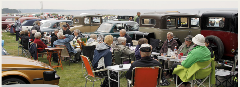
Flokken fra Aalestrup Classic Bil & MC, som også indeholder flere NVMK medlemmer, var kommet tidligt og havde kapret en plads, hvor der var læ.

Efter at have været rundt på hele pladsen endte vi igen ved vores borde, hvor der var tid til at nyde den medbragte kaffe/te og kager. Ved halv tre tiden begyndte