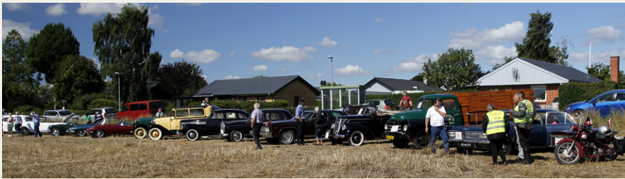
Deltagerne i klubarrangementet linet op på marken bag Hvidsten Kro