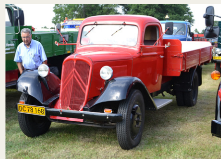
En fin gammel Citroën var også at finde i Skelund.