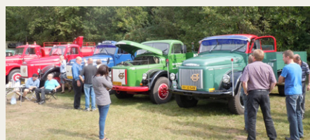
Fire flot renoverede Volvo Viking og Titan på striben