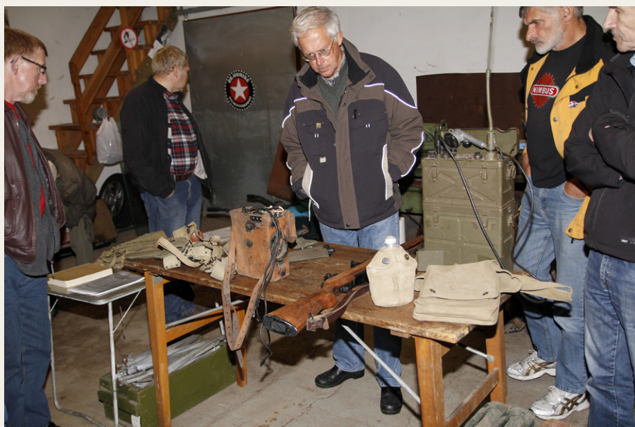
Et lille udsnit af „ovrigt“ militære samleobjekter.

I rummet bag ved værkstedet var der endnu en gammel lastbil sammen med fire forskellige udgaver af Jeep'en. Den ældste var en „rigtig“ Willys Jeep fra 1941, som i forbindelse med 60-års dagen for invasionen i Normadiet, kørte hele turen