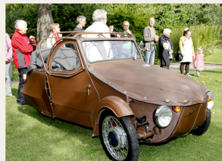
Naboens Velorex fra 1971 er noget helt for sig selv.