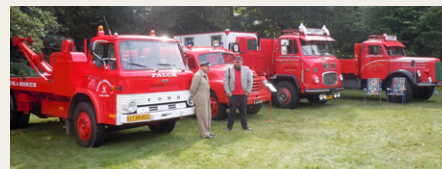
Et par flotte udstillede Falckbiler. Falckredderen (til venstre) var iført tidstypisk uniform og kedeldragt, inklusiv kasket samt handsker og twist i baglommen