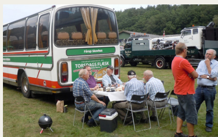
Frokosten indtages bag bussen. Trods reklamen var det ikke torsdagsflæs.