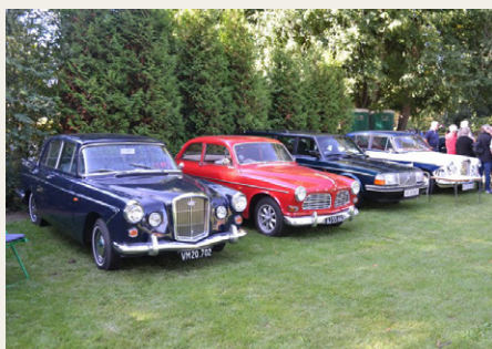
To Volvoer har presset sig ind mellem to Wolseleyer.

Ankomst kl. 8.45 så der var plads i haven til Wolseleyen, frem med kaffen og diverse rundstykker og kage. Og der dukkede to Wolseley mere op, så tre stk. Wolseley på samme træf er højst usædvanligt, men skønt at opleve for mig. Som sagt var vejret med arrangementet,