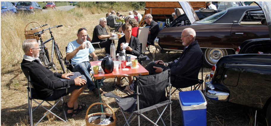
Og så var der ellers dømt hygge ved de medbragte borde.

i nakken. Jeg tror det var meget sjovt for publikum at se på.