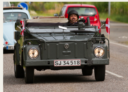
Når man kører et specielt køretøj, er man selvfølgelig ganske seriøs med, at påklædningen matcher bilen.