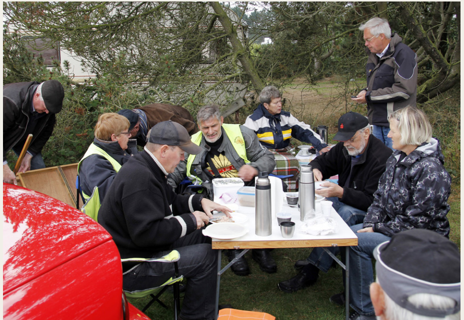
Vi har fundet lidt læ mellem nogle amerikanerbiler og nogle buske, og de mest sultne er i fuld gang med at smøre de medbragte rugbrødsmadder.

Efter en kort pause kørte kolonnen videre sydpå, og via Virksunddæmningen nåede vi frem til campingpladsen på Lundø klokken lidt over 11.00. På dette tidspunkt var der allerede samlet så mange biler og motorcykler, at vi blev henvist til det yderste område mod nord. Vejret var overskyet og lidt blæsende, men det holdt næsten tørt, og der var straks nogen, der gik i gang med at finde et sted med lidt læ, hvor vi kunne slå borde og stole op til