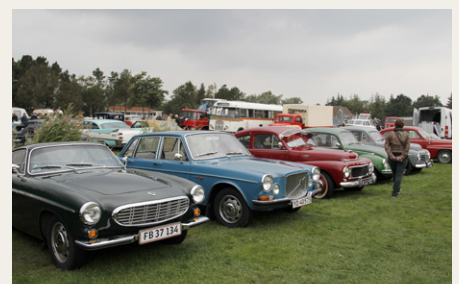
En enkelt Folkevogn havde sneget sig ind i rækken af Volvo'er.