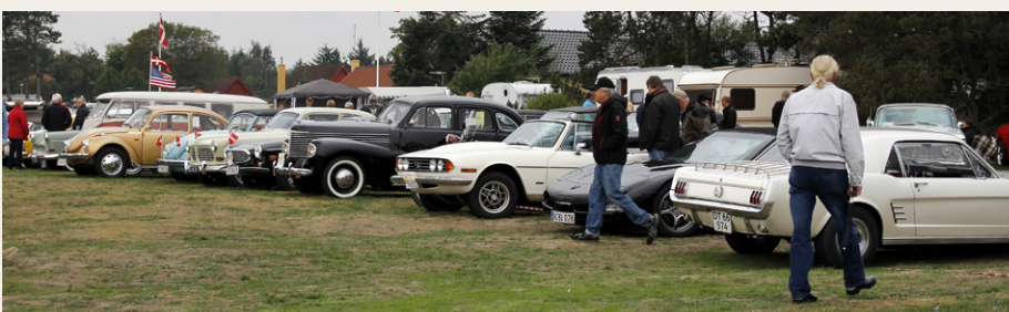
Vi fik ikke lov til at holde belt samlet, men her holder nogle af os imellem ligesindede.