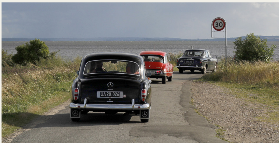
I kolonnekørsel på vej ned mod dæmningen mellem Gjøl og Øland.