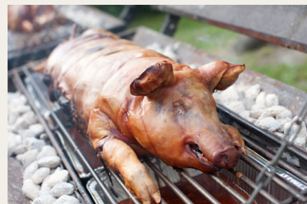
Og her er den så, grisene som alle ventede på.