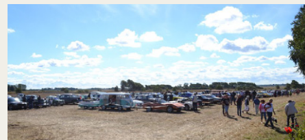
Der var masser af biler på marken bag kroen.