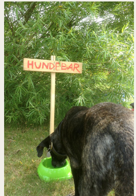
Årets nyhed: En hundebur. Næste gang må udvalget godt være lidt større.