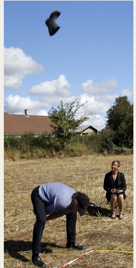
Et af de bedre gummistøvlekast, selv om støvlen ikke helt nåede over startlinjen. Det var heldigt for nogle af kasterne, at der ikke blev anvendt træskostøvler.