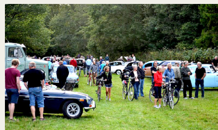
En typisk tirsdag aften i Lundby Krat med masser af gamle biler og masser af interesserede tilskuere.