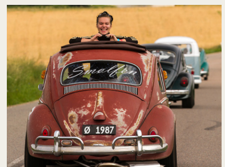
Et soltag er nærmest uundverlig, når man skal fotografere de andre deltagere i cruisen. Øh, plejer Smølfer ikke at være blå?