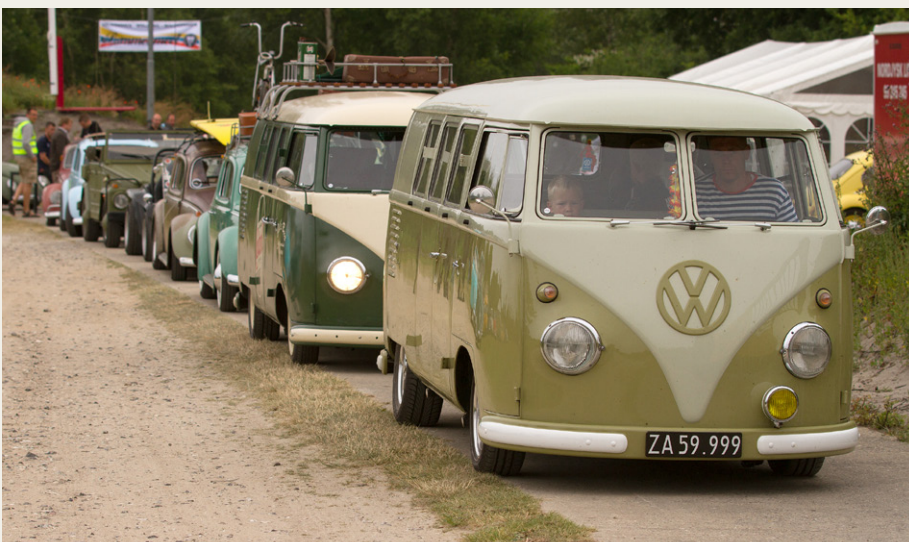
En blandet flokliner op til den længste række Folkevogne på cruise i Østhimmerland