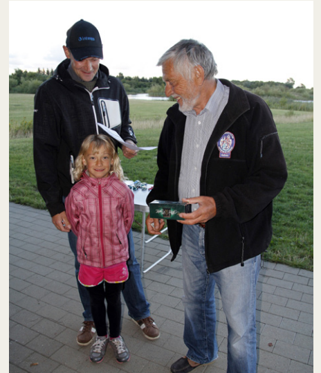
Andenpladsen blev premieret med en pakke After Eight . . . .