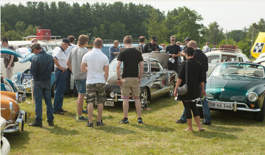
Fruerlundsparken fyldtes hurtigt af Folkevogne og folkevognsentusiaster fra det meste af Europa.