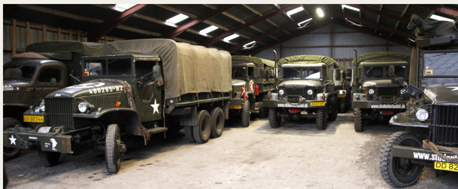
Sådan 12 - 14 store GMC, Kaiser og REO lastbiler fylder altså godt op, selv i en stor hal.

indeholder en højere akademisk uddannelse, og om hvordan de militære lastbiler kom ind i hans liv.