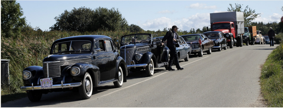
Kø ved færgen fra Voer til Mellerup. Læg mærke til det pragtfulde vejr, som fulgte os hele dagen.