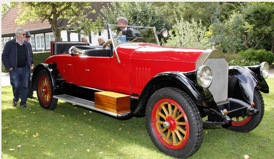
Bent Pedersens Pierce Arrow Model 33 Runabout fra 1922 har endelig fået nye dæk og er ude på sin første rigtige tur.