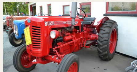
Der var udstillet traktorer . . .

klubhus ligger midt i byen, kan der nok ikke laves så meget om på det. Ellers en god dag med handel, masser af snak, bytte „løvn” og hvad ellers der skal til for en god dag i venners lag. Et arrangement jeg gerne tager til næste år.