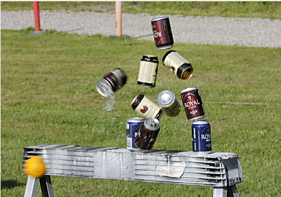
Ved Hadsund Lystbådehavn skulle der væltes dåser. Sådan ser et pletskud ud. Bolden blev kastet af Rainer Mittelstädt.

andre fra klubben, men da vi lørdag aften fik at vide, at der var planlagt et løb med poster undervejs, blev vi enige om, at så måtte vi hellere deltage fra Hadsund. Så vi kunne få en lille familie fight, da mine forældre skulle deltage i deres Opel Kapitän.