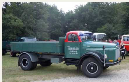
En efter min mening meget flot og tidstypisk Volvo Viking med tippelad