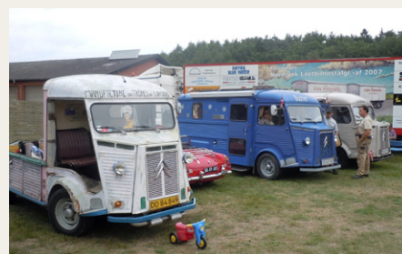
Tre af de fire fremmødte Citroën HY. Den manglende dør på den forreste bil blev monteret inden hjemkørsel