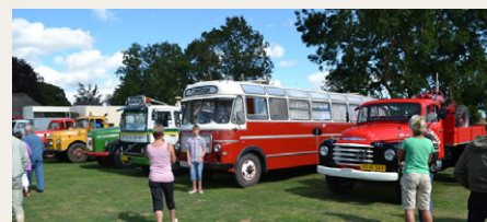
Der var ikke så mange lastbiler og busser som tidligere