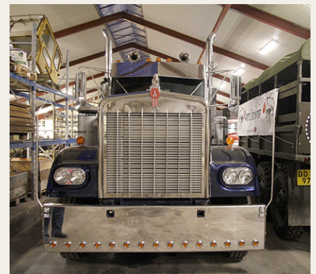
Der er også blevet plads til denne store Kenworth W900a fra 1972 i samlingen.