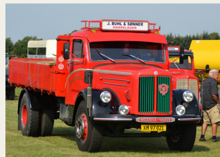
Scania Vabis Regent fra 1958