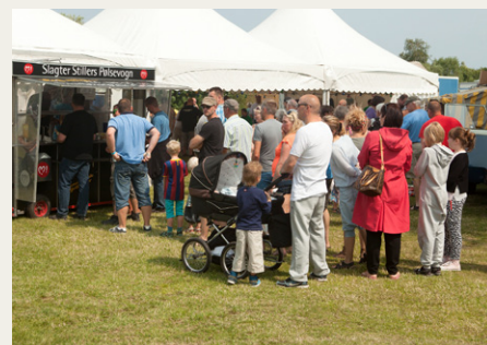
Der var megen trængsel omkring Slagter Stillers pølsevogn.