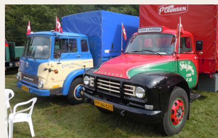
To Bedford, engang nogle af de mest almindelige lastbiler i Danmark