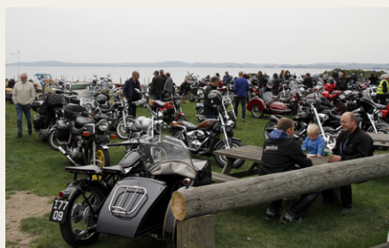
En af markerne ned mod fjorden var forbeholdt motorcykler. I forgrunden ses en Nimbus fra 1950 med sidevogn