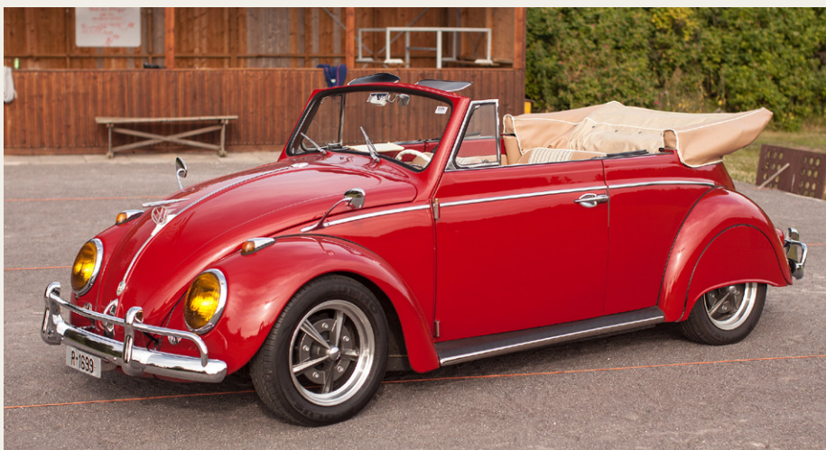
Der var gjort meget ud af detaljerne på denne flotte, norske Cabriolet, og den endte da også blandt de fem biler, som blev premieret.