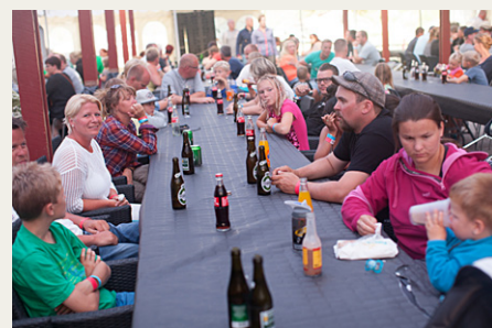
Der var både øl og vand på bordet, mens gæsterne ventede på at grisene skulle blive færdige.