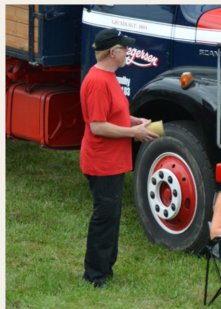
En mand med overvejelse.