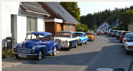
Det halve af Sdr. Saltum var proppet med biler.

Desværre kneb det lidt med pladsen til parkering af alle gæsternes køretøjer, hvilket var lidt en skam, men da deres