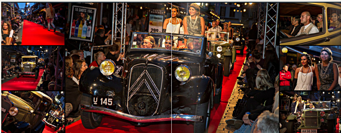
Fest i gaden på den gode måde. Billederne er venligst udlånt fra highline-fashion.dk , og det er dem, der har lavet den hvide stribe.