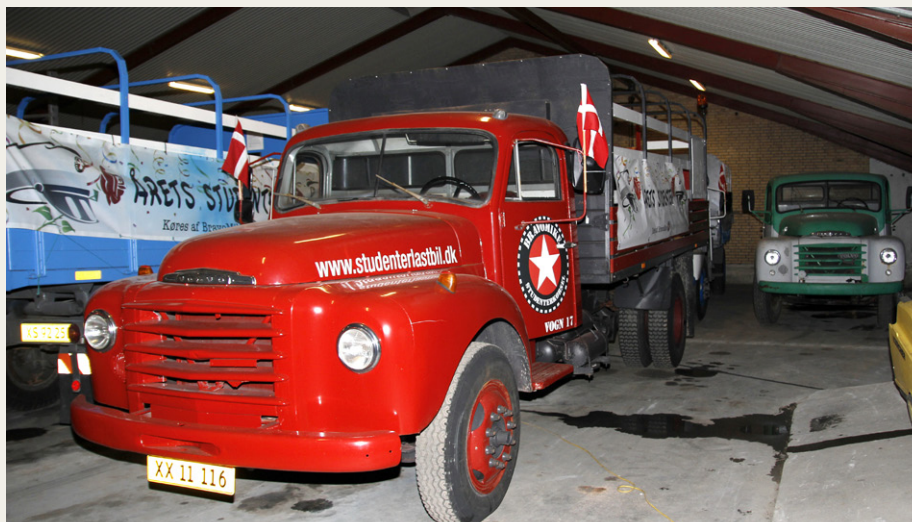
Hele fire gamle Volvo lastbiler havde fundet plads i samlingen. Den røde i forgrunden er en N84 fra 1975.